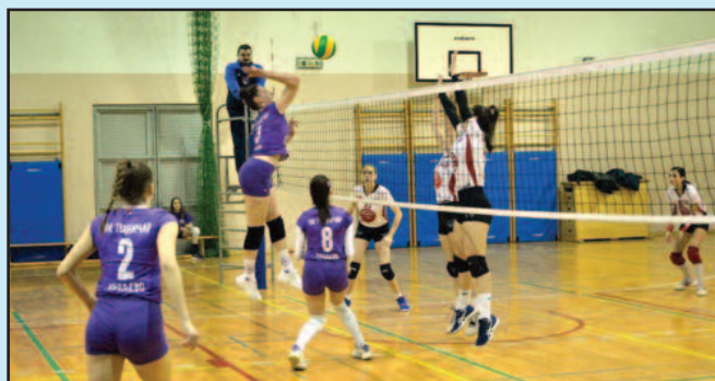
Пораз у Пријеполу-детаљ са утакмице одбојкашица Техничара