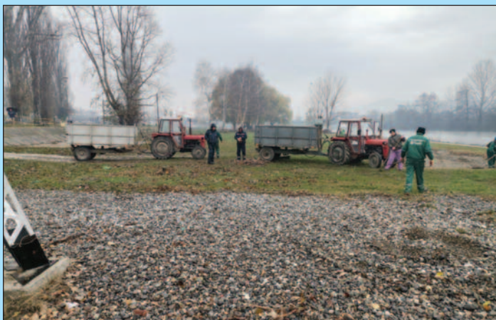
За два дана прикупљено четиристо кубика разног отпада

-Направили смо једну врсту синергије између радних јединица ЈКП „Чистоћа“, а на крају крајева, ми смо једна фирма и радне јединице „Комунална хигијена“ и „Градско зеленило“ су се удружиле како би овај посао што пре био завршен. Ибар се вратио у корито, а за собом је оставио хаос и доста грања, смећа, много отпада је остало на градској плажи. Двдесетак радника је ангажовано и сва распложива механизација, како бисмо што пре вратили плажу у првобитно стање. Уколико поново дође до овакве ситуације, поново ћемо бити на терену и очистити све, јер ми у програму пословања имамо обавезу да чистимо градску плажу