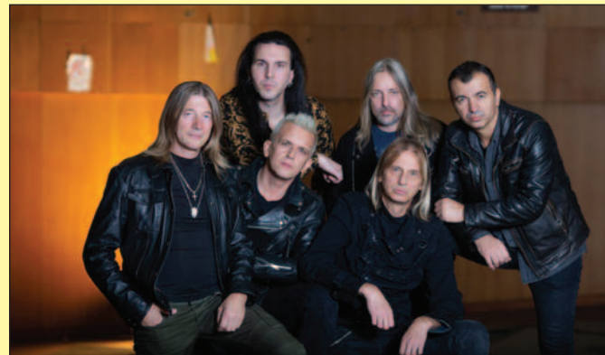
Освајачи - хард рок и хеви метал бенд

У среду 14. децембра од 19 сати у галерији Културног центра у Рибници биће отворена Годишња изложба радова младих ликовних стваралаца,