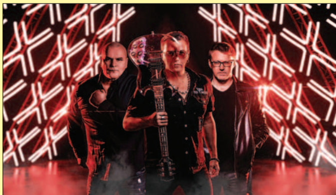
На Тргу ће прво наступити група Ван Гог

Од 22 часа публика ће имати прилику да слуша Освајаче, хард рок и хеви метал бенд основан 1990. године у Кра-