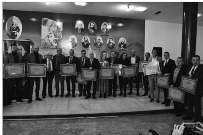
Афирмација свеукупног стваралаштва развија се и кроз доделу ове угледне друштвене награде

Наравно да сви ми добитници, а у овом случају сам ја испред институције коју представљам, знамо да неко прати наш рад, да се оцењује између свих оних који се баве сличним послом. На тај начин нас несвесно терају да још