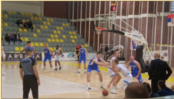
Одлични Нови Пазар и слаба Слога-детал са утакмице у дворани Догуш

Пораз је дошао као последица наше слабе партије. Били смо без жеље, воље, моји играчи ни једном нису пали за лопту, деловали смо без енергије, иако