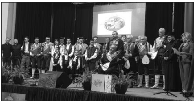
Гусле су им заједнички именитељ за бројне акције које су реализовали

И, рекло би се да из ових неколико редова сазнадосмо све: повод, одржано гусларско вече, велико интересовање, дошла (макар људима који то цене) позната гусларска имена... Али, не треба се играти с грехом и стати овде. У овој људској заједници има најмање људи који гуслају. Остали се никако не "крију" иза гусларског наслова. Они су само у гуслама пронашли заједнички именитељ за своје добротинство, ако би овај термин могао да покрије све оно чиме се ово друштво бави. А у њему су инжењери, лекари, професори, официри, бизнисмени, девојке, жене, деца, новинари, доктори наука, учитељи, студенти... Има их око сто. Они су Друштво гуслара Жича из Краљева. Овде је добродошао свако ко доноси добру намеру, патриотски дух и хуману идеју. У пракси то значи – ко не мери време добровољног рада на сате, не броји жуљеве на рукама и не стиди се знојање кошуље. А гусла и пева колико