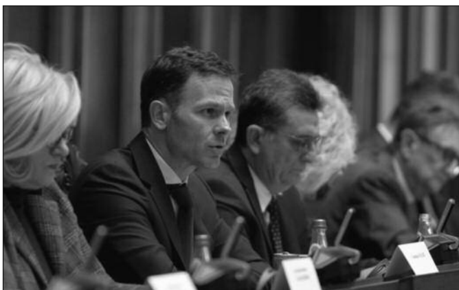
Министар финансија Синиша Мали

–Када је реч о привлачењу страних директних инвестиција, очекујемо да на крају године оне пређу 4 милијарде евра, а инвестиције и даље долазе. Србија је данас атрактивна инвестициона дестинација. Што се тиче буџета, ми данас на рачуну имамо 285 милијарде динара, а подсетићу вас да смо пре 10 година били на ивици банкрота. Наш јавни дуг је данас око 54 одсто БДП-а, док је просек ЕУ око 94 одсто БДП-а. Тиме смо одржали обећање да нећемо прећи 60 одсто, иако су многи у ЕУ то и заборавили, али нама је то важно, истакао је министар.