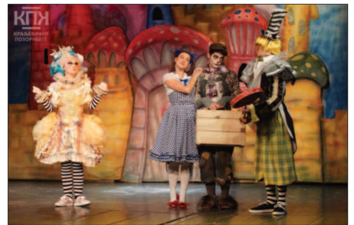
„Чаробњак из Оза“ – истински позоришни спектакл за децу