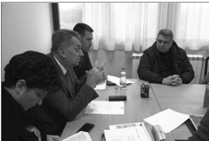
У селима је сада далеко боља ситуација, види се напредак

Имали смо два пројекта за асфалтирање, један је рађен ове године, а други прошле године. Само да се настави тако. Наш проблем је Дом културе. Тај објекат је добијен од Града Кра-