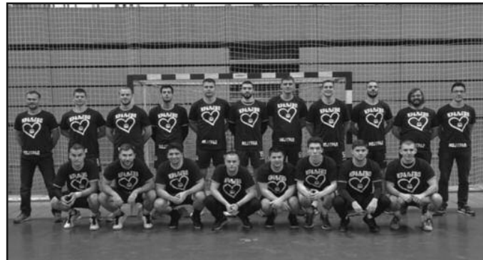
Рукометаш краљевачке Слоге на крају полусезоне