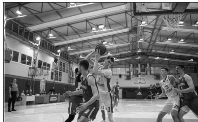
Пораз од клонфера- детаљ са утакмице ПКК Београд-Слога