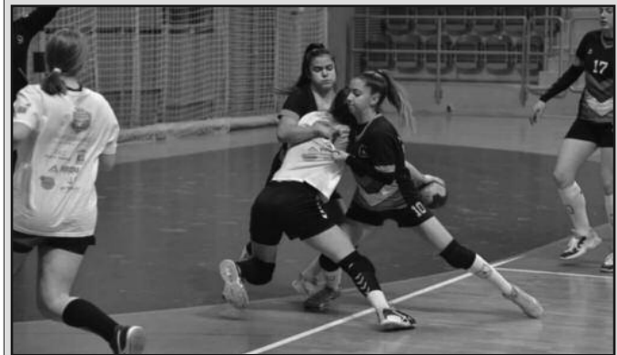
Детаљ са утакмице рукометашица Металца