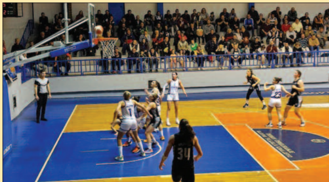
Детал са утакмице кошаркашица Краљева