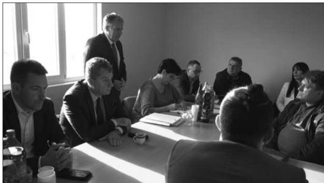
У план уврстити захтеве сходно расположивим средствима у буџету

-Важно је напоменути да смо сумирали неке наше планове и жеље које су биле у оквиру буџета и ребаланса буџета за 2022. годину, али смо разговарали и шта је планирано за 2023. годину. Сада је тренутак да системски планирамо поједине инвестиције, а то подразумева израду пројектно-техничке документације и потребе планске документације, тако да је било захтева и за увек популарно асфалтирање уз учешће од 15 одсто, као и за пресвлачење оштећених коловоза. Морам да признам да је у 2022. години одређен мали