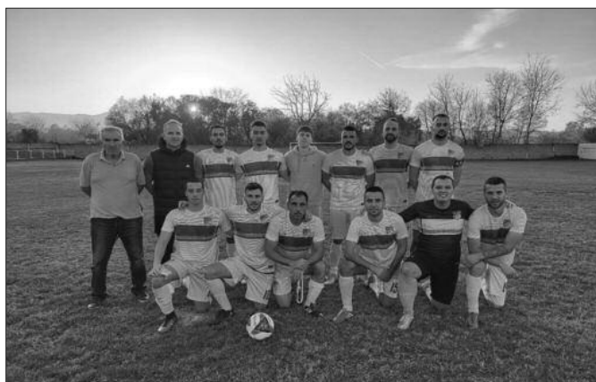
Јесењи прваци Окружне лиге-ФК Ибар из Матарушке бање