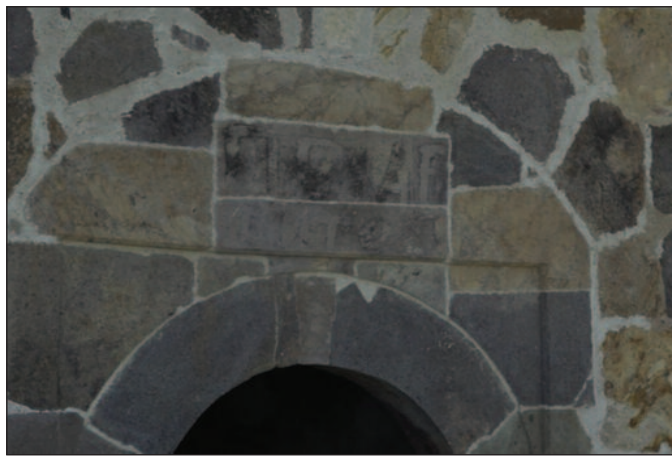
Натпис којим су комунисти наружили цркву у Бељаку