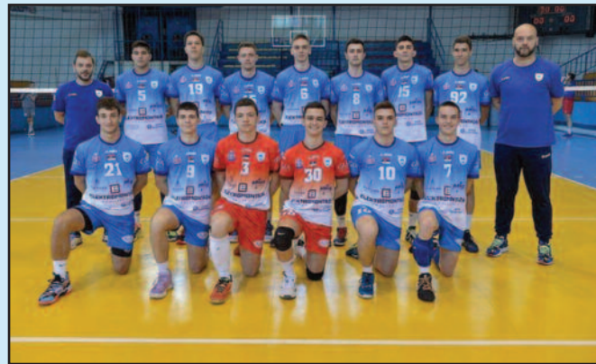
Одбојкаши Рибнице 2 победили у Крушевцу

На теренима Друге лиге група „Запад“ за одбојкаше претходног викенда одигране су утакмице 6. кола. Рибница 2 је у Крушевцу изненадила домаћу Багдалу и забележила победу резултатом 2-3 (25-23, 25-22, 16-25,