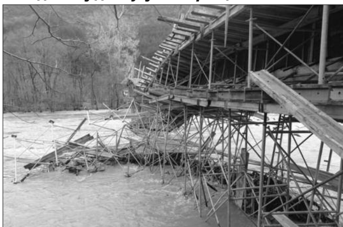
Радови на изградњи ће још више каснити иако су сви рокови већ пробијени