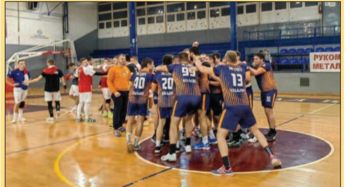
Славље рукометаша Слоге после победе у Ваљеву