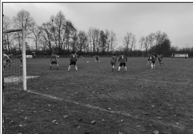
Морава декласирала Магнохрон

РЕЗУЛТАТИ 15. кола: Боготовачка бања-Гружа 4-3, Морава (М)-Магнохром 6-2, Јединство (Г)-Омладинац 6-3, Поповићи Врњци-Краљево