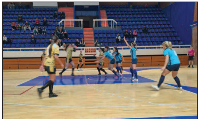
Пораз у последњој секунди-детал са утакмице рукометашица Металца у Лозници