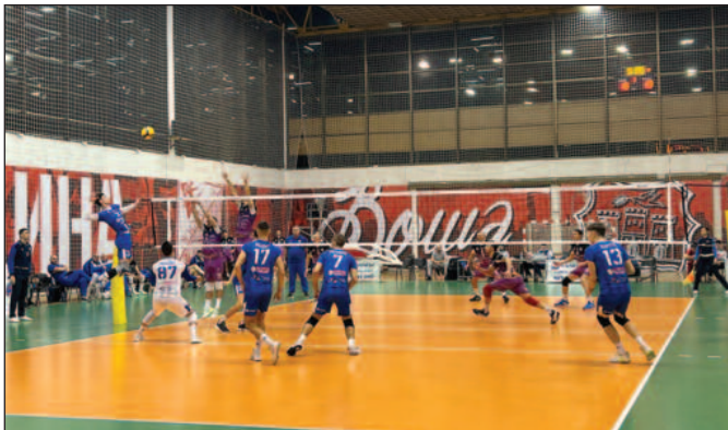
Вредна и тешка победа у Новом Саду-детал са утакмице Нови Сад-Рибница