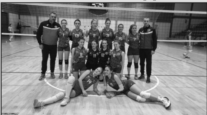
Победа за прекид традиције-одбојкашице Техничара у Бајиној Башти