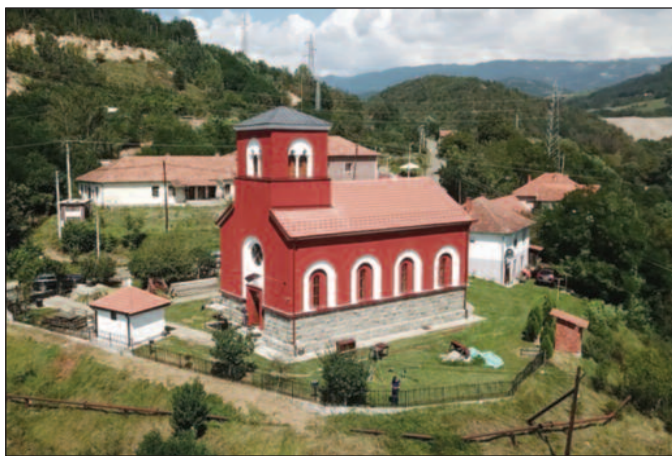
Цркви Свете Петке у Рудници враћен комплетан првобитни изглед

-Храм Преподобне мати Параскеве почео је да се гради 1931. године по благослову Светога владике Николаја Жичкога. Радови су извођени махом од добровољних прилога парохијана. Радови су завршени 1939. године уочи Другог свет-