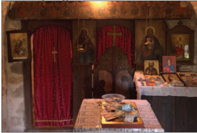
Иконостас цркве у Бељаку из седамнаестог века

Рудница данас није богато село, парохијани нису имућни, али као што видимо има људи који имају и спремни су да уложе у Цркву. Уз Божју помоћ и унутрашњост ове цркве биће фреско-