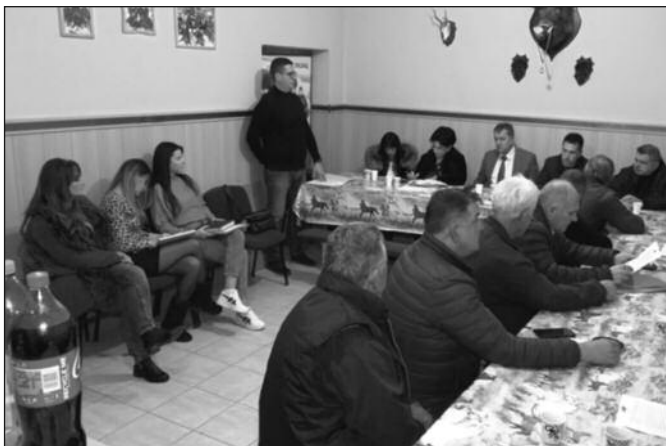
На целом сеоском подручју хитно треба решити проблем водоснабдевања

- Могу да кажем да сам задовољан. Ради се, није све завршено, али последњих година се доста урадило. Надам се да ће и у будуће да се настави овим темпом, да ће обећања која су овде дата бити и испуњена, јер не сумњам у локалну самоуправу. Као и у осталим МЗ највећи приоритет су путеви. Села су замрла где су газили блато,