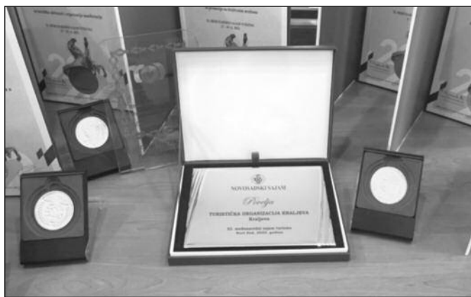
Туристичка организација Краљева једна од најбољих међу 250 излагача

био састављен од еминентних стручњака из Србије,