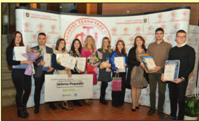
Награђени најбољи студенти и дугогодишњи запослени