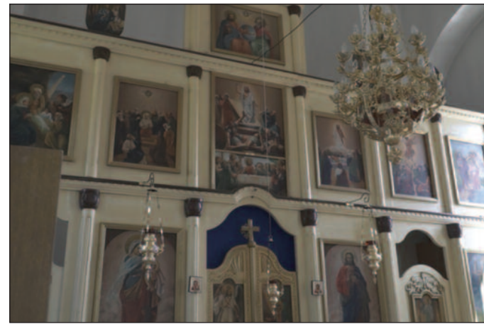
Иконостас цркве Свете Петке у Рудници

Хиландар. Садашња црква је изграђена на темељу старе 1656. године и из тог периода потиче и део иконостаса. Ктитор цркве је био свештеник