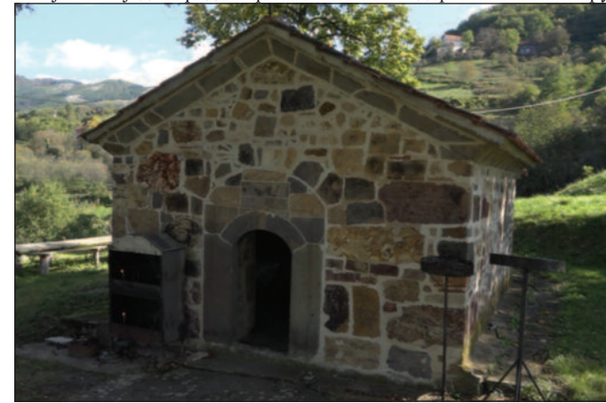
Једнобродна црква Марковица у селу Бељак изграђена од камена

Према повељи деспота Стефана Лазаревића из 1392. године црква Ваведења је приписана и дарована манастиру