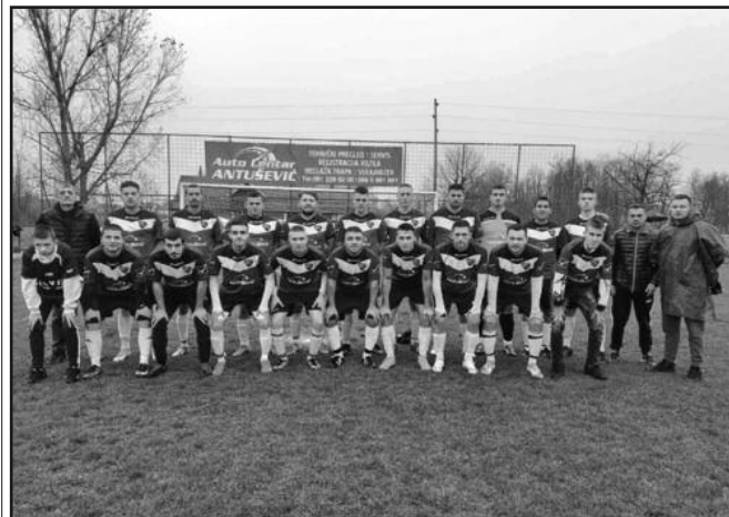
ФК Морава из Мрсаћа другопласирани тим МФЛ Краљево након јесење полусезоне

Претходног викенда завршена је јесења полусезона у МФЛ Краљево. Јесењи првак је Звезда из Чукојевца која је у Цветкама одолела и зимоваће на трону. Морава је у Мрсаћу декласирала „ватросталце“ и остала на три корака од лидерске позиције. У мечу са девет постигнутих голова у Годачици, домаћин је славио против гостију