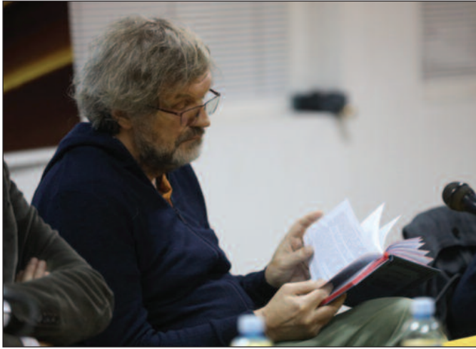
Емир Кустурица у краљевачкој библиотеци

-Хандке је деведесетих година био један од најпопуларнијих људи код нас, али код нас се све тако једнократно деси и лако падне у заборав. Он је био не баш у забраву, али ја сам