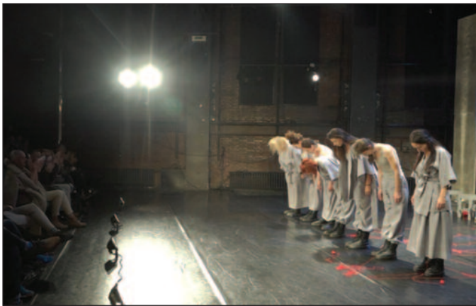
Ансамбл представе „Трпеле“ награђен вишесатним овацијама

Пројекат је суфинансиран из буџета Града Краљева - ставови изнети у подржаном медијском пројекту нужно не изражавају ставове органа који је доделио средства