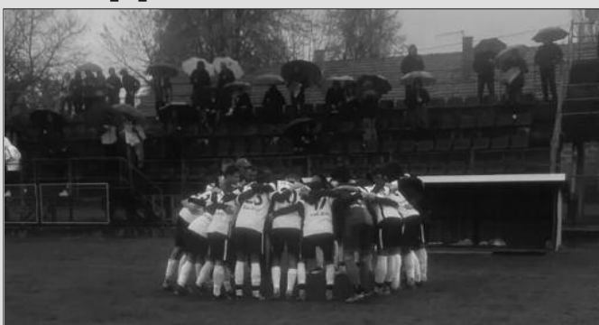
Пораз по киши-кадети краљевачког Кикера