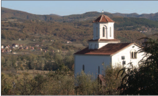
Манастир својом архитектуром и белом бојом доминира овим крајем

На неколико километара од Рашке када се крене Ибарском магистралом ка Аутономној покрајини Косово и Метохија, на левој обали Ибра, налази се веома важна и велика светиња Српске православне цркве. Манастир Кончул, познатији у народу као Никољача, својом архитектуром и белом бојом доминира овим крајем. Манастир Кончул изграђен је на остацима ранохришћанске базилике и тај манастир је највероватније изградио родоначелник лозе Немањића, велики жупан Стефан