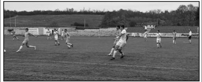
Детаљ са утакмице Слога-Оле

• У редовном 12. колу Кикер поражен као домаћин од Црвене звезде 0-4, док је Слога у Београду изгубила од Чукарничког 3-0 • У ванредном 13. колу Слога-ОЛЕ 2-2, Младост (Лучани)-Кикер 5-0 • За викенд, Кикер дочекује Телеоптик, док Слога гостује београдском Партизану.