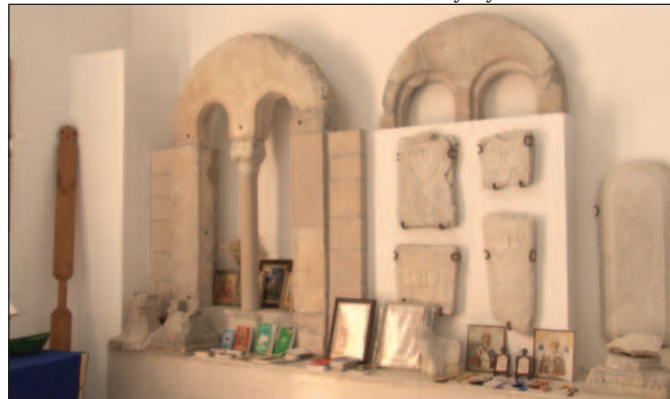
У току археолошких ископавања нађена је бифора, фрагменти фресака, делови врата

На Кипарској планини Кико налази се манастир „Богородица Кикска“, посвећен рођењу Пресвете Богородице, познат по Богородичиној икони „Кикутиса“. По предању, то је једна од три иконе које је насликао свети