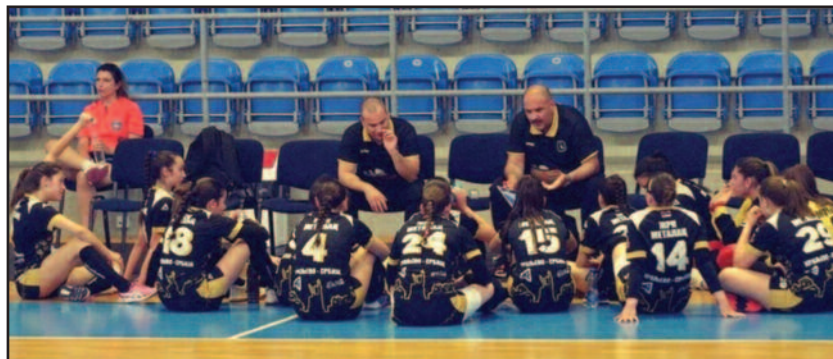
Савети злата вредни- рукометашице Металца са стручним штабом

На теренима Прве лиге група „Запад“ за рукометашице претходног