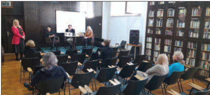
Размена искустава са колегама из уживичке библиотеке

Пројекат је суфинансиран из буџета Града Краљева - ставови изнети у подржаном медијском пројекту нужно не изражавају ставове органа који је доделио средства