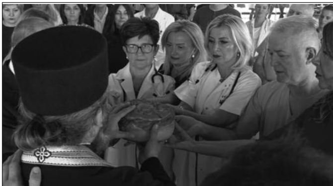
Од Службе кућног лечења славу је преузело Одељење анестезиологије

Српска православна црква и њени верници славе дан Светих врача Козме и Дамјана, а то је првенствено лекарска слава. То су светитељи и небески лекари који су бесплатно исцељивали болесне, а за узврат су тражили само да пацијенти верују у Исуса Христа или да не изговарају његово име улудо, чак и када не желе да приме хришћанску веру. Довили су велику благодат од Бога да лече људе и животиње од сваке болести и то обично полагањем руку. Лекарска слава је традиционално обележена и у Општој болници „Студеница“, а домаћин је била