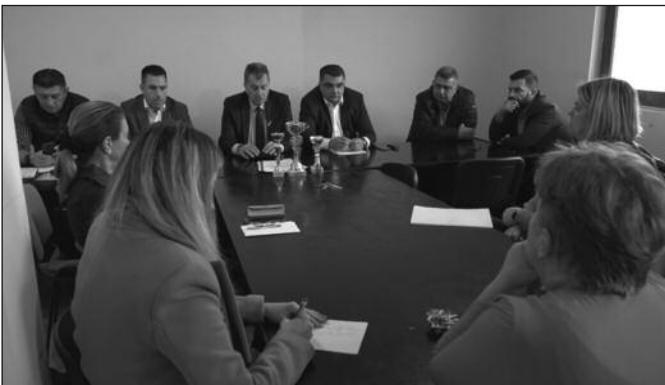
На састанку договорени кораци за решење инфраструктурних проблема

Имамо проблем са потенцијалним загађењем воде. На неких 150 до 200 метара ваздушном линијом од игралишта, фирма „Лангелић“ прави штале за гајење 30.000 товних пилића. На том месту је бунар са којим се мештани села снабдевају пијаћом водом. Воду из овог бунара користи 100 домаћинстава, односно преко 400 људи. Плашимо се да не дође до загађења те воде или било чега што ће угрозити континуирано снабдевање водом које смо напокон, после 40 година разних проблема, обезбе-