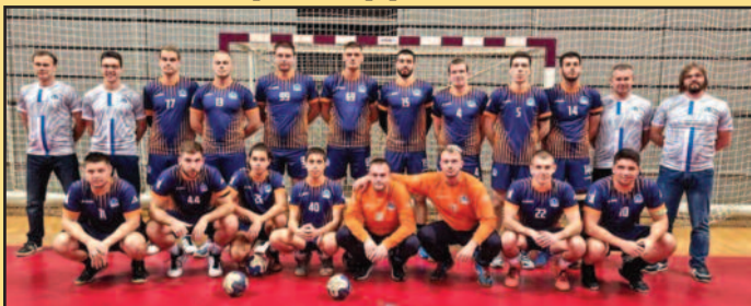
Зауставили их Параћинци-рукометаши краљевачке Слоге

Рукометаши Слоге поражени су у Краљеву од екипе Параћина резултатом 29-38 (13-21) у мечу 8. кола Прве лиге група „Запад“. Фаворизовани гостујући састав био је у подређеном положају све до 20 минута меча. Слога је у том периоду била у константном вођству, а онда су Параћинци додали гас и успели да преокрену ток меча. Предност стечена до одласка на велики одмор била је довољна да се утакмица у наставку мирно приведе