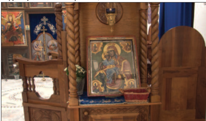
Једна од манастирских светиња је икона Пресвете Богородице

XV века манастир Кончул је доживео највећи успон. Из те епохе потичу многи нађени покретни предмети и највећи број откривених надгробних плоча. После пада Деспотовине (1459) и за Кончул су настала тешка времена. Не зна се тачно када је запустео, али претпоставља се