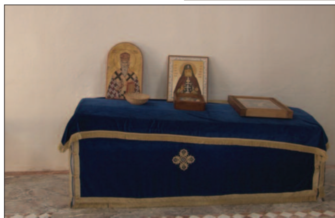
Гробница Реље Крилатице или „Реље од Пазара“

археолошких ископавања, која су вршена од 1975. до 1979. године, нађена је бифора. У самој цркви налази се гробница на којој стоји оштећени натпис који говори да ту почива Реља