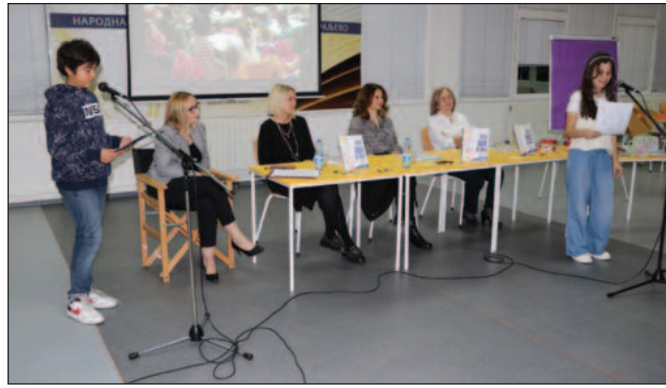
Упоредо са представљањем приручника одржана и Књижевна радионица