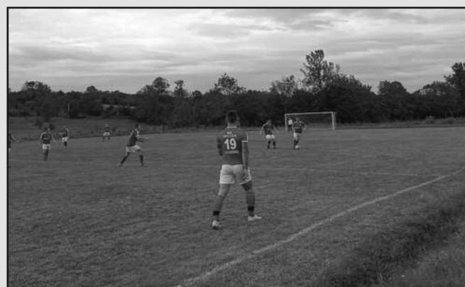
Чукојевац чека славље-детаљ са утакмице лидера МФЛ Краљево

ПАРОВИ 15. КОЛА: Богутовачка бања-Гружа, Морава (М)-Магнохром (субота), Јединство