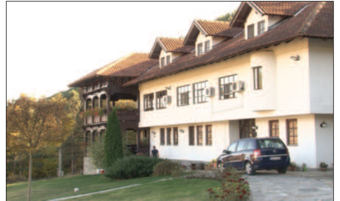
Вредно здање-конак манастира Кончул

Пресвета Богородица како држи Христа десном руком. Назива се и милосна јер је извор милости. По узору на ову икону, у 18. веку, је насликана икона Мајке Божије која се по Кипарској, та-