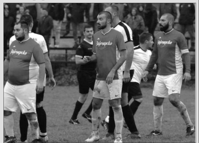
Много узбуђења на терену Окружне фудбалске лиге