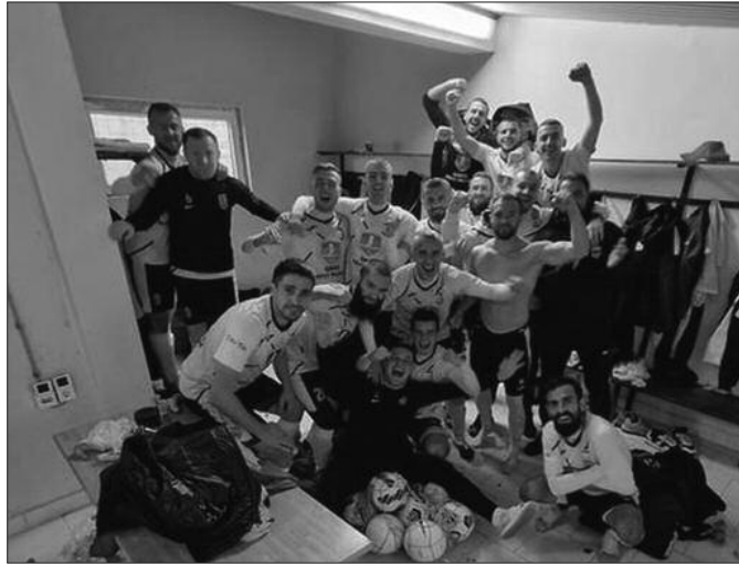
Заслужено на трону-јесењи првак Шумадијско-Рашке зоне ФК Јошаница