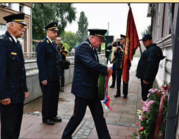
Група ватрогасца Марибора положила венац и одала пошту

Дан Србије традиционално је обележен и ове године широм државе, а у нашем граду је, у знак сећања на ватрогасца 27. септембра 1941. године, обележен и Дан Добровољног ватрогасног друштва