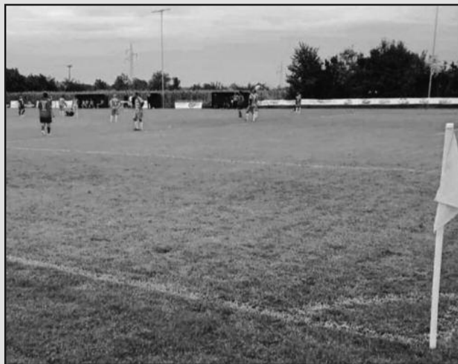
Детаљ са комшијског дербија у Прогорелици

У Окружној фудбалској лиги претходног викенда одигране су утакмице 5. кола. Лидер је у Матарушкој бањи, у дербију кола, деklasирао госте из Печенога који су у другом полувремену примили четири гола. Прогореличани су победили у комшијском дербију фаворизовани састав из Конарева, док су „малинари“ у Врдилима били сигурни против гостију из Делмеђе. Рибница је одолела на тешком гостовању у Вранешима, док је у Тутину домаћин био сигуран против Милочајаца. „Дуњари“ из Тавника су голом у 86. минуту дошли до бода у Новом Селу. Занимљиво, Тавничани имају три пораза код куће, а на страни победу и реми. У Тутину домаћин није дозволио изненађење и поразио је Милочајце.