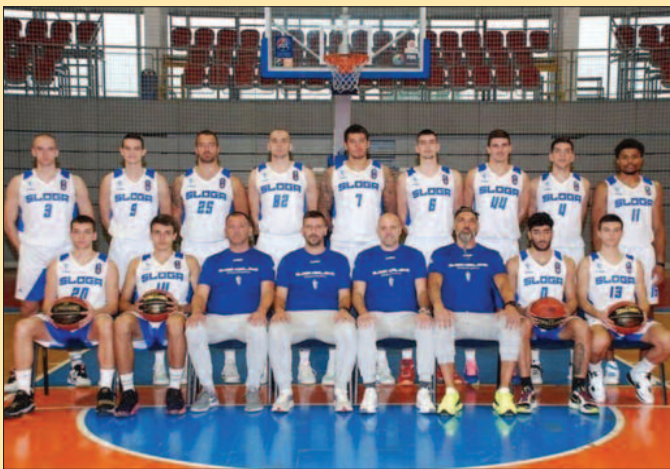
КК Слога у новој сезони

рију 10-2 и прво вођство Краљевчана. Све после тога је било много лакше, иако су Кувајћани неколико пута покушавали да се резултат-