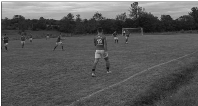
Победа Звезде у Чукојевцу против Ласца

У МФЛ Краљево претходног викенда одигране су утакмице 7. кола. Дерби је одигран у Годачици где је домаћин нанео први пораз Мрсаћанима и тако засео на челну позицију. Ово коло ући ће у фудбалске анале града на Ибру јер је одиграна и прва званична ноћна првенствена утакмица. У Врњцима је домаћин угостио и победио екипу из Драгосињаца, а меч је одигран под светлошћу рефлектора. Изненађење кола приредио је лигаш из Дракића који је „поткресао крила“ у Метикошима, док је у Цветкама виђено шест голова и подела плена, а слађи део „колача“ припао је домаћину који је јурио два гола заостатка. У Јарчујаку није било победника, „ватро-сталци“ су освојили бод, док је на Рудну домаћин зауставио госте из Витановца. Лазец је видео „све звезде“ у Чукојевцу, а вредну победу остварили су Матаружани