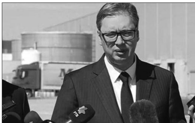
Председник Александар Вучић разговара са новинарима у Инђији

–И да ли ће заиста покренути целу процедуру око пријема тзв. Косова у чланство Савета Европе, 4. и 5. октобра ћемо то да видимо. Биће још неки ствари 4. и 5. октобра. Такође, 6. октобра је велики самит Европске политичке заједнице 41 земље у Прагу и у томе ћемо да учествујемо. Такође, 7. октобра ћемо имати отварање фабрике МТУ, једне од најважнијих фабрика, после више година напорног рада, навео је Вучић.