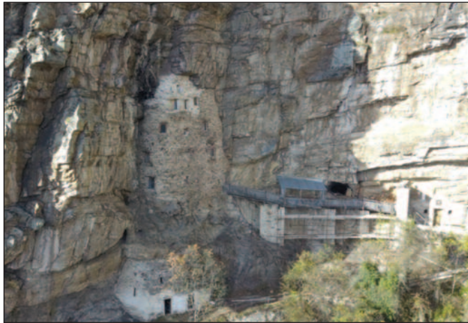
Поглед на комплетан комплекс Горње испоснице

Монаштво у Србији организовао је Свети Сава иако се зна да су монаси постојали и у 4 веку н.е. Горња Савина испосница је најстарији сакрални објекат где су се подмижавали најумнији монаси тог времена. Одрцање од свега земаљског како би се приближили Богу терало је монахе још у 4 веку да одлазе у пустиње где су уз молитве проналазили Бога у себи. У православној цркви монаштво је настало у египатским пустињама где су монаси живели као пустињаки у пећинама, колибама и у крошњама дрвећа. Једино тако, лишени свих овоземаљских удобности и страсти и уз свакодневну молитву могли су да у себи осете исконско хришћанство. Свети Сава је у Србији основао монашки ред који никада неће бити јачи него тада у средњовековној Србији. За монахе је изградио Горњу испосницу где се живело на