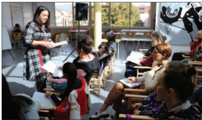
Курс руског језика у краљевачкој библиотеци

тивну оцену и читалаца и књижевне критике, па су прва два дела трилогије, „Зеленбабини дарови“ и „Тајна немуштог језика“, овећана наградом „Невен“ за најбољу дечју књигу у 2013. и наградом Змајевих дечјих игара „Раде Обреновић“ 2014. године. „Зеленбабини дарови“ су уврштени у литературу за пети разред основне школе. Последњи део трилогије,