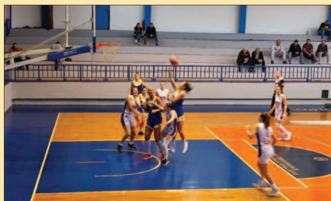
Кошаркашице Краљева убедиле против Дуге-детал са утакмице

- Ово је била јако добра провера, најзбиљнија у овом припремном периоду. Дуга има добар тим, играју регионално такмичење, али смо показали да смо