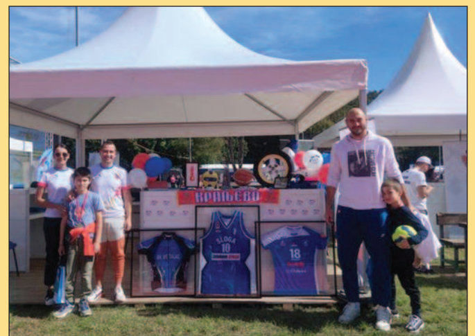
Прослављени кошаркаш и некадашњи капитен репрезентације Ненад Крстић на штанду ССК

Београду окупе што више краљевачких бивших и садашњих