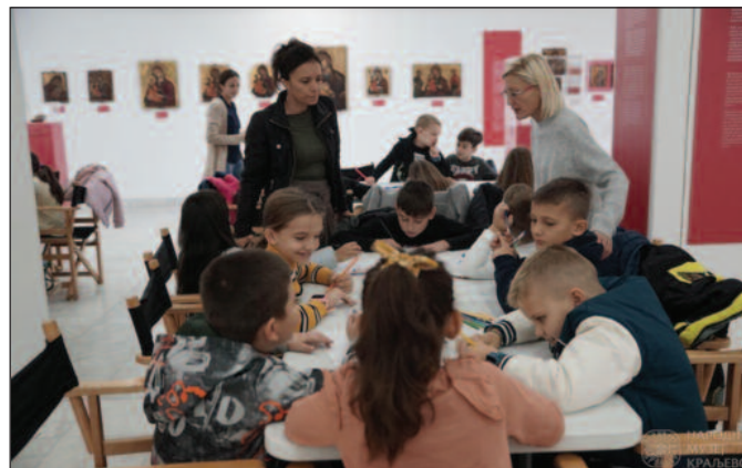
Радионица за основце који похађају часове Верске наставе

вор се активно укључила публика која је махом говорила о рецепцији књижевног дела, о томе зашто стихови младе песникиње остављају дубок траг у читаоцу, о покушају препознавања код млађе популације, о суморној слици српског села и живља које у њима