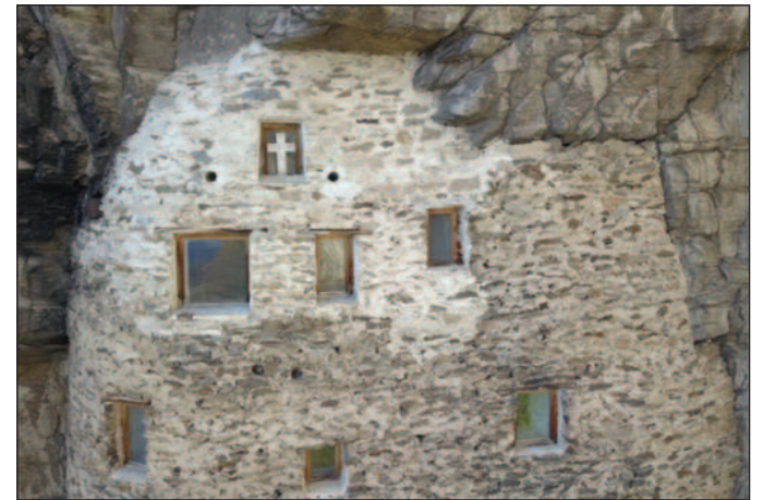
Орлово гнездо за мировање, тиховање и посвећивање молитви

био задужен да сав материјал уз помоћ своје снаге уским и ризичним путем донесе до испред испоснице са 1,8 километара удаљености. Ту скоро на самом врху брда налази се минерализована, благо на кисела питка вода у пећинском удубљењу за