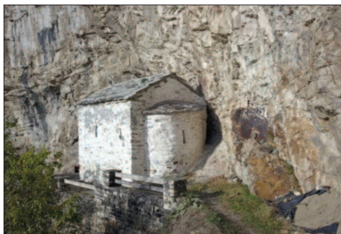
Црква Светог Ђорђа - једнобрда грађевина, малих димензија

зило у испосници у смутним временима Првог српског устанка је спаљено да не би пало Турцима у руке тако да смо остали без једног књижег блага које се ту чувало. Испосница је успела да преживи, живела је и живи и ту се у малој