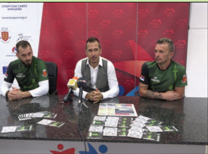
Конференција за новинаре на којој је представљена „Трка хероја“

километара са укупно 23 захтевне препреке, од педесет припадника лепшег пола да се метању