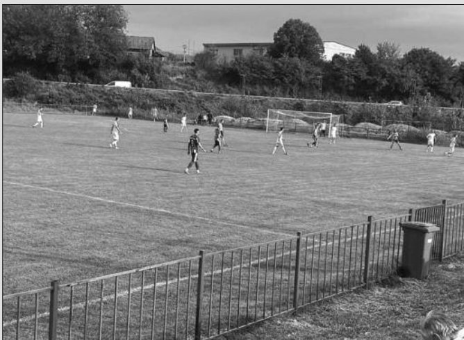
Вредан бод у Гружи-детал са утакмице Гружа-Напредак

ПАРОВИ 7. кола: Напредак-Јошаница, Шумадија 1903-Бане 1931, Гоч-Трпача (субота), Корићани-Гружа,