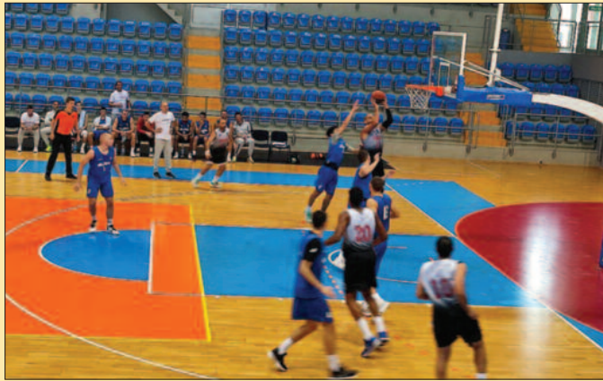
Добра кошарка крај Ибра-детал са утакмице Слога-Кувајт