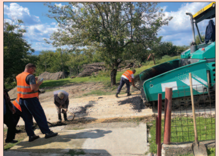
Асфалту се највише обрадовали основци који овуда иду у школу

дана интезивно раде на асфалти- рању сеоских улица са учешћем грађана од 15 одсто.