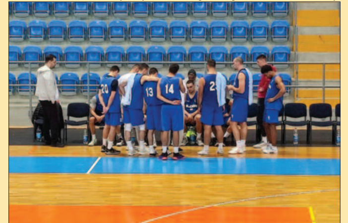
Краљевачки кошаркаши спремни за нову сезону

срету најважнији. Њихова под- ршка нам је потребна да би смо добро стартовали и да касније