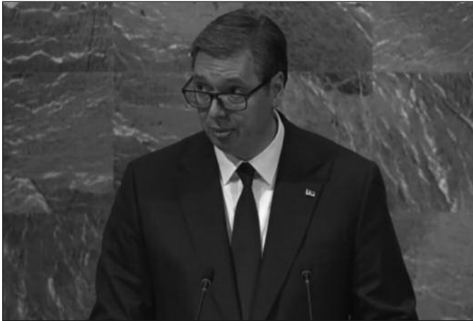
Председник Александар Вучић говори на заседању Генералне скупштине УН

Београд овај процес води у веома комплексним околностима у којима је присутан хибридни рат и прљава кампања у делу међународне јавности против наше земље на различитим пољима. Довољно је да вас само подсетим на цитате и наводе светских медија да ће Србија напасти своје суседе и да представља претњу по регионалну стабилност. Наравно, то се никада није догодило, и то је била само једна у низу бројних лажи против Републике Србије, истакао је председник Србије.