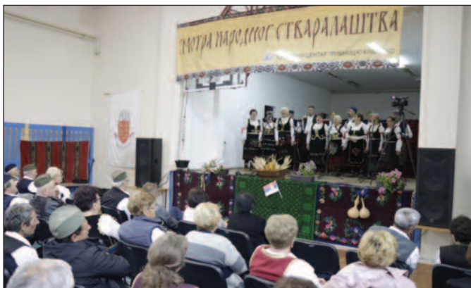
Ове године учествовало четрдесет певачких група

- Долазимо сваке године. Циљ нам је да отргнемо од заборава најизворнији део нашег културног наслеђа и да пренесемо на младе генерације све оно лепо и драгоценост што се чувало у нашем на-