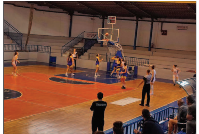
Сигурна игра и победа кошаркашица Бановића против Краљева

нално ВАБА лигу, имају већ сада јако добар тим. Биће опет две добре провере. Све играчице ће добити шансу, осим