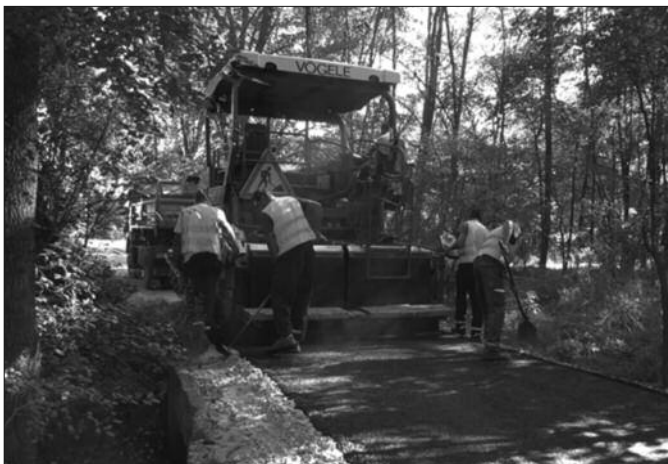
Путна инфраструктура основни предуслов за останака младих на селу

Краљевачки „Путеви“ поред Обрве протеклих дана асфали-