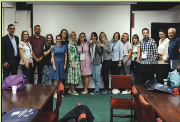
Ове године радове потписало близу двеста аутора из девет земаља