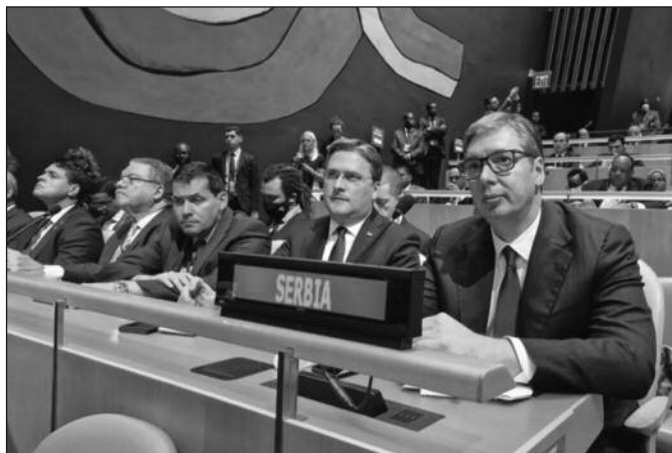
Александар Вучић предводи делегацију Србије у Уједињеним нацијама

2. Очување територијалног интегритета и суверенитета ме-