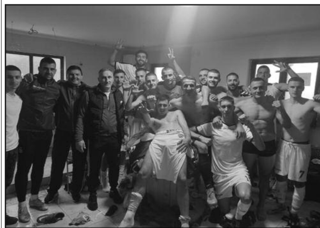
Весело после победе у Грачацу-фудбалери Напретка после тријумфа против Мокре Горе

На теренима Шумадијско-Рашке фудбалске зоне претходног викенда одигране су утакмице 5. кола. Дерби је виђен у Корићанима где су гости из Рашке победили упркос чињеници да су већи део меча играли са десет играча. Јошаница полако хвата шампионски ритам, победа на тешком гостовању у Грузи двоструко вреди. Најпријатније изненађење првенства је Напредак који је у Грачацу славио против гостију из Зубиног Потока упркос њиховом вођству у првом полувремену. Карађорђе је покорио крагујевачки Бубањ и везао две добре игре и победе.