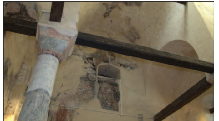
Камени стуб - симбол манастира Нова Павлица

која је окренута ка туризму и поред Копаоника, који је већ довољно промовисан, културни и верски туризам су у повоју, али могу постати привредна грана која