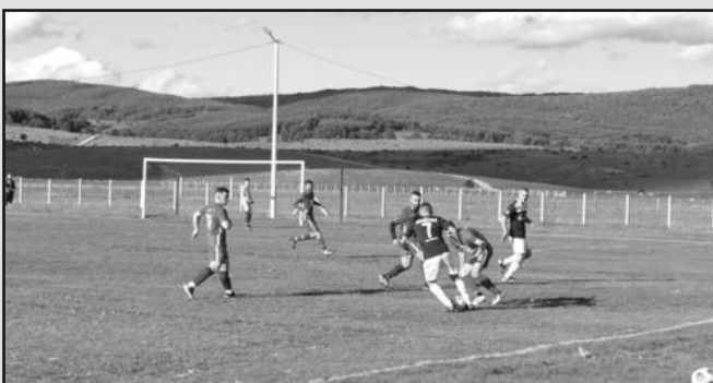
Детаљ са комшијског дербија у Делимеђи Коштам Поље-Јединство 2017 2-2

ПАРОВИ 5. кола: Рудар-Радник, Младост (В)-Коштам Поље