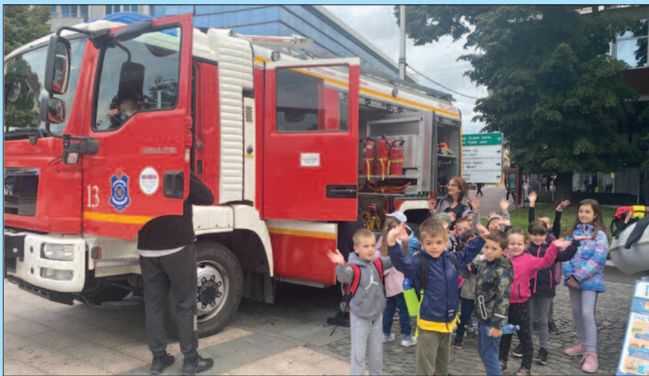
Највише пажње малишани посветили камиону за гашење пожара

опреме који су грађани, а посебно најмлађи суграђани, били заинтересовани да виде. Поред квада, ватрогасних аутомобила, највише пажње привукао је камион за га-