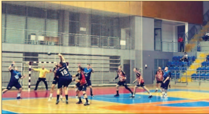
Металац убедљиво победио Прибој-детал са утакмице у новој спортској дворани

У 9. минуту меча било је 3-3 и то је био последњи егал резултат у овом