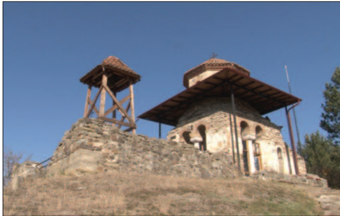
Стара Павлица привлачи бројне туристе из целог света

-Веома битан податак о манастиру Стара Павлица имамо у повељи коју је цар Урош дао Муси, управитељу тврђаве Брвеник, где помиње места које властелин Војислав Војиновић даје челнику Муси и где се помиње село Павлица. У тој повељи Павлица се назива „село цркве Павлове“ и тиме видимо да је и само место имало другачији назив. Манастир Стара Павлица је посвећен Светом апостолу Павлу и сама та чињеница говори о томе да је и сам манастир можда старији од 11. века, јер