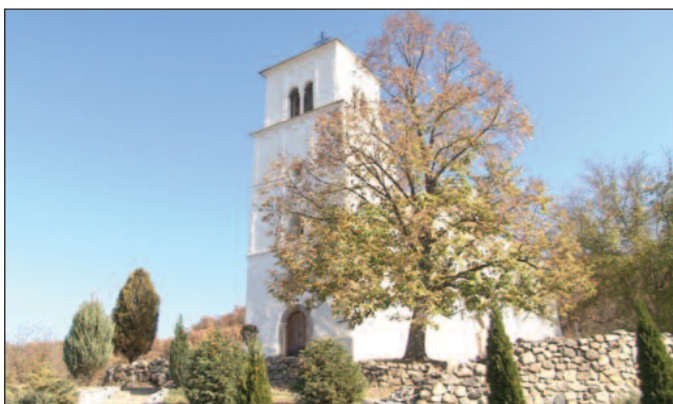
Манастир Нова Павлица изграђен у четрнаестом веку

Овај пројекат је суфинансиран из Буџета Републике Србије - Министарства културе и информисања. Ставови изнети у подржаном медијском пројекту нужно не изражавају ставове органа који је доделио средства