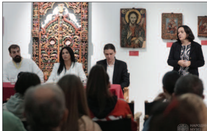
Врло је важно да се баштина сачува и пренесе у савремени иконопис