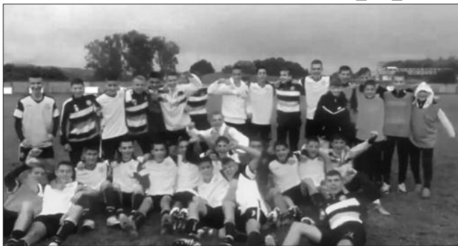
Велико славље кадета Кикера после победе против ТСЦ-а

Кадеги Слоге су поражени у Земуну од Телеоптика резултатом 3-2, иако су водили 2-1 головима