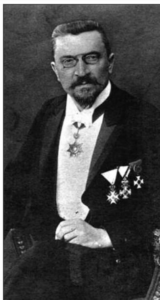
Стеван Стојановић - Мокрањац

1914. - Умро Стеван Стојановић - Мокрањац, композитор, музиколог и диригент, професор и директор Српске музичке школе у Београду,