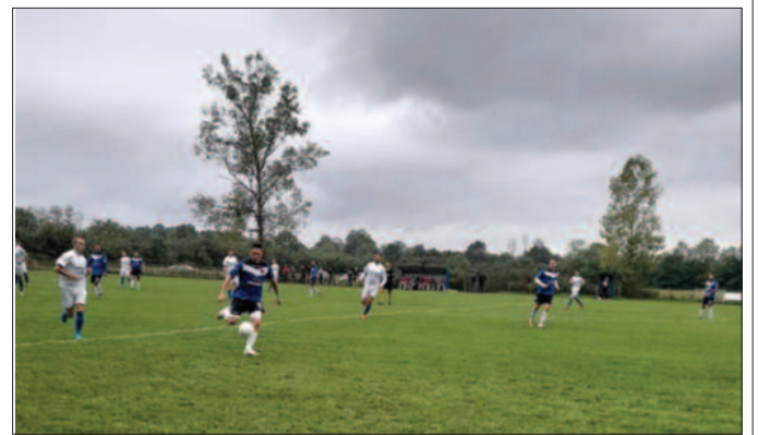
Лидер не прашта-детал са утакмице Морава-Краљево Хајдук

ПАРОВИ 7. кола: Млада Крила-Омладинац (субота), Минерал 2015-Гужа (недеља 11ч), Звезда-Лазац, Краљево