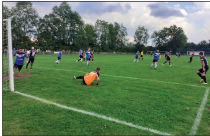
Морава из Мрсаћа без пораза на челу табеле

ране су утакмице ванредног 5. кола МФЛ Краљево. Магнохром је славио на Рудна,а „ватросталци“ су се жалили и на меч са Младим крилима, па док се не донесе коначна одлука, преузели су лидерску позицију. Мрсаћани су одолели у Чукојевцу, док је лигаш из Метикоша био убедљив са „фењерашем“ из Ласца. Највеће изне-