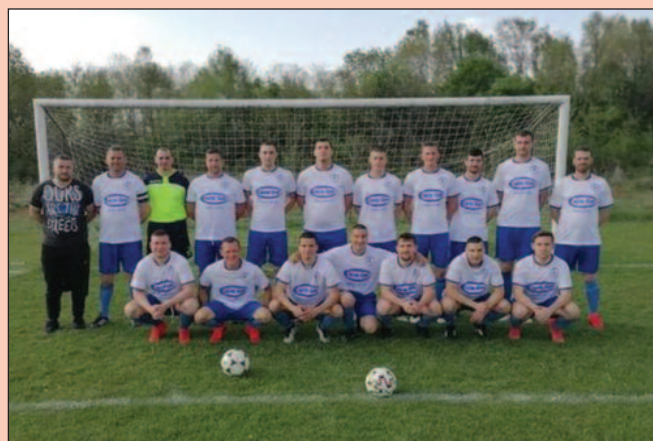
Фудбалери Младости 1981 из Штулца

У групи „Морава“ Градске фудбалске лиге Краљево, у 2. колу, виђено је доброг фудбала. „Мундири“ из Сирче су славили против Врњачке бање, док је у гостима до три бода дошао и Милаковац 2018 и то на терену у Обрви. „Пескари“ су поразили неугодне Шумаричане и са максималним учинком скочили на чело табеле. Друштво им прави Стубал који је славио против гостију из Штулца.