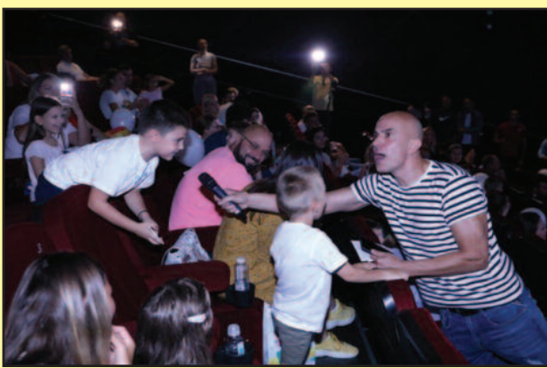
Веселје на премијери прве епизоде

Серијал има снажну компоненту друштвене одговорности и то у односу на осетљиву групу – децу, јер обрађујући теме као што су другарство, заједништво, помоћ у невољи, подршка слабијем, желимо да у раном дечијем узрасту учинемо на ширење и усвајање исконских вредности на којима једно друштво које тежи да буде