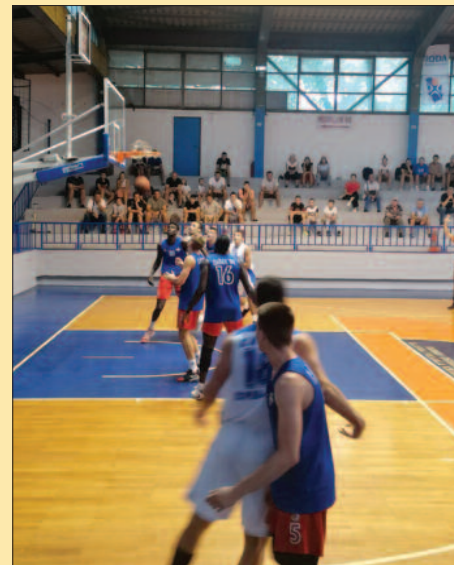
Дета са утакмице Слога-Чачак '94

Слога је у среду у Краљевоу играла против лесковачког Здравља, а овог викенда „бели“ имају још једну јаку проверу. У Београду, Слога игра са прваком Египта Алексан-