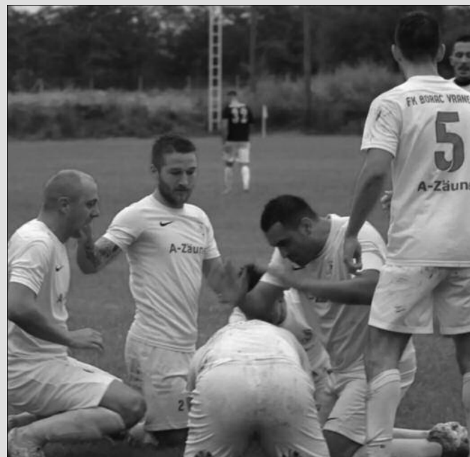
Фудбалери Борца из Вранеша декласирали госте из Делимеђе у Окружној лиги