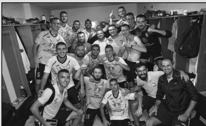
Славље после победе у градском дербију-фудбалери Јошанице из Новог Пазара