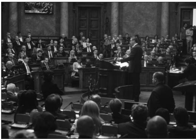
Александар Вучић: У овом тренутку не смемо да напуштамо европски пут

Вучић је на посебној седници парламента, на којој представља Извештај о преговарачком процесу са привременим институцијама самоуправе у Приштини од 15. јуна 2021. до 1. септембра 2022. године, истакао да одговорна и реална политика не може да почива на митовима, те да на Космету треба да пронађемо живот за Србе и ништа мање за Албанце. Он је оценио да је то тежак задатак који морамо да завршимо да бисмо преживели и опстали као држава и народ. Према његовим речима, суштинска криза дијалога Београда и Приштине и наш највећи проблем проистиче из чињенице да западни свет не жели да поштује Повељу УН и Резолуцију 1244 СБ УН. Други проблем, како је указао, јесте тај да међународну заједницу не занима поштовање потписаних споразума, нити да тим поводом изврши