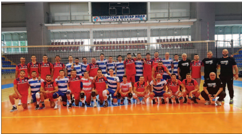
Заједнички снимак одбојкаша Војводине НС семе и краљевачке Рибнице