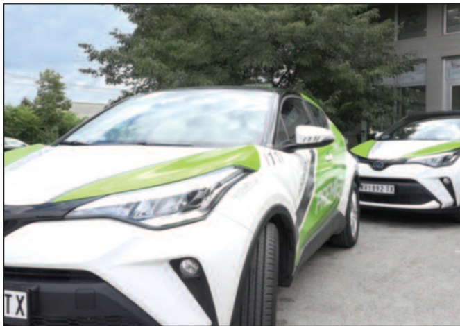
Нова, конфорна и удобна хибридна возила

један део је на струју, а један део на бензин. Возила су опремљена wi-fi уређајима, а ускоро ће бити могуће плаћање и платним картицама, а одређене фирме добиће могућност одложеног плаћања, путем админи-