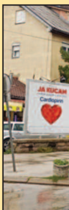
Град ће отку

-Ради се о улазу у Поликлинику, паркингу и о делу саобраћајнице која