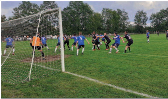
Детаљ са једне од узбудљивијих утакмица МФЛ Краљево

челну позицију на табели. „Мегданције“ из Цветака су победиле у Дракчићима,а лигаш из Витановца у Ласцу закуцао домаћина на последњу позицију на табели. Највеће изненађење припредила су „крила“ из Метикоша убедљивом победом на Старом аеродрому, што је и први пораз „ватросталаца“. Крај Лопатнице је домаћин