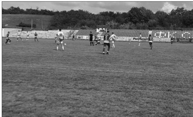
Детаљ са утакмице Слога-Младост Лучани

После катастрофе на гостовању Црвеној звезди, кадети краљевачке Слоге су смогли снаге да освоје бод у мечу са неугодном екипом из Лучана. У првом озбиљнијем нападу Краљевчани су повели изузетно лепим голом Николића. Младост је до изједначења