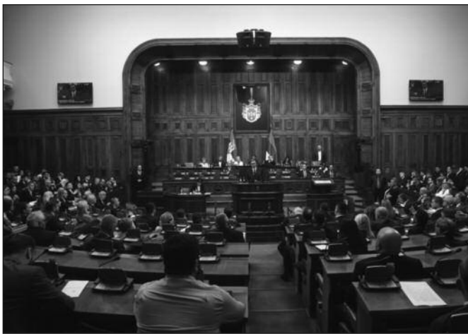
Александар Вучић: Од повлачења признања нећемо одустати

Председник Србије је предочио да је у последњих 10 година уложено више новца у Космет него у 40 година пре тога, иако се број српског становништва смањило за две трећине. У последњих 10 година, од маја 2019. до данас, изграђено је и реконструисано средствима државе 2.480 стамбених јединица, а у току су радови на изградњи 232 стамбене јединице. Приводе се крају радови на повратничком насељу Сунчана долина где ће се обезбедити услови за живот 1.500 лица, навео је Вучић. Он је додао да је завршен регионални водовод Зубин Поток-Звечан-Косовска Митровица, а да се финансира изградња постројења за прераду воде Болованка у Штрпцу. Заокружимо здравствено рекреативни комплекс Рајска бања, изграђена је ПЦР лабораторија, а раде се нови објекти на здравственом центру у Косовској Митровици,