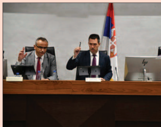
Грађани до уторка могу да дају предлоге

Учесници у јавној расправи могу доставити примедбе, предлоге и сугестије Одељењу за привреду и финансије Градске управе града Краљева у писаној форми или на e-mail адресу privreda_i_finansije@kraljevo.org на посебном обрасцу, најкасније до