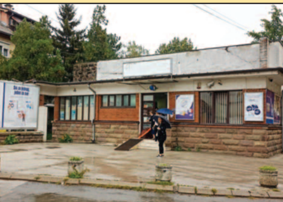
Упути саобраћајницу која води до улаза у Поликлинику и до ОБ „Студеница“

Разговарао са представницима Вега д.о.о. из Ваљева, који су нови власници и договорено је да грађани могу без проблема да дођу до лекара