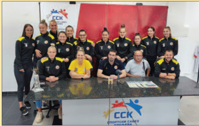
Кошаркашице ЖКК Краево спремне за нову сезону