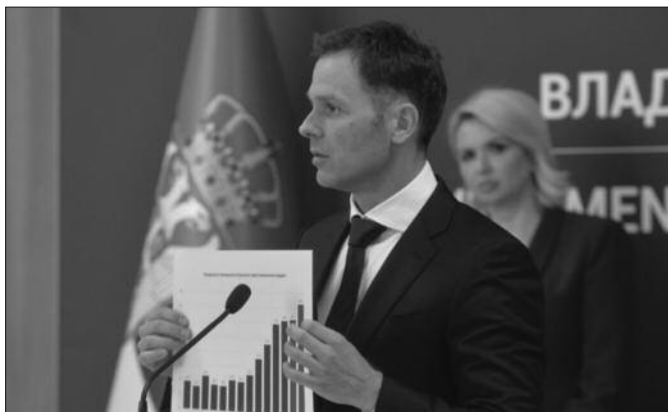
Министар Сениша Мали најавио највећи раст минималне зараде икада

Министар је указао на то да је држава из године у годину ишла ка материјалном повећању минималне цене рада, много већем него што је била стопа инфлације, а исти принцип примењује и сада. Наиме, како је предочио, просечна стопа инфлације ове године пројектована је на 11,5 одсто, наредне године 8,7 одсто, тако да са те стране ово повећање минималне зараде, умногоме или бар