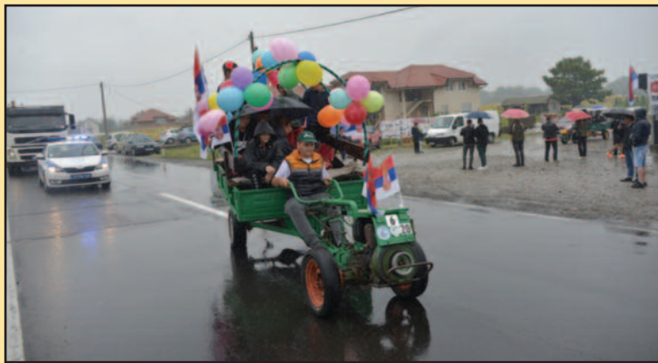
Ни јака киша није зауставила љубитеље фреза