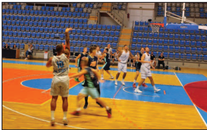
Детаљ са једне утакмице Слоге у КЛС