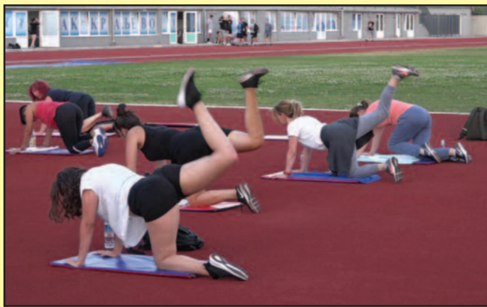
Краљевчанке све бројније на фитнес тренинзима

„Ову акцију је пре непуних три године покренуо Спортски савез Србије у сарадњи са више од 35 територијалних савеза и општина широм наше земље, међу којима је и наш у Краљеву. Акција је јако добро осмишљена, лепа и корисна и из године у годину све је масовнија. Има за циљ да укључи што већи број припадница лепшег и нежнијег пола у рекреативни спорт. Што се тиче тренинга, они се реализују два пута недељно, уторком и четвртком од 19 до 20 часова на Атлетском стадиону. Користимо ову локацију током пролећа и лета и када је време лепо. Када су у питању зимски месеци, прелази се у затворен простор, у салу за вежбање. Јако је важно да напоменем да сваке године, уз помоћ Спорт-