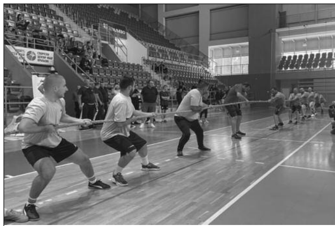
Вуча конопца само за горостасне тешкаше

вамо да очувамо. Хвала вам што поред модерних спортова, годинама увежбавате и традиционалне српске спортске дисциплине. Зато је данашње такмичење значајно јер ће по-