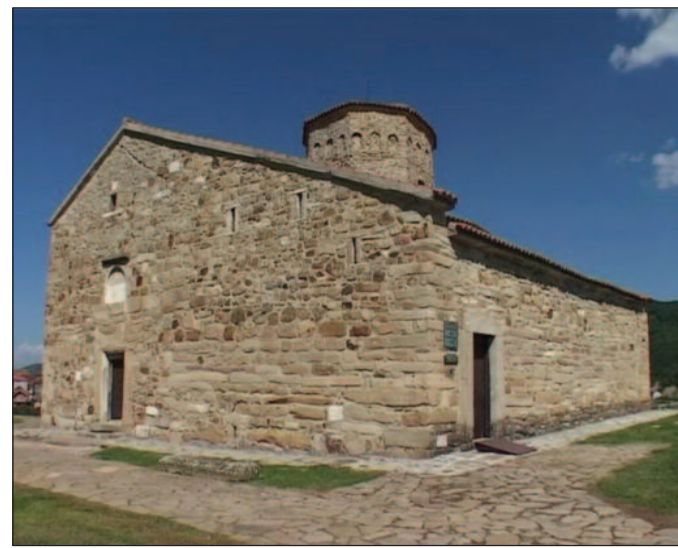
Петрова црква својим специфичностима и тајновитошћу буди посебно интересовање