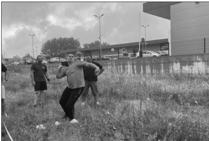
Бацање камена с рамена – изазов за најјаче

већ смо, захваљујући екипи Милочаја, домаћини и регионалног такмичења. Верујем да ћемо бити добри домаћини, а да ће се екипе успешно надметати у овим спортским дисциплинама које су заборављене, а које покуша-