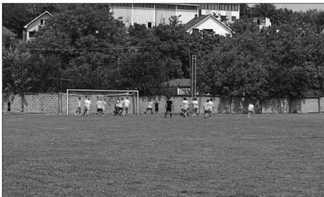
Вредни бодови за Кикерсе против Спартака

Стадион: код Ложионице у Краљеву Гледалаца: 300 Судија: Пред-