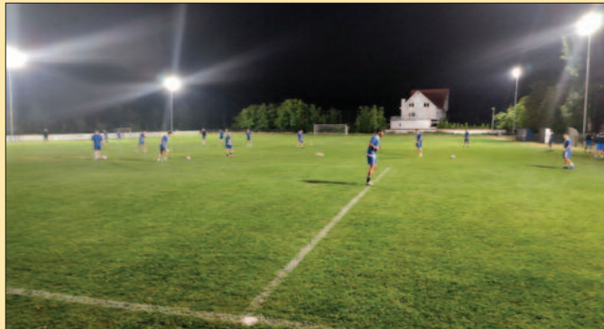
Тренинг фудбалера краљевачке Слоге на игралишту зонаша Карађорђа у Рибници

- Драго ми је да сам у Краљеву које је позната и призната спортска средина. Без обзира на тренутну ситуацију, ово је права фудбалска средина, простор са кога су потекла многа позната имена југословенског и српског фудбала. Моја је била жеља да одем из Београда, из те гужве и радим у клубу који представља један град, као што је то Краљево и Слога. То је био разлог да