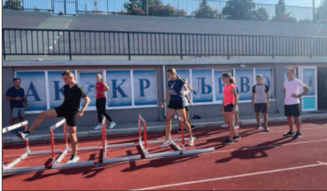
Неки од њих сутра ће наследити наше познате атлетичаре

У Краљево је пристигло око 65 милишана и 13 тренера. То су такмичари рођени 2006, 2007 и