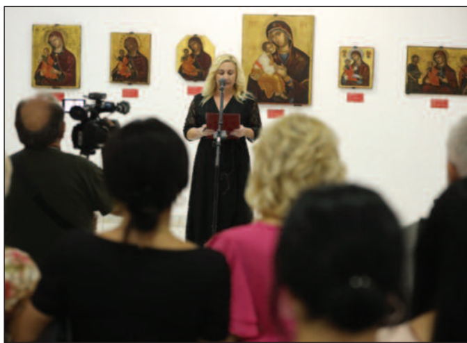
Свечано отварање манифестације по којој је наш град препознатљив

- Врло је важно да град буде препознатљив по манифестацијама, као што је ова. Веома ми је драго што отварам ову духовну манифестацију, која траје већ скоро трећину века. То се дешава када човек има храбро-