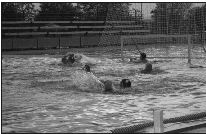
Одличне игре ватерполиста Краљева у тек окончаној сезони