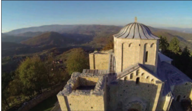
Ђуређеви ступови, манастир бурне историје са судбинским значењем