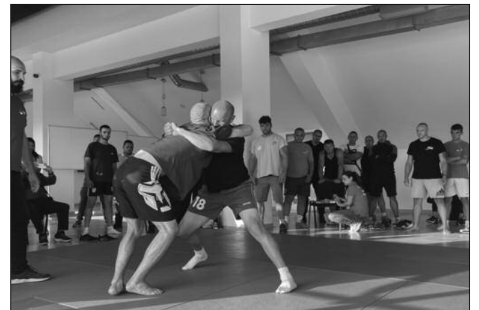
Рвање се задржало до данашњих дана

година. Како је појаснио, дисциплине су атрактивне за публику, а за професионалне спортисте необичне јер се са тим не сусрећу свакодневно. Екипе ће се надметати у специфичним дисциплинама које су заборављене у модерном спорту, као што су надвлачење штапа и конопца, трка у цако-