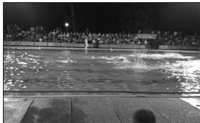
Детаљ са једне ватерполо утакмице у Краљеву

прелазимо у „Брезу“ у Врњачкој бањи. Управо се воде разговори око тога. Ако Бреза не буде радила, поново ћемо у Крушевац. Нећемо одустати, радићемо максимално колико можемо у овим