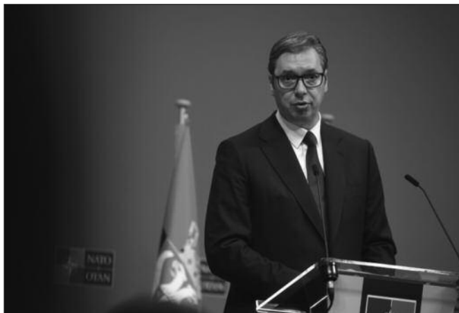
Александар Вучић, председник Републике Србије

-Наше је да говоримо о нашој позицији и да сачувамо мир и стабилност, рекао је председник Вучић.