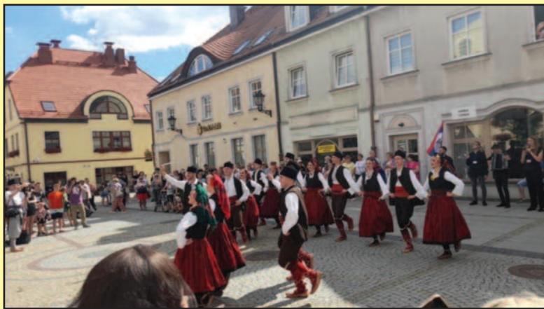
Запажен наступ првог ансамбла на Међународном фестивалу Европе у Пољској

- Ову богату сезону започели смо још у мају, када је наша хорска секција учествовала на Фестивалу хорова у Бијељини и тамо освојила бронзану медаљу. Јун смо провели на домаћем терену и имали смо гостовања у Београду, Крушевцу, Врњачкој Бањи, Владичином Хану. Организовали смо и нашу познату манифестацију „Лето код Абрашевића“. Имали смо гостовања у Турској и тамо су се представили чланови рекреативне секције, као и чланови секције ветерана. Они су такође донели две награде са великог фестивала из Турске. Први ансамбл је гостовао на највећем фестивалу Европе који је одржан