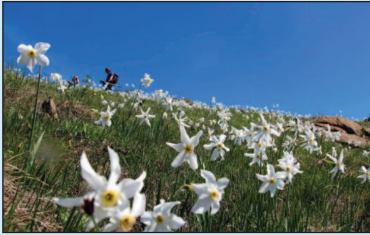
Нс Столовима заштићено подручје од близу десет хиљада хектара

храстов и буков, са низом уметнутих и измењених екосистема. Посебан значај Пределу изузетних одлика даје присуство строго заштићених дивљих врста попут мрког медведа и видре, као и дивокозе, која је након