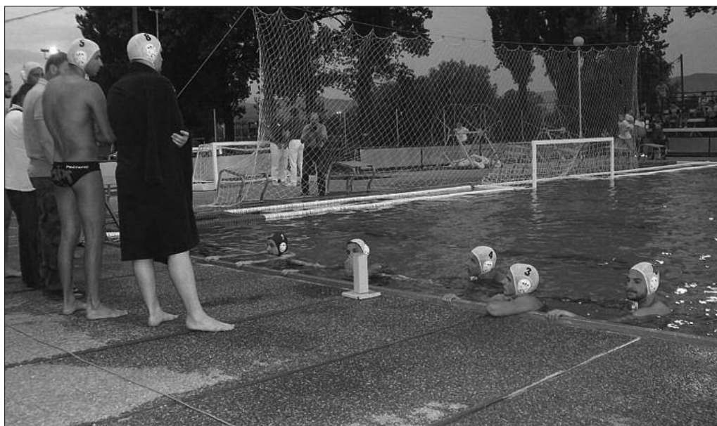
Ватерполисти Краљева током једне утакмице на градском базену