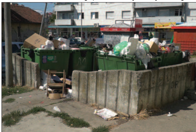
Контејнери се празне сваки други дан и стално су пуни

Пре неколико дана смо иза Дома војске затекли неких 60 до 70 цакова пуних шута. То не може да се реши механизацијом, већ наши радници морају ручно да их убаце на тракторску приколицу. То је посао од сигурно једног целог дана за наш трактор, што нам одузима много времена и енергије и представља велики трошак за нас. Осим тога, највише се дивље депоније појављују на триангли у Грдици. Као што знате, ми смо домаћинствима у овом насељу поделили канте од 120 литара, како бисмо спречили појаву дивљих депонија, али нажалост то није уродило