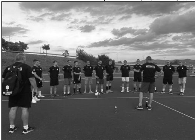
Први тренинг рукометаша Металца на Атлетском стадиону у Краљеву

- Што се тиче мог рада са професионалним спортистима, мој аршин неће бити исти према свима. Од рада, односа према мени као кондиционом тренеру и према самима себи, према тренингу и према саиграчу и другару зависиће и хемија и резултати ове екипе. Мени лично, ово је прва сезона у рукомету, тако да ћу и ја учити од играча, као и они од мене. Осећам