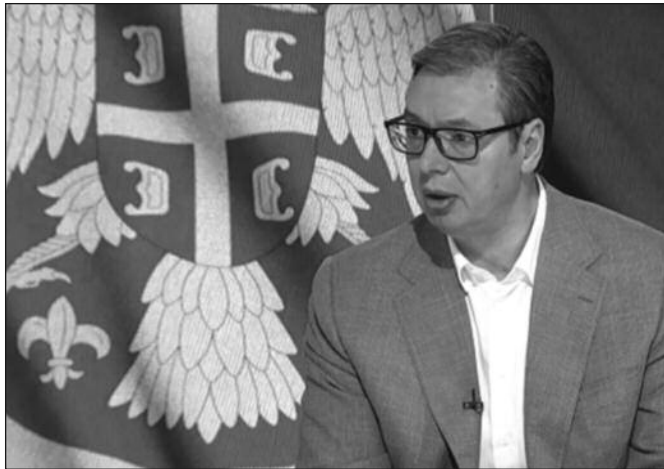
Александар Вучић, председник Републике Србије

-Суштина проблема је у томе што је очигледно да неки у региону мисле да треба да искористе прилику опште хистериче због напада Русије на Украјину, да Србију треба прикопчају уз Русију, да би цео Запад нагрнуо на Србију, јер не могу на Пучина. Да би они, у региону,