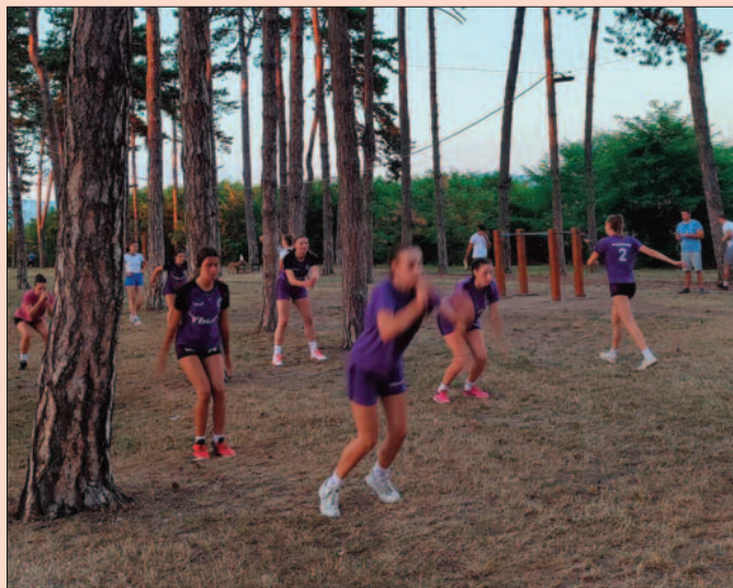
Техничарке на првом тренингу у Борићима