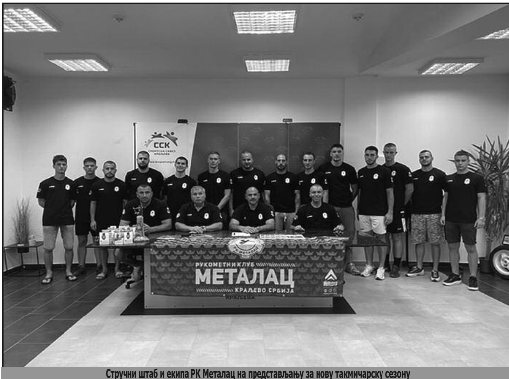
Стручни штаб и екипа РК Металац на представљању за нову такмичарску сезону

- Пробаћемо у сезони пред нама да направимо бољи резултат него прошле године. Сходно амбицијама смо и селектирали екипу, која је драстично другачија у односу на прошлогодишњу. Мислим да смо урадили добар посао током лета и овог прелазног периода и склопили смо екипу онако како смо желели. На време смо се окупиле, треба новом тиму дати простора и времена да се упозна, да се добро физички припреми и да се потом и уиграју кроз тренинге, утакмице и турнире који нам следе. Сигуран сам, када почне сезона, да ће овај тим одмах бе-