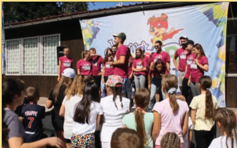
На Гочу основци на "Супер распусту" али и одбојкаши, кошаркаши, џудисти

из Краљева, али и из других градова. Планина има доста, али поново је почео да се повећава број оболелих од корона вируса, мађутим ми за сада нисмо имали никаквих проблема, правимо планове и за наредно пролеће и лето, додао је Милић