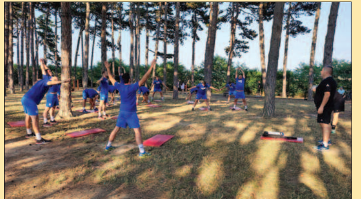
Шире плућа у борићима-одбојкаши Рибнице на првом тренингу