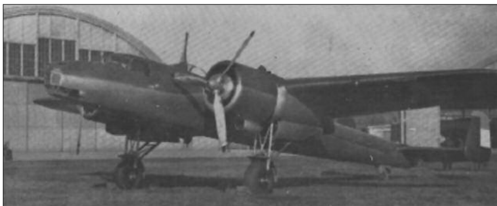
Дорнијер До-17К ратног ваздухопловства Краљевине Југославије испред фабрике у Краљеву

Најбољи пример ове је мотор К-14НО или тако зван „двострука звезда“, звездасти мотор са четрнаест цилиндараи 870 коњских