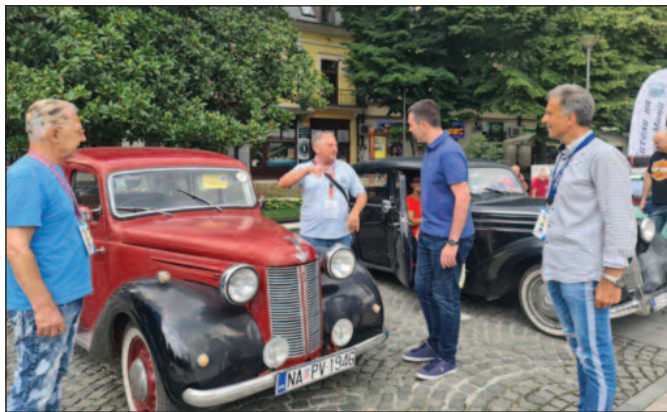
Власници са нескривеним поносом показивали своје четвороточкаше

Захваљујући Олдтајмер клубу Врњачка Бања, и ове године небична поворка најразличитијих возила, која је украсила Трг српских ратника, привукла је заљубљенике у старе аутомобиле – оне који их се сећају из млађих дана, али и оне који се први пут сусрећу са оваквим четвороточкашима, од којих су неки