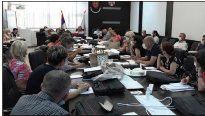
Ове недеље завршена обука за градске инструкторе

-За пописивача се могу пријавити не само незапослена лица, већ и запослени грађани, као и студенти и старосни пензионери. Потребно је да испуне неке опште, али и посебне услове. Што се тиче општих услова, потребно је да је кандидат држављанин Републике Србије, да је у тренутку подношења пријаве пунолетно лице, да има најмање завршену трогодишњу средњу школу, да има пријављено боравиште или пребивалиште у Републици Србији, да лице није кажњавано, да се против