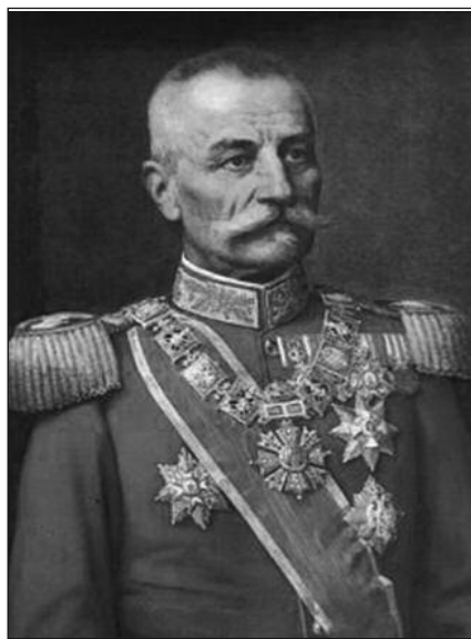
Петар I Карађорђевић

Краљ Петар је био врховни командант српске војске у Балканским ратовима. Због старости је 24. јуна 1914. пренео краљевска овлашћења на свог сина, престолонаследника Александра. У Првом светском рату повлачио се са војском преко