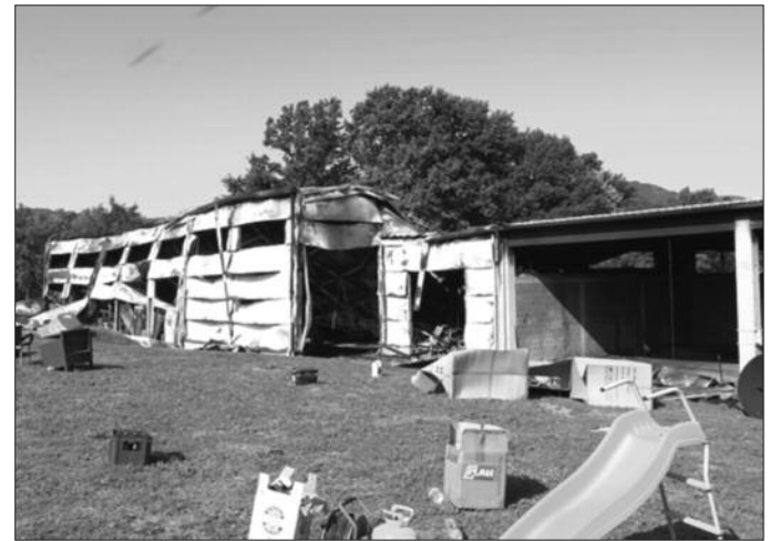
Производна хала потпуно уништена

горело. Овде је уложено много новчаних средстава. Сама хала која је изграђена 2016. године коштала је тада 130.000 евра, а роба која је изгорела је бар пет пута вреднија од хале. Најгоре