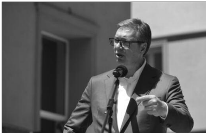
Александар Вучић, председник Републике Србије

Председник је рекао да ће држава гледати током зиме да буде и једнократне помоћи, али