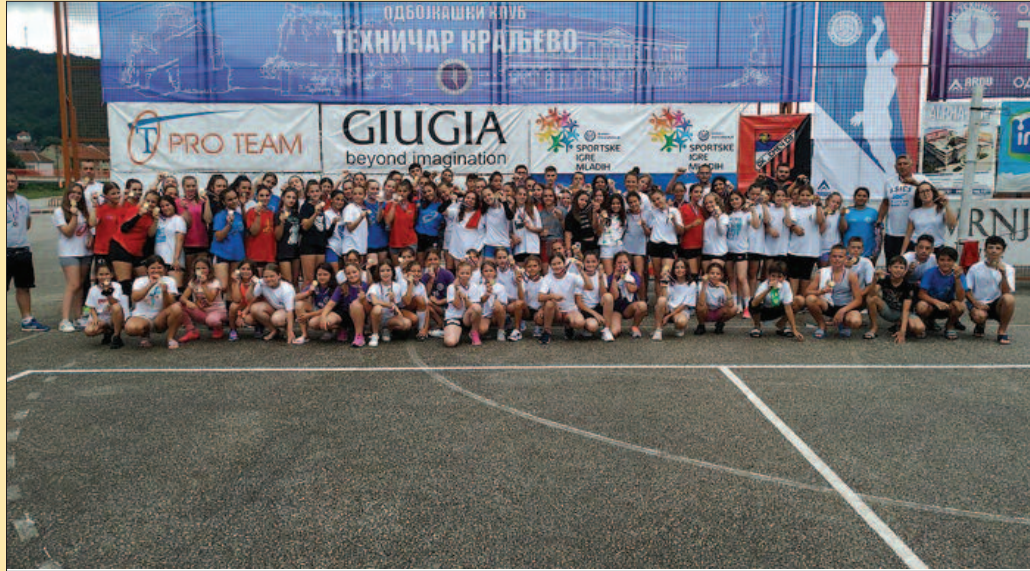
Сваки полазник на кампу осигурао је медаљу за труд и рад

- Пре 15 година нико није могао ни да наслути колико ће ово да траје. Сада је ово камп са озбиљном традицијом, овог јула ће доживети 16. издање, а до сада је