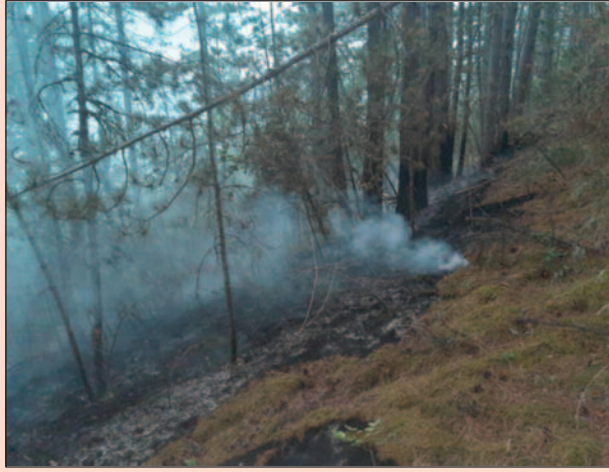
Ватрогасци спречили већу штету

Брзом интервенцијом ватрогасних екипа из Ушћа и Краљева, упркос неприступачном терену и отежаним временским условима, ликвидиран је шумски пожар који је у уторак поподне изазвао удар грома у селу Слатина изнад Ушћа.