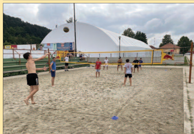
Одбојка на песку-обавезан садржај одбојкашког кампа у Гучи

ће на предивним теренима код Дома трубача у Гучи радити полазници из неколико градова Србије, али највећи број деце до-