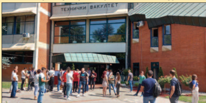
Пријемни испит полагало више од пет стотина кандидата

бруцоша, од којих су 455 буџетска места, док су 133 места предвиђена за студенте у статусу самофинансирања. Влада подједнако интересовање за свих дванаест студијских програма Факултету техничких наука у Чачку. Прелиминарне ранг листе биће објављене на дан пријемног испита до 20 часова, а упис студената је од 6. јула по утврђеном распореду који је доступан на сајту Факултета техничких наука у Чачку. Упис студената на непопуњена буџетска места обавиће се 8. јула, када ће студенти који нису уписали жељени студијски програм на терет буџета, имати могућност да се одлуче за други