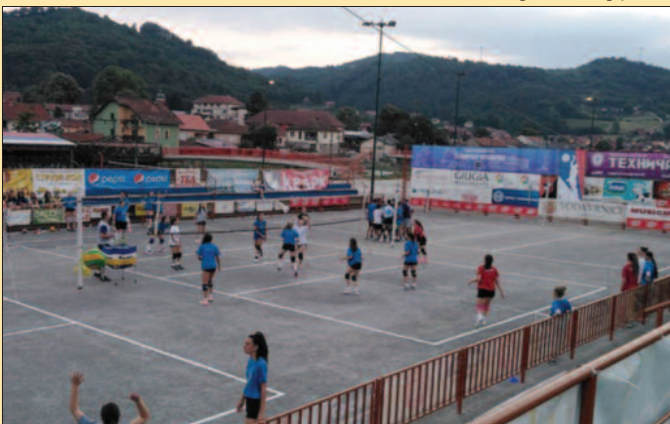
На тренинзима све пршти од одбојке