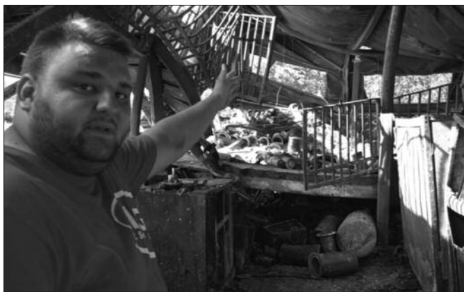
Алексићи изгубили све што су три деценије стварали

–Пошао сам ка спрату са против пожарним апаратом, јер сам видео на пар места да је ватра почела да букти. Горе су ми били филтери, сепаратори и ре-