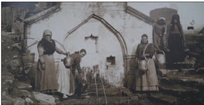
Прилика да се упозна начин живота жена када се користила обрамца