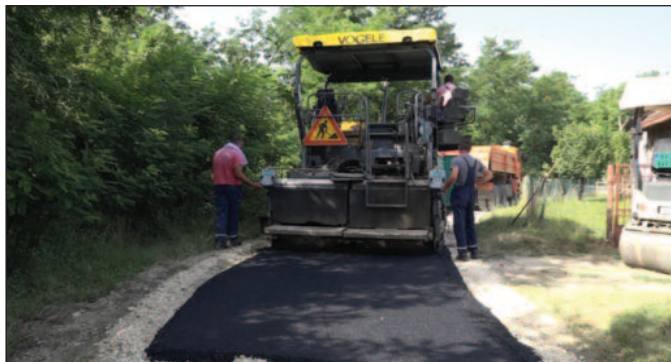
Све мора да се издржи иако асфалт пече а сунце пржи

-Остао је да се уради један део колектора атмосферских вода у Поцерској улици која се директно укључује у Главашеву улицу, која је већ израђена и завршена. Остао је још само прикључак атмосферске канализације на атмосферски колектор вода у Главашевој улици. Што се тиче осталих радова једна екипа је тренутно ангажована на Жичком путу, односно у Жичкој улици где радимо поправку лежећих полицајаца. Једна екипа је на крпљењу пута Метикоши-Ратина, друга екипа је на крпљењу у Кованлушкој улици која иде кроз цео Кованлук, поред царине до Ратине. Имамо и екипу која је ангажована на изради потпорних конструкција и потпорних зидова на путу Лопатница - Богutowац - Станча - Толишница. Тамо имамо велика оштећења и већ дужи период смо тамо ангажовани. Видећемо колико ћемо тамо још бити ангажовани са обзиром да су нам средства ограничена и нешто смо већ интервенисали у смислу укључења и других предузећа, пре свега Западне Мораве. У овај пројекат би требало да се укључи још предузећа са територије Града Краљева јер се ради о великом послу, великом ангажовању