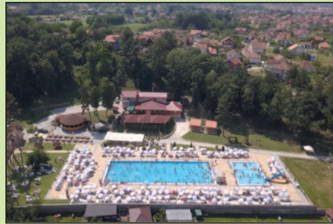
Купачима на располагању лежаљке и сунцобрани

На комплексу посетиоцима су осим базена на располагању и ресторан са брзом храном, дечије игралиште, ресторан са традиционалном кухињом, као и апартмани за одмор. На базенима Мошин Гај за све непливаче понедељком, средом и петком у вечерњим сатима организована је и школа пли-