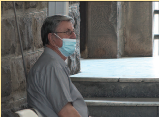
За недељу дана више од сто заражених

се пацијенти у амбуланту јаве после доласка са одмора али то није био значајан број да би указивао на то да су се са летовања вратили позитивни.