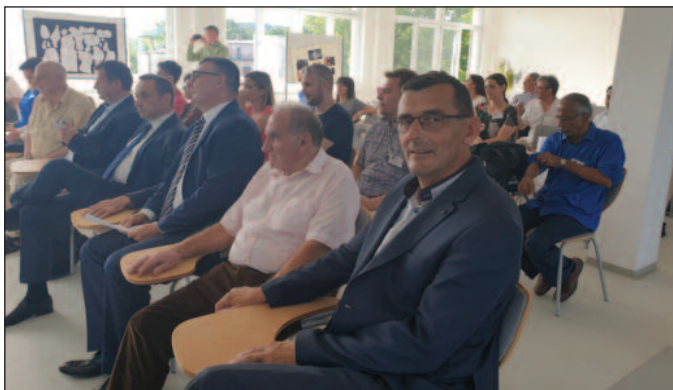
Научници, професори и истраживачи из више од десет земаља