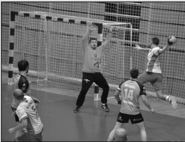
Детаљ са једне утакмице рукометаша Металца

Редовна седница Скупштине клубова Супер „Б“ рукометне лиге Србије одржана је средином недеље у хотелу „Феникс“ у Пожаревцу. Међу присутним делегатима нашли су се и представници краљевачког Металца. Прихваћен је календар такмичења, нова сезона ће почети 17/18. септембра, а занимљиво да је на жребу краљевачки Металац добио редни број 1 и сезону у групи „Исток-Запад“ почеће са два везана меча пред својим навијачима. Први противник Краљевчанима биће Прибој, а онда ће крај Ибра гостовати дојучерашњи суперлигаш Мокра Гора из Зубиног Потока. Ове сезоне поред поменутих клубова, у лиги ће наступати и нишки Железничар, Лозница, Власотинце, Нови Пазар, Хајдук Вељко из