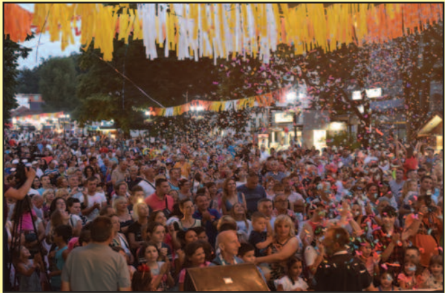
Очекује се више од триста хиљада посетилаца

• Марија Шерифовић, Бајага, Ана Бекута, Неверне бебе, Марина Висковић, Славко Бањац и многи други на 18. Врњачком карневалу • Велика међународна карневалска поворка биће у суботу, 16. јула