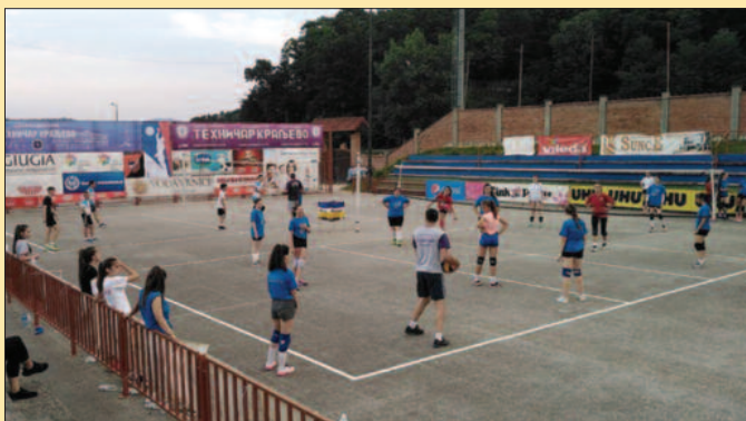
Идеални услови за тренинг свих полазника на кампу

селектора, тренера највишег звања. И због свега тога морамо да будемо поносни, али то је традиција која обавезује. Морамо да