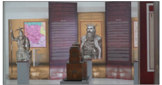
Изложба о постанку Крушевца градњом цркве Лазарице