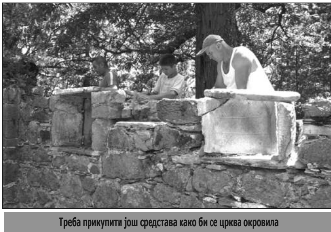
Треба прикупити још средстава како би се црква окровила

-Завод је због лошег стања цркве и дугогодишњег пропадања израдио пројекат конзерваторско-реставраторских радова и средства су одређена на конкурс Министарства културе и информисања. Вредност пројекта је 2,5 милиона динара у првој фази и то је почетак радова. Ми се надамо да ће бити разумевања у Министарству културе и информисања, локалној самоуправи и код донатора и да ће се скупити средства како би се црква ставила под кров што и јесте првобитна замисао и идеја стручњака Завода за заштиту споменика културе,