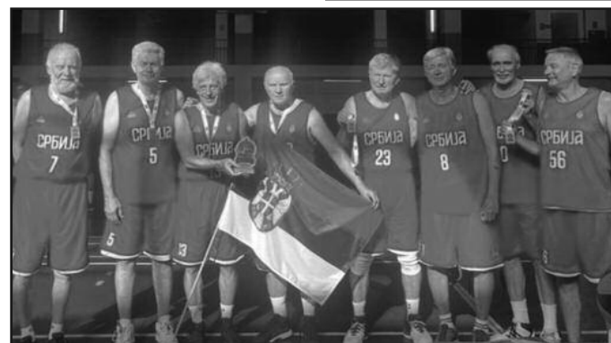
Репрезентација Србије у категорији 65 плус освојила златно одличе