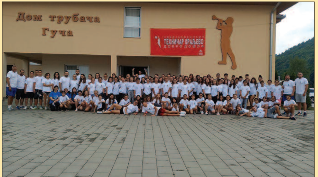
Дом трубача и ове године ће угостити стотинак полазника одбојкашког кампа Техничар КВ-Гуча