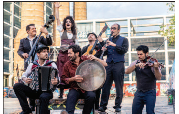
Фестивал „Маглич“ затвара концерт "BARCELONA GIPSY BALKAN ORCHESTRA"

Фестивал уметности "Маглич" по традицији затвара концерт, а овога пута организатори су се одлучили за "BARCELONA GIPSY BALKAN ORCHESTRA", познати интернационални састав који спаја музику Балкана, Блиског истока и Медитерана. Њихов кон-