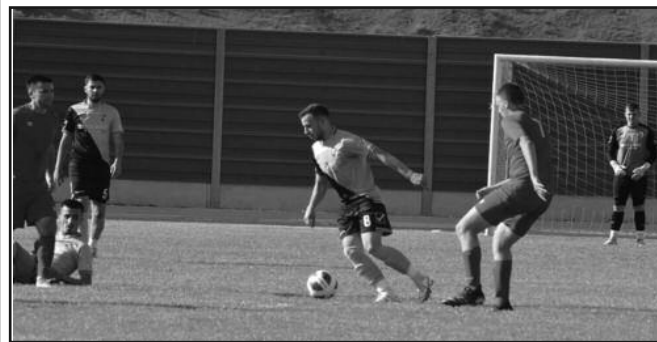
Шампионска звона звоне-детал са утакмице Тутина