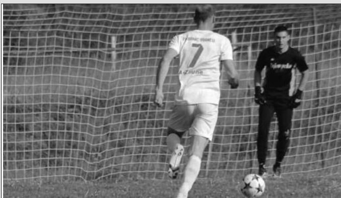
Узбуђења на утакмицама МФЛ Краљево