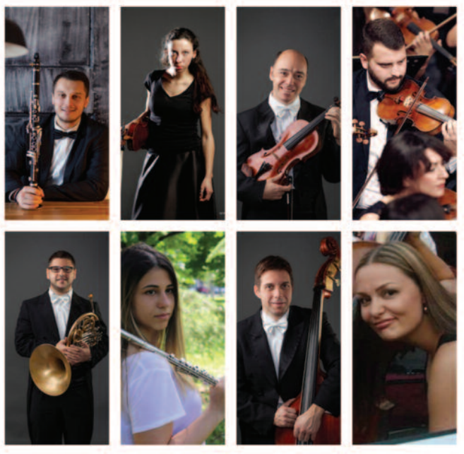
Чланови ансамбла „Чувари традиције“

Пројекат је суфинансиран из буџета Града Краљева - ставови изнети у подржаном медијском пројекту нужно не изражавају ставове органа који је доделио средства