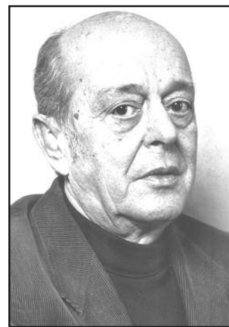
Иван В. Лалић

1931. - Рођен Иван В. Лалић, књижевник, академик. Иван В. Лалић, песник, преводилац и есејиста, један је од наших најпревођенијих и најпозна-