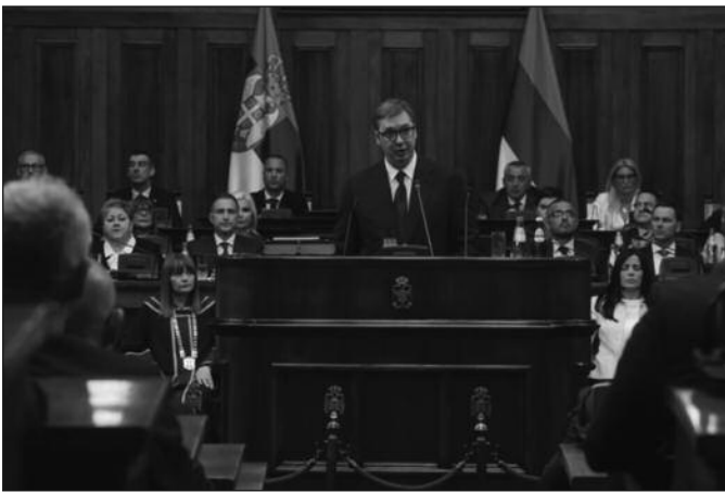
Председник Александар Вучић говори о приоритетима свог другог мандата

земљу, ма шта да кажете бићете предмет критике јер сте некога увредили јер желите да подстичете рађање. Данас имамо много више емисија и новинских чланака о љубимцима, него о деци. Не можемо да преживимо ако немамо оне који ће