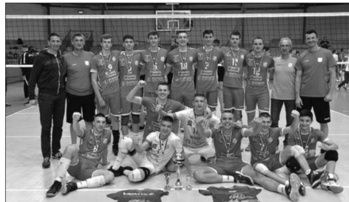
Прваци Србије у кадетској конкуренцији-ОК Војводина НС Семе

Краљево је претходног викенда било домаћин Првенства Србије у одбојци за кадете. Шампионски пехар припао је младим одбојкашима новосадске Војводине који су у финалу победили београдску Црвену звезду резултатом 3-2 (19:25, 27:29, 25:21, 25:18, 17:15). У борби за треће место Партизан из Београда је максималним резултатом 3-0 (25:12, 25:17, 25:15) победио екипу краљевачке Рибнице која је у конкуренцији 12 екипа на овом првенству на крају била четврта.