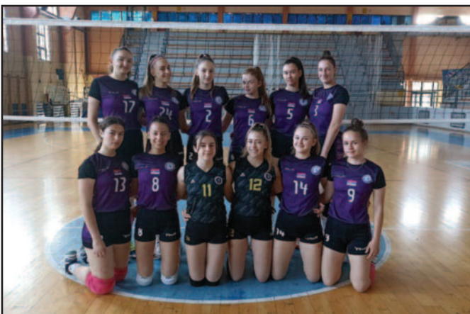
Кадетска екипа ОК Техничар Краљево

ЦРВЕНА ЗВЕЗДА – ЦРНО – БЕЛЕ 011 (БЕОГРАД) 3:0 (25:22, 25:15, 25:17)