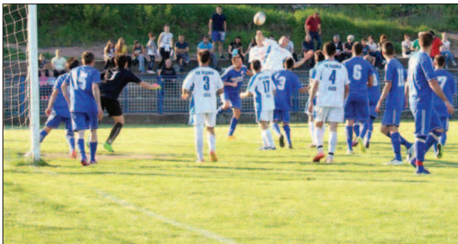
Детаљ са утакмице Окружне фудбалске лиге

У Окружној фудбалској лиги претходног викенда одигране су утакмице 28. кола. Лидер није успео да победи непредвидиве госте из Конарева, аздржао је позицију на трону лан сада са само два бода предности. Напредак је рутински славио код „фењераша“ у Матаругама и сада види реалну шансу да се домогне водеће позиције. Утакмица са много голова и преокрета виђена је у Тавнику где су „дуњари“ ипак успели да победе госте из Новог Села. Узбудљиво је било и у Врдилма где је после шест голова дошло до поделе плена. Прогореличани су славили убедљиву победу против гостију из Баљевца, као и у Ушћу где је домаћин био сигуран против релаксираног Ибра. Важну победу остварио је лигаш из Јовца протогостију из Делимеђе. У среду 1. јуна на програму су биле утакмице ванредног 29. кола Окружне фудбалске лиге. ОФК Рас је успео да победи Тутинце који као домаћини играју у Новом Пазару, док је у Грачацу домаћин био сигуран против „малинара“ из Врдилма. Тако је разлика на табели остала иста и одлука пада у последњем колу када ОФК Рас дочекује другопласирани Напредак. У овом колу вреди издвојити убедљив тријумф Конареваца против гостју из Ушћа, као и „петарду“