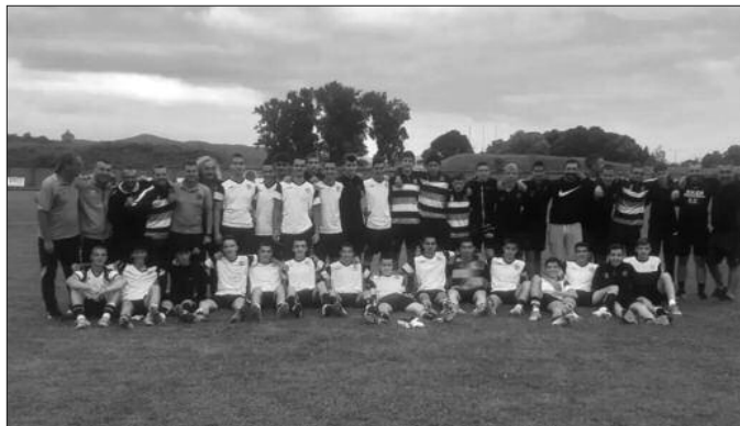
Одлични седми за седму сезону елити-кадети и стручни штаб краљевачког Кикера

„Кикерси“ су са 44 бода сезону завршили на одличном седмом месту на табели и седму годину за редом ће играти у Квалитетној лиги Србије. Успех вредан сваке пажње