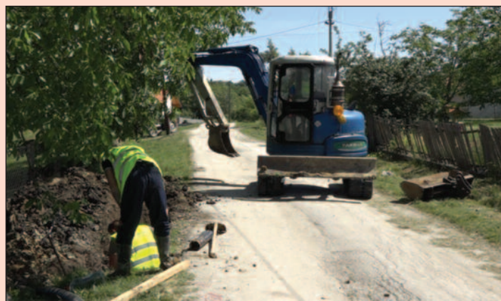
Завршна фаза реконструкције трасе од километар и по

завршна фаза радова на траси дугој 1600 метара како би и мештани овог дела села имали воду.