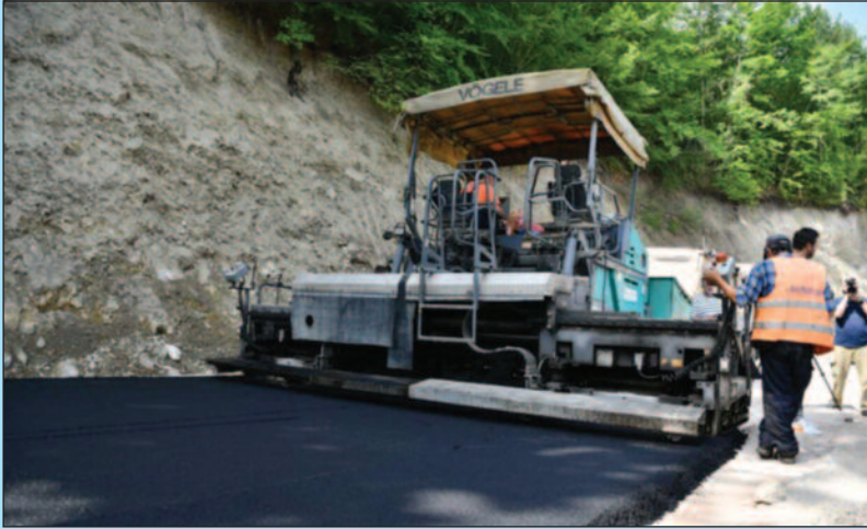
Радне машине замењене, наставља се асфалтирање

Као што је приликом посете граду Краљеву председник Републике Србије Александар Вучић обећао, пут Студеница-Рудно ће бити изграђен – захваљујући залагању и сарадњи председника Републике Србије, Владе Републике Србије и Јавног предузећа „Путеви Србије“.