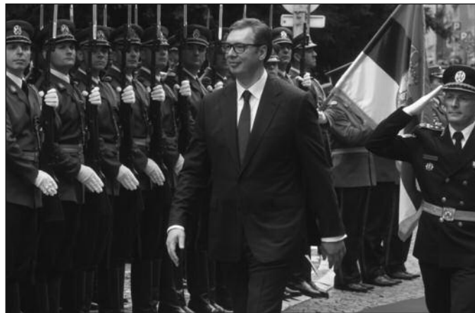
Испред Председништва председника Вучића дочекала Гарда Војске Србије

кавши да им није било нимало лако у претходних пет година. Данилу, Милици, Вукану бескрајно вас волим и тата ништа не би без њих могао, поручио је председник Вучић чија су деца и родитељи присуствовали данашњој церемонији полагања заклатве. Ове речи