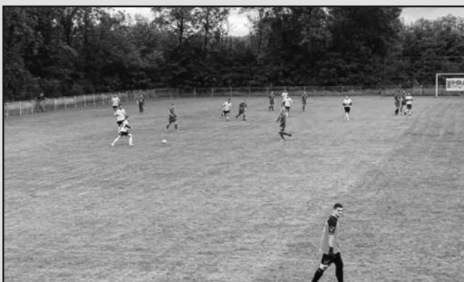
Дуел имењака у Мрсаћу и убедљива победа лидера