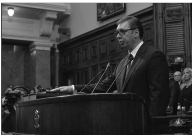
Александар Вучић полаже заклетву пред старим скупштинским сазивом

-Велики Конфучије је рекао да компромис може да се прави са свим осим са идеја-