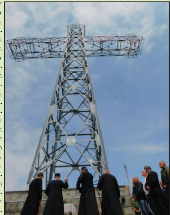
Знак уздарја Светом Сави и породици Немањића

предузећа и културних установа и представницима Удружења ратних војних инвалида града Краљева, и овде сабрали су на било који начин помогли овај подухват, било појединачно, или уз помоћ, који су се на тај начин прислонили на ово Крсно здање и постали заједничари у задужбинарском наслеђу Све-