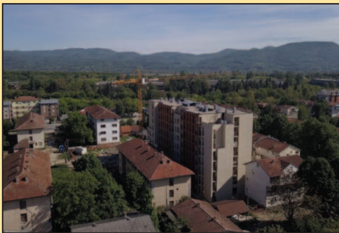
Радови у Доситејевој никако да крену пуном паром

Одустао је с обзиром да је модел уговора био са фиксном ценом. Модел уговора је идентичан уговору који је примењен успешно за реализацију прве фазе. Међутим, промене цена на тржишту грађевинског материјала тако да извођач није могао да прихвати уговор са фиксном ценом иако су цене изказане у св-