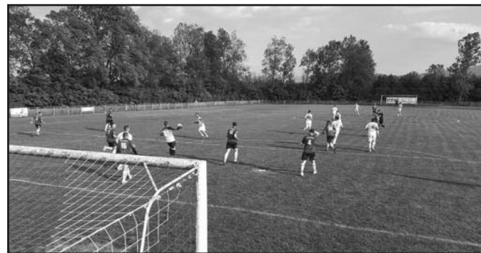
У Мрсаћу као на Маракани-детал са утакмице Морава-Стубал

Утакмицама 14. кола претходног викенда настављено је и првенство Градске фудбалске лиге, група „Морава“. Лидер је у Мрсаћу убедљиво победио госте из Стубла и на корак је од титуле првака и повратка у МФЛ Краљево. Први пратилац је екипа Милаковца 2018 која је победила „пескаре“ у Опланићима. Коначно су се радовали и „мундири“ победом против гостију из Штулца, док је права ревија голова виђена у Обрви где је домаћин победио госте