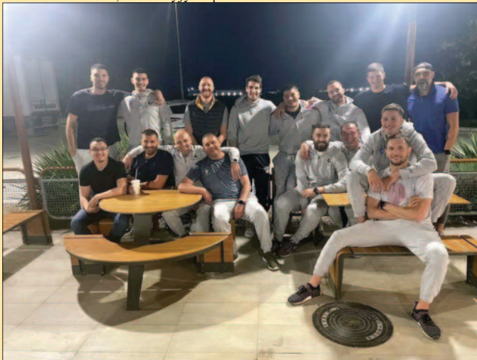
Заједничка фотографија кошаркаша и стручног штаба Слоге после меча у Новом Саду

гледали боље да је плеј оф игран одмах по завршетку КЛС. Без обзира на то, пауза је била и за Војводину. Дакле алибија нема.