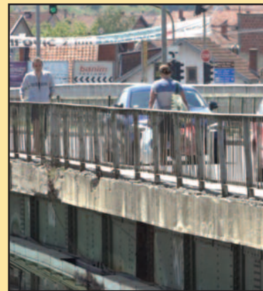
После пет деценија дошло време за са

– Мост је дуго по неком старом референтном систему био део државног пута. Он је последњих неколико година део нашег локалног референтног система и то је сада наша ингеренција. Долазиле