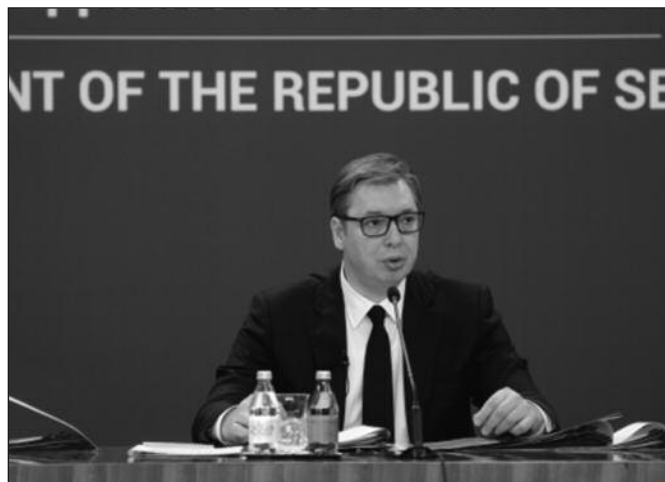
Питање Косова и Метохије је питање судбине наше нације

-Осетио сам и на својој кожи, добио сам хиљаде порука пред обраћање шта и како да кажем, јер сваки Србин боље од мене зна каква би политика Србије требало да буде, јер су они били на свим састанцима, а не ја... То је природно, да више верујемо емо-