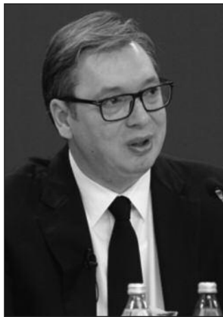
Младима понудити боље образовање и једнаку шансу за запошљавање

Када је реч о борби против климатских промена и заштити животне средине, нагласио је да ће