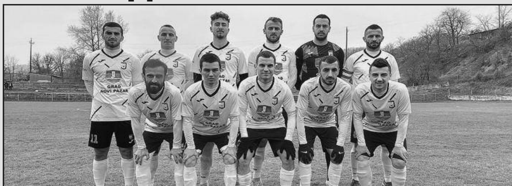
Фудбалери Јошанице из Новог Пазара лидери у шумадијско-рашкој зони

Претходног викенда одигране су утакмице 21. кола Шумадијско-Рашке фудбалске зоне. Водећа Јошаница је лако декласирала госте из Ратине и направила сјајну увертиру пред меч сезоне у Тутину. Другопласирани тим на табелони је у Рибници победио Карађорђа и са нестрпљивом чека обрачуна са Парзацима, јер ће у том ссурету пасти одлука ко ће се од два тима вратити међу српсколигаше. Врло је неизвесна и борба за опстанак, Слобода је победила госте из Ресника, као и Гоч који је у Топоници везао трећу узастопну победу. Није било победника у мечу Мокре Горе и Корићани, док је лигаш из Рашке у лепој серији, три бода су освојена у Гружи.