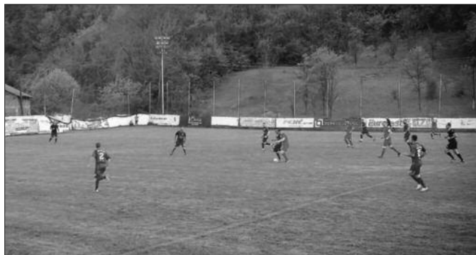
Сигуран ход лидера-детал са утакмице ОФК Рас-Пролетер

ПАРОВИ 25. кола: Рудар-ОФК Рас (субота), Пролетер-Радник (недеља 11ч), Јединство 2017-Тавник, Будућ-