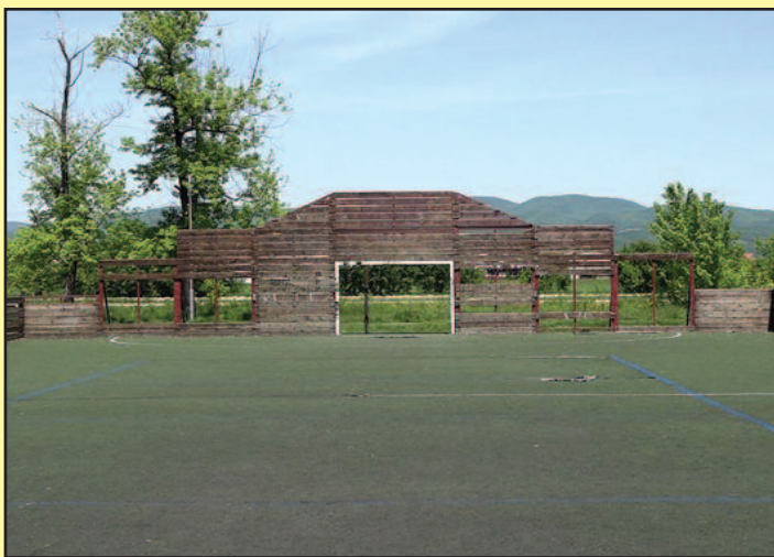
Коме је сметао мини пич терен - вандалски чин непознатих криваца