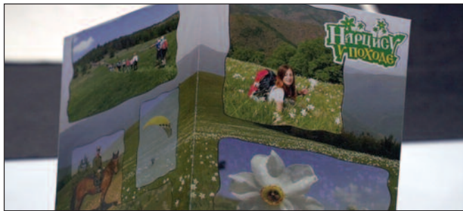
Традиција дуга 66 година - Нарцису у походе

- Изражавам задовољство што последњих година ово и слична удружења, посебно Туристичка организација све више доводе знатније новине у наш град, да упознају природне лепоте Краљева и околине. Сматрам да ако негде постоје услови за развој ове врсте туризма то јесте град Краљево са својим планинама, са рекама, и нарочито бројним културно-историјским споменицима, посебно из средњег века. Неки од таквих, манастир Студеница је уписан у листу Унескову листу светске, односно