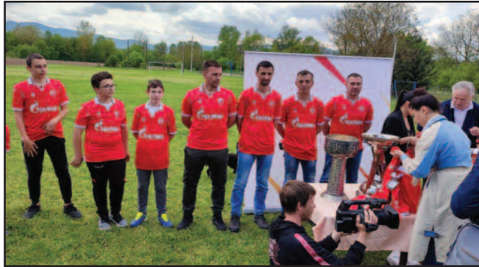
Београдска Црвена Звезда посетила Шумарице и поклонила опрему ФК Шумадија

- Ову акцију смо започели у сарадњи са Компанијом „Моцарт“ са жељом да обиђемо што више малих средина, малих клубова великог срца. Неписано је правило да баш из таквих средина потекне неко велико фудбалско име, а циљ је омогућити деци и младима са сеоског подручја квалитетне услове за рад. Овога пута смо у Шумарицама, селу код Краљева, где Црвена звезда има велики број поштовалаца и навијача и где сарадња са месним кубом Шумадија траје дуги низ година. Осмеси и узбуђење које смо измамили код најмлађих, али и старијих мештана овог питомог поморавског села, довољно говоре и то је знак да смо урадили праву и велику ствар. Локалном клубу смо донирали комплет опреме – каже Мирјана Бачкоња из ПР