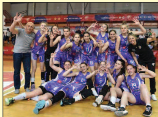
Кадеткиње ЖКК Краљево трећепласиране на државном првенству

• Београд је био домаћин финалног турнира Триглав осигурање кадетске лиге Србије за кошаркашице • У конкуренцији осам најбољих екипа у Србији кадеткиње Женског кошаркашког клуба Краљево освојиле су треће место и бронзану медаљу.