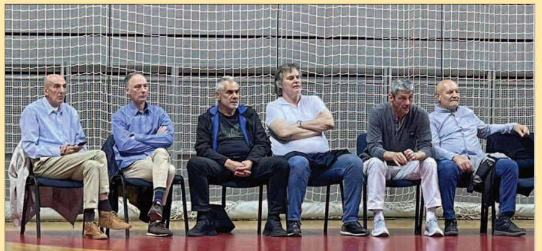
Слогине кошаркашке легенде подржале своје наследнике

мену још лошије издање Слоге. Потпуно неповезана игра, без садржаја, са много изгубљених лопти. Војводина је искористила све шансе, погађала кош домаћих из свих позиција и брзо стигла до капиталне предности 71-43. На крају треће четвртине Војводина је водила 73-49 и било је јасно свима у доврани да су „лале“ обезбедиле предност пред реванш у „српској Атини“. До краја утакмице постављало се само питање коначне кош разликe у корист Војводине која је на крају заслужено нанела Слоги убедљив пораз, најубедљивији ове сезоне. Коначних 67-95! Слога је убедљиво поражена и у Новом Саду од Војводине резултатом 104-80. Ако је после прве четвртине коју је до-