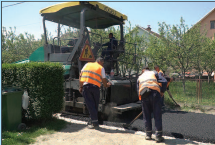
Асфалт за улицу дугачку 240 метара и широку три метра

За сада је на овој позицији издвојено око 60 милиона динара, са претпоставком да ће се уз ребаланс буџета за ову годину одредити додатна средства за асфалтирање са учешћем грађана од 15 одсто. Ово је прва у низу улица које ће бити асфалтиране у