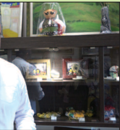
Стефанске организације Краљева