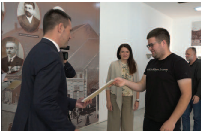
Градоначелник Краљева поделио уговоре о донацији за пројекте запошљавања

Један од резултата те веома успешне сарадње је управо ова додела грантова за оне који су покренули свој сопствени бизнис и