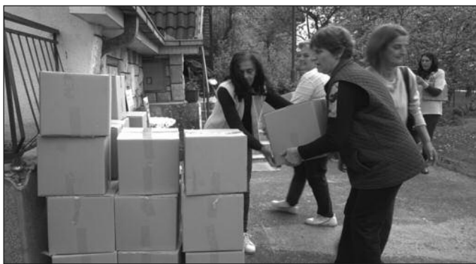
За живот достојан човека-донација СПЦ „Човекољубље“

Организација „Човекољубље“ постоји у оквиру Српске православне цркве и Краљеву су већ помагали у току земљотреса, а и поплава. Сарадња са мештанима Опланића траје већ три године на обострано задовољство. „Човекољубље“ тренутно организује пројекат у шест села, а поред поделе пакета старијим