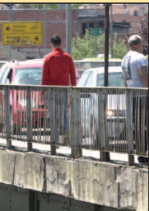
Реконструкцију старог Ибарског моста

прошлог века и сада је потребно обавити реконструкцијом моста