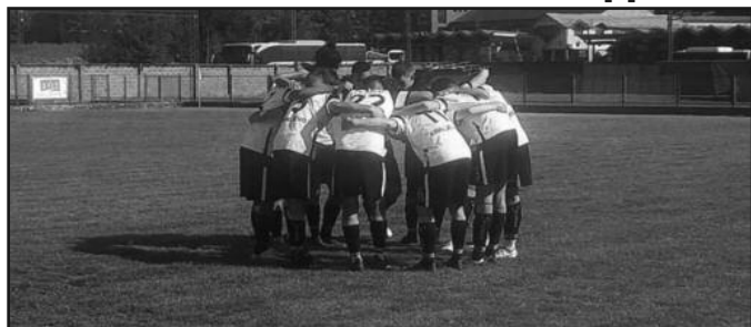
Пораз иза југа Маракане-фудбалери краљевачког Кикера

Кадетска фудбалска лига Србије настављена је претходног викенда утакмицама 27. кола. Краљевачки Кикер је у Београду, после три везана ремија, поражен од лидера Црвене звезде резултатом 3-0,