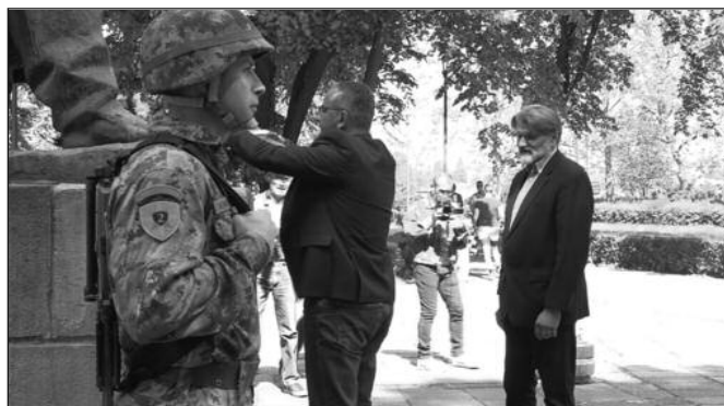
Представници локалне самоуправе положили венце на споменик Отпора и победе

● Град Краљево обележио је Дан победе над фашизмом полагањем венаца на споменик „Отпора и победе“ код главне железничке станице. Са овог места поручено је да Краљево никада неће заборавити злочине нациста у овом мирном граду као и да ће увек памтити жртве Црвене армије који су учествовали у ослобођењу Краљева и околине.