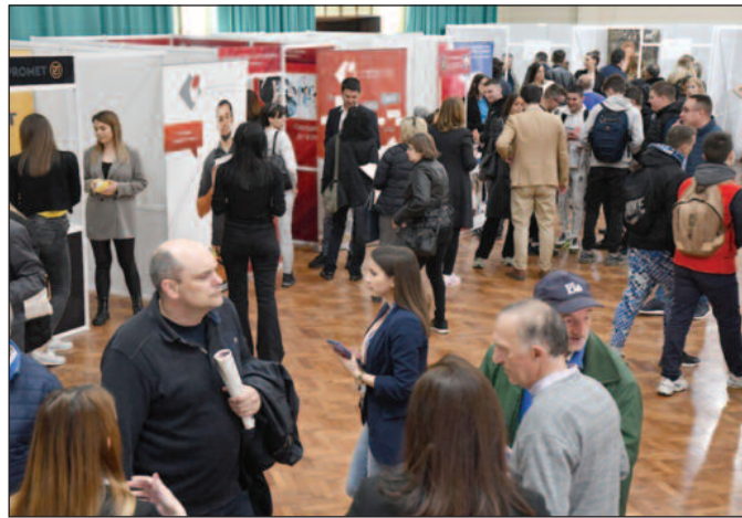
На Сајму је било учљиво велико интересовање средњошколаца

-Школска управа подржава и учествује у овој манифестацији што показује и број средњошколаца који су дошли на Сајам. Ученици имају могућност да погледају шта је све у понуди од