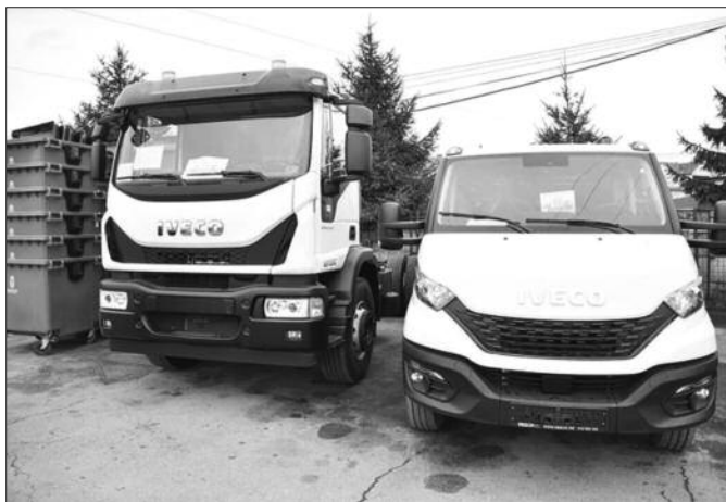
Нови камион моћи ће лакше да се креће закрченим улицама

- Са мини- смећаром моћи ћемо да премостимо критичне ситуације, као што су паркирани аутомобили и уске улице, јер има места где не можемо да приђемо великим камионима због повећаног обима саобраћаја. Други камион је носач