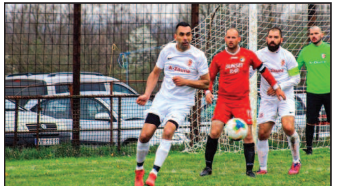
Детаљ са дерби меча Милочајац-Борац Вранеша