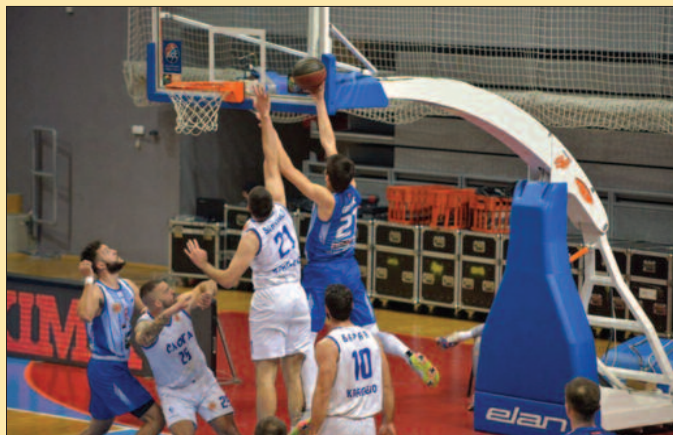
Са Новим Пазаром за историју - детаљ са утакмице кошаркаша краљевачке Слоге

Овај меч за нас је био од изузетног значаја. Само победа нам је чувала позицију на табели и предност у односу на директне ривале у борби за АБА 2 лигу. Ушли смо озбиљно у меч, не могу да кажем да је било лако, јер није. Слодес јесте последњи на табели, али они увек играју максимално, науче сваког ривала, поготово оне који их не схвате озбиљно. Ми смо, на срећу, ушли озбиљно у утакмицу, нисмо потценили противника, до изражаја је дошао наш