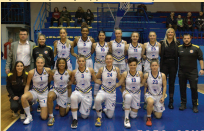
Завршена сезона правим дебаклом у плеј офу-ЖКК Краљево