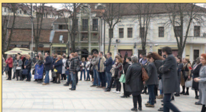
Просветари траже и да им се лична примања изједначе са здравством

Незадовољни просветни радници поред смањења броја ученика и промене закона из области образовања, захтевају и боље финансијске услове.