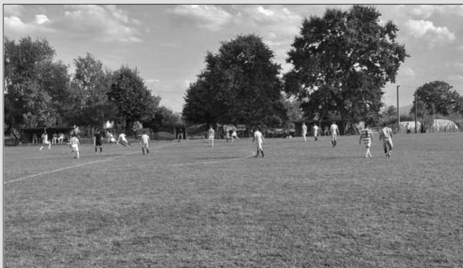
Детаљ са утакмице Шумадијско-Рашке фудбалске зоне

ПАРОВИ 17. кола: Карађорђе-Мокра Гора, Шумадија