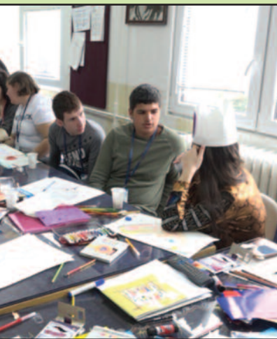
и помирење на Западном Балкану

изија ученика са тешкоћама у развоју кроз културу и Краљева и Тузле