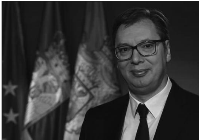
Александар Вучић, председник Србије и СНС-а

-Србија ће морати да се определи како и на који начин иде у будућност. Немам никакве сумње и илузује да ће се разговарати са свим политичким факторима, чак и са онима који делују да су најудаљенији од