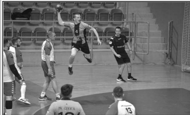
Детаљ са утакмице рукометаша Слога

Претходног викенда одигране су утакмице 15. кола Прве лиге група „Запад“ за рукометаше. Краљевачка Слога је као домаћин поражена од чачанске Младости резултатом 31-32 (14-14). Само седам дана раније, на исти начин је Слога поражена у Рашки, па се може рећи да пу-