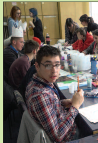
Један од циљева пројекта је

-Захваљујући пројекту „Инклузивна пракса кроз културу и традицију наших градова“ који је подржан од Европске омладинске организације, а под покровитељством Министарства науке, просвете и технолошког развоја, ЕУ и Немачке међународне организације за сарадњу, ШОСО „Иво Лола Рибар“ у прилици је да угости 10 ученика и 2 наставника из Завода да одгој и образовање особа са сметњама у психичком и тјелесном развоју