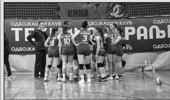
Слаба игра и заслужен пораз од Дрине-одбојкашице Техничара током предах

Одбојкашице Техничара поражене су у Краљеву од екипе Дрине из Бајине Баште резултатом 1-3 (14-25, 21-25, 25-20, 18-25) у мечу претпоследњег 21. кола Друге лиге група „Запад“.