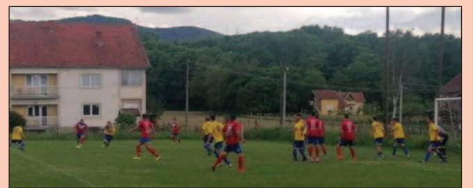
Сада Пазарци коло воде-детаљ са утакмице Округне фудбалске лиге

РЕЗУЛТАТИ 18. кола: Младост (В)-Радник 1-1, Тавник-ОФК Рас 1-2, Матаруге-Рибница 1-0, Напредак-Прогорелица 2-0, Јединство 2017-Звезда 5-2, Будућност-Омладинац 3-4,