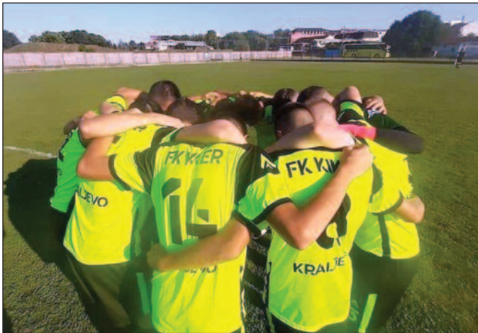
Кикерси до бода у Пожеги

Утакмицама 20. кола претходног викенда настављено је првенство Кадетске фудбалске лиге Србије. Краљевачки Кикер је у Пожеги са вршњацима домаће Слоге одиграо без голова. Сви покушаји домаћих да дођу до гола били су неуспешни захваљујући одличном вратару Кикера Дебељаковићу који је најзаслужнији што су „кикерси“ освојили бод на овом тешком гостовању.