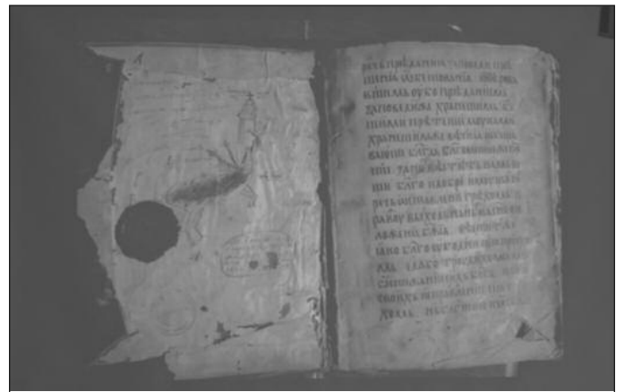
Врло је значајан рукописни фонд који се чува у Библиотеци

На развој и све чешћу до готово потпуно примену дигитализације, привikli су се и у овој библиотеци.