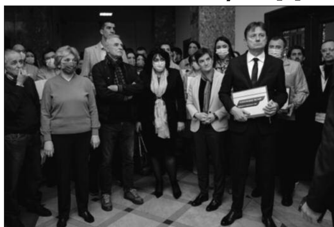
На листи СНС-а наша највећа имена у области медицине, науке, глуме