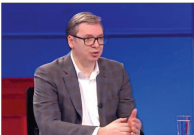
Председник Републике Србије Александар Вучић

ауто-путева и брзих саобраћајница, а онда су драстично скочиле цене сировина. По добрим ценама ћемо направити те путеве, рекао је Вучић и подсетио да ће се за мање од месец дана ићи за пола сата од центра Београда до центра Новог Сада, да је изграђен ауто-пут скоро до Пожеге, одакле ће у два смера, ка Црној Гори и ка Босни и Херцеговини.