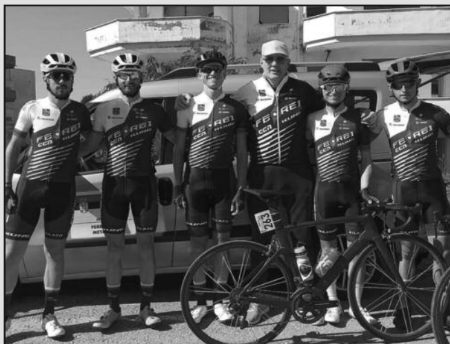
Солидан наступ у Турској-Ферен ЦЦН Металац континентал екипа

Уследило је и први наступ ФЕРЕИ ЦЦН Металца и то на УЦИ тркама