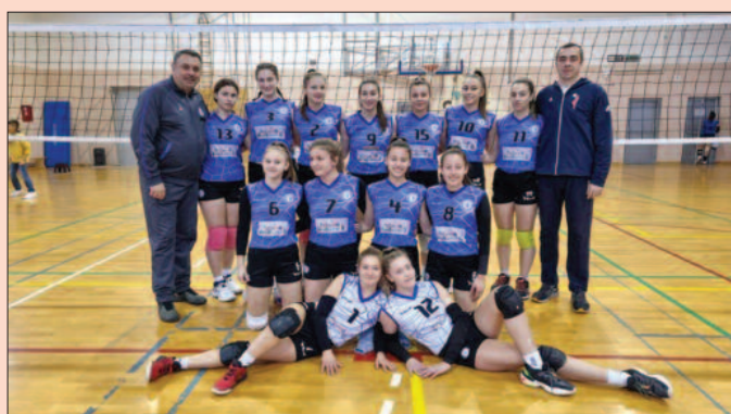
Одбојкашице Техничара наставиле победнички низ шротив гошћи из Новог Пазара

У осталим утакмицама 15. кола Друге лиге група „Запад“ постигнути су следећи резултати: Мокра Гора-Слобода С 1-3, Нови Пазар-Тара 3-0, Напредак 037-Борац 0-3, Дрина-Косовска Митровица 3-1, Рашка-Лотус 0-3 (службени резултат).