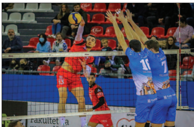
Блок Рибнице одрадио велики посао у Горњем Милановцу