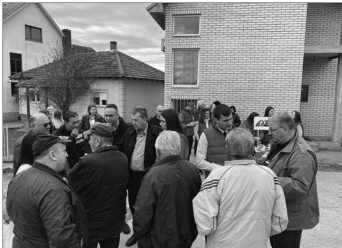
Млади представници СНС-а у разговору са мештанима Сирче

Након разговора са грађанима народни посланици обишли су