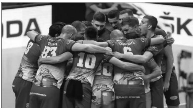
Знали да прославе успех-одбојкаши краљевачке Рибнице