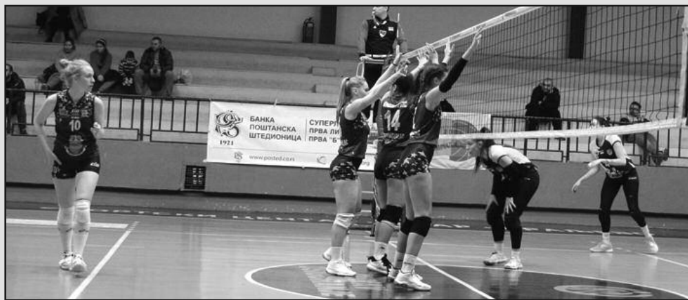
Порозан блок шармерки-детал са утакмице одбојкашица Гимназијалца

На теренима Прве „Б“ лиге за одбојкашице претходног викенда одигране су утакмице 13. кола. Гимназијалац је непријатно изненадио своје навијаче поразом од Ивањице у гостима резултатом 3-1 (22-25, 25-20, 25-19, 25-13).