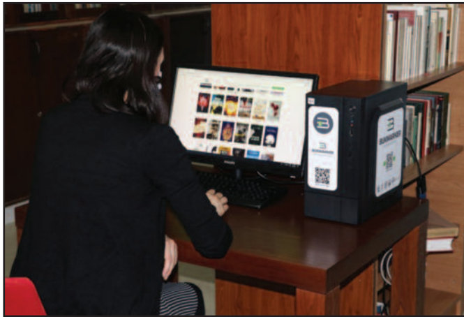
Апликација је бесплатна и намењена свим узрастима

Поносни смо што смо део јединствене визуелне заједнице у Србији која доприноси унапређењу библиотечко - информационе делатности и корисничког сервиса. Израда софтвера трајала је годину дана. Апликација је замишљена као друштвена мрежа, бесплатна је и намењена је свим узрастима. Могу јој приступити регистровани и нергистровани корисници, с тим што нергистровани корисници имају одређена ограничења. Све у свему ово је