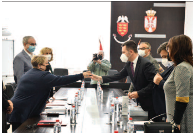
Министарка похвалила Краљево да је искористило све инвестиционе могућности

Министарка је истакла успешно пословање „Елипсе“,