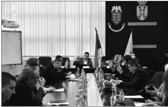
Градско веће – учинићемо све што можемо да помогнемо суграђанима

Кошаркашки клубови „Црвена звезда“ и „Партизан“ морају да плате коришћење некадашњег „Пионира“, Хале спортова на Новом Београду. Град Краљево не тражи да наши клубови то плате, али желимо да кажемо колико кошта сат коришћења и Старе и Нове хале спортова, израчунамо колико