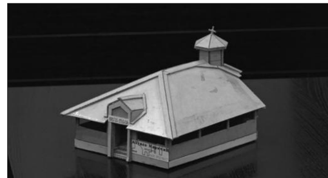
Изглед будуће војничке капеле на Чемерну