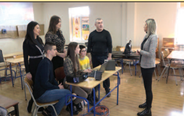
Наш репортер у разговору са члановима награђеног тима

Учесници у експедицији - Изазов 2021/2022", изабрано је седам ученичких пројеката из сфере дигиталних технологија, од којих је и тим из ОШ „Свети Сава“ из Краљева