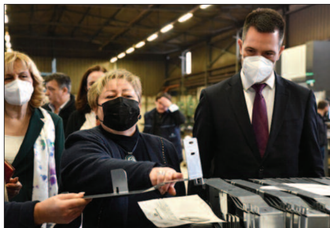
Краљевачке фирме одлично послују, али имају проблем недостатка радне снаге

која је такође породична, „женска“ фирма, а чија влас-