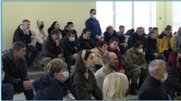
За дуално образовање заинтересовани и ученици и њихови родитељи

Машинско техничка школа нешто раније је склопила сарадњу са компанијом Еурогај, а сада и са фирмама Радијатор, Електромонтажа и Евротехна. Ученици заједно са роди-