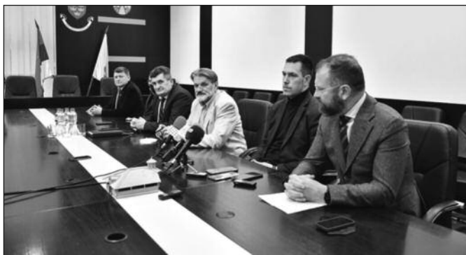
Сада је већ извесно да ће капела бити изграђена ове године