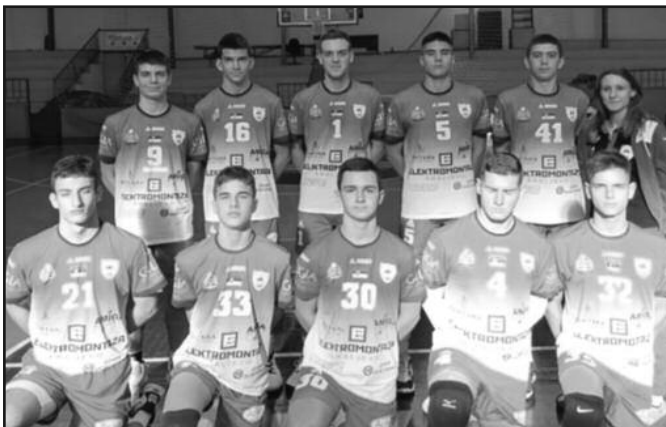
Одбојкаши Рибнице 3

Утакмицама 11. кола претходног викенда настављено је првенство Друге лиге група „Запад“ за одбојкаше. Рибница 3 је у Грачацу поражена од истоимене домаће екипе резултатом 3-0 (25-23, 25-16, 25-15). Био је ово шести пораз