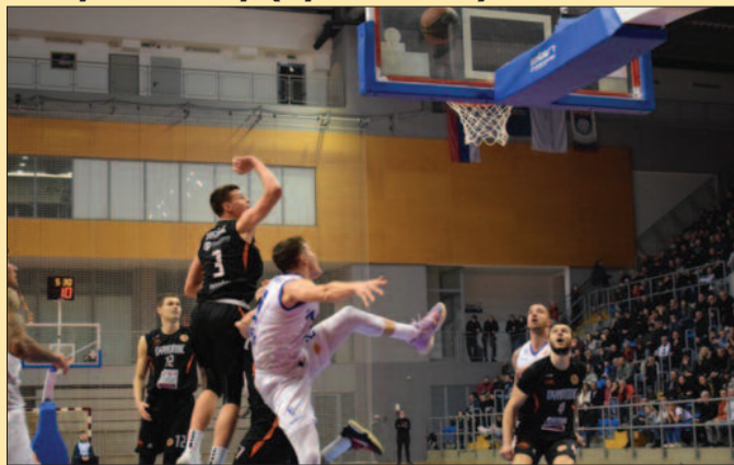
Добра посета и велика борба за нову победу-детал са утакмице Слога-Динамик