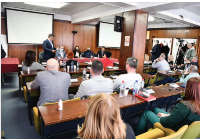
На састанку најављени програми подршке за које ће привредници моћи да конкуришу

Министарства, Фонда за развој, АОФИ-ја, и Привредне коморе Србије, обићи градове и општине у Србији и презентовати отворене позиве и програме