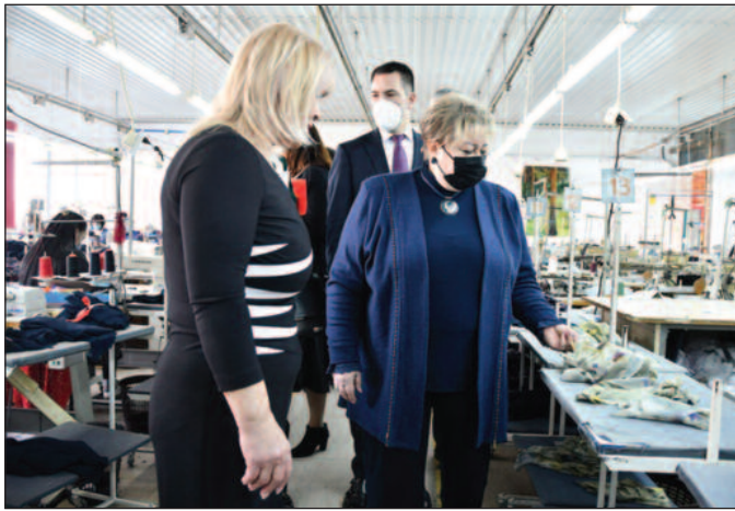
Министарство у сваком граду гледа да подржи бар једну „женску“ фирму

подршке за које ће привредници моћи да конкуришу. Како је нагласила, према извештајима, Краљево је максимално искористило могућности – инвестиције за опреме, почетнике, стартапове, а такође за жене, младе.