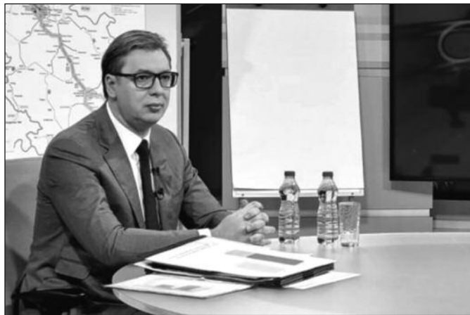
Александар Вучић, председник Републике Србије

Вучић је рекао и да је рекордна запосленост у Србији - преко 2,3 милиона запослених,