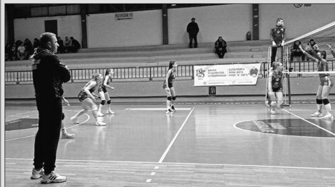
Тренер Гимназијалаца Горан Пљакић током једне утакмице Прве Б лиге