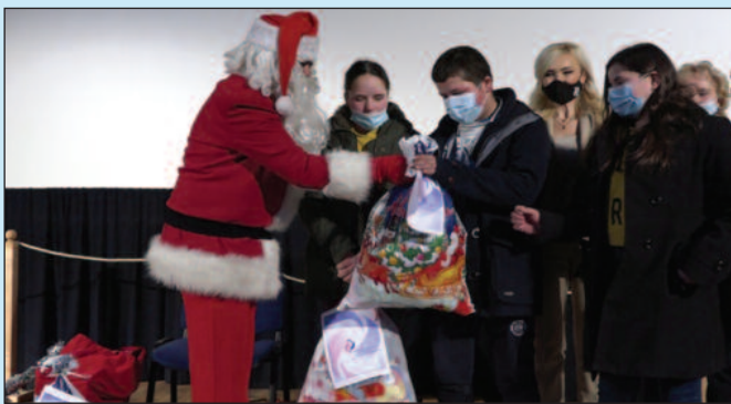
Уз пакетиће и обећање да ће овим малишанима сви помоћи колико могу

-Циљ нам је био да пружимо подршку овим нашим малим херојима, а то су деца која су у најранијем узрасту најжалост дошли у ситуацију да науче најтеже животне лекције. Приредбу за ову децу су извели ученици Основне школе „Јово Курсула“ из Краљева, а она управо има за циљ да пошаље јаку поруку о Међугенерацкој солидарности и сарадњи. То је све да би и ми и наши мали хероји наставили Савиним стопама, да наставимо да верујемо у оно што је племенито, да сви будемо што бољи људи, да помажемо