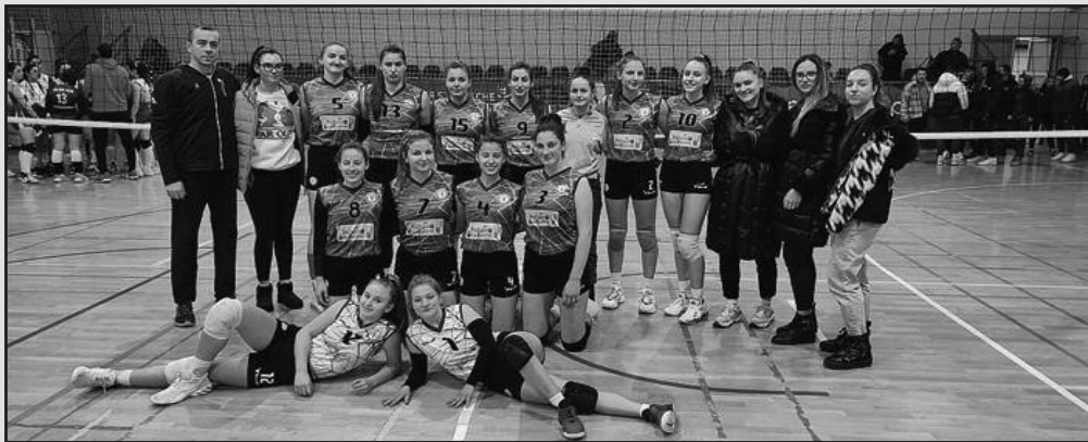
Одбојкашице Техничара после победе над Новим Пазаром

На теренима Друге лиге група „Запад“ за одбојкашице, претходног викенда, настављено је првенство редовним 12. колом. Техничар је у Краљеву победио екипу Новог Пазара резултатом 3-1 (22-25, 25-18, 25-21, 25-23). Била је ово седма победа „техничарки“ у сезони, које се са 21 бодом налазе на шестом месту на табели.