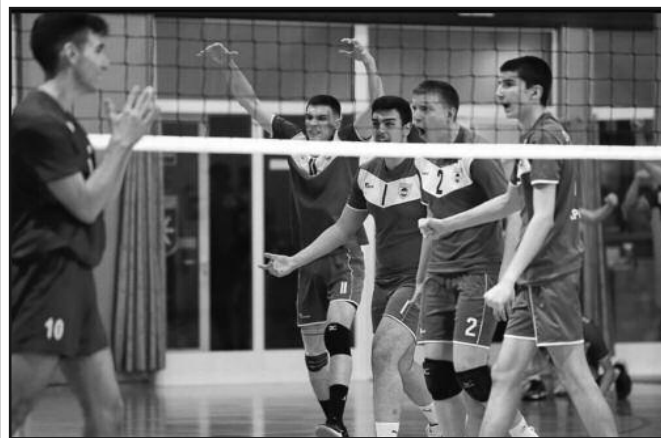
Успех донео много радости-одбојкаши Рибнице 2

Настављено је и првенство Прве „Б“ лиге за одбојкаше утакмицама 12. кола. Рибница 2 је у Краљеву победила вршачки Банат резултатом 3-0 (25-23, 25-21, 25-17). Ово је била тек друга победа младих „муске-