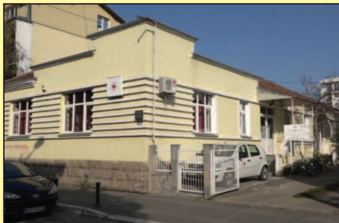
Прошле године одрађено седам стотина хиљада сати

Битно је поменути да је идеја за оснивање једне овакве организације настала још 1859. године, када се швајцарски трговац Анри Динан затекао на бојном пољу и схватио да је људски и да ипак мора да помогне свим повређеним ратницима, а не само онима на чијој је страни званично био. Временом, та идеја се развијала како код њега, тако је наилазила и на подршку других људи и 1864. године на Првој женској конвенцији је договорено да ће организација да штити и помаже рањеницима у оружаним сукобима. Кренуле су идеје и о томе да се направе и друштва националног карактера која ће функционисати како у оквиру ратних сукоба, тако и у миродопском периоду. Тако је коначно, 6. фебруара