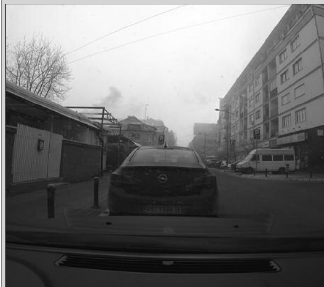
Препорука да се скрати боравак на отвореном

У периоду од двадесет чет- уобичајених активности у за- вртог до двадесет осмог творени простор док се не по-