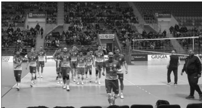
Спремни за Шумадијски дерби-одбојкаши краљевачке Рибнице

- Одиграли смо добро у Љигу. Шансу су добили играчи који