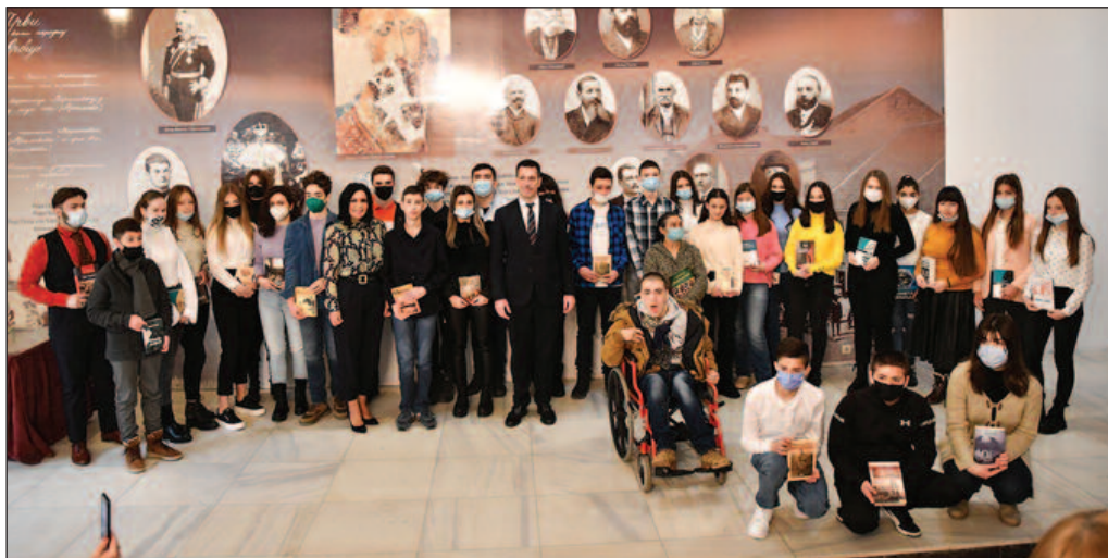
Заједнички снимак уз жељу да у наредним годинама постижу још боље резултате

Градоначелник је младим суграђанима који су током претходне школске године постигли најбоље резултате на нивоу своје школе честитао истакавши да га веома радују њихови успеси које постижу поред запажених резултата у редовним школским активностима и који им утиру пут ка новим успесима и животу окренутом правим вредностима.