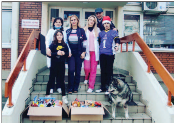
Традиционални божићни поклони за болесну децу у Дечијем диспансеру

Овакве акције доста значе и старијима у клубу, тренерима и осталим члановима, јер на тај начин унапређују и себе, али и усмеравају све младе играче и уче их правим вредностима и радости давања. И ове године су за Божић сакупили слаткише, играчке и књиге за болесну децу у Дечијем диспансеру Дома здравља Краљево. Недавно су Краљевске круне биле у Дубровнику, где су одиграли један хуманитарни турнир, дружили се, а када буде повољније време, дубровчани ће сигурно узвратити посету.