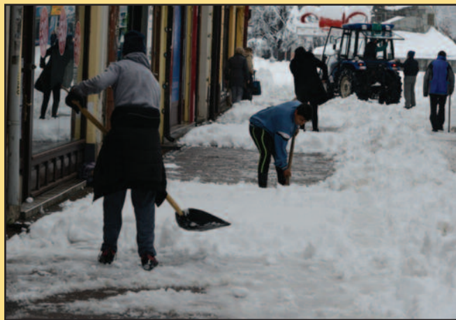
Одлично за рекреацију и за избегавање казни

• Грађани су у обавези да чисте снег и лед испред кућа, станова и пословних објеката, али и са кровова • Казне су од 10.000 до 100.000 динара