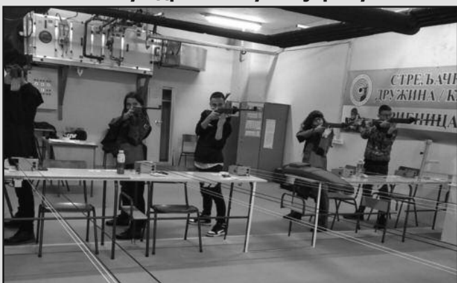
Стрелци СД Рибница у новој дворани под сводовима нове Хале спортова