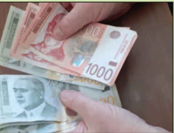
Исплата у динарској противвредности

ра кренути у исплату 100 евра на рачуне... оћ пријавили и овај новац биће исплаћен... ниша Мали, министар финансија