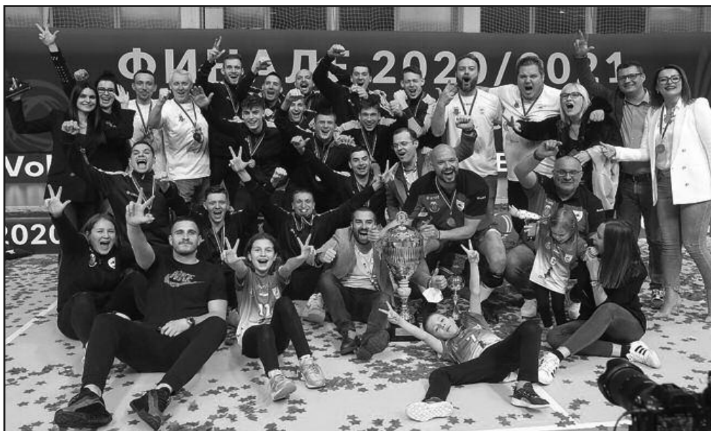
Трофеј чекан 43 године-ОК Рибница победник Купа Србије за 2021. годину

- Лига је јача него лане и врло интересантна и изједначена. Биће ту промена у другом делу првенства. Нисам задовољан пласманом и бројем бодова, имамо екипу за боље и више. Ипак, све се у шам-