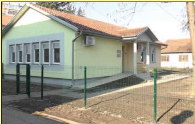
Квадратура простора одредиће број корисника

У септембру 2020. године почели су први радови на рашчишћавању просторија које су планиране за адаптацију Дневног центра за децу и омладину ометену у развоју. Мукотрпни рад, труд и одрицање, тако можемо описати целу претходну годину када је адаптација овог простора у питању. Пре месец дана на Међународни дан особа са инвалидитетом ове просторије су отворене у присуству министарке за рад, запошљавање, борачка и социјална питања, као и директорке Националне организације особа са инвалидитетом. На задовољство удружења „Аутизам“ Краљево овај дневни центар ће једног дана бити Дневни боравак. Министарство за рад, борачка и социјална питања је за ове намене издвојило нешто мало мање од пет милиона динара али су, истакла је министарка, имали велику подршку локалне самоуправе. Врата овог дневног центра отворена су за све, али се нажалост не зна се тачан број деце са посебним потребама у нашем граду.