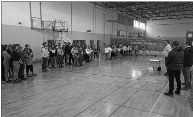
Прослава Божића и рођендана клуба како доликује-деталј са прославе у сали ОШ Браћа Вилотијевић