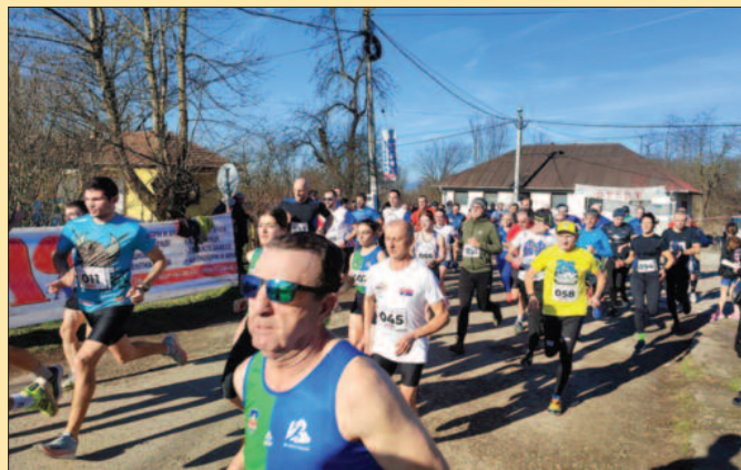
Српски Сао Паоло-детал са 52. трке у Мрсаћу

начин. Надам се да је ово најва мојих добрих наступа и резултата у 2022. години – видно задовољан је