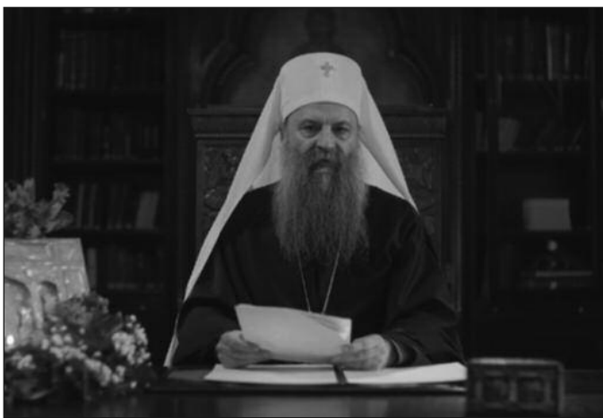
Његова Светост Патријарх српски г.Порфирије

...У празничној радости Божијног дана, са нарочитом па-