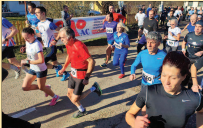
У Мрсаћу другог дана јануара трчало и старо и младо

–Свим грађанима и љубитељима атлетике упућујем новогодишњу честитку. Много сам срећна, ово ми је осма година као долазим у Мрсаћ и