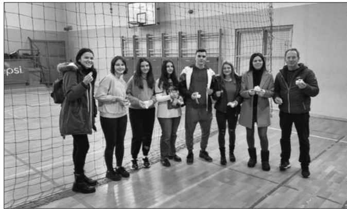
Извукли пару из чеснице на клупској прослави рођендана

40 дечака узраста од првог до седмог разреда који вредно тренирају. Можда наредне године поново будемо играли неко такмичење и са дечама, али ове сезоне смо били принуђени на неке потезе. Најмање смо заслужили тако