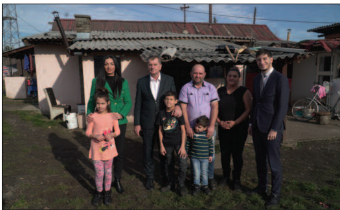
На делу показали да воде рачуна о угроженим породицама

-Ово није прва акција и ово није једина породица коју ћемо данас обићи. У плану нам је да обиђемо још двадесет породица које су из категорије социјално угрожених. И не само да их обиђемо и однесемо пакете са основним животним намирницама, већ и да разговарамо са њима, да слушамо њихове потребе и про-