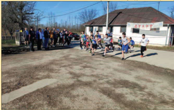
Најмлађи учесници трке у Мрсаћу