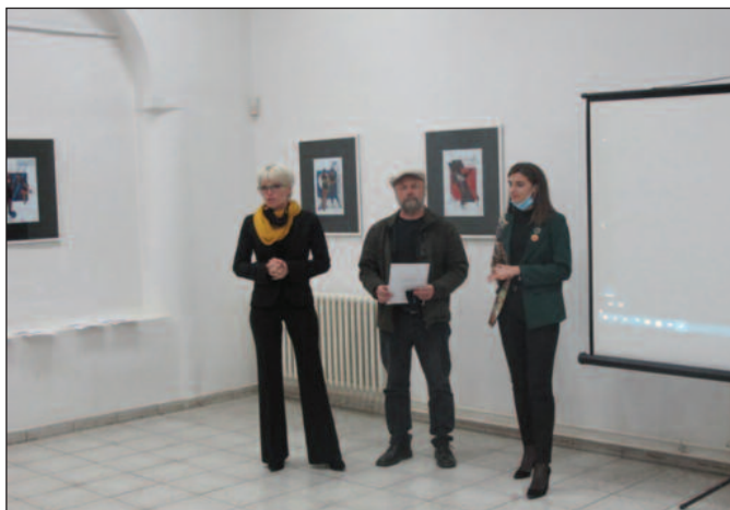
Свечано отварање изложбе „Ја сам сама себи муза“

Изложба ће бити отворена до 23. новембра ове године.