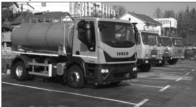
„Водовод“ улаже напоре да што спремније дочека летњу сезону