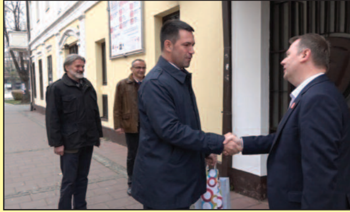
Градоначелник са сарадницима честитао празник директору Позоришта

-Није увек неопходно обезбедити новац. Некада је сасвим довољно пронаћи начин како да се помогне људима који воле културу и воле позориште. Верујте, да није љубави, ова установа никада не би овако изгледала. Мени је драго што има младих глумаца, младих људи који желе да се баве овим послом. Надам се да ћемо у наредној години успети да добијемо сагласност за запошљавање оних људи који већ годинама раде у позо-