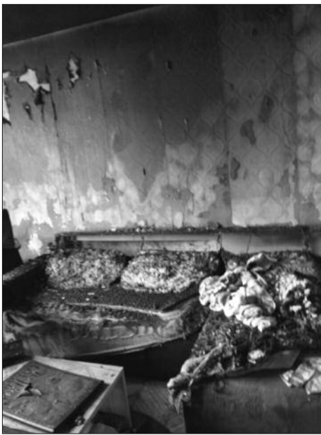
У пожару изгорео сав намештај

захвални. Рекла нам је да можемо остати све док нашу кућу не сре-