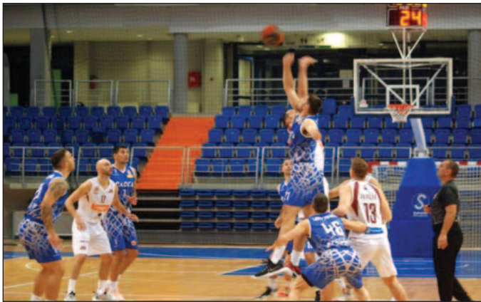
Одлично издање у Вршцу-детал са утакмице Вршац-Слога

мојловић 9 пута погодили тројку из 19 покушаја.