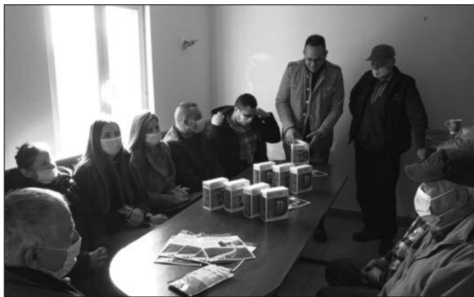
Омладина СНС-а није заборавила пензионере који живе на селу