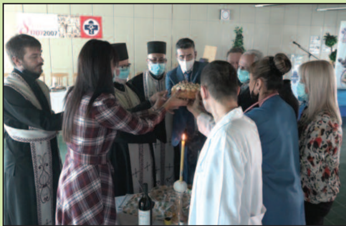
Због короне слава обележена само сечењем славског колача

Наредне године домаћин славе биће Служба кућног лечења Дома здравља Краљево, којој је ковид 19, као и свим осталим здравственим радницима, отежао редован посао, а то је лечење најтежих пацијената у терминал-