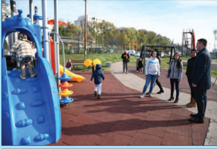
Предшколци из вртића одушевљени новим справама

лице, љуљашке и тобоган, њихови осмеси су најбоље показали колико су се обрадовали