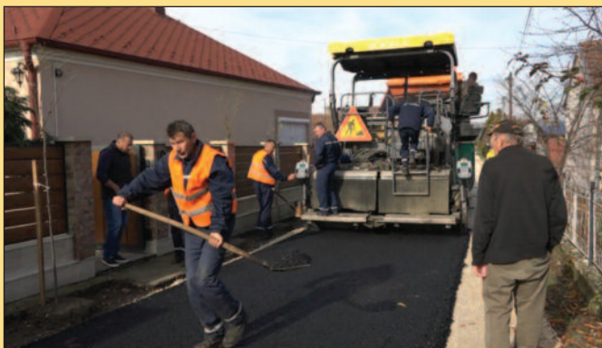
Захваљујући иницијативи напредњака „заборављена“ улица добила асфалт

-Хвала богу да је једном дошло до тога, да дођу и асфалтирају. Десет година како је урађен пројекат и нико од претходних власти није ни по-