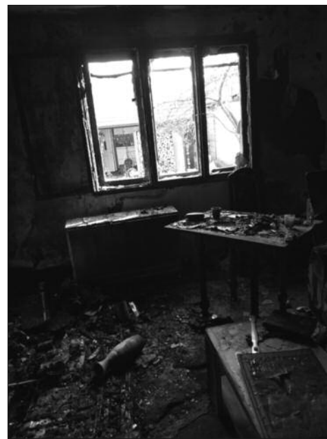
Дневна соба комплетно уништена

димо и нама то пуно значи, јер је деца близу школа и вртић. Дечја