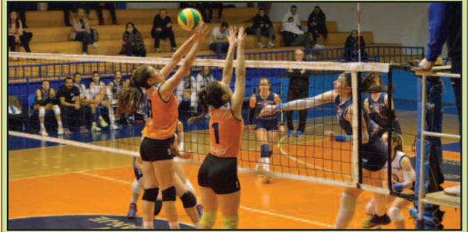
Порозан блок Техничарки-детаљ са утакмице Техничар-Слобода С