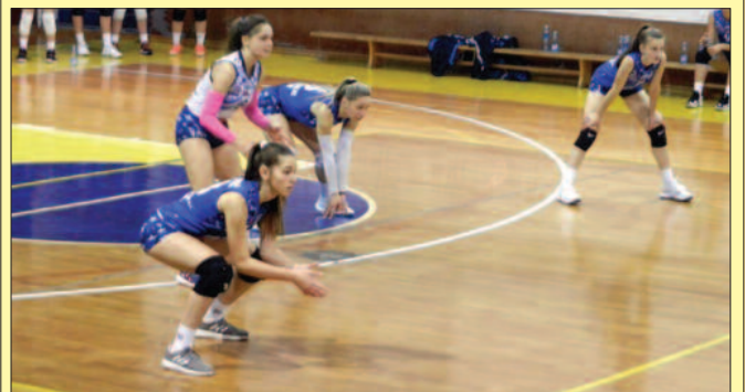
Чекајући сервис-одбојкашице Гимназијалца током меча са Стеријом