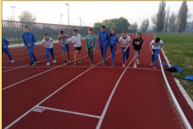
Учесници трке на 1000 метара