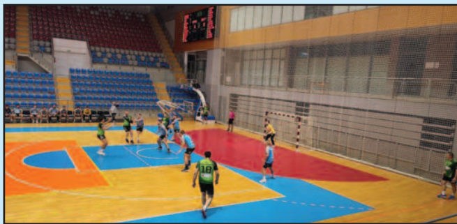
Детаљ са једне утакмице рукометаша Металца