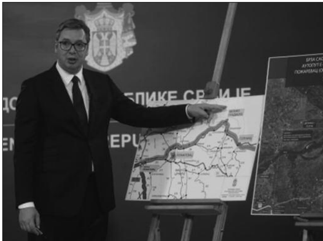
Александар Вучић-немерљив допринос изградњи Краљево и Србије