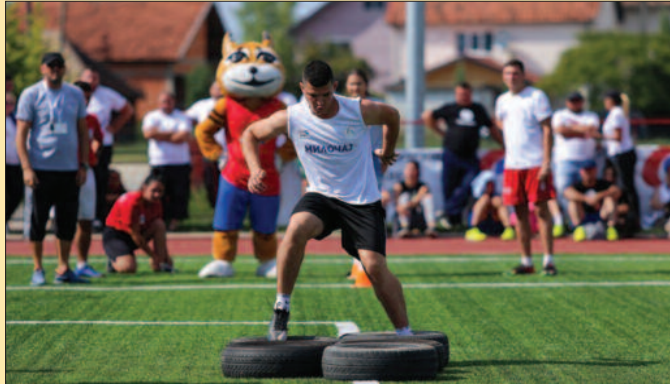
Захтеван наступ на полигону

Након пет месеци такмичења, најпре у 24 општине, а затим и на Регионалном нивоу, осам најбољих екипа из целе Србије одмериле су снаге на Републичком Финалу у десет дисциплина. Град домаћин био је Уба, а само отварање такмичења организовано је на стадиону "Жозе Мурињо" на "Школарицу". Краљево је представљало село Милочај које већ трећу годину учествује на завршној смотри и увек је пласирано у самом врху. Тако је било и овога пута, када су сабрани резултати после два дана такмичења, победник Сеоских