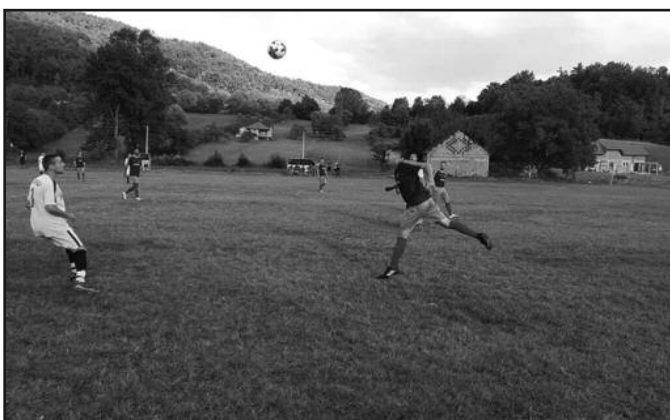
Сигуран старт Мораве из Мрсаћа-детал са утакмице у Годачици

(М)-Милаковац 2018 (субота), Стубал-Младост 1981, Слога (О)-Згодичица, Морава (С)-Младост 1925.