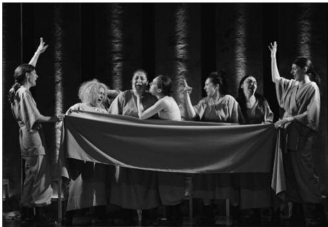
Детаљ из представе „Трпеле“