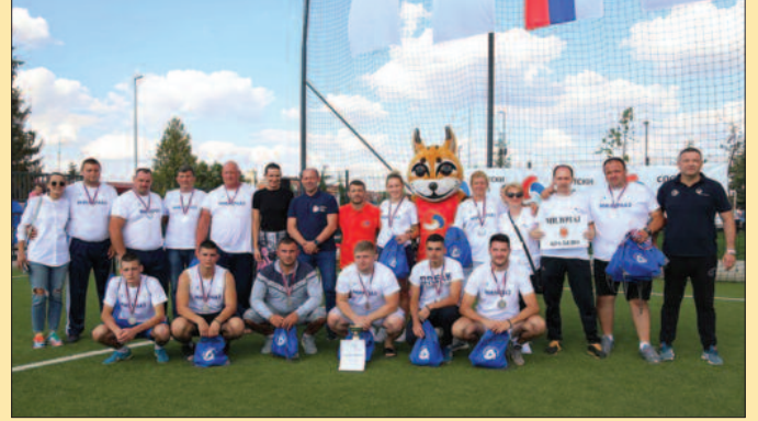
Село Милочај другопласирано у Србији