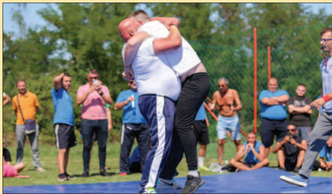
Милочај има свог адута у рвању

Морам да похвалим организатора, Спортски савез Србије, љубазне домаћине из Уба, као и све учеснике, јер су дали пун допринос да ова дивна манифестација постане традиционална и да буде једна од престижних у Србији. Село Милочај је показало да је најбоље на територији града