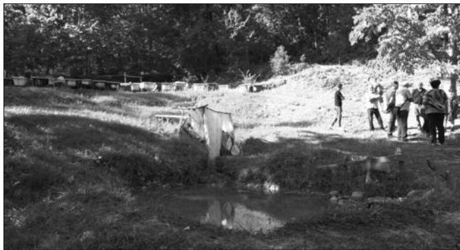
Потенцијални инвеститори неће годинама чекати на сагласност да би се изградио мост

-У више наврата сам говорила о томе да имамо 23 моста које је држава одобрила, два моста су урађена док два моста неће моћи да се ураде, један из техничких разлога зато што има клизишта, други је на Магличу где нису решени други неки проблеми. Девет мостова се ради, али имамо нажалост осам који нису ни почели да се раде, а из разлога што мештани нису дали сагласност, тако да без обзира што је држава исфинансирала пројектно-техничку документацију и што је ЈП за уређивање грађевинског земљишта исходвала локацијске услове, ми не можемо да исходимо грађевинске дозволе без њихове сагласности. Нама је циљ да идемо од моста до моста, од локације до локације, да пронађемо људе који треба да дају своју сагласност, да им објаснимо колики је значај моста. У противном имаћемо проблеме. Прво ће