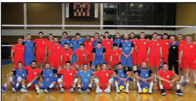
Одлична провера-заједнички снимак одбојкаша Војводине и Рибнице

Још једна у низу провера са нашим спортским пријатељима. Играла смо добро и што је најважније показало се да је конкуренција све јача. Из те конкуренције очекујемо квалитет, већи него смо га имали