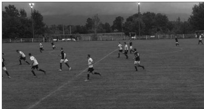
Одлични наступи гостију у Округној лиги

У среду су одигране утакмице ванредног 4. кола Округне фудбалске лиге. Лидер из Конарева је декласирао дојучерашњег зонаша из Печенога и потврдио аспирације за највиши пласман. „Малинари“ настављају победнички низ, у Врдилима је пала Рибница из Јовца. „Дуњари“ из Тавника су победили и другог лигаша из Новог Пазара, у само четири дана, и пробали се на трећу позицију. Комшијски дерби у Матаругама завршен је без побед-