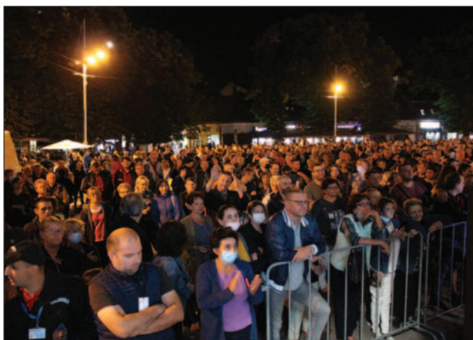
Краљевчани се ужелели оваквих коцерата

Пројекат је суфинансиран из буџета Града Краљева: Ставови изнети у подржаном медијском пројекту нућно не изражавају ставове органа који је доделио средства