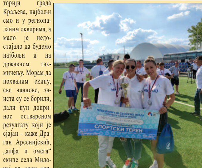
Даме су дале пун допринос успеху Милочаја

шине Прибој је победило прошле године и они су већ тада добили рукометни терен, то је главна награда ССС. Ове године, ми смо били другопласирани и награда је припала нама. ССС ће нам донирати рукометни терен, ми ћемо одабрати локацију у слу где желимо да се то