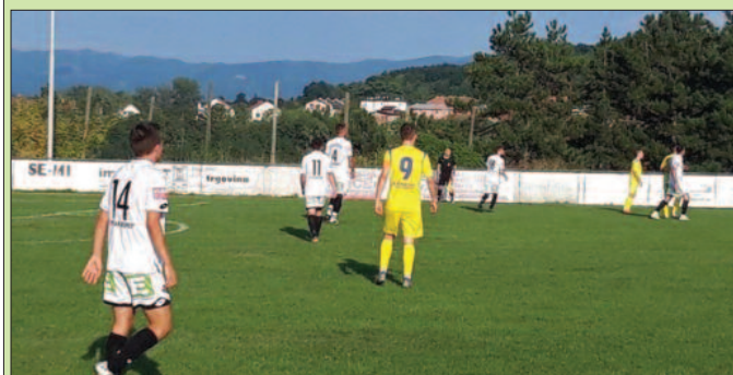
Детаљ са утакмице Карађорђе-Јошаница

На теренима Шумадијско-Рашке фудбалске зоне претходног викенда одигране су утакмице 3. кола. Тутин је победом у Рашки остао једина екипа са максималним učinkом му такмичењу. Убудљивим тријумфом против гостију из Грбице, Гружа је стигла на домак трона. Као пратилац лидеру, после овог кола, је и Полет из Ратине који је славио у Врњцима против Гоча. У једном од дербија кола, „шумадинци“ су на Бубњу победили госте из Зубиног Потока. У другом дербију кола Јошаница је славила на Буњачком брду и то на премијери Карађорђа пред својим навијачима. У Грошници је домаћин