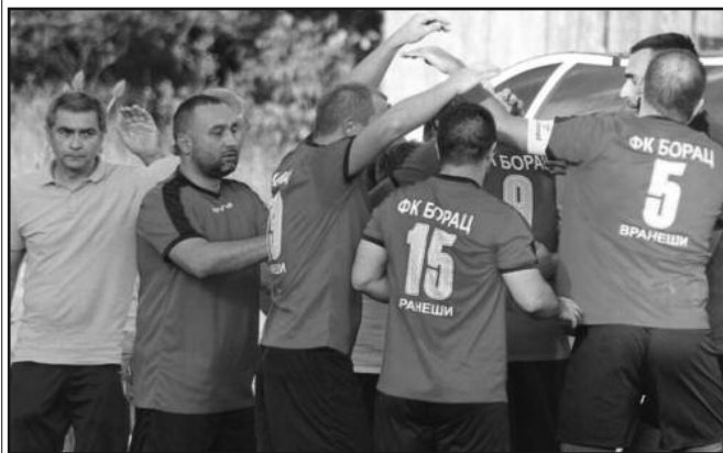
Радост фудбалера Борца из Вранеша после победе у дербију кола

На теренима МФЛ Краљево претходног викенда одигране су утакмице 3. кола. Лидер из Метикоша је фуриозно прошао кроз Лађевце и само потврдио да би ово могла бити сезона Младих крила. У Вранешима је требало да буде дерби, али су Милочајци послали екипу на сеоске спортске игре у Уб и од Борца „лопили“ седам комада. Ревија од осам голова виђена је у Јошаничкој Бањи где су плен поделили домаћин и „хајдуци“ из Јарчујака. Лигаш из Витановца је славио у Врџицима, док је узбудљив меч у Драгосињцима завршен победом домаћина. Није било победника у мечу одиграном у Годачици, док је комшијски дерби на Рудну, где су гостовали „вitezови“, завршен убедљивом победом до-