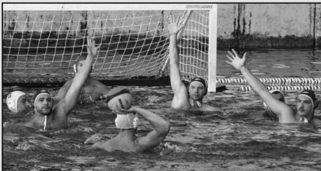
Детаљ са једне утакмице ватерполиста Краљева

у Краљеву. У суботу нам гостује Пожаревац, у недељу Бањчани и то су прилике за прве победе у такмичењу. Ми смо у сезону ушли са младим тимом, то су деца поникла у нашој школи пливања, али нисмо без шанси да победимо у мечевима који следе. Лично се надам да ћемо пред нашим навијачима бити конкурентни и против Кошутњака када буде гостовао крај Ибра.