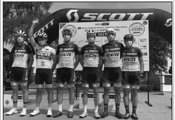
Бициклисти Металац на трци у Краљу