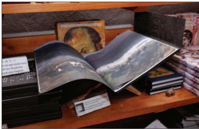
настављена дугогодишња сарадња са Жичом и Студеницом

О филму: Лаки Прескот заправо никада није упознала своју покојну мајку Милагро Наваро, неустрашиву каскадерку из малог града Мирадеро, који се налази близу отворене границе. Попут своје мајке, Лаки није баш љубитељ правила и ограничења, што је код њене тетке Коре изазвало доста