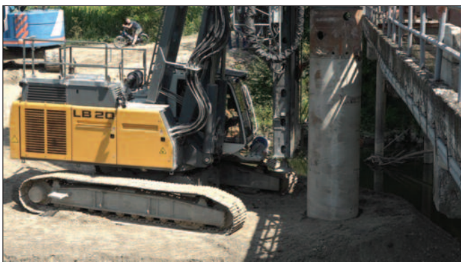
Машина у рекордном року поставила нови шип

-Чекало се препројектовање овог шипа који је пукао и морало је да се кроз техничку документацију уради прорачун и све друго што је потребно. Онда смо имали и проблем транспорта машине, јер она захтева специјални транспорт, а и била је ангажована на мостовима у Мрсаћу и у Милочају. А онда смо и тамо имали проблеме јер је требала да се измести бандера ЕПС-а, практично да се измести далековод и онда смо дошли у такав круг да не можемо машину да повучемо. Она је чекала радове на поменути мостовима, али смо ипак постигли договор да машина прво дође овде и