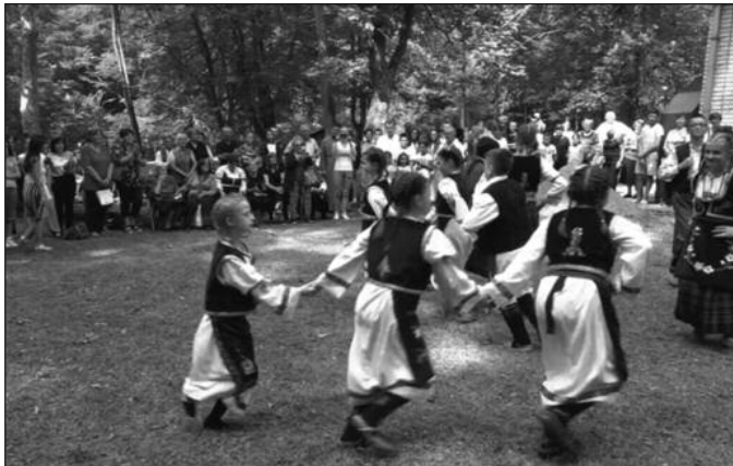
Најмлађи фолклорци награђени најдужим аплаузом

-Овај празник је познат у целом православном свету, а нарочито код нас Срба. Празнује се са великим поштовањем, јер је Свети Гаврило благовесник Божји који даје и носи велике тајне Божје. Честитамо свим парохијанима овога краја храмовну славу Светог архангела Гаврила, такође честитамо и желимо свима онима који су дошли да увеличају овај дан дуг живот, срећу и благо-