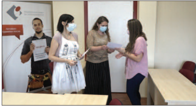
Са овим сертификатом лакше до запослења

- Ја сам 15 година радила на састављању завршних рачуна у "Првој петолетки", док није отишла у стечај, а радила сам и на замени као порески инспектор принудне наплате и као буџетски инспектор у општини, али сам се мало удаљила од свега тога, мада ми ова обука уопште није била тешка. Дајем испите за овлашћеног рачуновођу и хоћу да отворим своју агенцију,