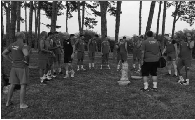
Одбојкаши Рибнице почели припреме за нову сезону