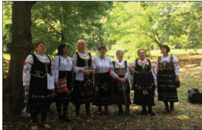
Женска певачка група са успехом наступа на фестивалима

брига. Лаки је одрасла у граду на источној обали под Кориним будним оком, али када Лаки претера са искушавањем среће кроз превише ризичних вратоломија, Кора их обе сели код Лакиног оца Цима, у Мирадеро. Лаки је дефинитивно импресионирана поспаним градићем. Њен живот се мења када упозна Спирита, дивљег мустанга који дели њену страст за независношћу, и када се спријатељи са две локалне јахачице, Абигејл Стоун и Пру Грејнцер. Пруин отац, власник стаје Ал Грејнцер, најбољи је пријатељ Лакиног оца. Када безосећајни каубој и његов тим желе да ухвате Спирита и његово стадо и осуде их на тежак рад у заточеништву, Лаки окупља своје нове пријатељице и креће у авантуру како би спасле коња који јој је дао слободу и сврху, и помогао Лаки да открије везу са мајчиним и мексичким наслеђем које није очекивала.