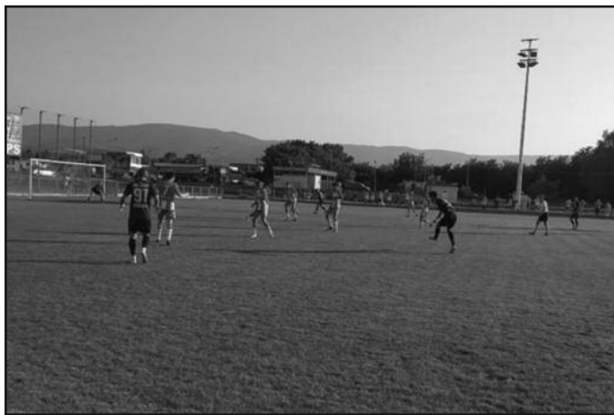
Детаљ са утакмице Слоге и омладинца Црвене звезде