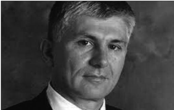
др Зоран Ђинђић

Ђинђић је био један од 13 интелектуалаца који су обновили рад предратне Југословенске Демократске странке, оснивајући модерну Демократску странку 1989. године чији је председник постао 1994. године. Током 1990-их био је један од лидера опозиције режиму