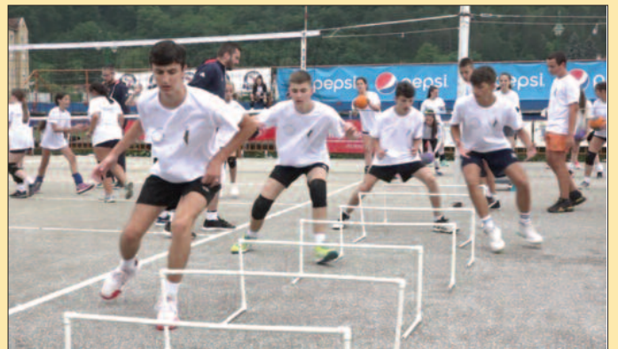
И ове године на кампу мали број дечака

-Овај камп је осмишљен као окупљање и мале деце, а зна-