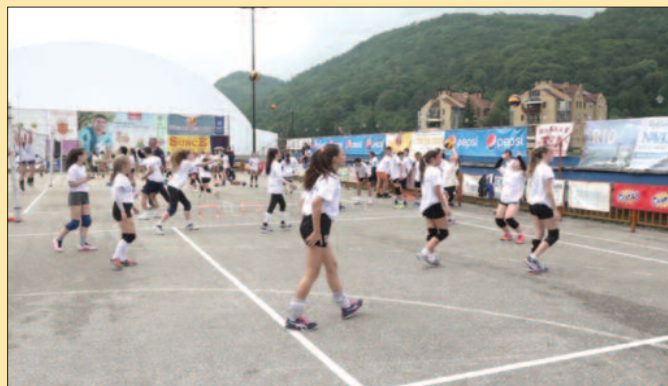
Камп је користан за младе јер се спортски дисциплинују

понеко дете које оствари запажене резултате, а талената има доста. У разговору са полазницима сазнали смо да им заиста понекад мало теже падају напорни тренинзи, али врло радо све спроводе у дело. Доста деце ове године се појавило први пут и сви су сагласни да ће се вратити и наредних година. Највише ће памтити дружења, али и оно што су научили током претходних недеља дана у Гучи. Иако су ове године радили само у једној смени, камп је одржао своју традицију, а многа перспективна деца стекла су искуство више и надоградила своје одбојкашко знање. Одржавање кампа свих ових година свакако не би било могуће без помоћи великог броја пријатеља Одбојкашког клуба „Техничар“ и спонзора који су одавно препознали да један овакав спортски камп је управо оно што је потребно деци да се развијају и напредују на прави начин.