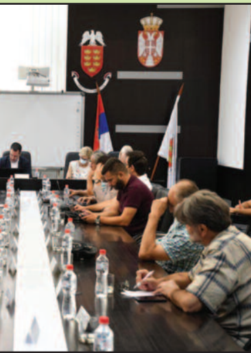
ва за пројекте верских заједница

бијени су пројекти цркве у Годачици и Конареву због непоштовања процедуре. Градоначелник Краљева рекао је да ће Град и у наредној години издвојити новац за верске заједнице и напоменуо да се тренутно граде две потпуно нове цркве у Адранима и Ушћу. Средства у висини од 500.000 динара одређена су и за католичку цркву у Краљево.