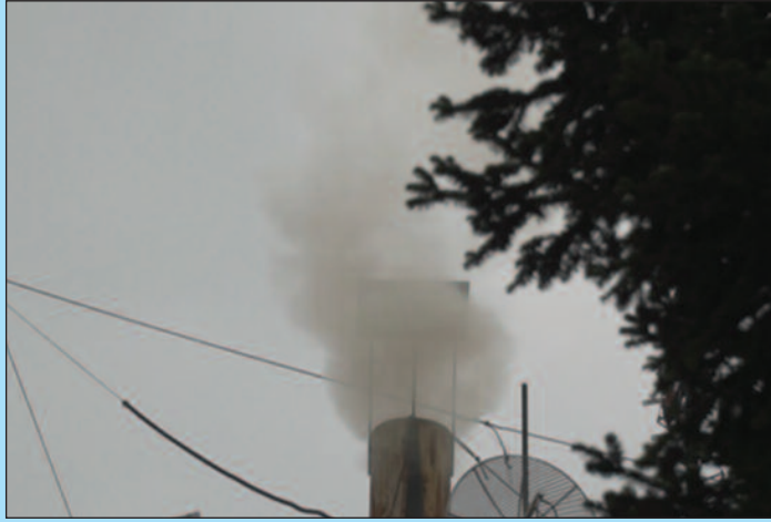
Замена котлова би знатно смањила загађеност ваздуха

-Евидентно је да ми имамо проблем са загађењем ваздуха у току грејне сезоне. Доминантан загађивач су суспендоване честице ПМ10 и ПМ2,5. Да ли смо по томе први или шести у Србији, по мом мишљењу није толико битно већ је битно да смо ми констатовали да имамо проблем. Сада је битно да нађемо решење. Ми смо у 2020. години имали 107 дана са прекорачењем за суспендоване че-