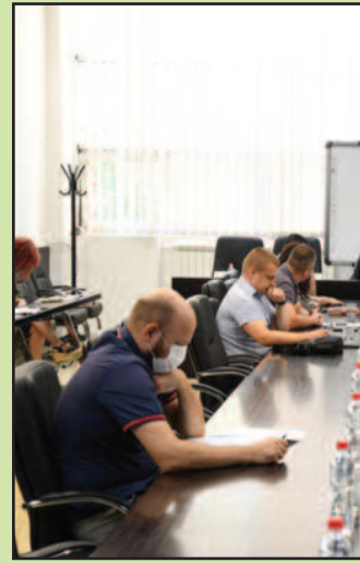
Први пут издвојена средства

Градски већници једногласно су дали сагласност на одлуку Надзорног одбора ЈП „Градско стамбено“ који је