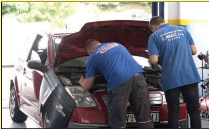
За технички преглед сада је потребно duplo више времена

-За сада сви могу проћи технички, до 2023.године. Дали су услов да свако ко је или скинуо ДП филтер или катализатор мора до 2023.године да врати на свој ауто. Најчешћи недостатак због којег не