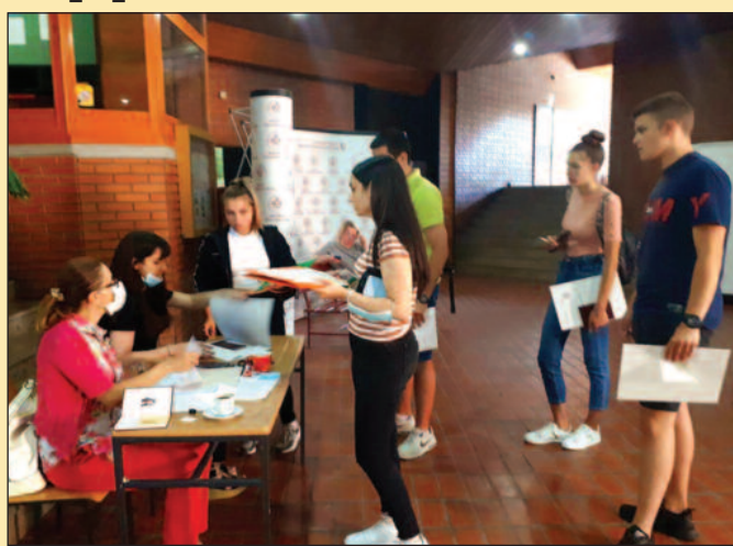
Још има слободних места која се финансирају из буџета

Према ранијим најавама, до другог уписног рока очекује се и акредитација новог трогодишњег студијског програма Одевно инжењерство и дизајн који поред класичног начина студи-