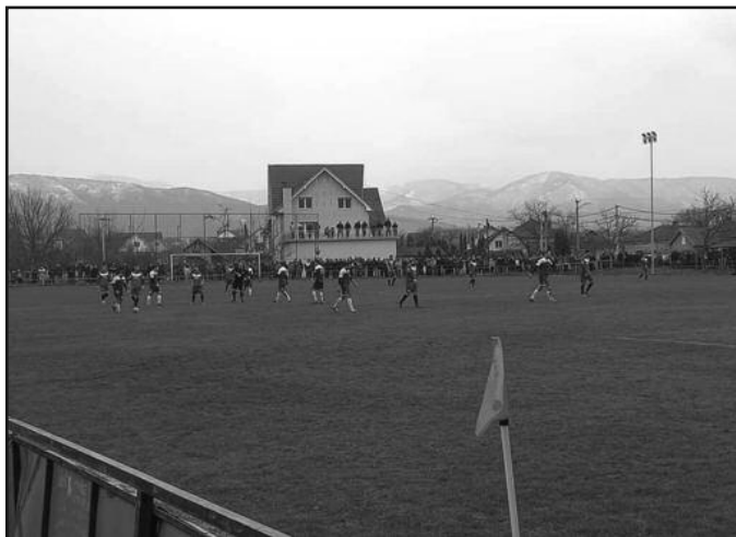
Ко мари за корону кад је дерби-амбијент током меча Карађорђе-Будућност