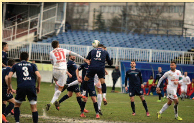
Гужва у шеснаестерцу чачанског борца