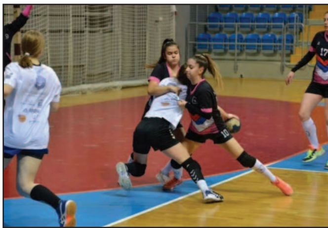
Детал са утакмице рукометашица Металац

Дворана основне школе у Прелици Без гледалаца Судје: Јанићијевић (Крагујевац), Ђорђевић (Јагодина) Искључења: Кошутњак