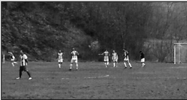
Детал са утакмице у Годачици

ПАРОВИ 17. кола: Стубал-Млада Крила (субота), Милочајац-Минерал 2015 (недеља 11ч),