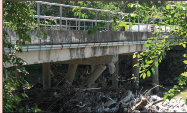
Оштећени и поломљени носећи стубови

падне Мораве који је јако висок. Чим водостај дозволи почеће се са радовима на реконструкцији овог моста, међутим постоји опасност да висок водостај додатно оштети мост због чега је битно да што пре почнемо са радовима, бар за почетак на заштити моста, а онда на његовој реконструкцији. То ћемо наредних дана договорити са извођачем радова, додао је директор Јавног пред-