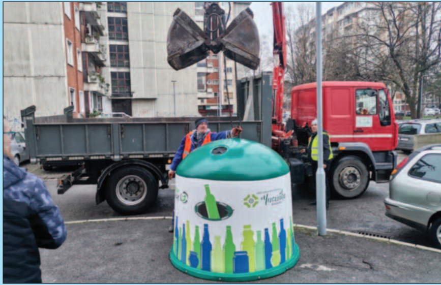
У ове контејнере се искључиво одлажу стаклене флаше и тегле

У ове наменске контејнере искључиво се одлаже стаклени амбалажни отпад.