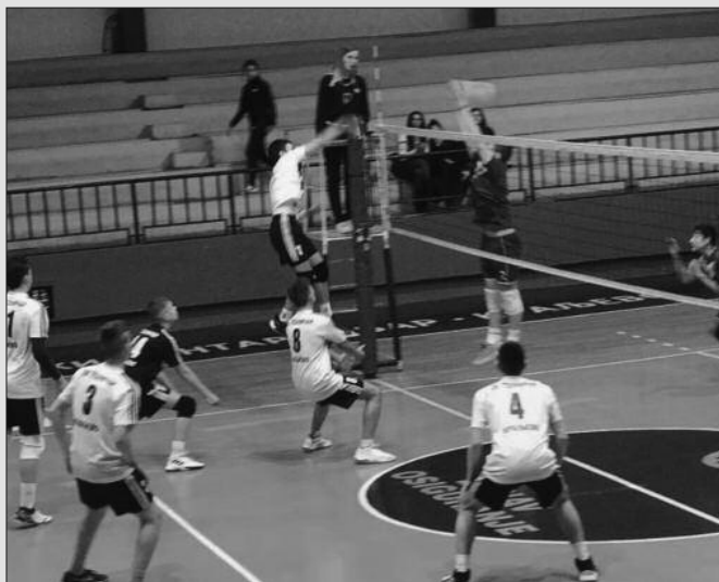
Добар градски дерби и тесна победа Рибнице 2-детал са утакмице

Градски дерби Техничар-Рибница 2 обележио је 16. коло Друге лиге група „Запад“ које је на програму било претходног викенда. После више од два сата одбојке и добре игре, меч је завршен победом Рибнице 2 резултатом 2-3 (25-19, 24-26, 25-19, 25-27, 7-15).