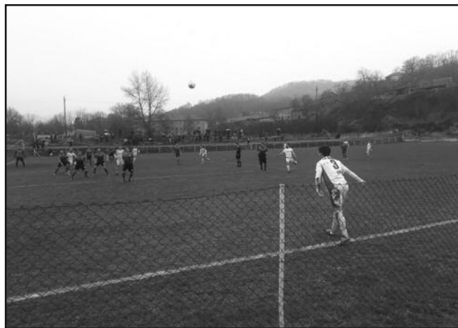
Без голова у Баљевцу-детал са утакмице Радник-Пролетер

На теренима Шумадијско-Рашке фудбалске зоне претходног викенда одигране су утакмице 17. кола. Гости су славили у четири меча и у овом колу били врло убедљиви. Лидер из Подунавца је славио на тешком гостовању у Новом Селу показао да ће бити једнако неугодан и ван Ратине, док је Мокра Гора славила у неизвесном мечу у Новом Пазару. У Топоници ретко када славе гости, то је на својој кожи осетио и Гоч, док је буран дуел виђен у Корићанима, седам голова и тесна победа домаћина. Једина утакмица без го-