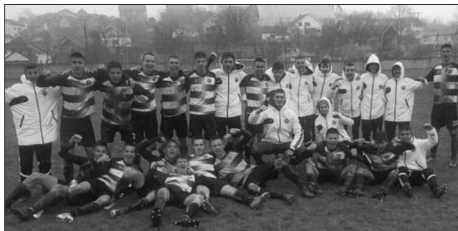
Кадети Кикера после победе над Лучанцима