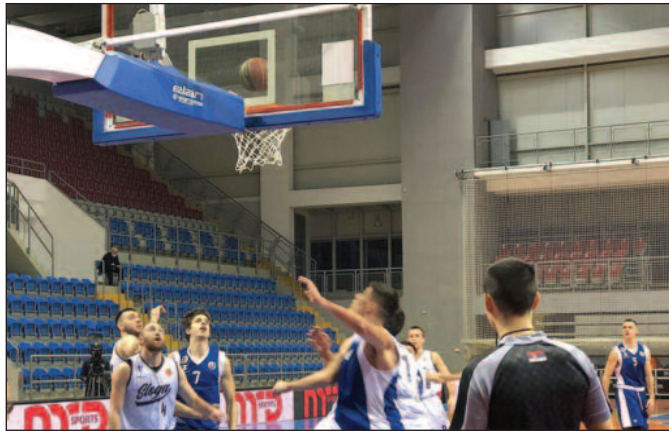
Бурна завршница КЛС-детал са утакмице у Краљеву