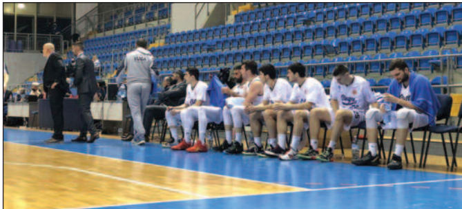
Пораз у завршници-кошаркаши Слоге на мечу са Земунцима

- Очекивали смо наравно тешку утакмицу, знајући који противник нам долази. Али, водити у једном тренутку 17 поена разлике је, како ја сматрам подвиг, али подвиг који не траје дуго. Још једном се потврдило да ниједна утакмица није добијена пре истека 40 минута. Мислим да оно од чега живимо, од тога и гинемо. У овом тренутку, Слога живи од полетне игре, позитивне енергије, добре атмосфере која влада међу нама последњих неколико кола. Свесни смо тога, да у неким моментима треба мало стати, успорити и одиграти на лопту. Ми то у овом мечу нисмо урадили, сигуран сам да смо приликом вођства од 17 поена разлике требали успорити и привести