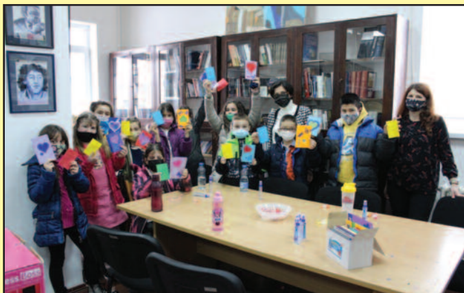
Ученици награђени за успешан први читалачки поход

- Изазов за сваког просветог радника у данашње време је да дете приволи да чита књигу и да време проведе уз нешто што нису видео - игрице и телевизија. Тако је мени пало на памет да позovem децу да на распусту прочитају „Хајди“, интересантан и авантуристички роман за децу, пошто смо на часу читали само одломак из тог романа. Обећала сам да ћу им у том случају приредити неко изненађење. Нисам занста очекивала да ће толики