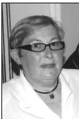
Љубица 2011 – 2021.