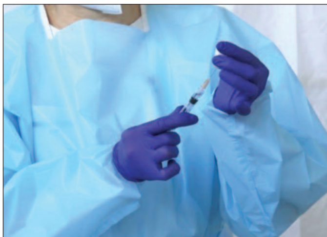
У Ушћу испуњени сви услови за безбедно вакцинисање грађана