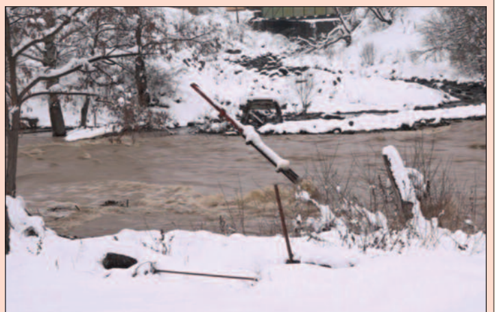
До краја године овде ће нићи нов пешачки мост

-У априлу прошле године Туристичка организација Краљево доставила нам је пројекат који смо проследили Канцеларији за управљање јавним улагањима. Пројекат је прошао две ревизије и пројекат