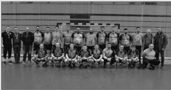
Рукометаше тренери и руководство РК Металац Краљево