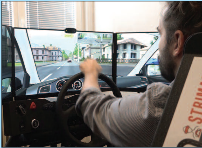
Симулатор ће користити и полазници у ауто школама