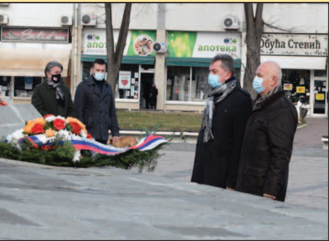
Венце положили представници Рашког округа и Града Краљево

ним Америчким Државама у још увек постојали робови. Нажалост, такав Сретењски устав био је у примени само око 50 дана, зато што су тада највеће европске силе, Аустрија, царска Русија и Турска