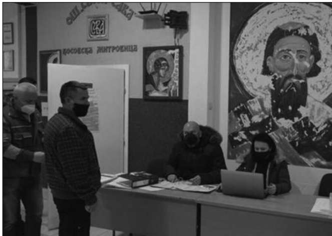
Гласање показало да Српска листа има велико поверење код народа

Директор Канцеларије за Косово и Метохију Владе Републике Србије Петар Петковић изјавио је да је победа Српске листе на ванредним парламентарним изборима на Космету гарант опстанка Срба и државе Србије на територији јужне српске покрајине. Како је нагласио Срби на Космету послушали су председника Републике Александра Вучића да гласају за Српску листу, што је допринело још једној историјској и убедљивој победи те политичке опције, која је освојила свих 10