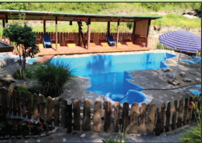
Етно кућа „Оаза мира“ у Лопатници

атне ваучере за одмор у нашој земљи, које је постоје, а како сазнајемо из Туристичке организације све је веће интересовање за ваучерима