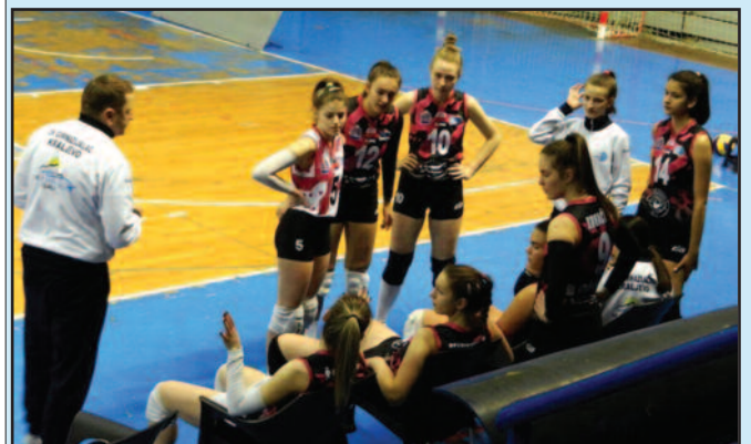
Серија поразу приковала Гимназијалац за последње место на табели

У такмичењу Прве „Б“ лиге за одбојкашице протеклог викенда одигране су утакмице 17. кола. Гимназијалац је у Краљеву поражен од Златибора из Чајетине резултатом 3-0 (25-8, 25-17, 25-22) и наставио нагатаван низ којим је своју позицију у борби за опстанак учинио још тежом. У међувремену, одигране су утакмице ванредног 18. кола Прве „Б“ лиге, а