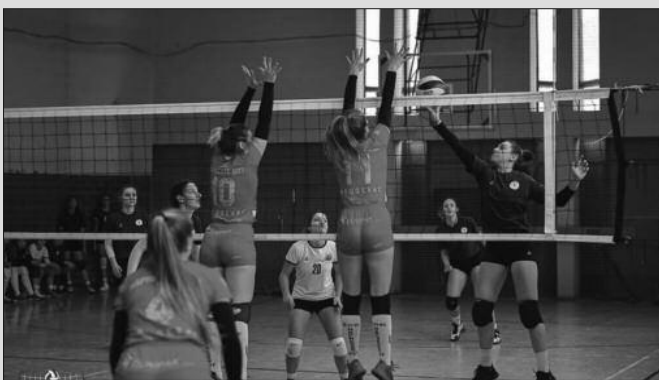
Вредна победа после велике борбе-детал са утакмице Техничара и Напредка

У првенству Друге лиге група „Запад“ за одбојкашице протеклог викенда одигране су утакмице 11. кола. Техничар у Краљеву победио крушевачки Напредак 037 резултатом 3-1 (25-23, 17-25, 26-24, 25-22). Била је ово важна победа „технич-