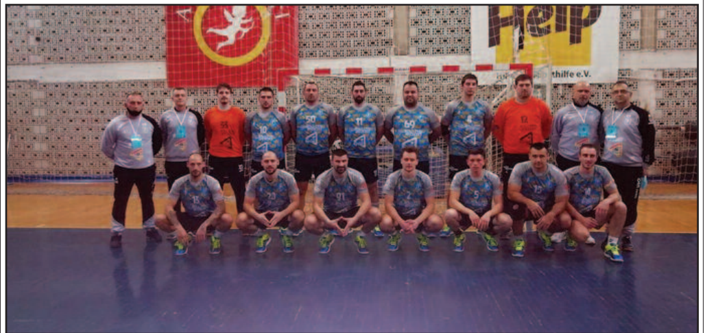
Рукометаши Металца у полуфиналу Купа западне Србије