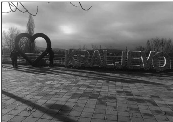
Радници Чистоће поставили ЗД натпис на градској тераси

- Ова конструкција је апсолутно употребљива. У питању