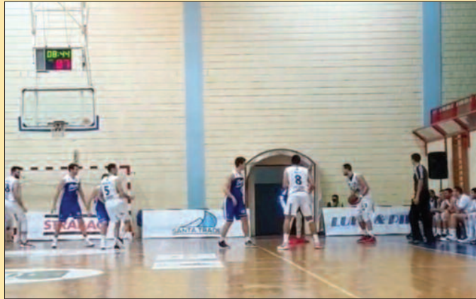
Детаљ са утакмице Дунав-Слога

Слога је у првом полувремену против Дунава одиграла слабо, примила је 53 поена и већ тада била у великом заостатку. Без потребних информација са клупе су Краљевчани покушавали да ухвате прикључак, али то им није пошло за руком. Међутим, у другом полувремену гледали смо другачију слику на терену. Слога је агресивном одбраном и добрим нападом успела да значајно смањи предност ривала, пред крај меча било је само 83-80 за Дунав. Тада су ствар у своје руке преузели најзапаже-