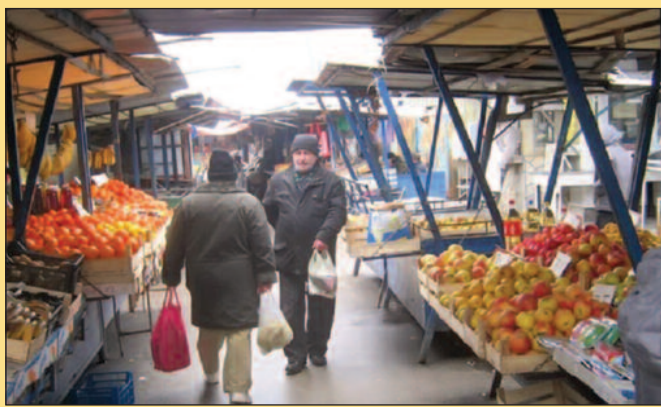
Измењен режим рада краљевачке пијаце

пијаци у Краљеву поштују се све епидемиолошке мере.