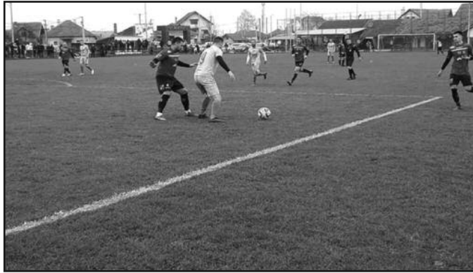
Детаљ са утакмице Карађорђе-Рудар Баљевац