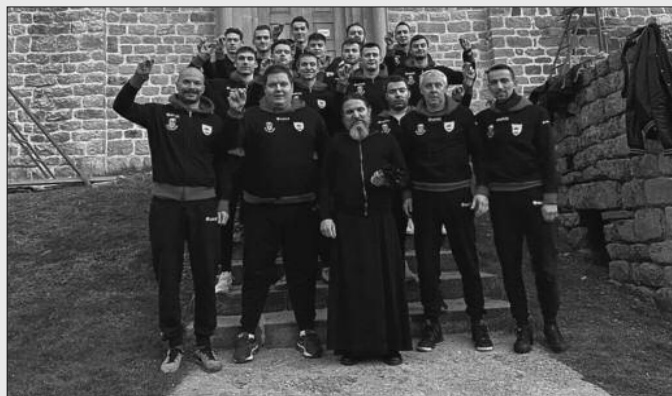
Пре дербија духовни мир-одбојкаши Рибнице посетили Ђурђево Ступове