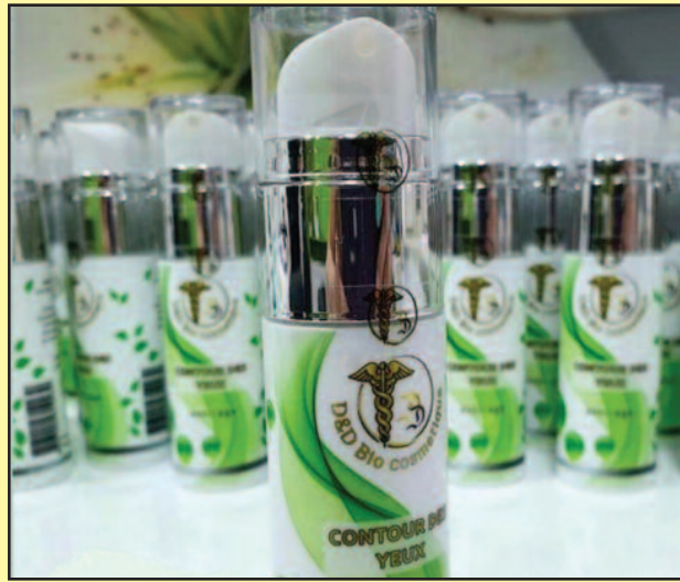
Производи светског квалитета

-Првенствено, медицинску козметику карактерише доста истраживања из домена физичко-хемијског, лабораторијског, микробиолошког, дерматолошког истраживања и када се прикупе сви неопходни сертификати, тек онда можете дистрибуирати козметику у апотеке. Сама истраживања су јако дуга, исцрпна, темељна. Када смо покретали производњу у Србији, прво смо радили са