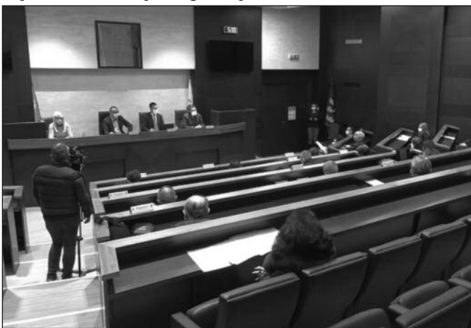
Неколико важних одлука на седници Градског већа

- Као што знате, ми смо у претходних неколико година на седницама Градског већа доносили одлуке о ангажовању текуће буџетске резерве за помоћ, на првом месту Српској православној цркви. Сада је буџет града неупоредиво бољи него ранијих година и имамо сигурне приходе и поред епидемије коронавируса. Управо зато сада имамо могућност да помажемо црквама и верским заједницама. Град Краљево по основу кредитног задужења не дугује више ниједан динар. Исплатили смо последњу рату дуга за кредит и више немамо никаквих дугова. С обзиром да су наши приходи сада стабилни, ми сада размишљамо и о томе да помажемо свим оним категоријама