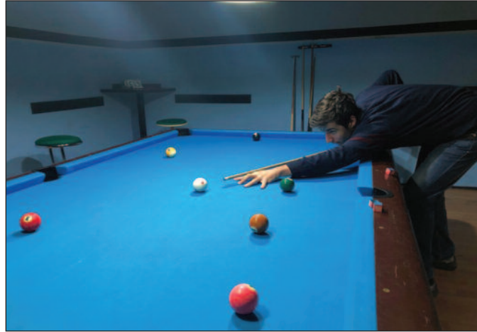
Матија Обрадовић краљевачки Рони О'Саливен

- У Београду су билијар клубови најбољи у Србији, самим