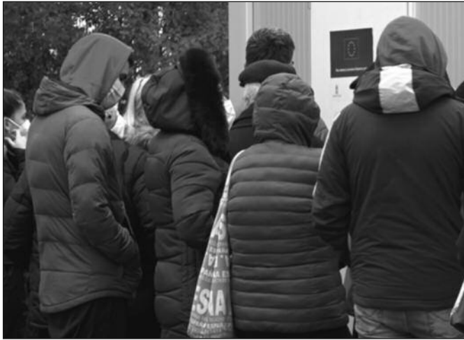
Преко 600 људи се тестира сваког дана у ковид амбулантама у Краљеву

Епидемија корона вируса не јењава. Краљево се налази на листи пет највећих жаришта у Србији када је у питању трећи талас епидемије, а бројке су застрашујуће. Од почетка епидемије у Краљеву је заражено преко шест хиљада људи, а за последња четири дана преко било је преко хиљаду позитивних. Нажалост повећава се и број преминулих, од почетка епидемије 95 особа је изгубило битку са корона вирусом. Испред ковид амбуланти су све веће гужве, дневно се тестира преко 600 узорака, како ПСР методом, тако и антигенским тестом. И број хоспитализованих је троцифрен. Пред закључење овог броја Ибарских Новости, 115 особа било је хоспитализовано у ОБ „Студе-