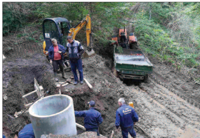
Обиман и важан посао радника ЈКП Водовод на санацији сеоских водовода

Захваљујући локалној самоуправи наишли смо на отворена врата и веома брзо, скоро у року од месец и по дана ми смо повратили