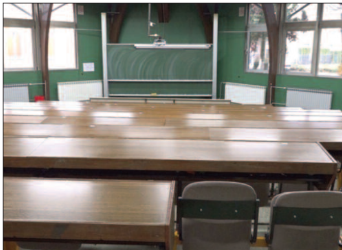
Амфитеатар на факултету празан-студенти такође прешли на онлајн наставу

- Од почетка овог месеца, настава за прву, другу и трећу годину основних студија прешла је комплетно на онлајн. До недавно је била комбинована настава, а сада смо прешли потпуно на предавања путем интернета. Посебан допринос дале су колеге асистенти и наравно професори који су били вољни да чак и дупло одржавају предавања како би све групе и сваки студент имао прилику да чује. Циљ је био да што већи део градива буде обрађен уживо и до децембра смо то некако успевали. То је била молба и