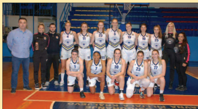
ЖКК Краљево јури плеј оф у овој сезони

- Негде у мислим нам је био први меч са Дугом. Тада нисмо били спремни и нисмо имали плејмејкера, просто много тога лошег је било везано за нас у том тренутку. Ситуација је сада била потпуно другачија. Имали смо 14 дана да вредно тренирамо, играчице су биле изузетно вредне, напорно су радиле и резултат није могао да изостане. Такође, квалитет је убедљиво на нашој страни тако да нисмо стрепели ни једног тренутка. Наравно, има још ствари које треба поправити у игри, јер нам следе далеко тежи