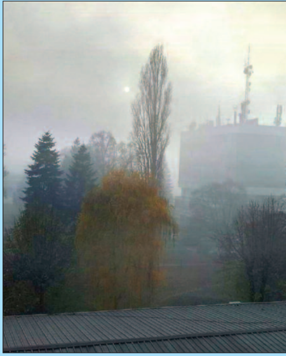
Аерозагађење велики проблем становника Краљева

- Ваздух је загађен првенствено због индивидуалних ложишта у приградским насељима, Рибници, Јарчујку, у Чибуковцу, Сијаћем пољу. Тако се производи велика количина загађености и ми смо као град решили да дугорочним мерама смањимо степен загађења ваздуха на територији Краљева. На првом месту, кроз процес гасификације насеља. Тренутно сви мештани Рибнице знају да се гасификација спроводи на њиховој територији. Након тога ми ћемо