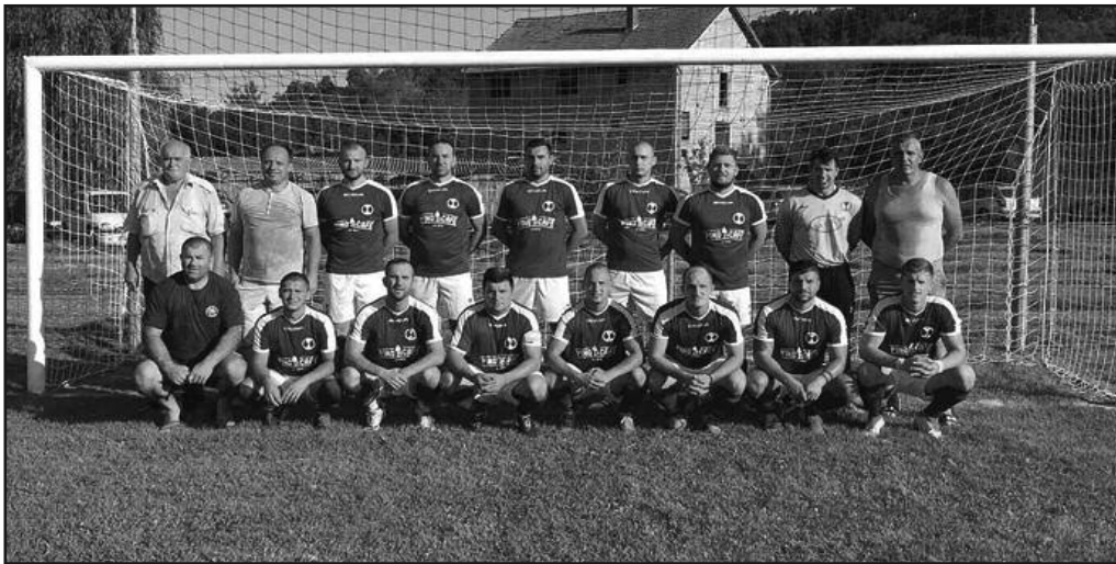
Најавили повратак у Окружну лигу-фудбалери Ласца

Када се тако гледају ствари многи би се питали да ли је могуће да смо први. Ипак, уложили смо огорман труд, крв, зној и сузе што би рекао Черчил, да би смо на крају јесење полусезоне били на првом месту. Завршисду такмичења смо одиграли са најмање осцилација, имали и спортске среће која прати храбре