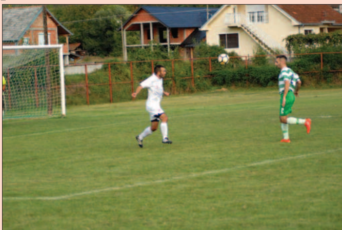
Ко ће пре до лопте-детал са утакмице Шумадијско-Рашке зоне

ПАРОВИ 15. кола: Борац-Водојажа, Гоч-Корићани, Мокра Гора- Будућност (субота), Про-