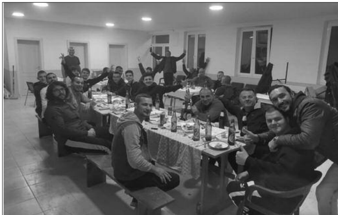
Знали да прославе победу-фудбалери и руководство ОФК Прогорелице

ПАРОВИ 14. кола: Млада Крила-Јединство (Д) (субота), Милочаја-Слога