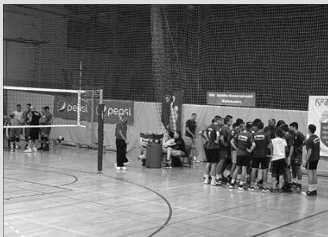
Детал са меча Рибница 2 и Техничар