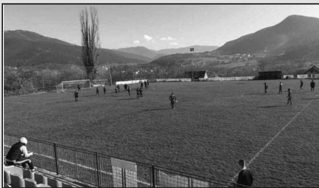
Детаљ са дерби меча у Студеници Студен Витез-Омладинац

ПАРОВИ 12. кола: Будућност (С)-Морава (М), Милаковац 2018-Згодича (субота), Биљановац-Стара Чаршија (недеља 11ч), Магнохром-Шумадија, Омладинац-Коштам