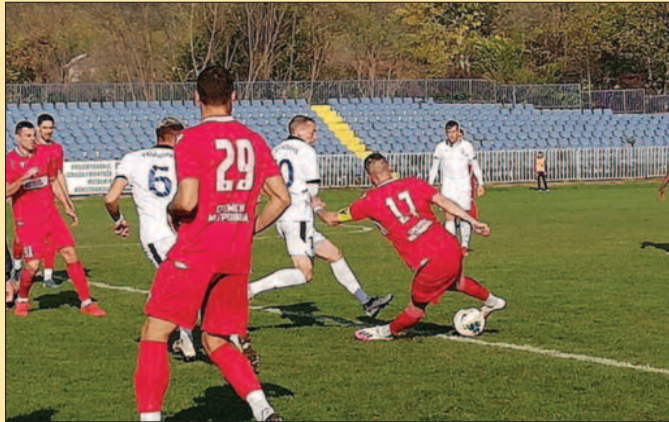
Краљевчани пету везану утакмицу без победе-детал са меча Слога-Раднички СМ

У наставку, чешћи напади фудбалера Слоге која су имали силну