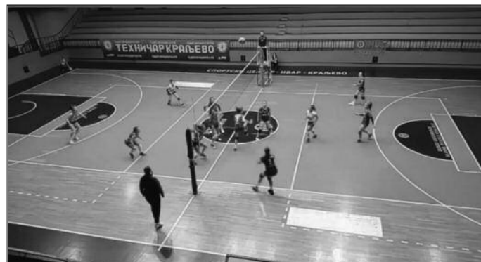
Пораз од Борца-детал са утакмице Техничар-Борац

Претходног викенда одигране су утакмице 7. кола Прве лиге група „Запад“ за одбојкашице. Краљевачки Техничар је у кошаркашком дербију поражен од чачанског Борца резултатом 0-3 (10-25, 22-25-20-25). Борац је лидер у првенству без пораза и изгуб-