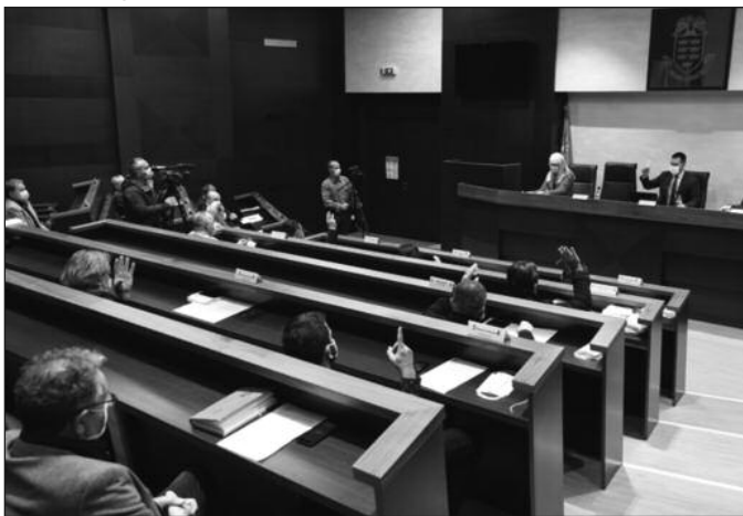
Већници усвојили предлог епидемиолога да се одложи референдум у Ушћу

Чланови Градског већа дали су сагласност на Решење о утврђивању просечних цена квадратног метра одговарајућих непокретности за утврђивање пореза на имовину за 2021. годину на територији града Краљева. Градоначелник је подсетио да се сваког новембра утврђују цене по квадратном метру непокретности у различитим