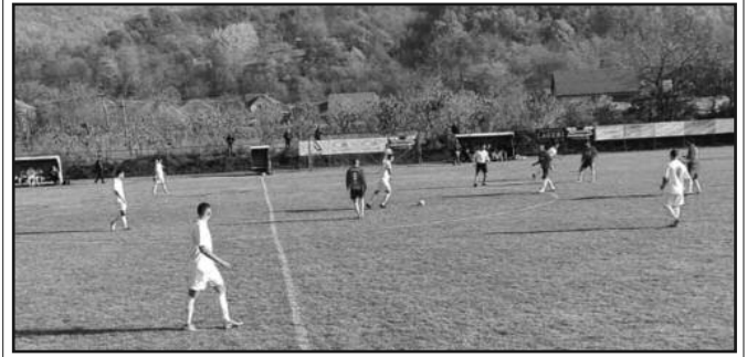
Детаљ са утакмице Поповићи Врњци-Ибар