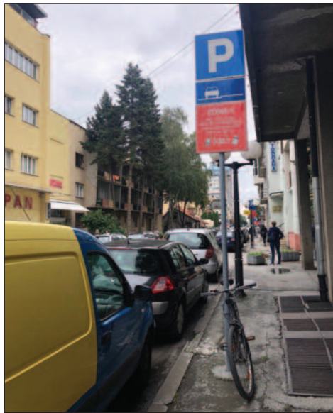
Последице неплаћања паркинга врло скупе

Целу 2019. годину смо посветили тражењу решења тог проблема. Прошао сам скоро целу Србију и скоро све паркинг сервисе да нађемо који је тај модел који ће да доведе несавесне грађане у ред. И један од модела је управо ово уступање потраживања за несавесне платише. Најбржи и тренутно можда и најбољи начин за решавање тих проблема са два аспекта. Један је везано за грађане, покушавали смо да идемо и преко извршитеља. На жалост, то је компликована процедура и за грађане то значи већи трошак. Јер само покретење процедуре је 6.000 динара према извршитељу. То ће на крају све платити корисник. Онда још иду и додатне