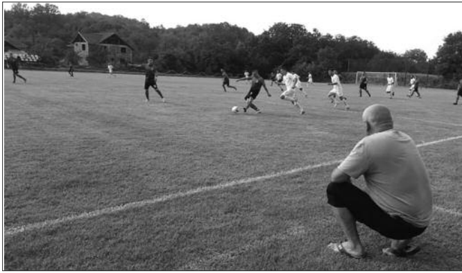
Детаљ са утакмице Водојажа-Пролетер

Претходног викенда почело је првенство Шумадијско-Рашке фудбалске зоне. Куриозитет су три победе гостију у 1. колу, а посебно су расположени за игру били фудбалери Реала из Подунавца и Радника са Ушћа. Реал је у Новом Пазару декласирао домаћи ОФК Рас, док је Радник био убедљив на свом терену против новајлије из Дреновца. Изненађење кола је победа Гоча из Врњачке Бање у Новом Пазару, поготово ако се зна да су Бањчани статус зонаша задржали административним путем. Дојучерашњи српсколигаш Мокра Гора је рутински славила у Корићанима што је најважније експресног повратка у трећи ранг такмичења. Полет из Ратине је освојио