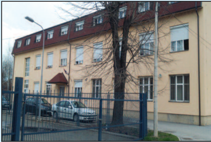
Студентски дом у Краљеву

ученичким домовима ученици морају сами да мере температуру ујутру и увече. У случају промене здравственог стања о томе морају да обавесте васпитача, који онда мора да зове родитеље или старатеље ученика. Мора да постоји и