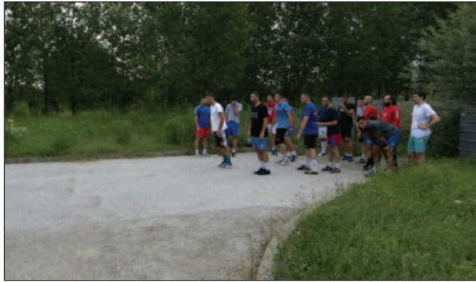
Играчи решени да прођу до другог ранга рукометног такмичења