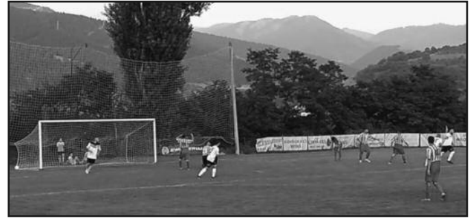
Славље на Ушћу после премијерне победе

РЕЗУЛТАТИ 1. кола: Будућност-Шумадија 1903 1-1, Корићани-