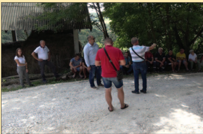
Мештани Горњих Лађеваца коначно дочекали да им буде урађен квалитетан пут

-Овде смо само урадили подасипање пута, што је најбитније за овако брдско-планинске путеве и пределе. Урађено је тачно километар и 400 метара пута, тако да после дугог низа година и овде су коначно дошле машине. Имали смо у последњих месец и по дана чак три поплаве и све су оне однеле овај пут толико да није могло ни да се прође, чак ни неким пољопривредним машинама. Сада је на срећу и олакшање пре свега ових мештана све урађено и завршено. Трудићемо се да овакве локације што чешће поправљамо, јер дошли смо у ситуацију да у селима нема више много људи, а посебно у овако