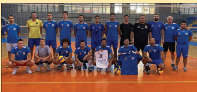
Одбојкаши краљевачке Рибнице на тренингу пред Бошковићев меморијал

руковођење Рибницом, као први задатак постављен је организација овог турнира.