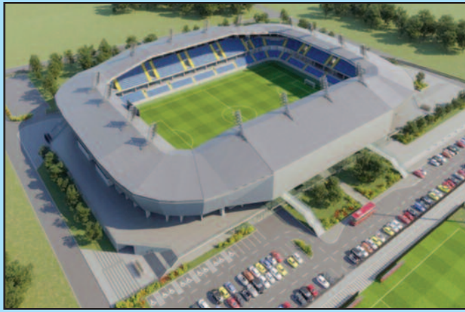
Пројекат фудбалског стадиона који ће се градити на Спортском аеродрому

-Та јавна набавка ће бити једна набавка са седам лотова. То значи да један учесник на тендеру не може учествовати на више места, већ мора да буде само на једном стадиону. Тиме је омогућено да буде разноврсних извођача радова на свих седам стадиона. Важно је напоменути да је то једна веома захтевна јавна набавка и на њој ће морати да учествују компаније које имају кредибилитет и најмање 200 до 300 запослених радника, јер сам рок од годину дана нас упућује да тај објекат мора бити изузетно ефикасно и квалитетно урађен и наравно на време завршен, истакао је