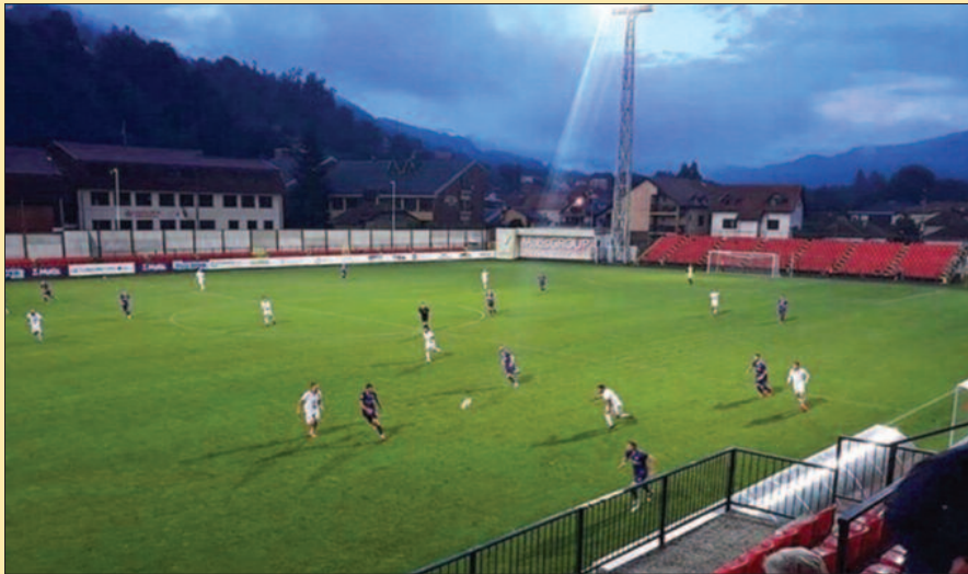
Добар фудбал у Ивањици-детал са утакмице Јавор-Слога