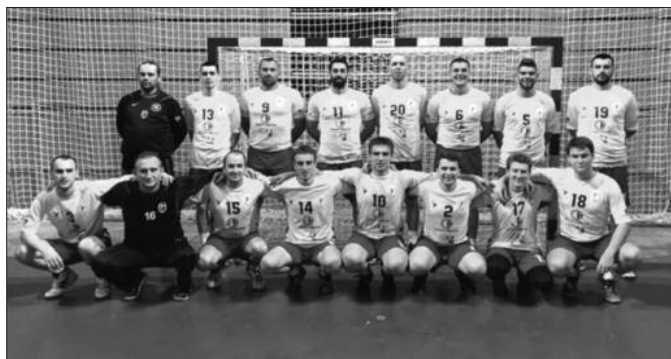
Са новим тренером и појачањима Металац спреман за бараж

У сваком клубу где је играо био је међу најбољима, оставио је запажен траг?