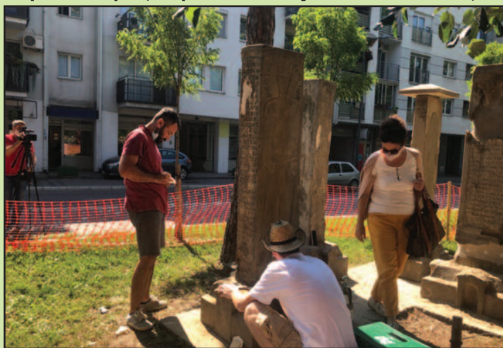
Ови радови треба да заштите крајпуташе наредних педесет година

Средствима које је обезбедило Министарство за рад успећемо у постигнуће да реализујемо овај пројекат, тако да ће по његовом окончању када истекне рок за реализацију