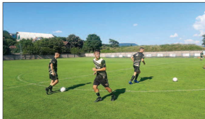
Припреме трајале осам недеља-кадети Кикера на једном од последњих тренинга