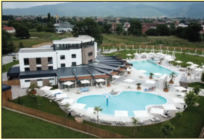
Завршена је тек прва фаза изградње овог комплекса

-Комплекс „Врњачко врело“ поседује два базена, један за одрасле димензија 25 пута 13 метара и један дечији са свим садржајима за децу, као и укупно 190 лежаљки које су на располагању гостима. Поштујемо све мере заштите. На улазу комплекса налазе се дезобаријере, а на улазу у свлачионице и тоалете налазе се