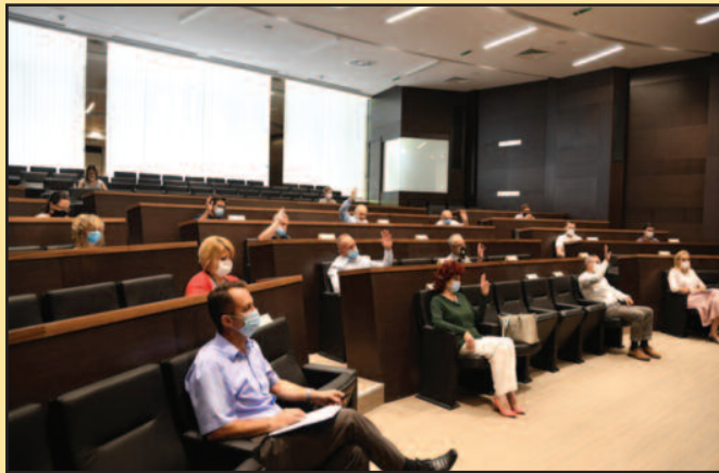
Расписан нови конкурс јер је остало још пара да се расподели

Чланови Градског већа су додали Решење о додели средстава за бесповратно суфинансирање инвестиционих пројеката стамбених заједница које су испуниле критеријуме за доделу средстава по Јавном позиву. Градоначелник истиче да све стамбене заједнице на територији Града Краљево имале могућност