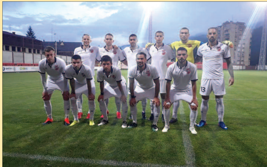
Фудбалери Слоге пред почетак меча у Ивањици

на стазе страе славе и биће нам ривал у првенству. Мислим да