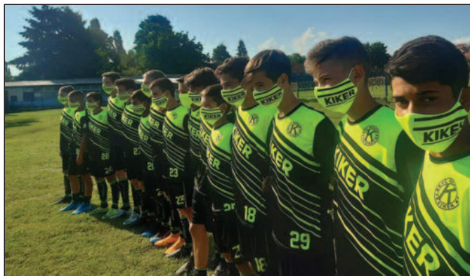
Нова генерација у новим околностима дочекује нову сезону у елити-кадети краљевачког Кикера

У току је летњи прелазни рок, дуго ће трајати, па су и у Кикеру били активни?