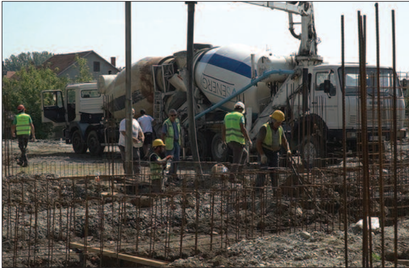
Корона за сада није угрозила изградњу ОШ „Свети Сава“

- Имали смо један мали прекид због ових атмосферских непогода, а после тога су нам се појавиле подземне воде, тако да смо морали да применимо одређене мере и решимо одређени део везан за тврдоћу темеља. Ту тврдоћу смо сада постигли и крећемо са бетонирањем. Пре тога је урађено шаловање темеља и сада крећемо да радимо пуном паром. Имамо један извесан број запослених људи на градилишту, а у наредном периоду ће долазити и нови људи и очекујемо да имамо 20 до 30 радника у сваком тренутку на градилишту. Са извођа-