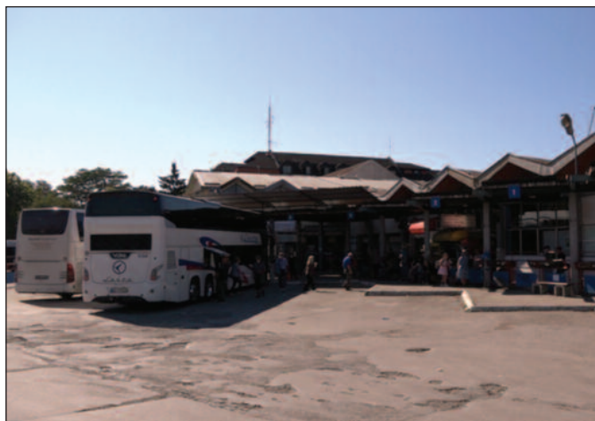
Краљево заслужује модерну и лепо уређену аутобуску станицу

-С обзиром да је град Краљево понудио одређену цену за куповину објеката коју нису прихватили они који руководе „Ауто-транспорт“ у стечају ми смо смо одлучили да на суду утврдимо вредност тих објеката. Након тога град Краљево ће, као једини могући купац, исплатити та средства и ући у посед не само земљишта него и објеката. Затим ми морамо да уђемо у процес реконструкције ових објеката, односно да самостално или у сарадњи са одређеним партнерима извршимо реконструкцију зграде