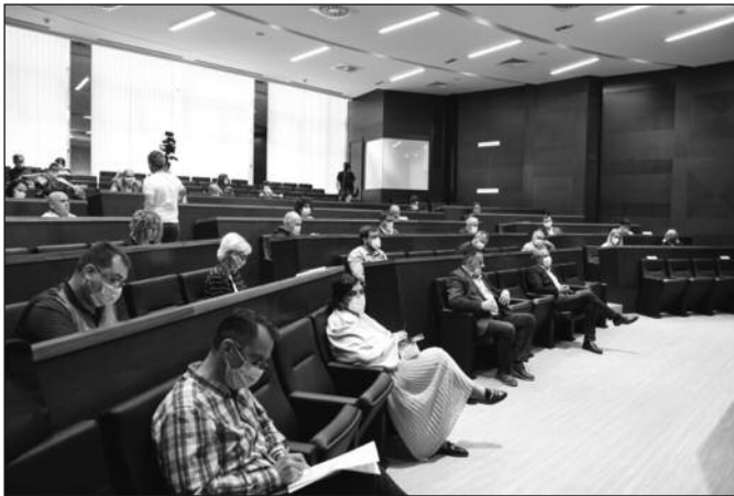
Седница одржана уз поштовање свих препоручених мера заштите

У односу на планирано реализовано је 98,7 процената прихода. Ако томе додамо приходе које смо реализовали по основу трансфера републичких власти и страних држава, као и суфицит из 2018. године, произилази да су укупни приходи који су остварени за 18 одсто већи од планираних. Остварили смо приходе у износу од 4.577.000.000 динара, чиме се показује велики раст прихода у