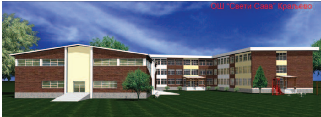
Овако ће изгледати нова зграда ОШ „Свети Сава“ у коју ће ђаци кренути идуће године

- Извођач радова "Тончев градња" улази у посао, рок је 400 дана, тако да се надамо да ће само следећа школска година бити она у којој ћемо морати да будемо мало стрпљивији, али ћемо заиста добити једну прелепу школу. Преправка пројекта трајала је током целе прошле године, али зато сада имамо један добро урађени пројекат и када крене изградња, мале су шансе