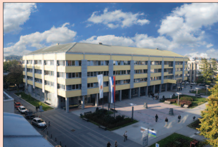
Апел грађанима да без велике потребе не долазе у зграду Управе

Градска управа Града Краљево од понедељка, 11. маја 2020. године, наставља рад у пуном капацитету, будући да је Одлуком Народне скупштине укинута ванредно стање.