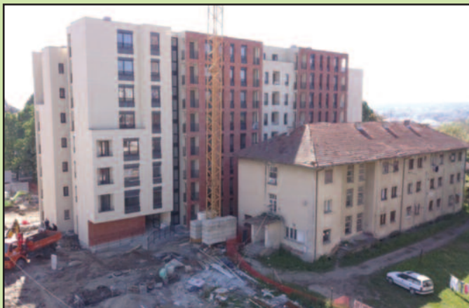
На првој згради у Доситејевој обављају се завршни радови

- У Доситејевој су у току завршни радови. Ја очекујем у што скорије време да ће зграда бити завршена и да ће се уселити први станари. Када се ова зграда заврши план је да се раселе