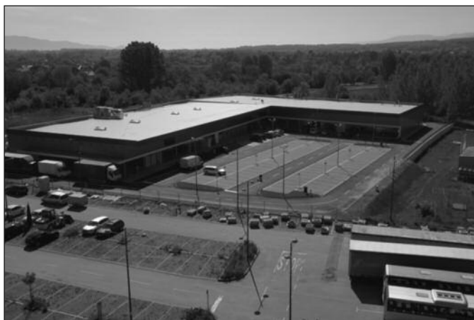
У новом тржном центру и радње неколикокупчених светских брендова

рата. Своја врата за купце у Краљеву отворили су "NewYorker", "Lilly", "Dak sport", "Gigatron" и "Jysk", док ће брендови "Oposite shoes", "DexyCo", "Katrin" и "Perco" бити отворени касније.