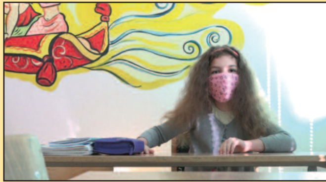
За продужени боравак у ОШ „4. краљевачки батаљон“ пријавило се десетак ученика

датеља. Међутим, када смо их поново контактирали, неки од њих су се снашли на други начин. Добили смо јасне инструкције од Министарства просвете које мере заштите треба да поштујемо и све је обезбеђено и маске и дезинфекциона средства, дезобаријере испред улаза у школу, каже