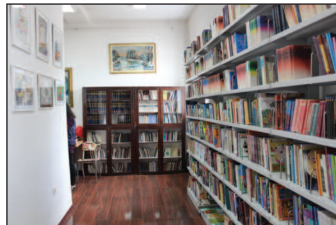
Отворена и књижара Културног центра у Рибници

највише 10 посетилаца који су такође у обавези да поштују мере заштите - да носе маске и рукавице. На улазу је постављена дезобактеријера, а обезбеђено је и средство за дезинфекцију руку посетилаца. До средине јуна, посетиоци могу погледати изложбу "Сурлаши –