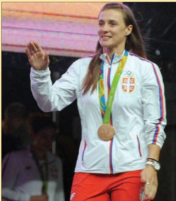
Олимпијска бронза златног сјаја-Невена Јовановић

спорт, музику, шетњу, уз жмурке, јурке и остале игрице уз које је и моја генерација одрасла. То су ствари које се памте цео живот. Ако крену озбиљније да се баве спортом, онда нејка буду спремни за одрицање, да буду упорни, да верују и не дозволе никоме да им одређује лимит и крајње границе.