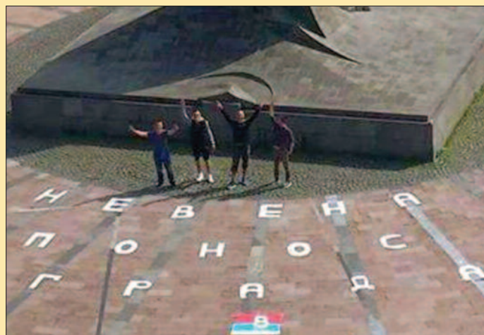
Невена понос града-захвалност Краљевчана Невени Јовановић

Невена Јовановић је као и све наше репрезентативке у кошарци постала идол новим генерацијама деце која тек почињу да се баве спортом.