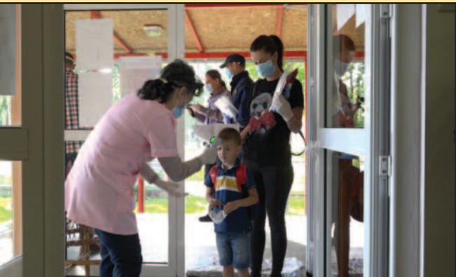
Пријем у вртићу „Полетарац“ протекао без проблема

аузе, у понедељак су поново отворени вртићи и продужени боравак у школама * У ове обра- о се враћају деца чији родитељи морају да раде, а немају коме да оставе малишане