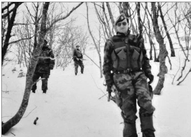
Младим војницима сам био и командант и отац и све

да будем фин, а некада сам био и груб. У тој тешкој ситуацију мораш да нађеш метод како да тим људима приђеш. Ја њих разумем, јер су они у рову провели све време рата. Излазили су из рова само да обаве физиолошке потребе. И ја сам са њима био у рову, али тај војник остаје у рову, а ја одлазим да обилазим друге војнике у другим рововима. Ипак, сам се кретао више од њих. Током битке на Кошарама која је трајала 67 дана погинуло је 12 бораца, а рањена су 33. У целом 53. граничном батаљону погинуло је укупно 16 бораца, а рањено је 67. То само говори о томе какве су се битке водиле на Кошарама. Битка на Кошарама треба да се памти као битка у којој је добро обучена и организована војска високог морала, бројчано мања, успела да заустави бројчано јачег непријатеља који је такође био обучен, а у наоружању је био у предности јер је имао подршку из ваздуха од стране НАТО алијансе, и подршку артиљерије из Албаније. Успели смо да зауставимо непријатеља на граничној линији, да му нанесемо губитке које није очекивао, да омогућимо нашим јединицама да дођу из дубине и последњу положаје и спречимо продор у којем би шиптарско терористичке снаге направиле масакр над неалбанским цивилним становништвом у дубини Србије. То је једно моје важно запажање.