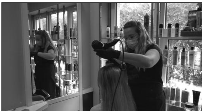
Да би се избегле гужве најбоље је применити рад на заказивање

У фризерско - козметичком салону "Недекс" јасно и прецизно примењују све инструкције Владе