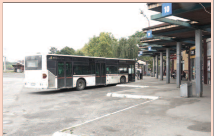
Од 4. маја се омогућава друмски међуградски саобраћај уз придржавање свих мера

— За сада чекамо одлуку Владе о евентуалним изменама уредбе, јер је без тога забрањено обављање градског, приградског и међуградског превоза. Иако је најављено да ће већ кренути превоз путника, још нисмо отворили линије и поласке, јер уредбама о мерама у време ванредног стања и даље је на снази забрана обављања овог превоза. Оно што је допуњено изменама од 24.априла 2020.године јесте да је Влади поверено да може да се изјасни о ублажавању мера које су тренутно на снази. Према томе, ми још увек чекамо тај акт Владе и евентуално следећу измену уредбе, јер је без тога забрањено обављање свих врста превоза. Надам се да ће се то што пре догодити и да ће се превоз нормализовати на задовољство пре свега наших корисника, али и запослених. О свим новим уредбама на време ћемо обавестити све заинтересоване,