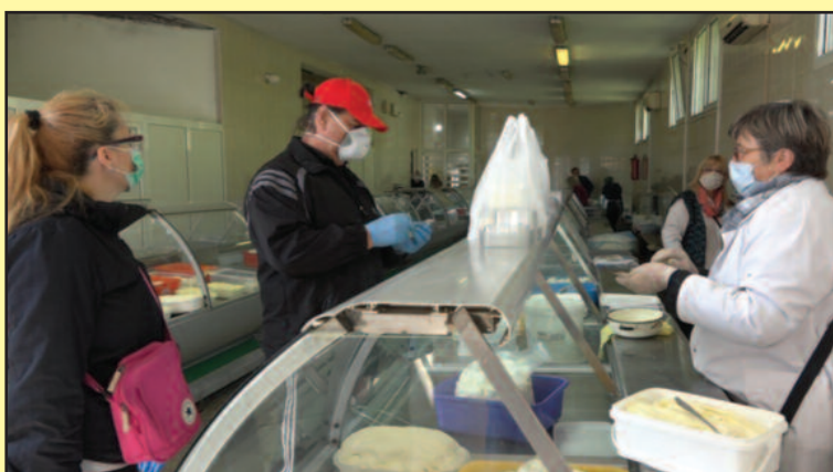
Пијаца обезбедила све услове за примену прописаних мера

-У складу са одлукама Владе и градског Штаба за ванредне ситуације, отварамо и делове пијаце који до сада нису радили, а то су Млечна пијаца, Робна пијаца, Борјак, Мала пијаца. Свака од пијаца отворена је након дезинфекције и припреме за почетак рада. Имамо доста купаца који су старији од 65 година, али