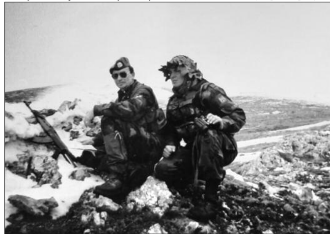
Ко није био у граничним јединицама тај не зна шта је лепота

-Тај батаљон је заиста заслужио да добије одликовање Народног хероја. Тај батаљон је током 1998. године поднео највећи терет, а такође и 1999. године. Хвала још једном председнику Александру Вучићу који је сагледао шта је тај гранични батаљон учинио током 98/99. године. Ја ћу да се борим до краја да тај батаљон буде одликован. На дан граничара 13. новембра 1999. године генерал Небојша Павковић, командант Треће Армије прогласио је 53. гранични батаљон за најбољи батаљон у Треће армијској