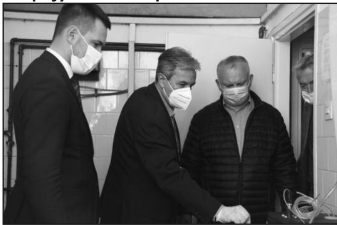
Дезинфекционо средство од Краљева затражило 25 локалних самоуправа

—Од почетка ванредног стања Град Краљево је обезбеђивао довољне количине натријум хипохлорита. Добијали смо га из Крушевца и ово је прилика да се јавно захвалимо граду Крушевцу који нам је омогућио да имамо довољно овог средства за дезинфекцију. У међувремену, преко ЈКП „Водовод“ смо успели да почнемо и сами да производимо довољне количине натријум хипохлорита. И не само то, сада смо у могућности да овим дезинфикационом средством снабдевамо друге градове и општине у Србији, да њима помогнемо у овом тешком времену борбе против КОВИД 19. Дугујемо велики