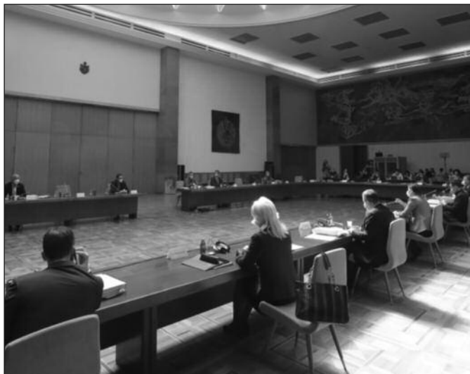
Усвојен календар ублажавања мера ако епидемиолошка ситуација буде повољнија

Од понедељка, 27. априла, дозвољен је рад пијацама у затвореном простору, фризерским и козметичким салонима, салонима за негу лепоте, као и фитнес центрима и теретанама. Сви објекти морају обављати своје делатности уз коришћење заштитне опреме (маске, рукавице, дезинфекциона средства). Поједини објекти, попут теретана и фитнес центара, услед природе делатности, морају додатно појачати дезинфекцију објеката и посебним протоколима уредити начин рада, водећи рачуна о социјалној дистанци и броју људи унутар објекта.