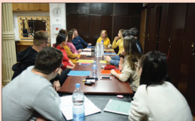
Детаљ са пробе за представу „Гласине“