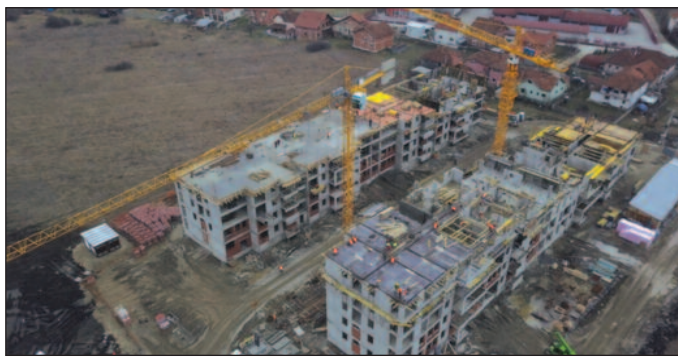
Ови станови моћи ће да се купе по повлашћеним условима

-То је одлична вест за све припаднике Полицијске управе у Краљеву, краљевачког одреда жандармерије, Друге бригаде Кошарне војске, судске страже, Окружног затвора, јер ће имати могућност да за свега 400 евра по квадратном метру купе потпуно нове станове. И то по врло повољним условима, јер за стан од 55 квадрата, на кредит од 30 година, месечна рата износиће свега 82 евра. А то је знатно мање од цене закупа за