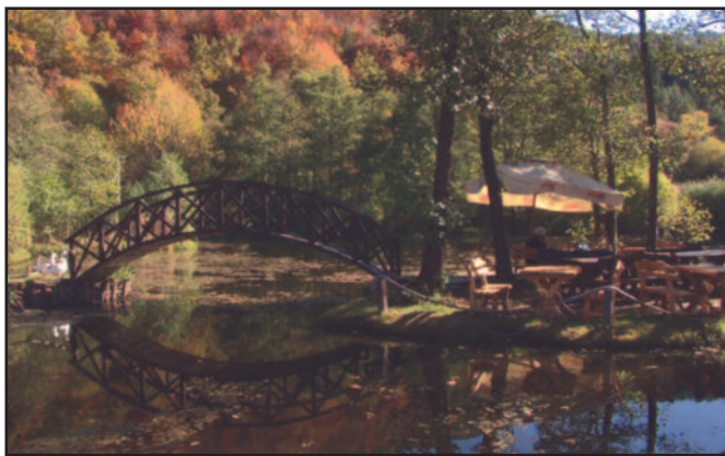
Семетешко језеро познато по плутајућим острвима и дубини

Рашка је мали, леп и чист град са око 7.000 становника. Рашка је место рођења и колевка српске средњовековне државе. Рашка је делила судбину свога народа током векова. Кућа Курсулића сведочи и чува истину о томе како је Рашка у најтежем периоду за опстанак државе постала ратна престоница Србије 1915. године. Када је током друге године Првог светског рата Србија остала сама окружена са свих страна аустроугарским, немачким и бугарским војницима, Рашка је била по-