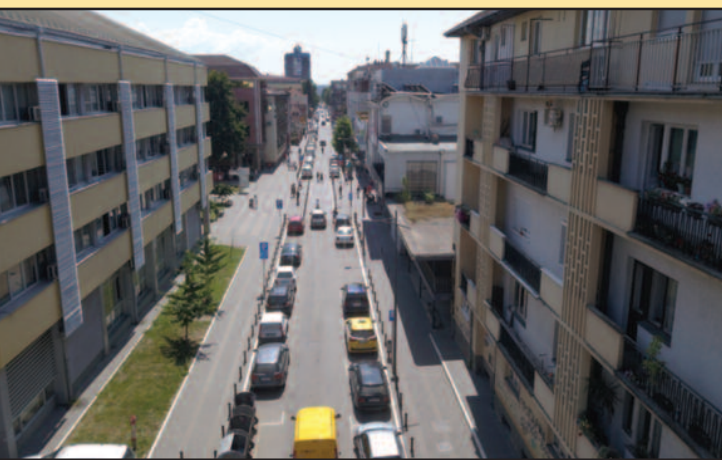
У Краљеву ће бити изграђен интегрисани систем видео надзора

Ове године од Министрства без портфеља задуженог за иновације и технолошки развој добио 26 милиона динара за постављање камера које ће побољшати безбедност у саобраћају, а ове године у ове намене добио је Краљево од Министрства државне управе и локалне самоуправе