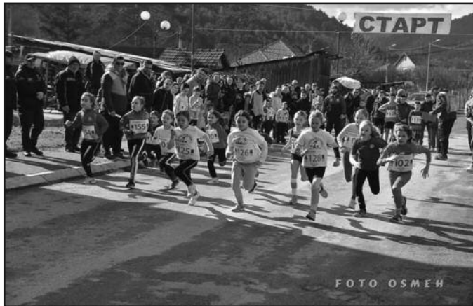
Старт најмлађих учесника Сретењске трке