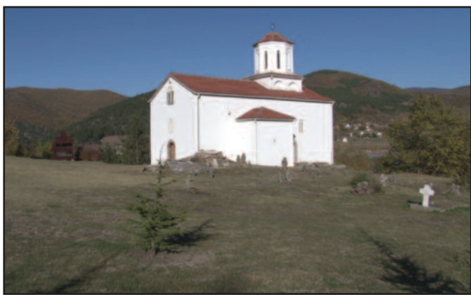
Манастир Кончул изграђен још у дванаестом веку

У непосредној близини Рашке, а подно Копаоника на 900 метара надморске висине сместио се прави природни драгуљ, Семетешко језеро. Ово језеро је познато по својим плутајућим острвима и дубини језера. Чак ни најiskusнији рониоци нису смели да зароне испод 10 метара дубине, а мештани кажу да ово језеро нема дна. Због јаких водених струја које рониоце вуче на дно никада Семетешко језеро није испитано до краја. За ово језеро зна се од вајкада и могуће је да је старо више милиона година. Ово је урвинско језеро настало радом ледника. Сама позиција језера је таква да пружа одличне услове за рурални туризам. Општина Рашка завршила је асфалтирање пута до села Семетеша.