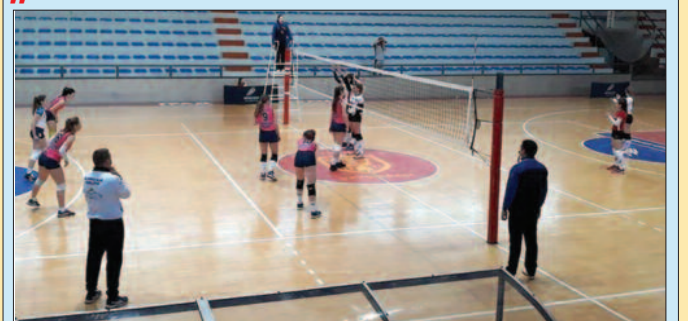
Гимназијалац славио у Крушевцу и поново на трону-детал са утакмице под Багдалом

На теренима Друге лиге група „Запад“ за одбојкашице претходног викенда одигране су утакмице 11. кола. Краљевачки Гимназијалац је у Крушевцу победио домаћи Напредак 037 резултатом 3-0 (25-17, 25-14, 25-16), док је Техничар у Краљеву изгубио од Новог Пазара резултатом 3-0 (25-21, 25-19, 25-12). Гимназијалац је искористио кикс Борца у градском