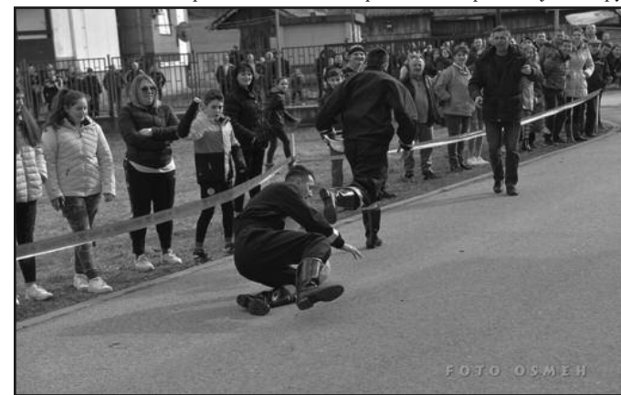
Било је и падова-трка рудара на Сретењској трци у Ушћу

је увек важно. Хвала присутнима који су дочли и позвао вих све да у наредном периоду посећују спортске манифестације и дру-