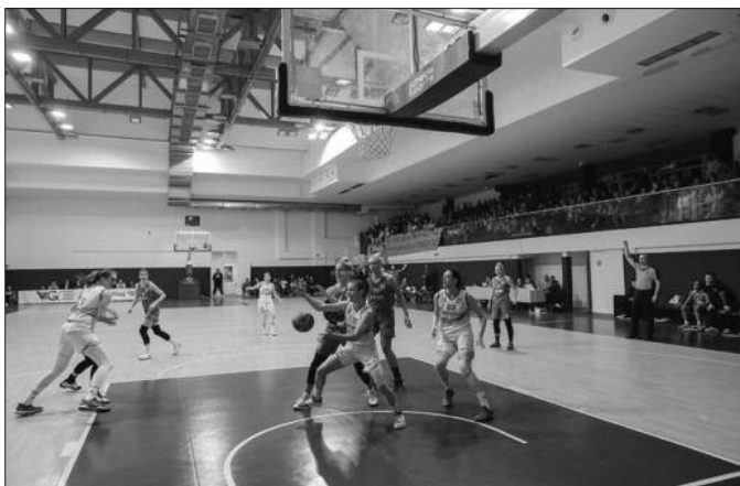
Важна победа у дербију-детал са утакмице Радивој Кораћ-ЖКК Краљево

Меч је обележила спектакуларна атмосфера у популарној „Жућковој авлији“, потпуно не свакидашња за женску кошарку у Србији. Трибине попуњене до последњег места, импресивна кореографија, балони, бубњеви, транспаренти и право спортско навијање присталица Кораћа од првог до последњег минута утакмице. Међутим, све то није било довољно да домаћи тим забележи победу против сјајне екипе Краљева. Гошће једноставно нису