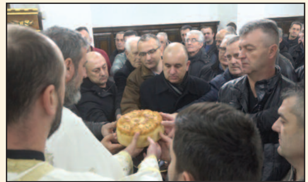
Традиционално сечење колача у Цркви Свете Троице

„Користим прилику да честитам свим занатлијама славу. Грудници смо се да окупимо што већи број