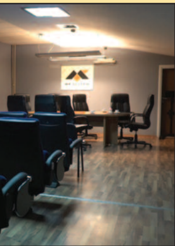
Салу се бави свим жанровима

српску кинематографију, а поред многобројних пројеката који се односе на подстицање финансирају Министарство културе и информисања и Филмски центар Србије, један од пројеката је дигитализација биоскопа • Мултимедијални центар „Кварт“ у протекле 4 године је укупно 3, 3 милиона динара, а средства су опредељена за куповину опреме и се-