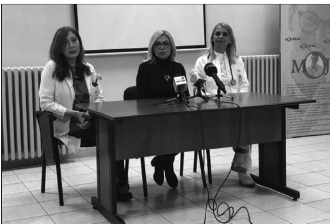
Вирус грипа је заступљен у високој мери, речено на конференцији за новинаре

-На територији нашег града почетком овог зимског периода па до треће недеље ове године ситуација је била мирна, и то све до четврте седмице када је дошло до приметно повећаног броја оболелих, а пре свега код деце. То је популација у годишту од нула до четири године, а доста их је било међу малишанима од пете до четрнаесте године. Ипак, све ово није довело до тога да ми прогласимо у нашем граду епидемију грипа, али због специфичне ситуације која се јавила међу малом децом, одојчади и новорођенчади, са великим бројем тешких клиничких слика у смислу пнеумонија и због велике заузетости на одељењу пе-