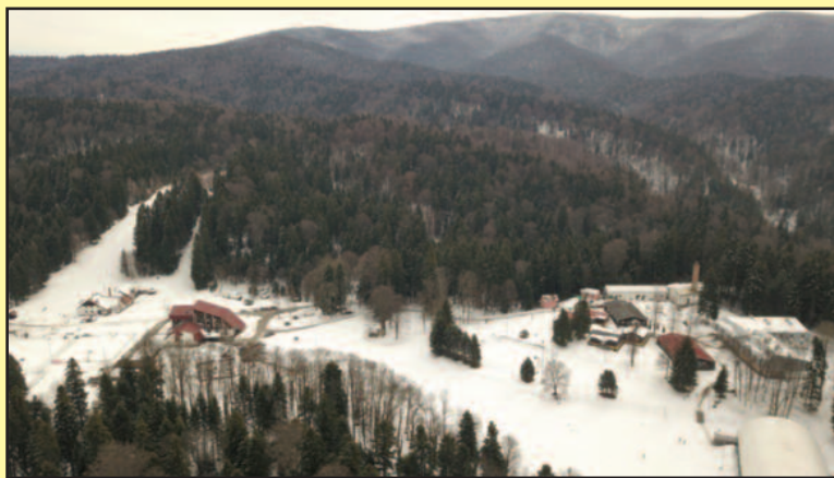
Биће изградња ски стаза, базен, спортски терени

Како кажу из Одељења за урбанизам сада је већ извесно да ће на Гочу бити изградња мала ски стаза на делу