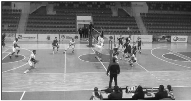
Слабо издање у Пожаревцу-детал са утакмице одбојкаша Рибнице