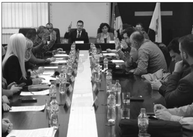
Већници усвојили планове рада предузећа за 2020. годину