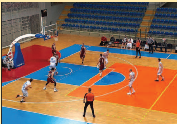
Тешком муком до победе-деталј са меча Слога-Пирот