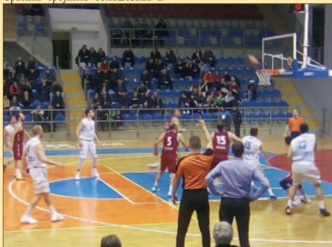
Преко хиљаду гледалаца пратило дерби Слога-Пирот

Радића, да би Матовић закључио прву четвртину поенима испод коша. Центар Пирота је већ у првих десет минута имао 11 поена.