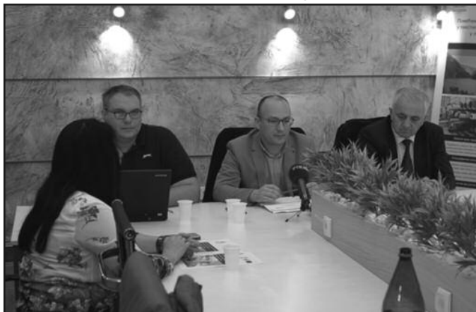
На конференцији за новинаре представљен пројекат прекограничне сарадње

-Тренутно имамо преко четрдесет активних пројеката. То су такозвани Софт пројекти за младе и неке од њих посебно издвајам: пројекат „Да живот жене на селу буде бољи“, затим веома значајан пројекат који је премијерка заједно са нашим председником отворила - такозвана самопослуга за младе који нису на евиденцији, па пројекат „Покрени се“, као и многи други пројекти који се директно одnose на младе. Пре неколико година смо отворили и Канцеларију за младе и имамо и Омладински клуб где се они свакодневно друже и размењују знања и искуство. И тако на тај начин лакше долазе до посла. Имамо позитиван