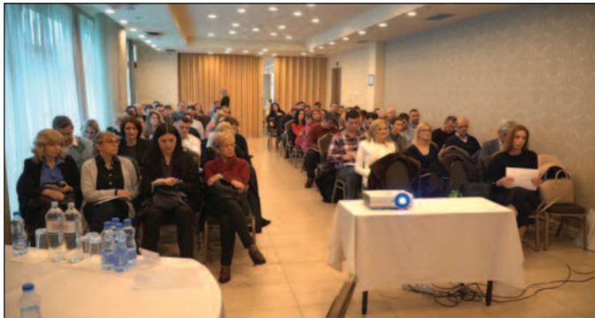
Свака локална самоуправа треба да припреми акциони план запошљавања

- Смисао је да обезбедимо да у свакој локалној заједници у складу са њиховим потребама, могућностима и захтевима тржишта рада, припреме одговарајуће акционе планове. Ово је процес који траје неколико година. У почетку је било само