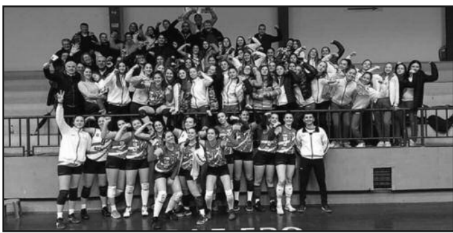
Прославили победу у дербију-одбојкашице и навијачи Борца из Чачка након меча у Краљеву