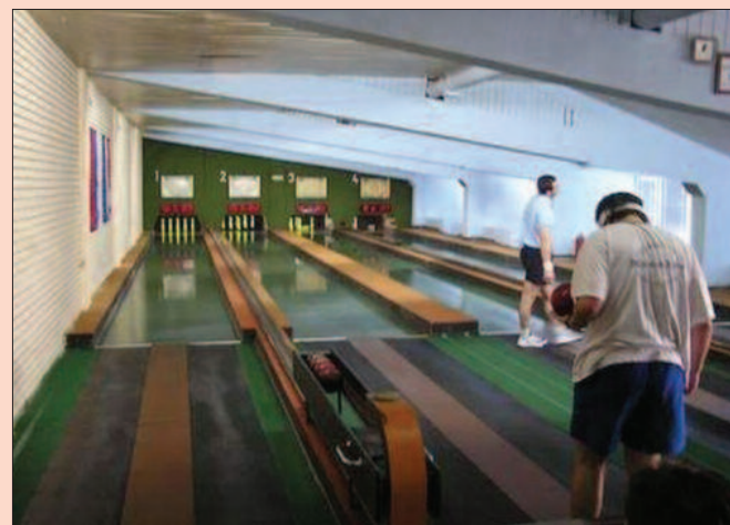
Чекатују нову куглану краљевачки куглаши као домаћини играју у Крушевцу