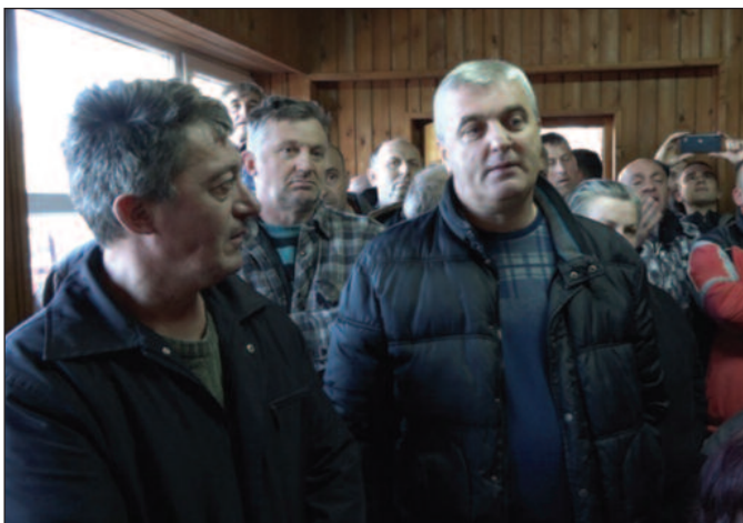
Грађани желе аутопут али уз правичну надокнаду за своје парцеле

Њихово незадовољство или стрепња изражава се пре свега око висине цене земљишта где ће проћи ауто-пут, а ту је затим и сумња шта ће се десити са остатком парцеле када после куповине остану такозвани репови од неколико ари, као и где ће бити пролази за њихова имања. Има доста конкретних питања и драго ми је да је атмосфера била доста повољна и да су сви за то да се ауто-пут гради. Сви су схватили шта то значи за Шумадију и овај део Србије. Драго ми је и да су схва-