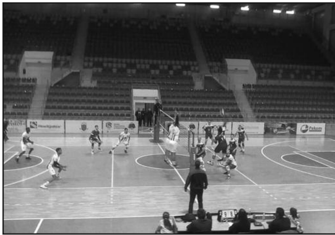
Премијера у новој години са Партизаном-деталј са утакмице одбојкаша Рибнице

још једног репрезентативца. На припремама државног тима био је и Стефан Скакић.