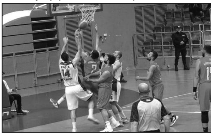
Убедљива победа Слоге у дербију-детал са меча Слога-Раднички Кг

- Изузетно важна утакмица и победа која вреди много више. После пораза у