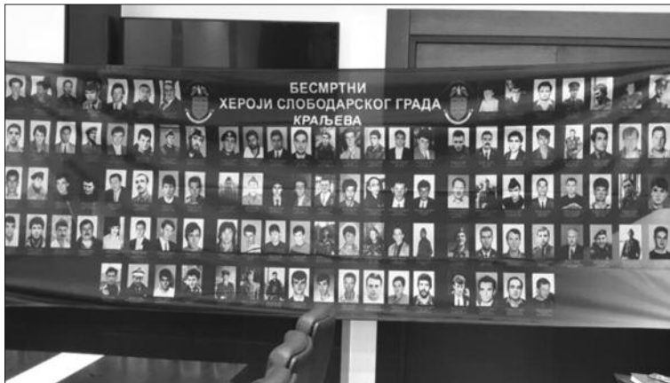
У ратовима од 1991-2000. године живот изгубио 81 краљевчанин