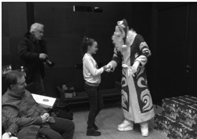
Божићне поклоне добило четрдесеторо девојчица и дечака

-Пре три и по године започела је сарадња између Града Краљева и Удружења ратних војних инвалида. На првим састанцима ми смо истакли највеће проблеме и већ три и по године их решавамо. Првенствено смо успели да обезбедимо попусте на комуналне услуге породицама ратних војних инвалида, али и да омогућимо ратним војним инвалидима да имају предност