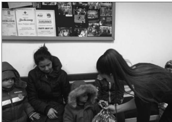
Позитивни коментари потврђују да су овакве акције права ствар

-Ми са поносом можемо да кажемо да је само у протеклих неколико месеци омладина, наравно у сарадњи са саветима овог одбора, реализовала више од 30 хуманитарних акција. Све то проузрокује да имамо позитивне коментаре и позитивне реакције свих младих у Краљеву, а који нису у нашим редовима, што представља знак да ми радимо праве ствари. И сами знате да је дат велики простор од стране лидера Српске напредне странке младима у поли-