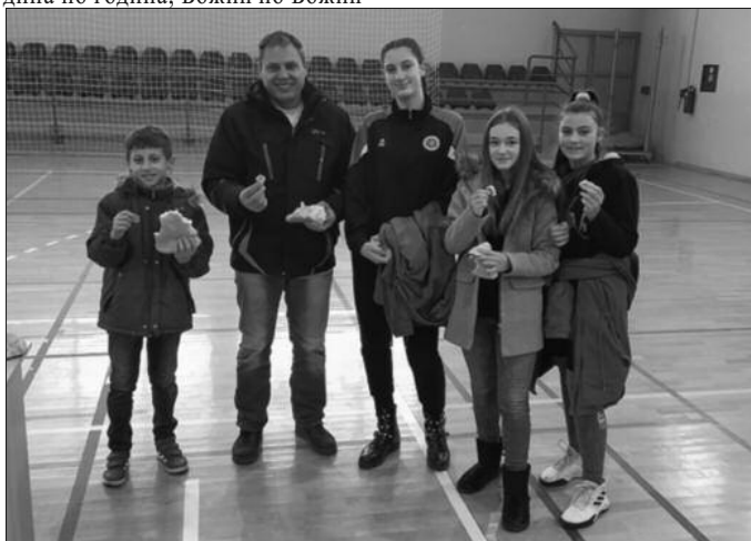
Извукли пару из чеснице на десети рођендан клуба

и Техничар дође до свог првог јубилеја. Почели смо са 17 дечака у жељи да радимо само са мушком популацијом. Данас је Техничар одлично организован клуб у коме тренира око 250 девојчица и дечака, са девет селекција у такмичењу, са пет тренера и као такав је носилац развоја спорта, одбојке пре свега у Краљеву и Србији. Поносни смо на пређени пут, на близу две хиљаде деце који су прошли кроз Техничар, један број њих је био веома успешан и стигао до дреса са државним грбом. Многи су касније отишли у друге клубове, играју и вишим лигама, али нису и неће заборави