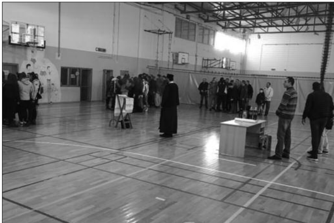
Уз молитву преломили чеснице на Божић и прославили рођендан

-Нико тада није могао ни да претпостави колико ће све ово трајати, о прослави 10. рођендана нисмо ни маштали, али година по година, Божић по Божић