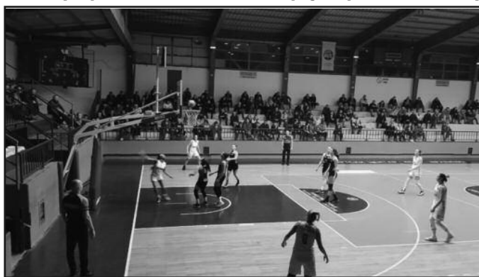
Победа и на премијери у 2020. години-детал са утакмице кошаркашице Краљева

- Имале смо краћи одмор од веома напорног распореда у првом делу првенства и учешћа на три фронта. Ипак, први смо клуб у Краљеву, из екипних спортова, коме се пружа прилика да освоји титулу првака државе и то је био огроман мотив да се и током празника ради много и јако. Имали смо и кадровских проблема, на терапијама смо биле