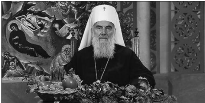
Његова Светост Патријарх српски Г.Иринеј

Главна порука и овогодишњег Божића треба да гласи да православно веру треба чувати и сачу-