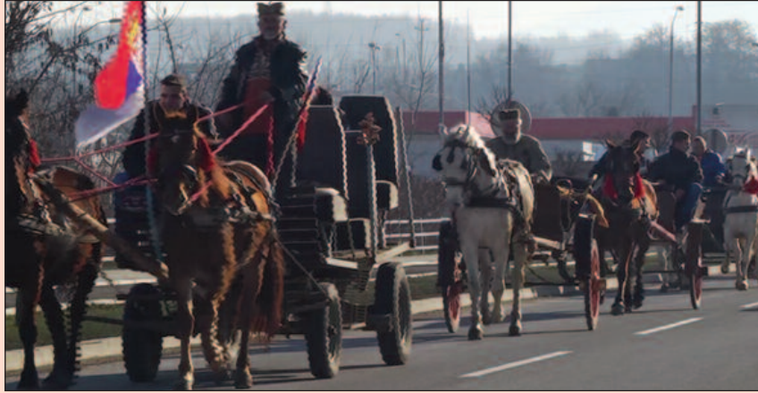
Поворка одушевила најмлађе краљевчане

На Божић, најрадоснији хришћански православни празник, у Краљево је одржана традиционална манифестација – дефиле фијакера, чеца, запрега и коња градским улицама у организацији одашњег Удружења љубитеља коња „Столови“. У овој несвакидашњој поворци која је на одушевљење нарочито најмлађих Краљевчана продефиловала градским улицама, ове године учествовало је десетак запрега у које су били упрегнути чак и полудивљи коњи са оближње планине Столови.