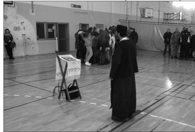
Божић и рођендан клуба

-Убеђени смо да ОК Техничар чека таква година, јер успех није само резултат на терену, већ слога и јединство наше велике породице. Зато смо и рекли