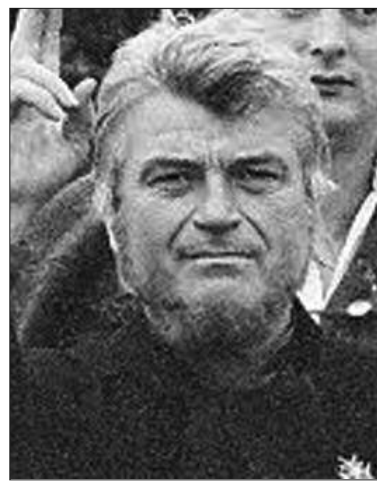
Милић од Мачве

2010. - На данашњи дан 2000. године умро је Милић Станковић - Милић од Мачве, сликар и књижевник. Милић од Мачве је студирао сликарство на Академији ликовних уметности у Београду. Живео је и стварао у Белотићу, Београду, на Златибору, у Паризу, Женеви и на грчком острву Парос. Био је члан групе "Медијала", са којом