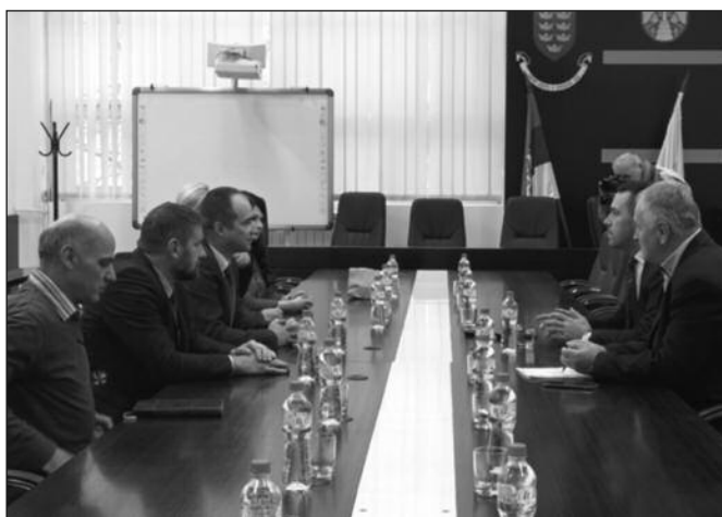
Амбасадор Републике Северне Македоније у разговору са градоначелником Краљева

-Ми смо разговарали о међународној политици, о односу Србије и Северне Македоније, али смо разговарали и о локалним темама. О односу града Краљева према Удружењу македонаца и договорили смо се да већ ових дана одржимо састанак како бисмо наше веома добре односе побољшали и како бисмо решавали све оне проблеме са којима се сусрећу припадници македонске мањине. Хтео бих да истакнем да смо