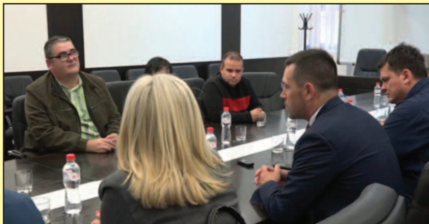
Краљево на добром путу да особама са инвалидитетом створи добро окружење