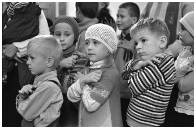
Верска настава има задатак да допринесе формирању одговорних људских бића

У основи верске наставе јесте њена реализација на квалитетан начин те стога она има задатак да до-