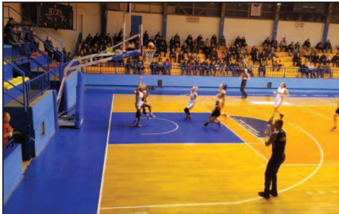
Без неизвесности у кутији шибица-детал са утакмице Краљего-Орлови