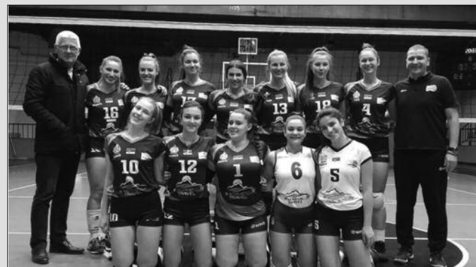
Водећи тим на друголигашком западу-ОК Гимназијалац