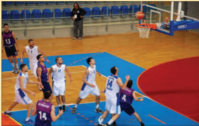
Остали дужни навијачима-дета са утакмице Слога-Фер Плеј

- Лига је дуга, биће ту још промена. За сада доминира крагујевачки Рад-