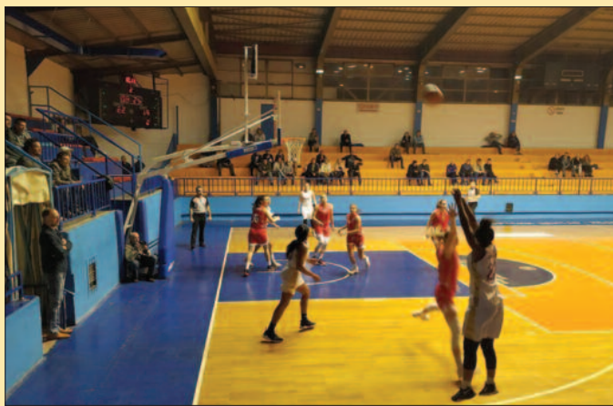
Кошаркашице славиле у Нишу-детал са утакмице ЖКК Краљево