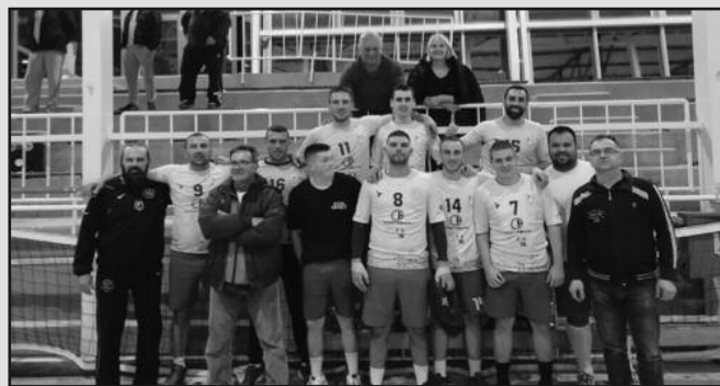
Вредни бодови из Тополе-рукометаша Металца после утакмице са Карађорђем

Сала: ОШ „Карађорђе“ у Тополи Гледалаца: 100 Судије: Јовановић и Петровић Искључења: Карађорђе 4 минута, Металац 10 минута Седмерици: Карађорђе 1(1), Металац 2 (0) КАРАЂОРЂЕ: Стјепановић, Ђури-