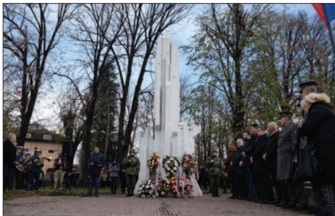
Поводом Дана ослобођења венци положени на Споменик ослободиоцима