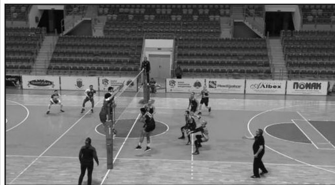
Детаљ са једне утакмице Рибнице 2

Претходног викенда одигране су утакмице 6. кола Друге лиге група „Запад“ за одбојкаше. Техничар је у Краљеву поражен од Грачаца резултатом 0-3 (11-25, 22-25, 22-25) у мечу у коме су домаћи одиграли веома слабо, док су десетковани гости лакше од очекиваног стигли до целог плена.