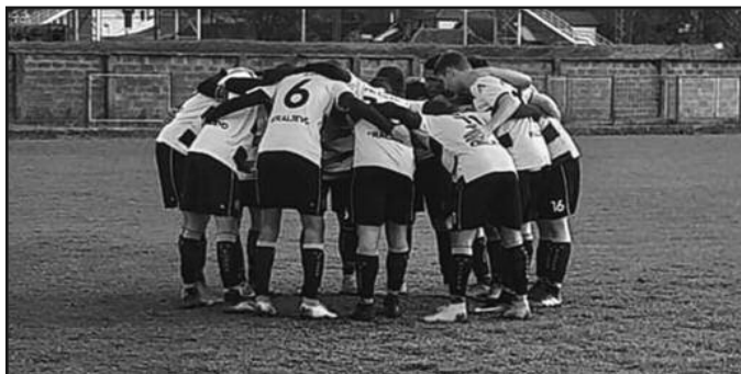
Одлични седми ове јесени-кадети Кикера