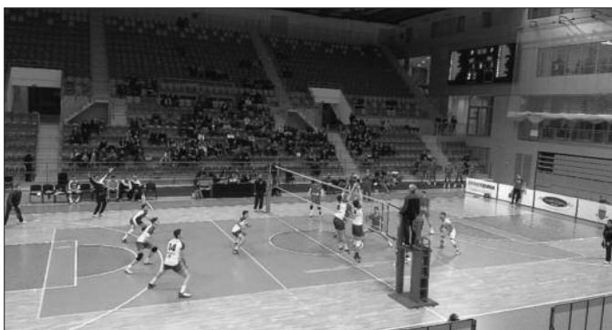
Рибница поражена од Црвене звезде у Београду

Испустили смо први сет и без обзира како се одвијао меч даље, утисак је да смо утакмицу изгубили у том делу игре. Просто нисмо имали концентрације за више и боље, у тај брек су пресудиле неке грешке које не би смеле да