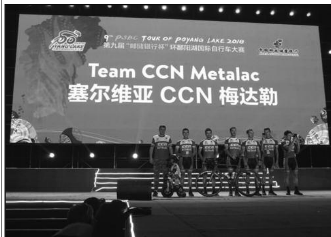
Бициклисти Металца на турнеји по Кини

Бициклисти краљевачког Металца завршили су турнеју по кини у оквиру које су наступили на две етапе и једној једноднев-ној трци. Што у авиону, возу, што на бицикли, краљевачки бицик-листи су прешли преко 10 хиљада километара, мењали временске и климатске зоне у најмногољуд-ној земљи света.