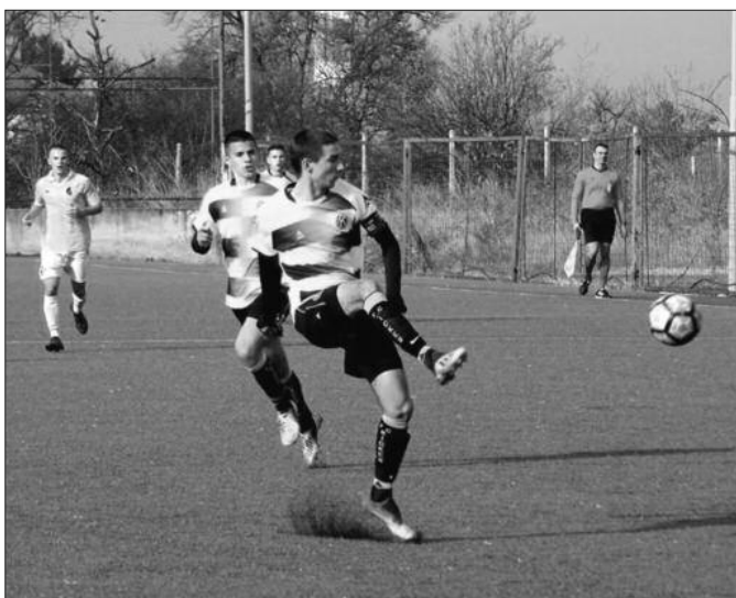
Кикер без бодова у Земуну