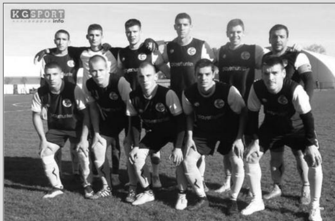
Чекајући одлуку-фудбалери Шумадије 1903 из Крагујевца

РЕЗУЛТАТИ 15. кола: Шумадија 1903-Полет 4-2, Омладинац-Нови Пазар 1928 1-2,