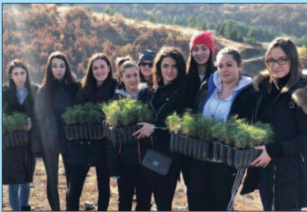
Омладинци истичу да раде нешто корисно за своје суграђане

- Омладинци Српске напредне странке су препознали значај ове акције у смену очувања околине града Краљева. Имајући у виду да шума има немерљив значај за живот људи и очување планете Земље, ако посадимо дрво, благодети дрвета осетиће, не само наши унучици, него и праунучици. Због тога је веома битно да у овакве акције спојимо све генерације, од петогодишњака, нас омладинаца, па све до пензионера. Мени је задовољство