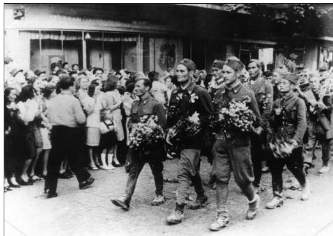
Првог јутра ослободиоци су положили цвеће на хумке стрељаних

У ноћи 28/29 новембар, испред града, на десну обалу Ибра, избијају јединице 4. црногорске бригаде и у садејству са осталим јединицама НОВ и Црвене армије, прелазе Ибар и заузимају делове око порушеног гвозденог моста. Услед великог офанзивног притиска јединица НОВ и снага Црвене армије, штаб 34. немачког