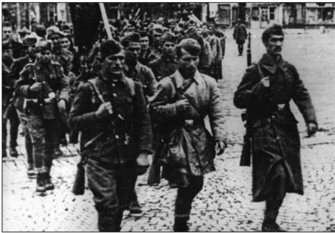
Борбе за ослобођење Краљева трајале су месец и по дана

Концентрација немачке војне силе, нарочито на линији Врпска ада - Метикоши - Трешњари - Крушевица - Лојаник (кота 335) условили су да завршне борбе за ослобођење Краљева буду за ослободилачке јединице тешке, непрекидне и исцрпљујуће у