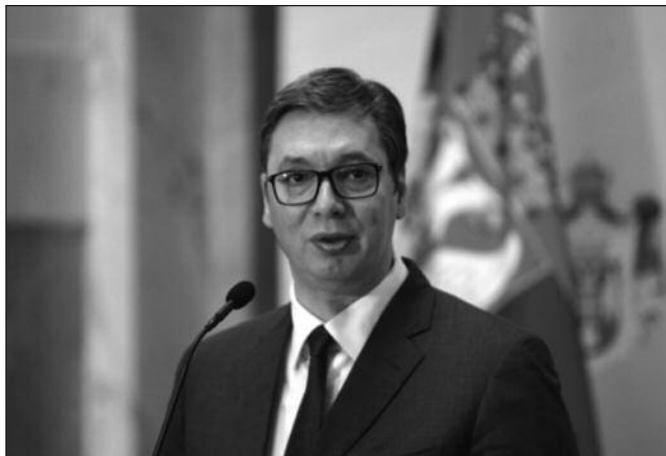
Александар Вучић, председник Србије

Нагласио је рекао да деца у Србији немају времена за чекање, а да немају ни средњовечни људи, наводећи да данас из региона не одлазе само млади, већ сви који могу да добију већу плату - од возача аутобуса, заваривача, бравара. Вучић је приметио да се земље у региону "лажу празним бројкама", док се регион испразнио, па је у државама остало мање људи него што показују званични подаци, те поручио да је за останак мла-