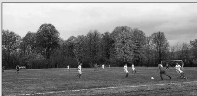
Детаљ са утакмице фудбалера Старе Чаршије

РЕЗУЛТАТИ 13. кола: Будућ-ност (С)-БСК 2014 2-1, Шумадија-