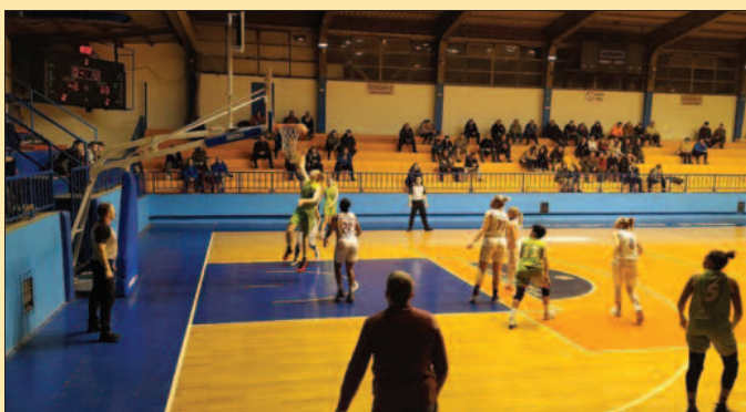
Чекајући нови меч у кутији шибица-детал са утакмице кошаркашица

-Прве утакмице после паузе су увек тешке, али нама је предах добро дошао. Видело се да је тим уморан, одиграли