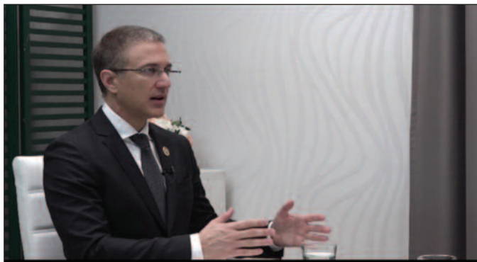
Др Небојша Стефановић, министар унутрашњих послова

Ја сам пре две године иницирао да деца која похађају први, четврти и шести разред добију едукацију од полицајаца о њиховој безбедности, посебно о безбедности у саобраћају, затим како да буду безбеднији у ванредним ситуацијама, какав је наш одговор