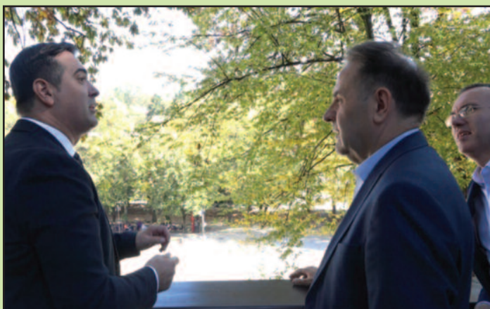
Председник општине Бобан Ђуровић и министар Расим Љајић

– Бања постаје заиста један бисер, у правом смислу те речи, бањског туризма у Србији. У овој години је најпосећенија бања по броју остварених ноћења и друга најпосећенија локација у нашој земљи, после Београда и тај статус није случајно условно речено