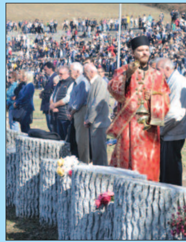
Свештеници Епархије Жичке одржали парас

После Комеморативне седнице испред зграде Градске управе формирана је поворка и још једном се пошло путем где су хиљаде невиних цивила начинили своје последње ко-