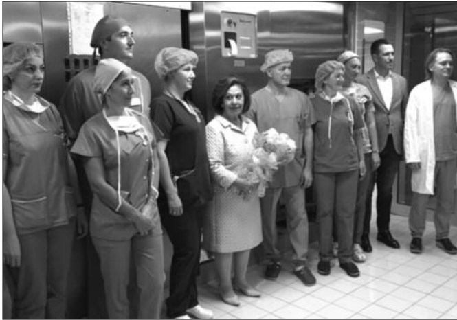
Принцеза Катарина истакла да су здравствени радници понос наше земље

-Наши доктори, наше медицинске сестре и сви здравствени радници су понос наше земље. Својим напорним радом, својим знањем и својом борбом за сваког пацијента заслужују нашу велику захвалност и помоћ. Ви сте у фокусу хуманитарног рада моје Фондације већ 25 година и тако ће остати и у будућности. Знање је баш као и опрема важна за врхунске резултате у медицини и ми зато помажемо да здравствени радници од нас поред опреме усавршавају и своје знање. Морам да кажем да има много народа који су пореклом Срби,