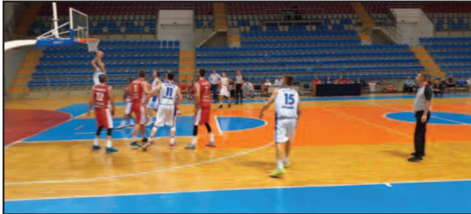
Детаљ са утакмице Слога-Пролетер