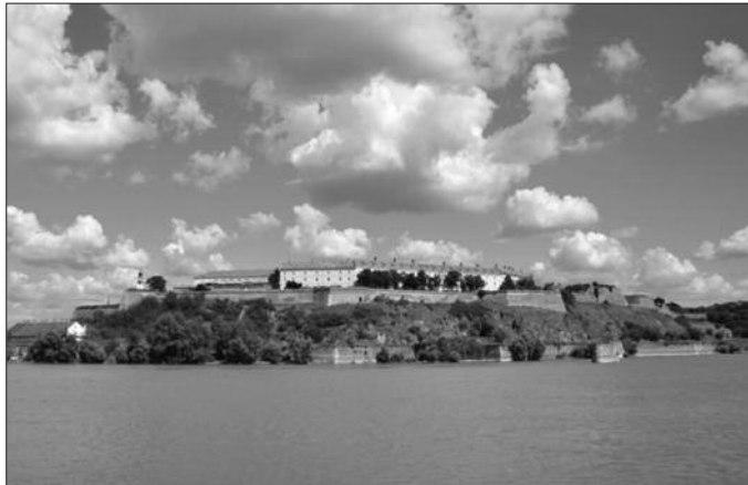
Петроварадинска тврђава данас

1692. - Почела градња Петроварадинске тврђаве у Новом Саду. Камен-темељац Петроварадинске тврђаве положио је аустријски принц Крој. Изградња је трајала пуних 88 година, до 1780, по пројекту француског војног архитекте Себастијана Вобана, а гра-