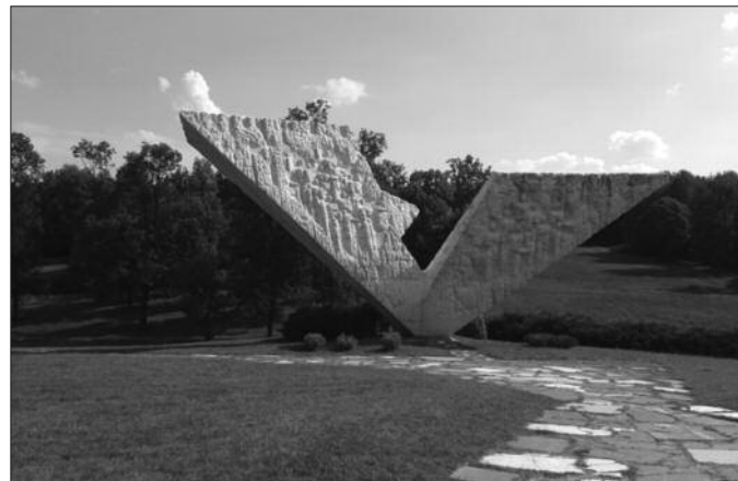
Споменик стрељаним ђацима у крагујевачким Шумарицама

1887. - Рођен Димитрије Митровић, књижевни критичар, уредник "Босанске виле", члан "Младе