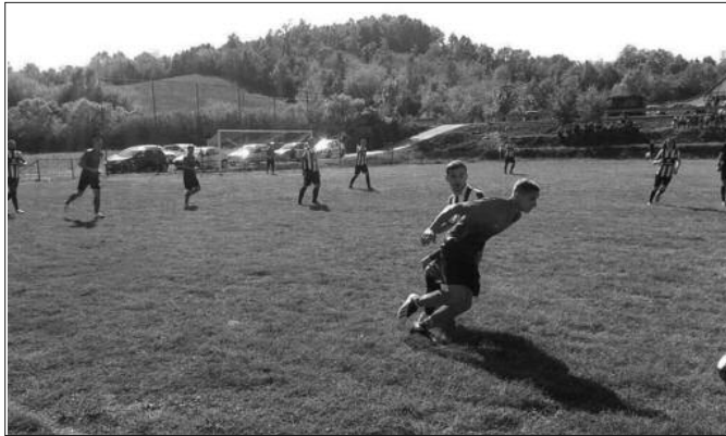
Победа за очување трона-детал са утакмице Пролетер-Рудар

ПАРОВИ 11. кола: Млади Радник 1925-Матаруге, Младост (В)-Карађорђе, Рудар-Поповићи Врњци (субота), Будућност-Краљево