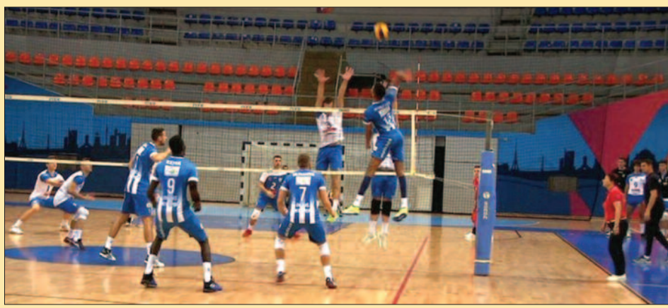
Нишлије убедљиве против мускетара-детал са утакмице из дворане Чаир