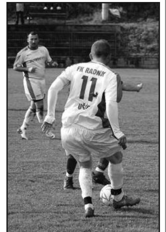
Дочекали први тријумф-детал са утакмице Радника из Ушћа

ПАРОВИ 10. кола: Гоч-Бане 1931 (субота), Полет-Омладинац, Реал-Радник, ОФК Рас-Будућност, Водојажа-Звечан, Нови Пазар 1928-Шумадија 1903, Шумадија (Т)-Аполон 2018, Корићани-Гружа.