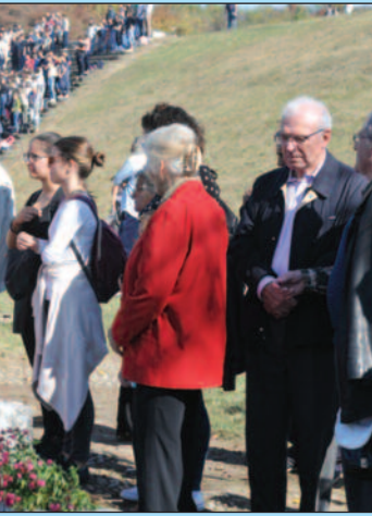
Тос и помолили се за спас душа стрељаних

Године припадници регуларне немачке армије стреляли су неколико хиљада невиних цивила подно Грдичке косе