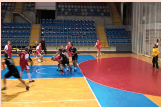
Детал са утакмице рукометаша Металца

кулић 2, Прибаковић 4, Симовић 1, Јовановић 8, Томић, Делић, Симић, Николић, Гајић, Вукадиновић 4, Марић 2, Миловановић Тренер: М. Жуњанин