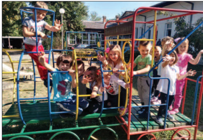
Међународни дан деце обележен и у Врњачкој Бањи

Прошле године је у присуству министарке без портфеља задужене за демографију и популациону политику, Славице Ђукић Дејановић, свечано отворен комплетно реновиран објекат у