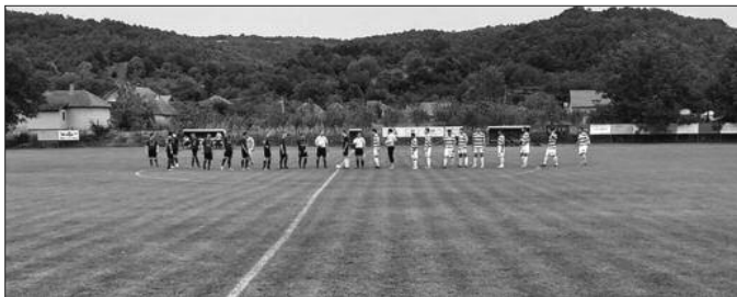
Вредна победа зонаша из Ковача-деталј пред почетак утакмице Будућност-Аполон

Претходног викенда одигране су утакмице 2. кола Шумадијско-Рашке фудбалске зоне. Стрелци су били врло расположени, на осам утакмица постигнуто је 37 голова, а највише је уживала публика у Ратини и Подунавцима. Полет је после старта ремија у Врњачкој Бањи, на премијери пред својим навијачима победио новајлију из Звечана, минимално иако су навијачи видели седам голова и то све у првих 45 минута. Реал је освојени бод у гостима на старту сезоне потврдио убедљивом победом против гостију из Топонице. Шест лопти је спаковано у мрежу вратара Шумадије, екипе која је у првом колу постигла 9 голова. Прави дерби