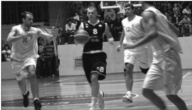
Црно-белирадо виђени у Краљеву-детал са једног од последњих дуела Слоге и Партизана

- Када почну припреме и када се прави план одигравања контролних