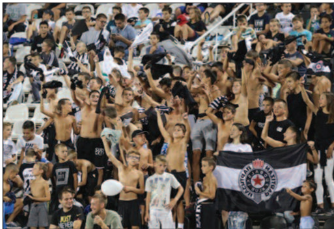
Хоће ли трибине на стадионима бити све пуније или све празније?

Министарка је нагласила да су подржана и 22 млада брачна пара кроз суфинансирање кућа и станова, те да ће се, осим крова над главом, суфинансирати и започињање сопственог бизниса за младе брачне парове у руралним срединама. Такође, како је додала, средства су обезбеђена и за 22 возила и бицикле за службу патронаже у домовима здравља, као и за неопходну медицинску опрему за унапређење услова рада у организационим јединицама за гинекологију здравствених установа. Већа пажња посвећена је саветовалишном раду, посебно у погледу репродуктивног здравља, едукације адолесцената, васпитача у предшколским установама, саветовалишта за рани развој детета и за унапређивање родитељских компетенција и развијање партнерства у развоју деце, едукације жена на селу, промоцију очинства и едукацију