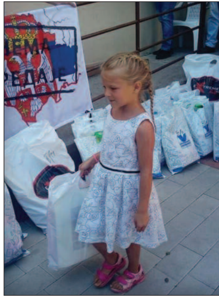
Обезбеђен школски прибор и одећа