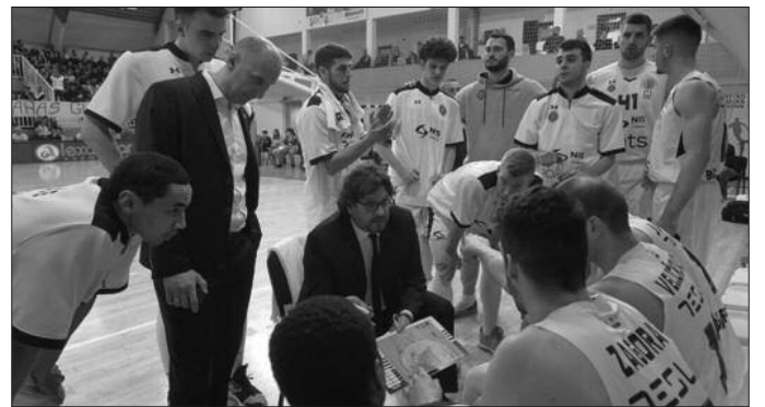
Предвођени тренером Транкијеријем кошаркаши Партизана у суботу у Краљеву

кође у рангу великих утакмица, клуб из Бара је међу најбољима у АБА лиги, сада силно појачан и биће привилегија видети их и играти против