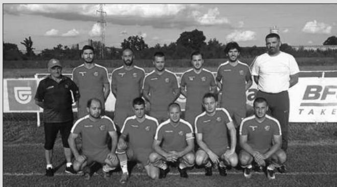
Без голова у дербију-фудбалери Младости из Врдиле

На теренима Окружне фудбалске лиге претходног викенда одигране су утакмице 2. кола, а виђено је много узбуђења и изненађења. Дојучерашњи зонаш Карађорђе славио је у Грачацу и одмах запосео челну позицију на табели. Исто учинак има и Пролетер који је у Печеногу тесно победио комшије из Витановца. Дерби кола је одигран у Врдилима где су Младост и Тавник одиграли без голова. Гранит је на старту сезоне примио осам голова у Тавнику, али је на другом узастопном гостовању славио изненадивши „хајдуке“ у Јарчујаку. У Баљевцу је гостовала одлична Будућност из Конарева, а меч је завршен без победника, док је у Матарушкој Бањи одигран вечити месни дерби. Матаруге су до