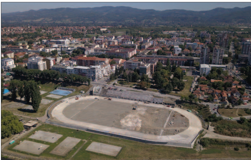
Да ли ће и нови рок за завршетак радова на фудбалском стадиону бити испоштован?

-Ја се искрено надам да ће атлетски стадион до краја године бити завршен. Радови касне делом због лошег пројекта, делом због непредвиђених радова који су се појавили у самој реконструкцији, а делом и због тога што је Закон о јавним набавкама јасан и изричит. Оног тренутка када уочите непредвиђене радове на градилишту тог тренутка морате да обуставите радове и да се обратите