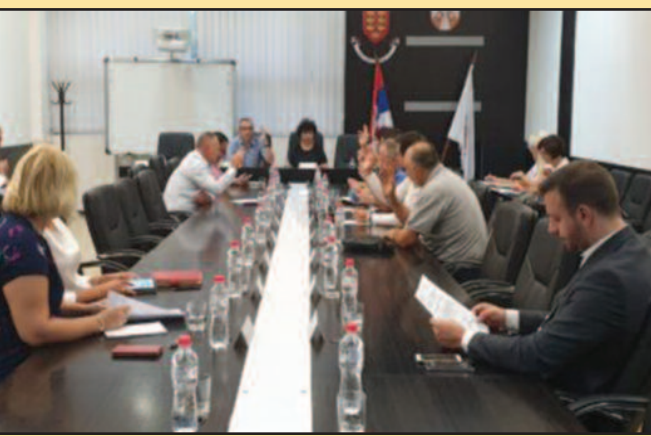
Средства за инфраструктуру у сеоским месним заједницама

За изградњу канализације у Чибуковцу, Јарчујаку, Жичи и Ковачима издвојено 10.600.000 динара, док за изградњу јавне расвете у некатегорисаних путева у селима издвојено 5.000.000 динара, а за изградњу јавне расвете