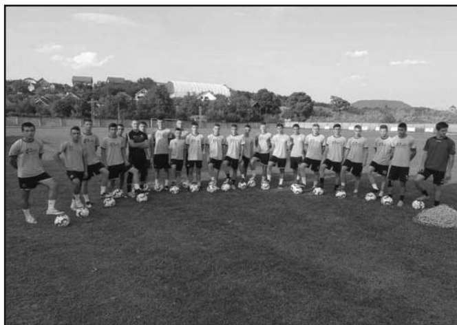
Стигли са бодовима из Вршца-кадети краљевачког Кикера