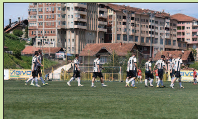
Међу фаворитима за улазак у виши ранг-фудбалери Коштам Поља

• Ове сезоне 14 клубова ће играти у јединственој лиги • Добро упућени очекују да се пола лиге бори за улазак у виши ранг.