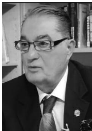
Генерал Небојша Павковић

Захваљујући правовременим одлукама, јединице 3.А су спремно дочекале почетак агресије и организовале одбрану, на правцу главног удара 19 најразвијенијих земаља света, више стотина пута надмоћнијих, које су користиле најсавременије оружје које је свет до тада није упознао.