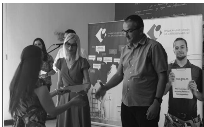
Пара имало само за половину заинтересованих предузетника

-Влада веома велико интересовање за покретање предузетништва на територији Града Краљева и надамо се да ће и град и институције које су данас са нама, а међу њима су Регионална привредна комора Моравичког и Рашког управног округа, Удружење пословних жена Краљева „Илинка Илић“ и Регионална развојна агенција Моравичког и Рашког округа, уз стручну подршку, подстаћи и покретање, и развој и опстанак предузетништва. Најзаступљеније делатности су производња, интелектуалне и здравствене услуге, производно и услужно занатство, али и друге делатности. Велики проценат жена се определио да покрене сопствени бизнис, велики број младих, тако да је заступљено омладинско, женско, али и породично предузетништво. Акцент