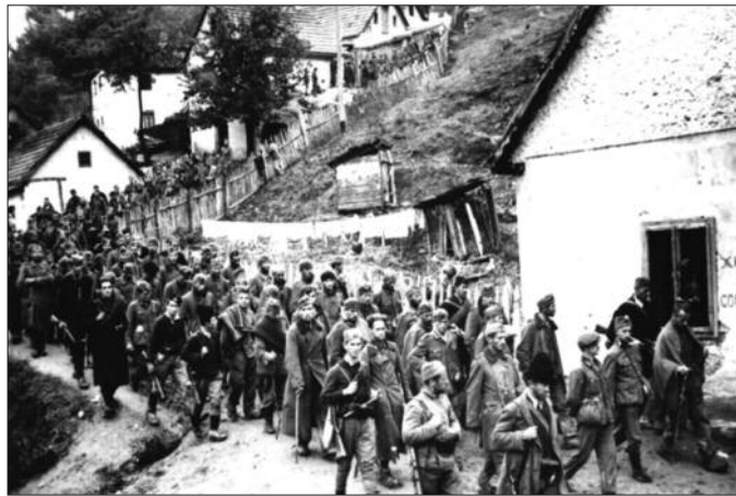
Немачки заробљеници у Ужицу

1990. - Скупштина СР Србије усвојила Закон о престанку рада Скупштине и Извршног већа Косова због