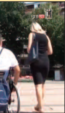
Инвалидитем морају саме да плаћају

Администрација, јер увек за вас то мора урадити неко други, сами не можете. Требало би то свести на писаним документима, јер другачије представља замор за читаву породицу, па и нас инвалиде, истиче