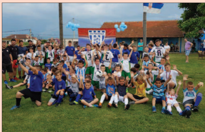
Заједничка фотографија фудбалских нада ФК „Рибница“ и ФК „Рудар“

Представници ФК „Рибница“ из Јовца организовали су крајем јуна први „Видовдански турнир“ у две категорије. Такмичили су се дечаци рођени 2004. и 2008. године. У обе конкуренције победу је однела екипа ФК „Рудар“ из Косовске Митровице, која је онедавно потписала пословно-техничку сарадњу са актуелним прваком државе Црвеном звездом. Код старијих дечака, рођених 2004. године за треће место успешнији су били чланови Фудбалског клуба „Ма-