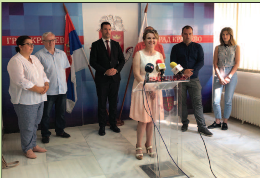
И гости из Чикага и домаћини из Краљева очекују успешан наставак ове сарадње

Управо захваљујући карановчанима ова посета би могла прерасти у нешто традиционално, а своје утиске о нашем граду и очекивања поделили су са нама