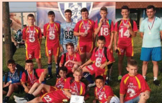
Млади фудбалери „Минерала“ окићени сребрним медаљама

- Нисам незадовољан, јер је у овим категоријама била изузетна конкуренција, а Металац нема комплетну екипу код јуниора и кадета. Ту су нам измакла два трећа места, али најбитније је да ови момци вредно раде и обојица ће врло брзо показати да спадају у сам врх