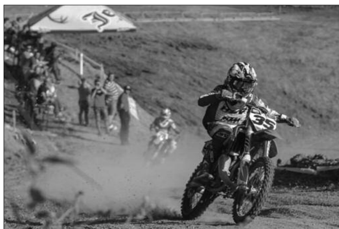
У краљевачком клубу велику пажњу посвећују најмлађим возачима

–Посебну пажњу желимо да посветимо нашим најмлађим чла-