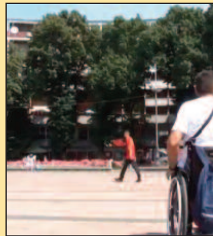
Проблем су и трошкови које особе са инвалидитетом

Правилник о медицинско-техничким помагалима која се обезбеђују из здравствених осигурања предвиђа право на приступ помагалима у здравственој заштити у зависности од типа инвалидитета. Правилник предвиђа обезбеђивање протеза за горње и доње екстремитете, ортозе, ортопедске ципеле, инвалидска колица, штаке. Особе са инвалидитетом у овом случају према подацима из 2014. године плаћале су висину партиципације 10 одсто од