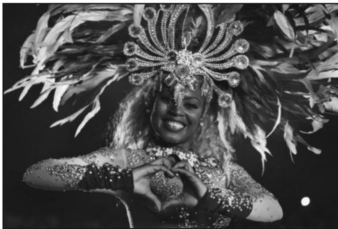
Бразилке ће и ове године зачинити фестивал