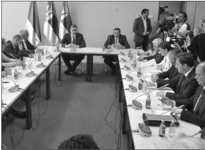
Помагаћемо нашем народу на очувању српског језика и писма

То, додао је, не говори о намери оних који су добро желели свом народу, већ о томе шта је било реално, могуће и објективно, и шта је ишло у корак са временом. Нисмо разумели свет и друге