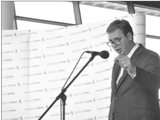
Председник Вучић: Сами стварамо своју будућност и одлучујемо о њој

-Ако сагледамо где се данас налазимо, чини ми се да ћемо лако да извучемо поуке за будућност. Данас ми морамо да бирамо, као што је и тада било боље да смо учинили, не аплаузе, већ рад, аутопутеве, нове аеродроме, фабрике, раднике и нове послове као нашу будућност. Али, не одричући се