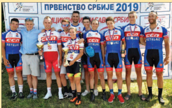
Доминација на друму-БК Металац шампион Србије за 2019. годину