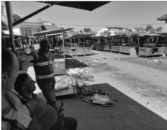
Зелену пијацу красиће модерне тезге врло лепог изгледа

–Крајњи рок за завршетак ове реконструкције и почетак рада нове пијаце је 1. септембар и може да буде само пре тога. За то време омогућили смо закупцима и грађанима