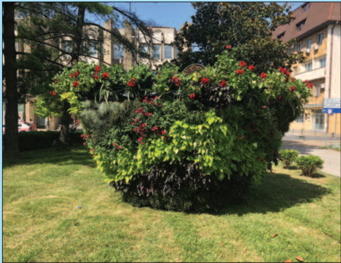
Цветни аранжман за лепшу слику нашег града

је испред трећег улаза у Градску управу необичан цветни аранжман.