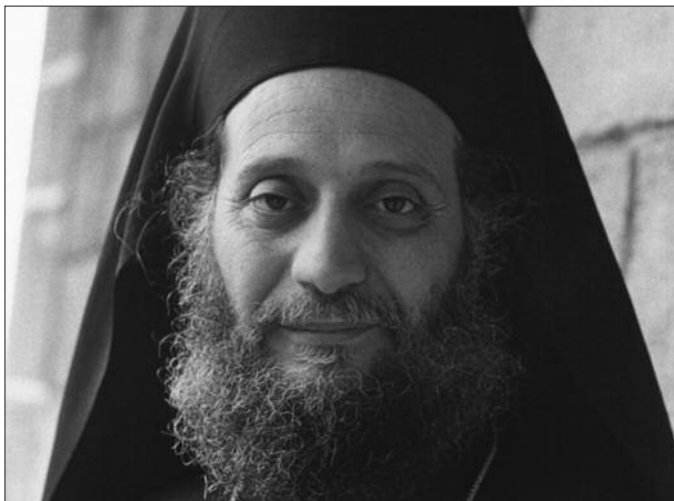
Архимандрит Емилијан светогорски

Одсуство радости значи одсуство Бога, док је радост доказ Његовог присуства! Није могуће да тамо где се преступа заповест Божија има радости, као што није могуће да уз примењивање закона Божијег постоји брига.