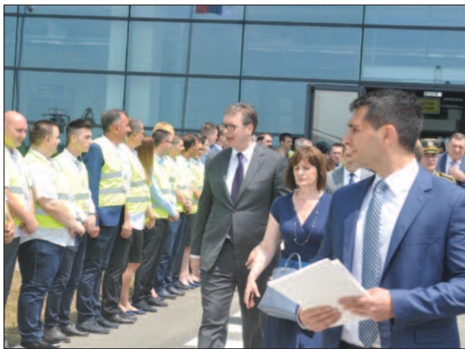
Срећан сам што ће на аеродрому педесет људи добити посао

Српска економија је на добром путу, истиче и додаје да српској економији опада јавни дуг као и незапосленост, као и да су сви други параметри веома добри, те да је веома задовољан. Вучић је навео да све што се дешава у кварталима може да се исправи и да ће Србија свакако, не рачунајући Ма-