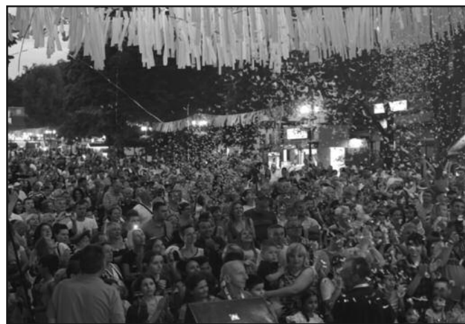
Очекује се више од 350.000 домаћих и страних посетилаца

19:45 Промоција карате клубова Врњачке Бање; Плато код