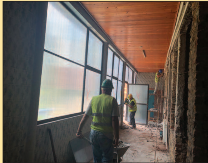
Објекат је око хиљаду квадрата и ради се комплетна реконструкција

Срце објекта Здравства 2 је базен који се комплетно рекон-