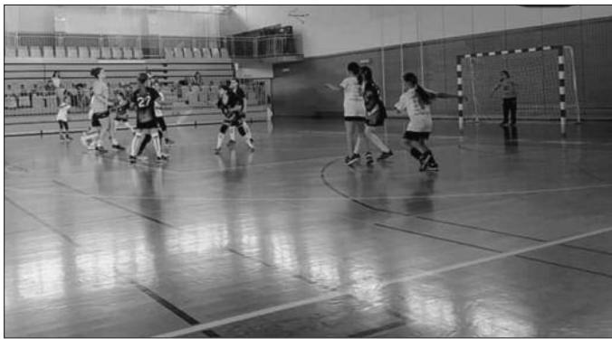
Детаљ са једне утакмице на турниру у Врхници

ниру. Овога пута позив из Врхнике „Лавице“ нису одбиле, па