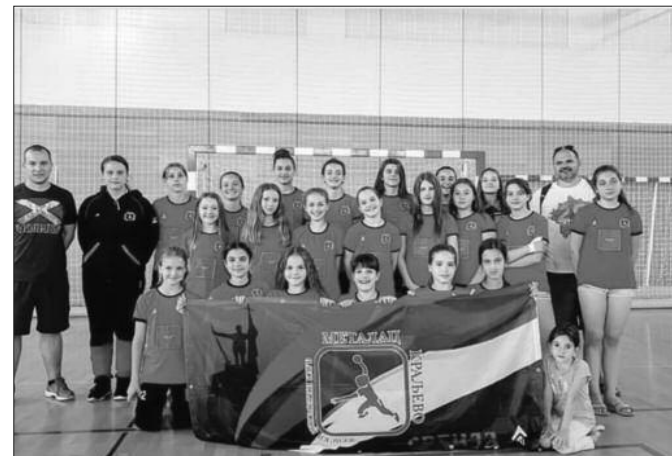
Добар наступ у Врхници рукометашица из Краљева

нерација „Лавица“ има шта да покаже у сезонама које долазе, ову децу само треба сачекати и истрпети. Искористили смо прилику у