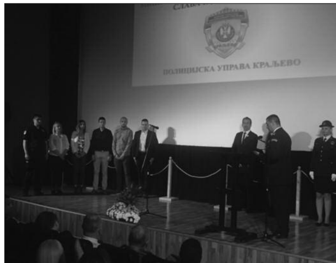
Шесторо новопримљених радника полаже заклетву

Министарства унутрашњих послова. Непосредно пре свечаности у Кварту, полицијски