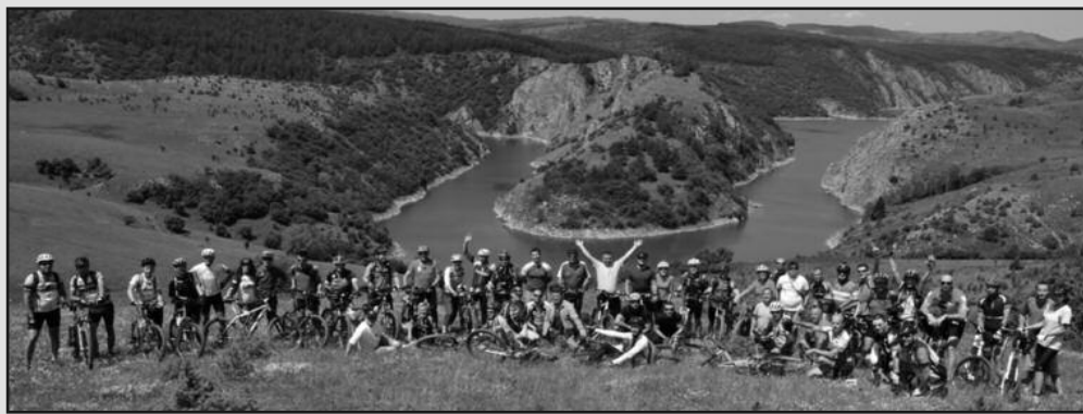
Маратон промовише туристичке и културне потенцијале Србије и Црне Горе

МТБ „Чикер“ из Краљева, у сарадњи са више од десет туристичких организација, од 2012. године организује „Чикер МТБ маратон“ чија релација сваке године полази из Краљева, а завршава се у некој од општина у Црној Гори. Прве године маратон је био део ИПА пројекта: „Бициклом кроз Србију и Црну Гору“, који је проглашен за најбољи пројекат прекограничне сарадње у 2012. години и финансиран је од стране ЕУ.