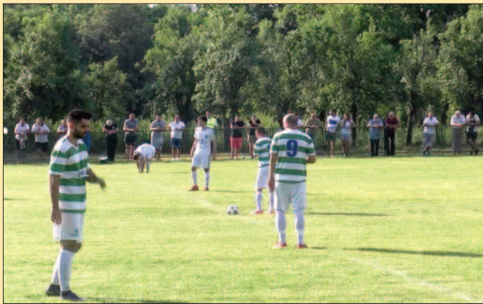
Детаљ са утакмице Будућност-Омладинац одигране у селу Ресник код Крагујевца

У баражу за попуу Шумадијско-Рашке фудбалске зоне састали су се другопласирани тимови Рашке окружне лиге (Омладинац, Ново Село) и другопласирани тим лиге Крагујевца (Будућност, Ресник). Омладинац из Новог Села је у Реснику код Крагујевца победио домаћу Будућност резултатом 1-0 и стекао лепу предност коју је потврдио у Новом Селу. У реванш мечу није било победника, али је коначних 2-2 било довољно за велико славље Новоселаца који се после три године враћају у зонски степен такмичења.