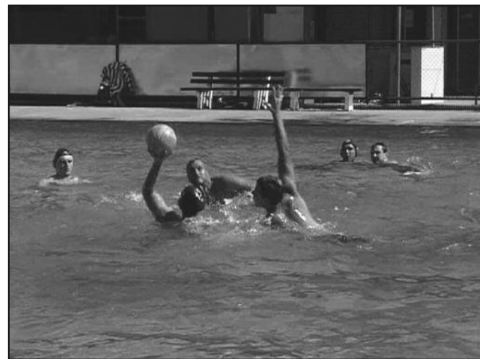
Млади добијају шансу да се боре, афирмишу и стекну неопходно искуство

дотакао и ситуације у овом краљевачком клубу. —Доста тога урађено је на инфраструктури око базена и на тај начин јесу побољшани услови за рад нашег клуба. Ми се заиста и трудимо да припремимо и обезбедимо