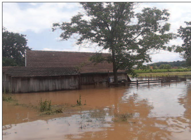
Поплавлено поврће не би требало користити за исхрану становништва