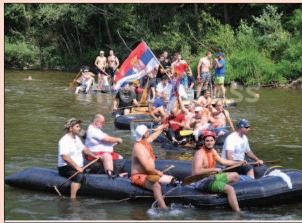
Да ли ће „Весели спуст“ бити одржан овог лета

Због ванредне ситуације која је проглашена на територији града Краљева, тридесети „Весели спуст“ неће бити одржан 30. јуна 2019. године. Ово је прошле недеље у саопштењу нагласио Организациони одбор манифестације „Весели спуст 2019“, али није чак ни наговестио да ли ће овог лета и када бити одржана ова позната туристичка манифестација.