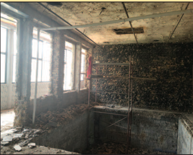
Базен ће се проширити и уградити нове цеви због агресивног сумпора