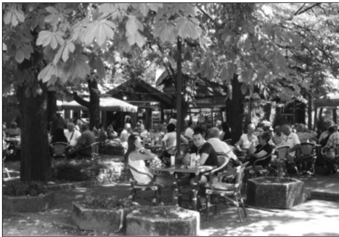
Врњачкој Бањи требају радници из области угоститељства и туризма

-Што се тиче пољопривреде, почела је и ту потражња. Оно што бих истакао јесте да се ми опредељујемо и радимо пре свега са фирмама које су регистроване, а не радимо са приватним газдинствима. Разлог томе је што власници не-регистрованих имања нису у могућности да обављају радницима уплату преко нас. Углавном радимо са хладњачама и у овом тренутку