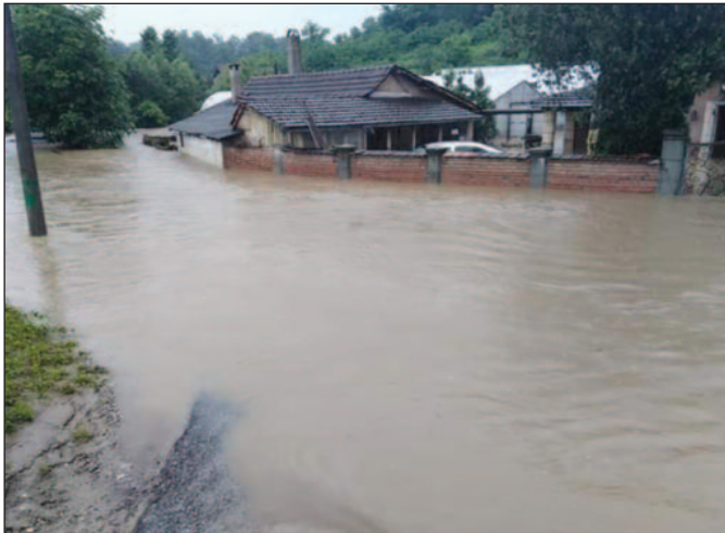
Ни висок зид није успео да заштити кућу и пластенике