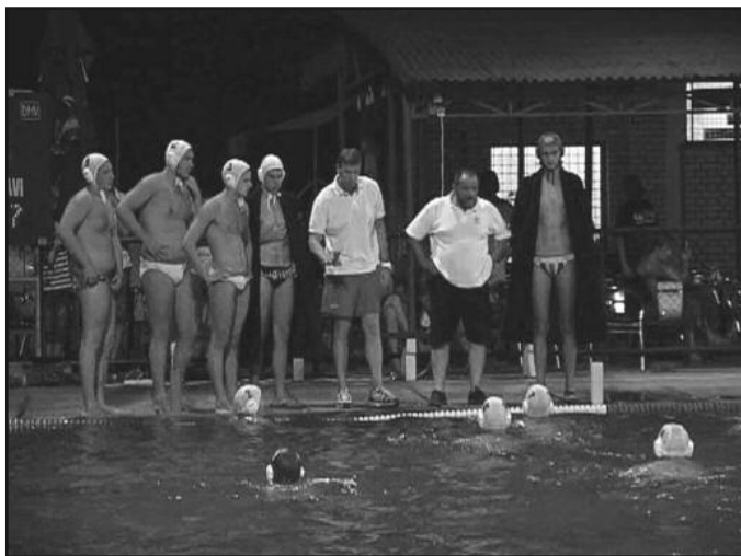
Очекује се да краљевачки дечаци буду окосница тима у наредном периоду

цију и окренуо у можда једном сасвим другом смеру у животу. А спорт је сигурно један од најважнијих фактора за млађу попула-