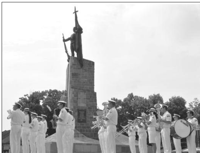
Оркестар Министарства унутрашњих послова свирао на Тргу српских ратника

- Захваљујући једном тимском и колегијалном раду полицијских службеника ПУ Краљево 2018. година је једна од најбезбеднијих година у последње три деценије. Нисмо имали ни једно убиство, само