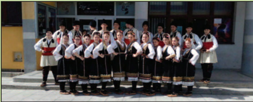
Дечји ансамбл достојно репрезентовао Краљево и Рашки округ

На Републичком такмичењу дечијих фолклорних ансамбала Србије, одржаном недавно у Ваљево, Краљево и Рашки округ представљао је дечији ансамбл Српског културног центра „Стефан Немања“ - КУД „Железничар“ из Краљева. Оцењивачка комисија коју су сачињавали наши најеминентнији кореографи, етнологи и етномузиколози, дечијој групи из Краљева доделила је сребрну плакету Савеза аматера Србије.