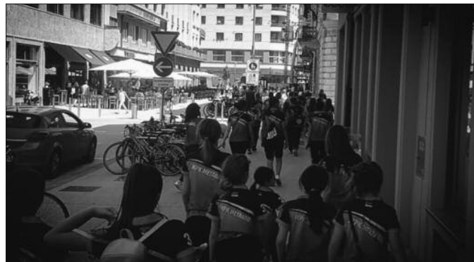
Током боравка у Словенији рукометашице Металца шетале и улицама Љубљане

И ове 2019. године маратон ће трајати 10 дана и завршиће се у Тивту, на Јадранској обали.