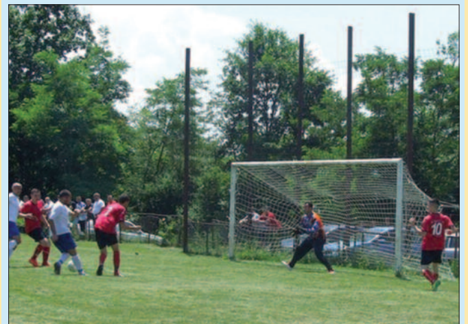
Тренутак одлуке у Милочају

У Међуопштинску фудбалску лигу Краљево пласирали су се и прваци Градске