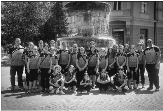
Рукометашице краљевачког Металца у Словенији на турниру

велико и позитивно искуство. Деца коју смо водили први пут се