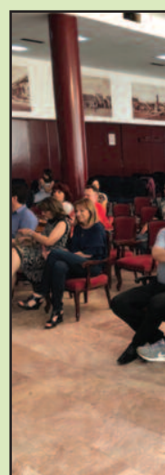
Даваоцима је д

боља. Статистика показује да је у поређењу са прошлом годином нових председника давалаштво крви