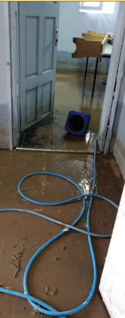
Просторије и реквизите уништио бујични поток