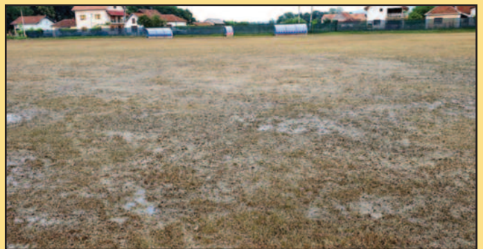
Терен у Грдици-остала само каљуга