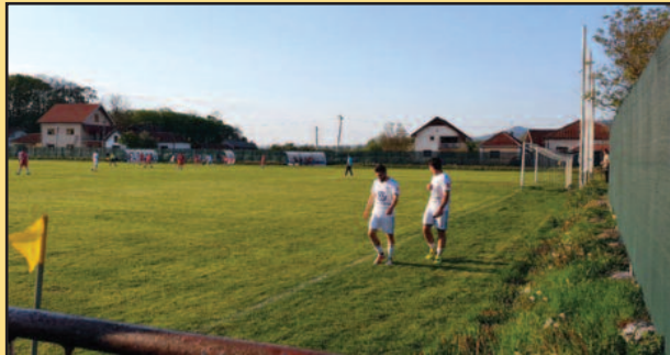
Само даљн пре поплаве изглед терена у Грдици за време првенствене утакмице