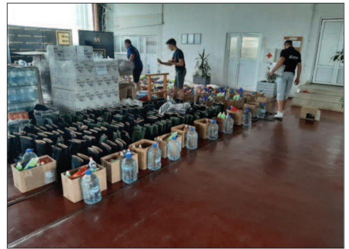
Напредњаци из Златиборског округа донели и средства потребна Штабу за ванредне ситуације

-Ми смо се прикључили нашим страначким колегама из Златиборског округа и дали свој скроман допринос, јер ми у Бајиној Башти можда најбоље знамо шта значи доживети једну овакву катастрофу. Ово