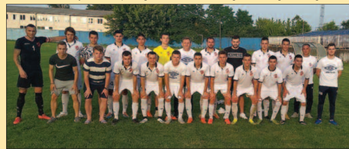
Слога на крају другопласираниа и ипак у Српској лиги