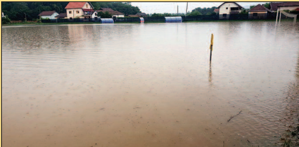
Услови за ватерполо-терен у Грдици под водом