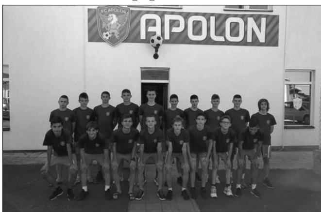
Пионери ФК А полон поражени од Партизана у полуфиналу Првенства Србије

Златибор Игралиште хотела Палисад Гледалаца: 700 Судија: Љубиша Борисављевић (Ивањница) 8 Стрелци: 1:0 Исаиловић у 37, 1:1 Јевремовић у 64, 1:2 Јевремовић у