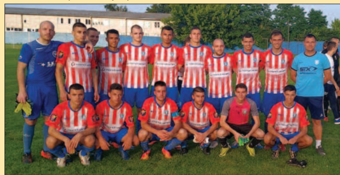
Испунили циљ и остали у зони-ФК Аполон 2018.