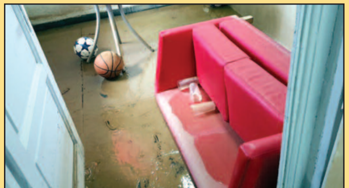
Тужна слика просторија ФК Млади радник