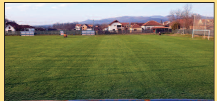
А како је било пре саме поплаве