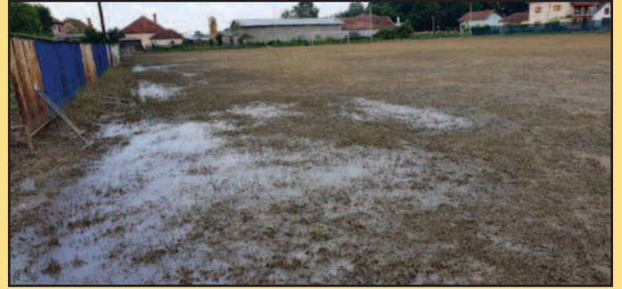
Тренутно стање терена у Грдици