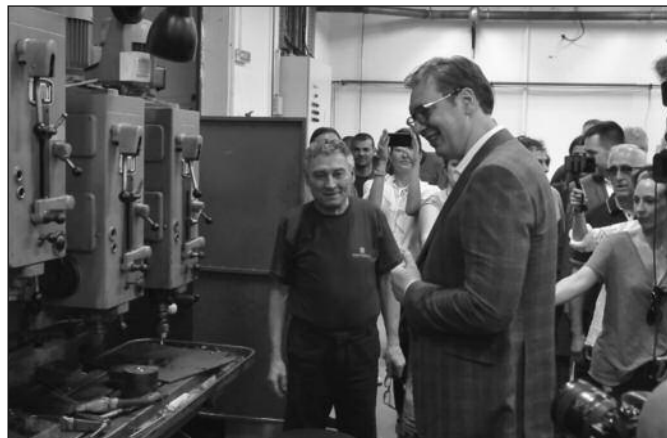
Александар Вучић у Шеовцу обишао предузеће „Радијатор“

Трговиште и наредио хитну санацију пута. Радници предузећа „Нови Пазар пут“ приступили су подасипању пута и ускоро би једина веза Трговишта и Краљева требало да буде реконструисана. Један део насеља Сирча код Краљева тешко је погођен поплавама, а бујица је однела и мост и једину везу Сирчанске бање са Краљевом. Вештом акцијом припадника 2.бр. КоВ постављен је лансирни мост преко Сирчанске реке у рекордном року. Председник Републике Србије, Александар Вучић, обишао је поплављена подручја у