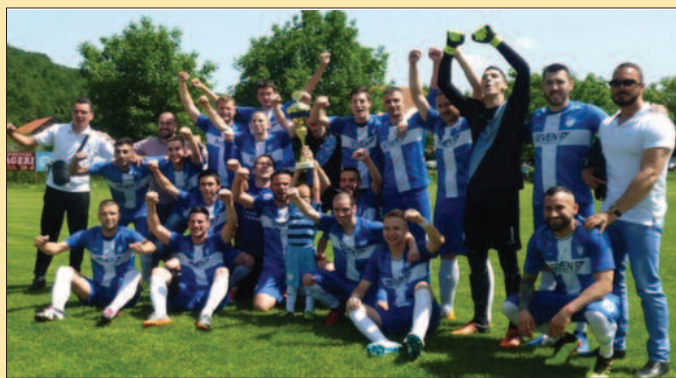
Прваци шумадијско-рашке зоне-ФК Сушица Крагујевац

Претходног викенда одигране су утакмице последњег 26. кола Шумадијско-Рашке фудбалске зоне. Није било непознаница пред ове мечеве, првак се знао од раније, као и тимови који испадају из лиге. Утакмица у Грошници није одиграна, јер се Карађорђе из Рибнице није појавио на мегдану Водојажи. Непопуларан потез „устаника“ на крају баладе и сезоне у којој су заузели последње место и враћају се у Окружну лигу. Утакмица у Гружи је трајала тек који минут у другом полувермену. Дома-