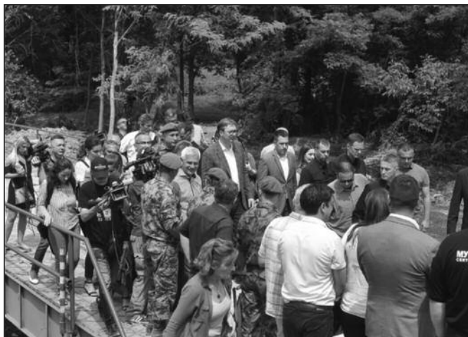
У Сирчи председника дочекали на новопостављеном лансирном мосту

-Видели сте ове људе из компанија „Вирциније“, „Гир“, „Радијатор“. Они имају око 1.200