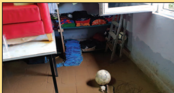
Вода до пола зида