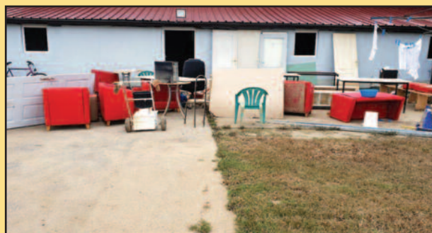
Водена стихија уништила све што је стварано и улагано