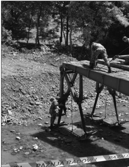
Припадници Војске Србије за сат времена поставили мост

-У МЗ Сирча првих неколико дана око 100 домаћинстава је било потпуно одсечено од света и локална самоуправа није имала на-