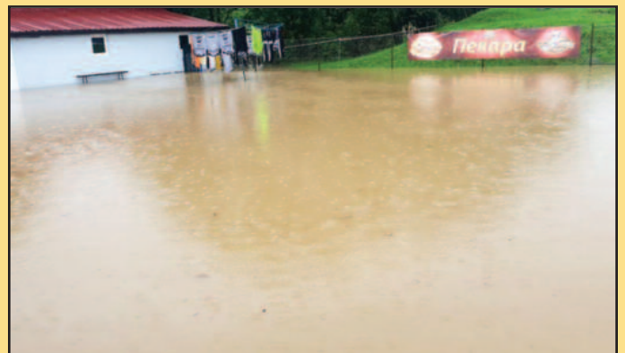
Све под водом у Грдици-деталј за време поплаве