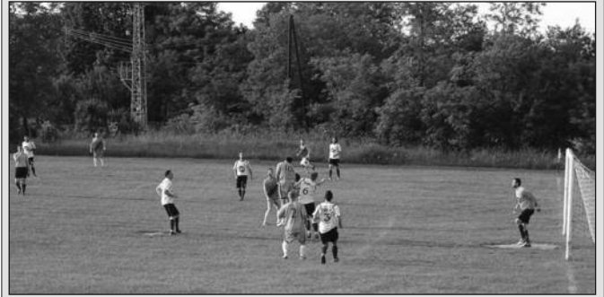
Детаљ са једне утакмице МФЛ Краљево

Утакмицама 30. кола претходног викенда завршено је првенство Међуопштинске фудбалске лиге Краљево. Младост из Врдила је са два везана пораза довела у питање освајање првог места, али су „малинари“ у Ласцу освојили бод и потврдили су да су били најбољи тим МФЛ Краљево у овој сезони. Разлога за задовољство имају и у Грдици, јер се Млади радник 1925 враћа у Окружну лигу као другопласирани. Ипак, у Грдици није било слава, јер последња поплава је уништила терен и историје крај Чађавца, па је последњи меч са гостима са Рудна одигран на Градском стадиону. Иако нису изборили улазак у Окружну лигу, Тавничани су обележили пролећну полусезону. Остварили су 13 победа и два ремија и постигли 67 голова, укупно 100 ове сезоне по чему су прави рекордери. На опроштају од на-