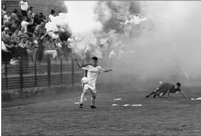
Радник у зони-фешта на утакмици у Ушћу