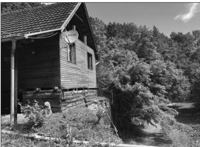
Бујица однела део плаца и дошла до темеља куће

лини Краљева који нема мира од понедељка 3. јуна када је наш град и околину погодила још једна поплава која је за собом оставила не-