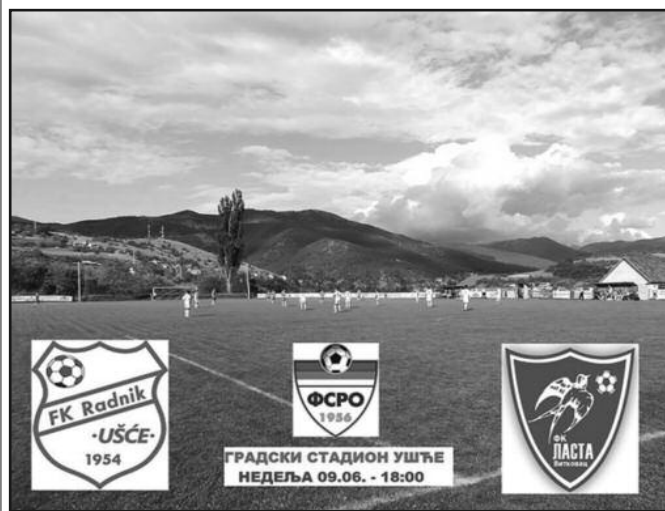
Све спремно за утакмицу деценије-платат за дуел Радника и Ласте

ције у новом зонаша. За такав епилог биће потребна победа у последњем колу у Ушћу против претпоследњепласиране Ласте. Омладинац из Новог Села је победио у Витановцу, 24 сата пре надолazeћег кишног таласа који је у међувремену потпуно полавио игралиште Груже. Овај тријумф Новоселцима је донео друго место које води у бараж за улазак у зону, а да би га сачували потребно је да у недељу победе Краљево Хајдук пред својим на-