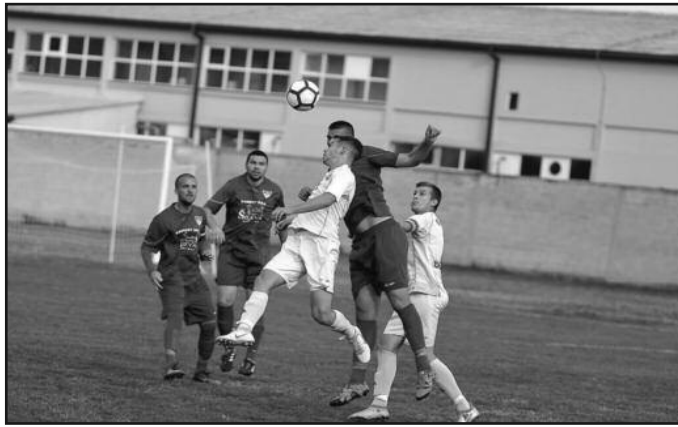
Детаљ са једне од првенствених утакмица краљевачке Слоге

На теренима Шумадијско-Рашке фудбалске зоне претходног викенда одигране су утакмице претпоследњег 25. кола. На програму је био претпоследњи краљевачки дерби, на Буњачком брду Карађорђе је угостио Полет из Ратине. За „устанике“ је постојала само теорија да могу до опстанка, али гости су одиграли зрело, ефикасно и боље од Карађорђа и заслужено славили победу резултатом 3-0. Овим тријумфом Полет је обезбедио опстанак у зони, док су „устаници“ чекирали карту у окружни степен так-