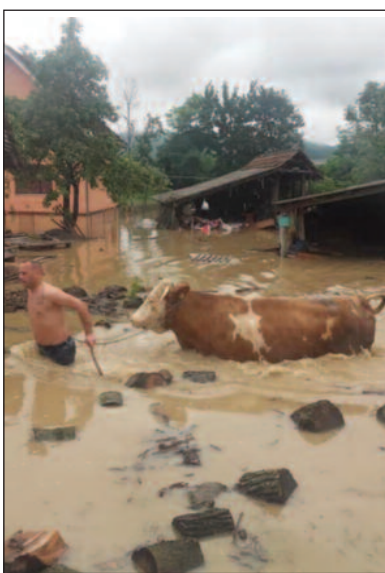
Крупна стока сачувана

шина да уколико желе да помогну да се обрате ЈП за уређивање грађевинског земљишта, а нафта за возила је обезбедијена, додаје на крају Кочовић.