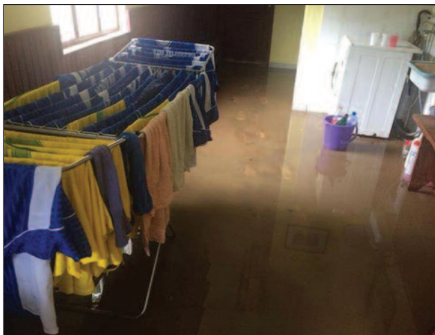
Просторије клуба поплављене