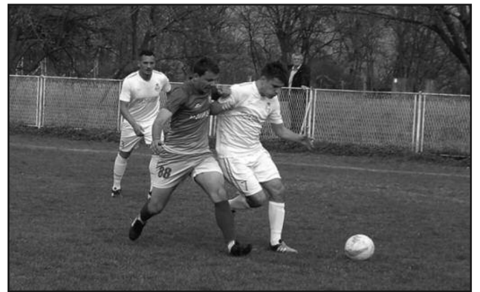
Одлука у последњем колу-детаљ са утакмице полета и реала

лиге („Војводина“ и „Исток“ већ имају по 18 клубова) доносе могућност ненаданог Слогиног напредовања. „Бели“ никада у својој