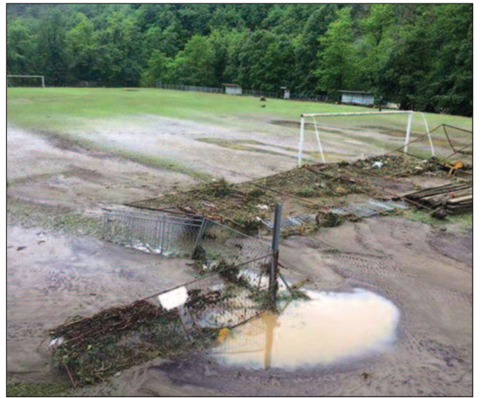
После бујице остала пустош-терен у Богutowцу