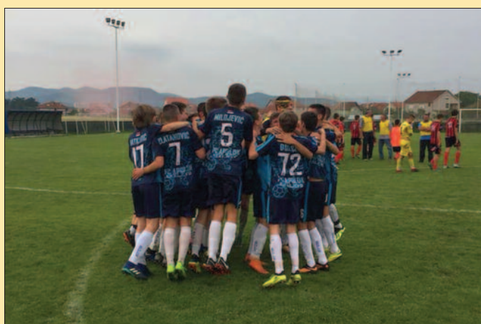
Пионири Аполона су знали да прославе победу против Слободе

- Биле су то јако добре утакмице, али смо у оба меча ми били много бољи. Треутак непажње нас је коштао и у Ужицу да примимо гол, слично је било и у реваншу у Ковачима. Деца су одлично одрадила утакмице, тактички смо играли перфектно и заслужено