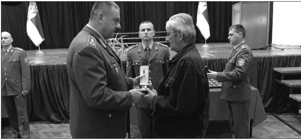
Споменице уручене родитељима погинулих припадника бригаде

—Ове године обележавамо двадесет година од НАТО агресије на Србију, односно тада СР Југославију. Након неуспешних преговора у Рамбујеу 24.марта 1999.године око 20 часова отпочело је бомбардовање наше земље. Војска се тада, као носилац одбрамбених активности, ефикасно супроставила како дејству из ваздушног простота, тако и побуну шиптарских терориста на Косову и Метохији. Били смо опремљени мање савременим наоружањем, али смо имали другу предност над непријатељем — висок морал, спретност и стручност. Припадници војске, али и народа, бра-