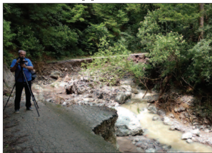
Пут потпуно уништен и неће моћи брзо да се поправи

Село Трговиште налази се на самој граници између Краљева и Крагујевца. Ова брдско село и ваздушна бања сада се налази одсечено од остатка света. Трговиштански поток који неретко лети и пресушу у последњим поплавама направио је огромну штету на путној инфраструктури. Село је сада одсечено од света и само спремни могу да пређу на другу страну, где углавном живи старачко домаћинство, па је отуд мука и већа што не постоји веза са Краљевом. Овакве поплаве се не памте у овом крају.