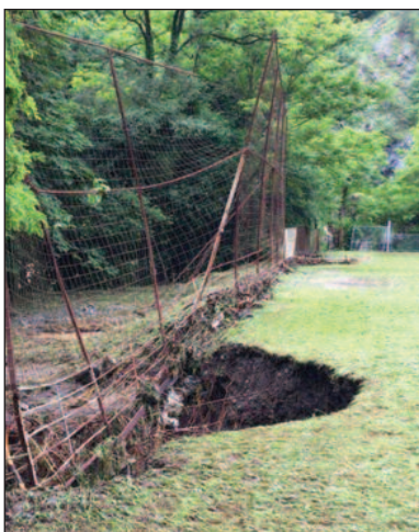
Набујала Лопатница однела део игралишта

Захваљујући помоћи бившег фудбалера Радника из Ушћа (где је долини јоргована подигнута на виши ниво и то у предвечерје утак-