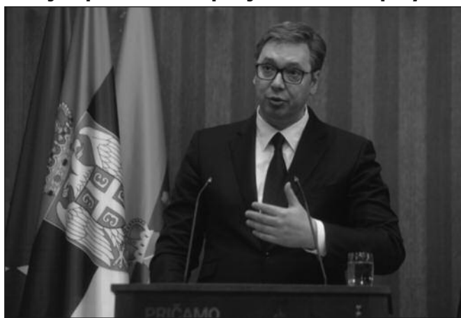
Александар Вучић, председник Србије

Вучић је рекао да је Србија отворила 16 поглавља у преговорима са ЕУ, а два привремено затворила, али и приметио да ти бројеви већини људи не значе ништа, јер они мисле да се ништа није променило. А, променило се,