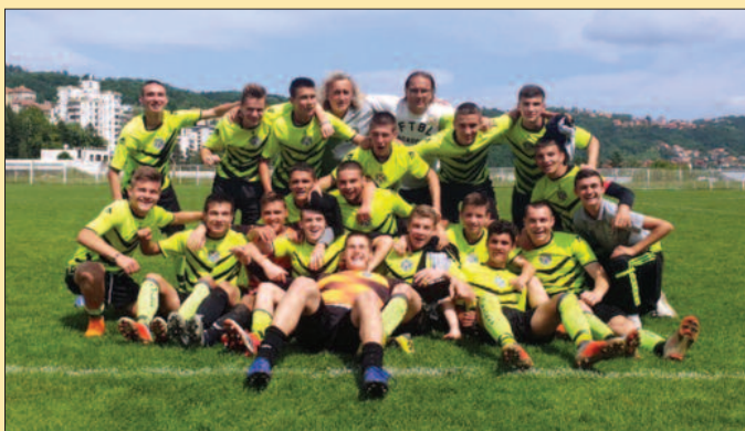
Кадети Кикера са стручним штабом славе победу у Ужицу

- Домаћи су одмах потом имали још једну коласалну шансу, погодили су статистику и ту смо имали много среће. У наставку смо ствари поставили другачије, заиграли смо много јаче, боље, квалитетније и за само пет минута стигли до изједначења и предности. Касније смо могли да слаavimo и убедљивије, али и овако је било довољно. Заслужили смо опстанак и поносан сам на дечаке које тренирам и на остварено у овој сезони –