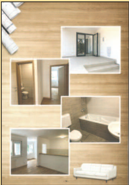
Овако ће изгледати унутрашњост станова

агенције у Воћаревим ливадама и послали Министарству финансија. Захваљујући председнику, очекујемо да ћемо добити новац за то, односно да неће бити неопходно да трошимо новац из буџета града Краљева за ову инвестицију, нагласио је Терзић. Променом закона о станоградњи за снагу безбедности, од јесени велику да конкуришу за станове сада ће имати и војни инвалиди и војни ветерани.