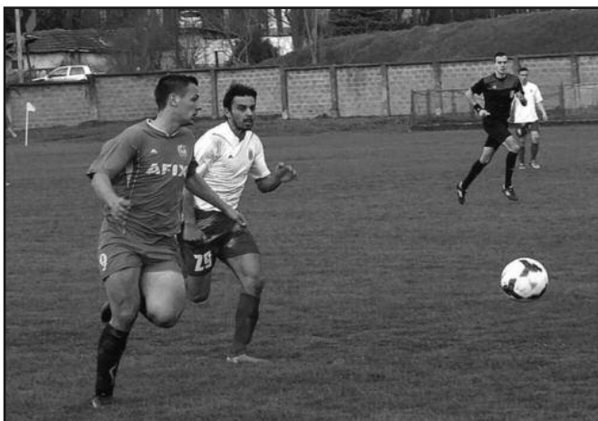
Коначно радост код Ложионице-детал са једне утакмице Металца

Утакмицама претпоследњег 29. кола претходног викенда настављено је првенство Међуопштинске фудбалске лиге Краљево. Дерби је одигран у Конареву где је лидер из Врдиле као домаћин угостио другопласиране „пекаре“ из Грдице. Иако су јесенас славили у Грдици, „малинари“ су сада добили праву шамарчину од директног конкурента који их је победио, понизио и озбиљно уздрмао трон. У случају да у последњем колу изгубе у Ласцу, а Грдичани победе код куће, Млади Радник 1925 ће освојити шампионско звање због бољег међусобног скорa. Најбоља екипа пролећа, Тавник је на Рудну са Минералом одиграо нерешено, док је у дербију зачеља Металац очекивано победио „фењераша“ из Врбе. Занимљиво да је ово прва победа Металца од 30. септембра и дуела са Јово Курсулом код Ложионице. У Вранешима је одигран буран меч са десет голова и поделом плена. Звезда је лако поразила госте из Адрана, као и Прогорелица екипу Ласца. У Богутовцу је домаћин победио госте из Метикоша, а дан касније остао без терена кога је однела набујала Лопатница. Последње коло нема већу такмичарску драж осим поменуте борбе за пехар најбољег тима, иако су и Младост и Млади Радник 1925 изборили улазак у Окружну лигу.