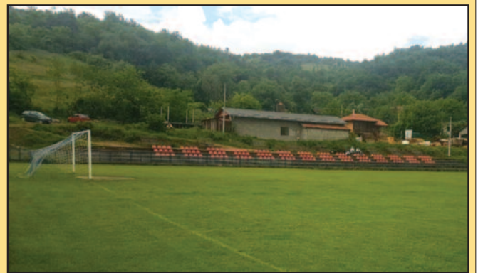
Нови амбијент за утакмицу деценије-изглед стадиона у Ушћу

Захваљујући помоћи бившег фудбалера Радника из Ушћа (где је долини јоргована подигнута на виши ниво и то у предвечерје утак-