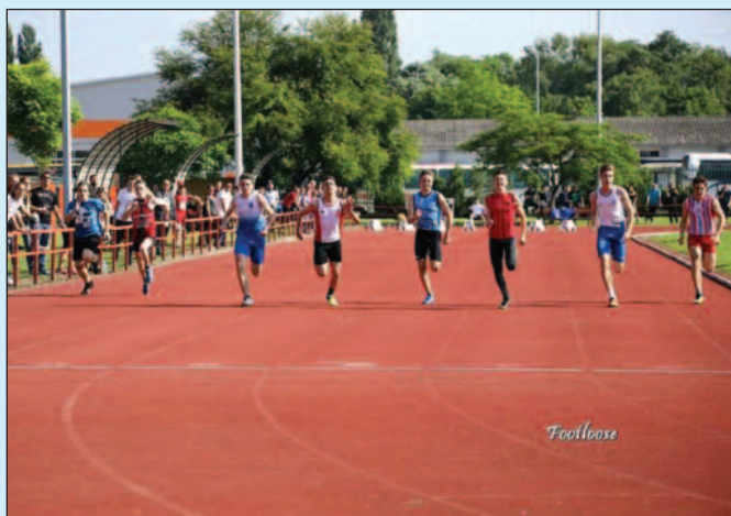
Детаљ са трке у Сремској Митровици

Краљевачки атлетичари са нестрпљењем чекају лето и от-