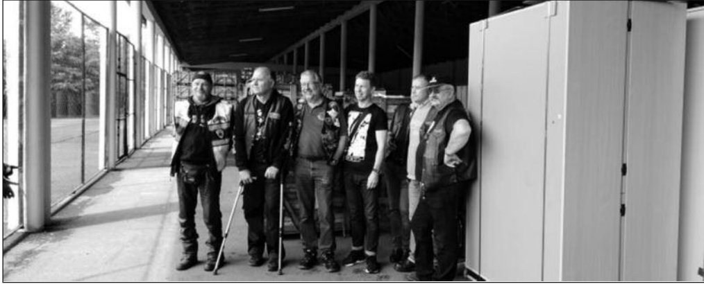
Бажкери из Немачке донаирали опрему изванредног квалитета