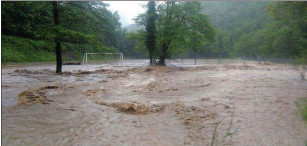
Лопатница прекрила фудбалски терен