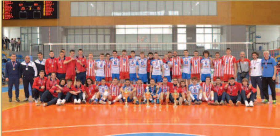
Добитници медаља на финалном турниру у Краљеву

Јуниорски шампионат Србије за одбојкаше важи за једно од најзанимљивијих такмичења, а Краљево је имало срећу и част да протеклог викенда буде домаћин завршног турнира за ову годину. Технички организатор био је ОК Рибница, један од фаворита за освајање титуле првака. У новој и старој спортској дворани такмичило се осам најбољих екипа у земљи, а Рибница је била у групи са београдском Црвеном звездом, Лаки Старом из Београда и екипом Ужица. Победе против „Ера“ и Лаки Стара су биле очекиване, али београдски „црвено-бели“ су славили са 3-1 у групном мечу и као да су најавили епилог шампионата. Рибница је после тога одиграла врхунски меч против Војводине у по-