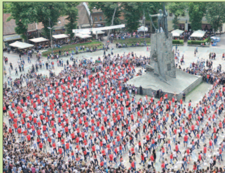
И ове године матуранти ће покушати да оборе Гинисов рекорд

плес у наш град довео је председник удружења грађана „Пријатељство за нова времена“. Од тада та манифестација је саморасла и сада је матурантима незамислив крај школске године без