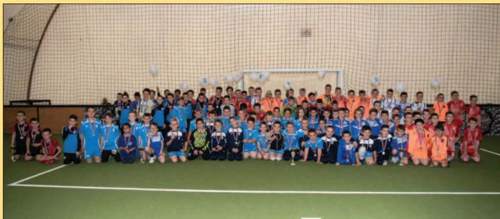
Учесници Титан Купа

омогући правилан развој и срећно детињство. Све то је могуће кроз организацију и стручни рад наше академије који је на врло високом нивоу