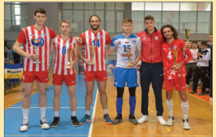
Награђени играчи по позицијама на јуниорском првенству у Краљеву

одиграних мечева, мучила се само у полуфиналу, све остало била врло доминантна. Рибница је одиграла добар турнир, одбранила вицешам-