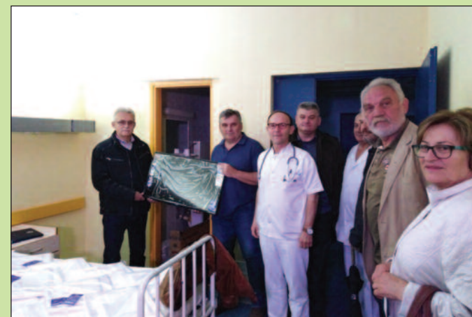
Телевизор за собу за изолацију на Дечјем одељењу

Свако треба да помогне онолико колико може, онда ће свима