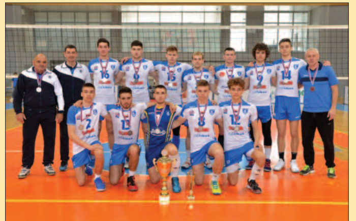
Поново вицешампиони-јуниори Рибнице

ност, нисмо издржали притисак услед велике жеље да пред својим навијачима дођемо до трофеја. Све то је утицало да делујемо летаргични у мечу са Звездом. Ипак, нема места незадовољству, остварен је успех, одличан резултат. Ово је генерација која је претходних година имала успеха и увек била међу четири најбоље у Србији у свакој млађој категорији. Круна је требало да буде шампионско звање у јуниорској конкуренцији, нисмо га остварили и живот иде даље. Долази време неке нове генерације играча. Подсетићу једино Војводина и Рибница имају екипе на финалним турнирима Првенства Србије у све три млађе селекције. То је резултат за памћење. За најбољег играча турнира про-