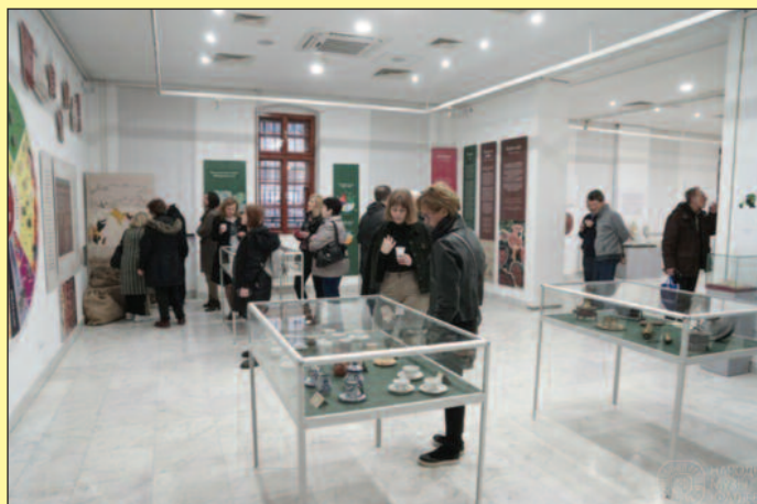
Отварање изложбе „Кафа узбудљива прича о добром укусу“