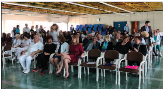
Највећи проблем је одлазак младог и стручног кадр у иностранство

„Сведоци сте да је посао медицинске сестре пун изазова, веома тежак, да је потребно непрекидно усавршавање знања и вештина, а оно што одваја медицинске сестре од других професија је хуманост и то што воле људе и воле и цене људски живот. За нас не постоје