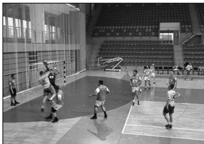
Пораз у комшијском дербију-детал са утакмице рукометаша Металца