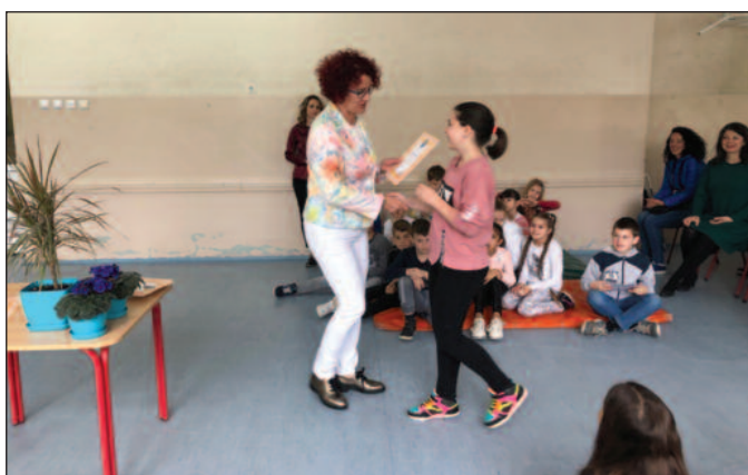
Ученицима који су се пласирали на републичка такмичења уручене похвалнице

државна народна школа Краљ Александар Први, а касније су ратна збивања довела до тога да је више пута мењала своју намену. Године 1944. почела је да ради као болница до негде педесетих година када добија данашње име Основна школа „Димитрије Туцовић“. Наставили смо да негујемо традицију наших предходника, да много радимо на усавршавању, на квалитету наставе пре свега. Морам да напоменем да су наши ученици прошле школске године били први у граду Краљеву по броју освојених бодова