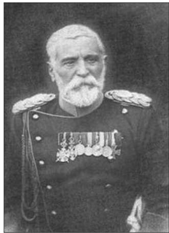
Војвода Радомир Путник

велики пораз. Противно се српској офанзиви у правцу Срема, али је на притисак владе организовао офанзиву на непријатељску територију. Након почетних успеха, због гомила непријатељских снага на Дрини, повукао је војску и спремно