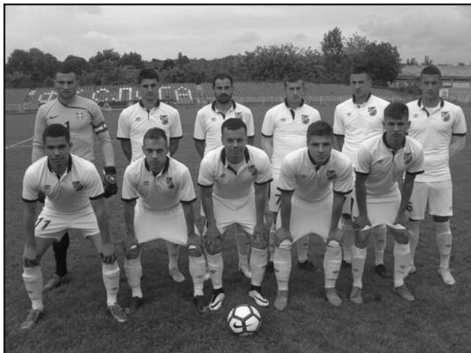
Далеко је трон-фудбалери Слоге из Краљева

На теренима Шумадијско-Рашке фудбалске зоне протеклог викенда одигране су утакмице 22. кола. Лидер из Крагујевца је у Грузи губио 2-0 на полувремену, али је успео да у наставку стигне до тријумфа. Први пратилац лидера, краљевачка Слога је гостовала у Groшници и дожи-