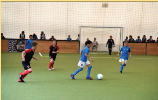
Детаљи са Титан Купа

- Велики посао смо урадили за протеклих годину дана. У академији већ тренира 300 чланова разврстаних у осам категорија са којима раде врсни тренери и педагози. Наш циљ јесте прави приступ деци, да им се