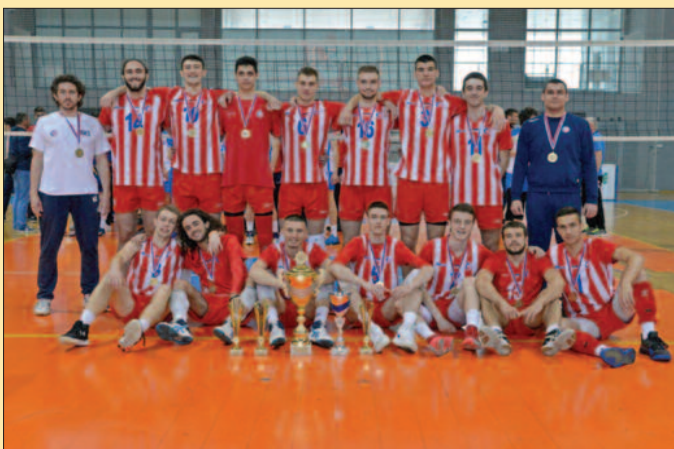
Јуниори Црвене звезде нови шампиони Србије