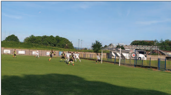
Узбуђење пред голом Партизана

На теренима Кадетске фудбалске лиге Србије претходног викенда одигране су утакмице 27. кола. Кикер је у Краљеву са вршњацима београдског Партизана одиграо нерешено 2-2. Одлична фудбалска представа на стадиону код Ложионице где су кадети Кикера и Партизана заслужили аплаузе око хиљаду гледалаца. Домаћи су у првих 25 ми-