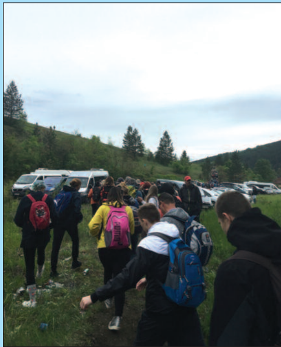
Једна од најмасовнијих манифестација у Србији

Више хиљада љубитеља природе и ове године је дошло из различитих крајева Србије, али и земаља у окру-