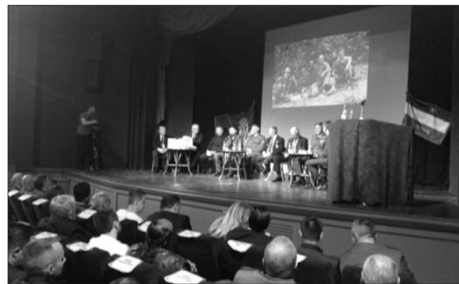
Једна од најбољих трибина о Кошарама одржана у Крушевачком позоришту

се ништа десило ни да је агресор дошао доле до Јуника и пута Ђаковица-Пећ. Ту бисмо га ми зауставили и чак је била и идеја да пустимо непријатеља да дође до Батуше и Јуника и да га уништавамо по шумама. Тако да знате да увек о томе говорите. Што се тиче одбране на Кошарама највећи терет је поднео 53. гранични батаљон и то је била јединица која најбоље познаје терен и коју нисмо могли тек тако да смеђујемо. Велику улогу и зна-