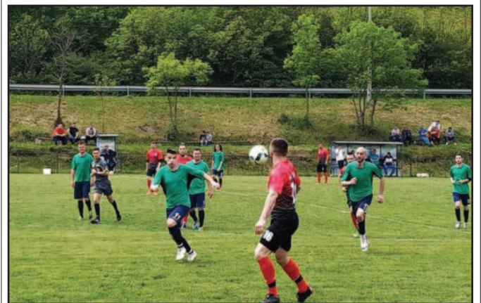
И Рудар пао пред лидером-деталј са утакмице у Печеногу

Утакмицама 26. кола претходног викенда настављено је првенство Окружне фудбалске лиге. Само једна победа гостију за коју су заслужни фудбалери Будућности из Конарева. У новоназарском насељу Дежева побеђен је ОФК Рас што је Конарева довело у позицију да се до краја сезоне боре за сам врх табеле. Трон љубоморно чува Пролетер који је у Печеногу лако поразио некадашњег српсколигаша из Балеваца. У Јошаничкој Бањи је виђено осам голова и тешка победа домаћина против гостију из Витковца, док је у Ушћу, у дербију кола, Радник више него тесно победио госте из Новог Села и преузео