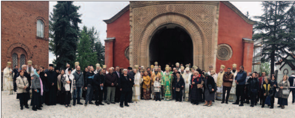
Заједнички снимак црквених великодостојника са Краљевчанима који су присуствовали овом великом догађају

-Ево нас данас у Светој Жичи да добијемо благослов наших предака за почетак рада Светог Архијерејског Сабора. Велики је благослов да имамо коме и за шта да се молимо. Господ нека дарује да чистог срца приступимо ономе што је пред нама. У октобру нас чека велика централна прослава јубилеја 800 година аутокефалности Српске Православне Цркве. Нека нас Господ са Пресветом