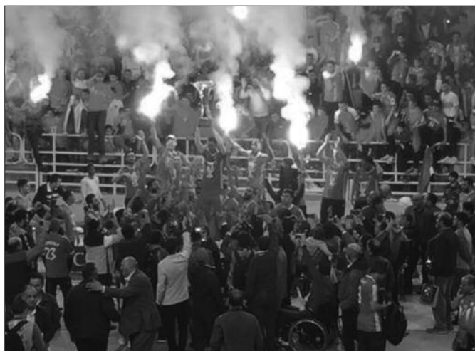
Славље због девете титуле у Мисурати

-Имају добру лигу. Сваки клуб има право на два странца, ми смо ове сезоне имали два Бразилца који су евидентно правили разлику. На Афричком клупском првенству у Египту морали смо да играмо са једним странцем и можда је то разлог да нисмо освојили медаљу. Либијски шампионат је из сезоне у сезону бољи и квалитетнији, занимљивији и неизвеснији, чему су сигурно допринели странци, како играчи, тако и тренери. Отуда друга узастопна