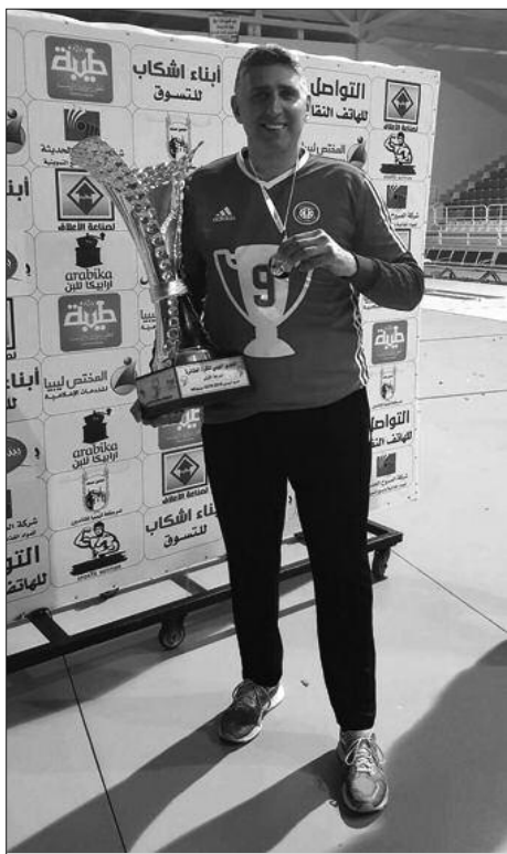
Позиви Бола ради титуле-са пехаром првака Либије

и резултатима сам отворио врата за нове доласке српских тренера.