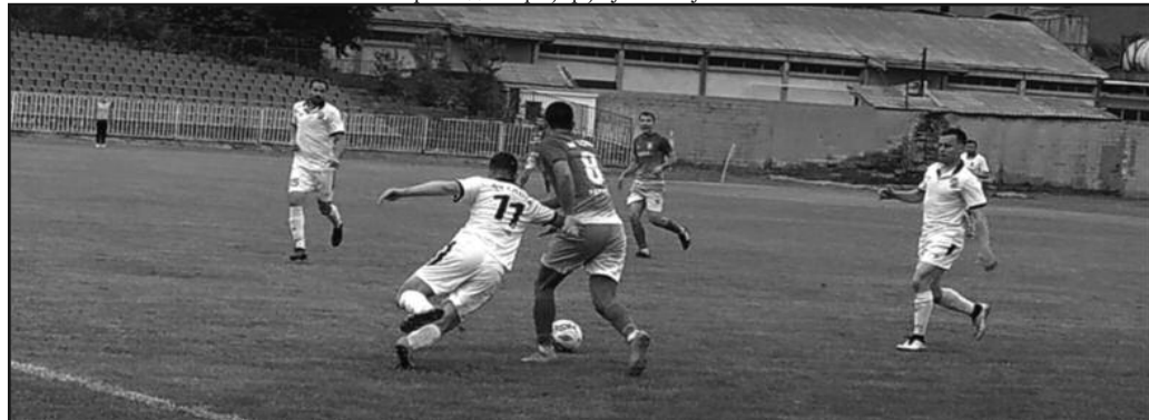
Жестоки дуели у комшијском дербију Слоге и Полета из Ратине