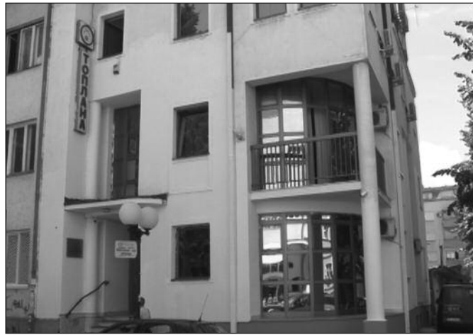
Краљевачка „Топлана“ једна од ретких која је грејала ових дана

–Није то 100 одсто, али је доста добро. Они који не могу на време да измире своје обавезе за грејање, ја позивам да дођу у „Топлану“ како би се направио некакав договор, односно уговор о репрограму дуга.