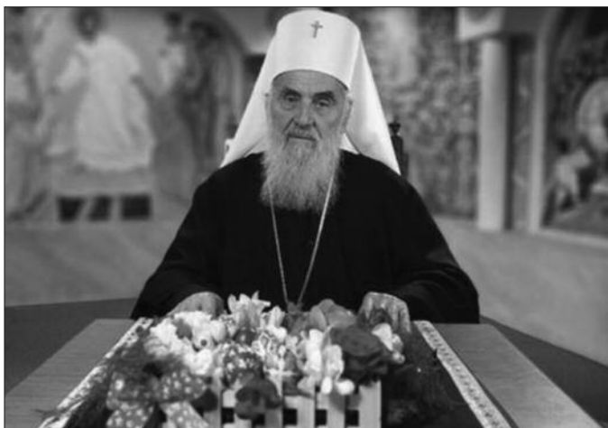
Његова Светост Патријарх српски г. Иринеј

Нажалост, и поред небоземне пасхалне радости, и даље смо сучочени са мноштвом искушења и невоља, са тероризмом, ратовима и одузимањем људских живота широм земљиног шара. Плач и агонија жртава, који до нас допиру највећом брзином путем савремених средстава комуникације, рањавају наша срца. Разноврсна и безбројна разочарења, туга и незадовољство обузимају наше душе. Свуда око нас влада неправда и мржња, а истина се релативизује. Људе врлинског живота клеветају и прогоне. То се одвија не само на личном и локалном плану него и у глобалним размерама. Сведоци