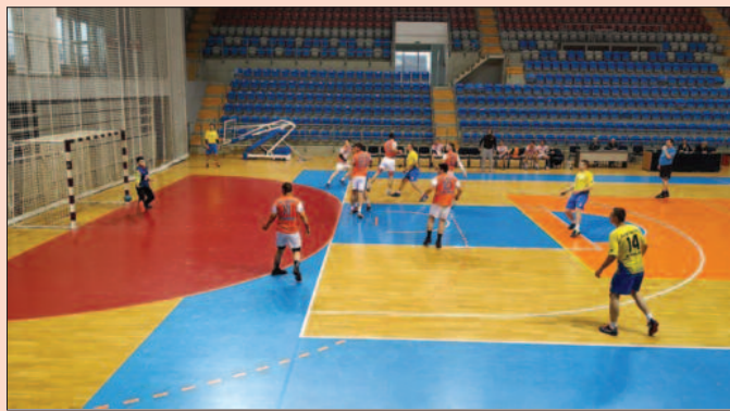
Слога победила Тречу и прекинула низ без тријумфа