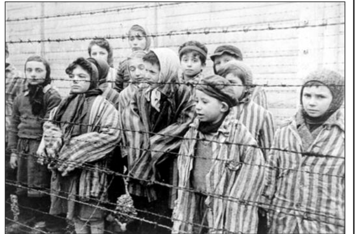
НДХ је једина држава која је имала посебне логоре за децу

Тачан број људских жртава Другог светског рата није утврђен нити ће икада бити утврђен. Разлог томе је делимично у томе што их је тешко разликовати од неких ратова који су вођени пре и после, а делом и у томе што се с бројкама из разних политичких разлога манипулисало (Југославија, СССР). Већина процена спомиње бројку од 55 милиона људи, при чему се такође држи да само 10 одсто отпада на непосредне учеснике, тј. припаднике оружаних формација, док се остатак односи на цивиле. Због тог несразмера се Други светски рат често наводи као крајњи пример тоталног рата.