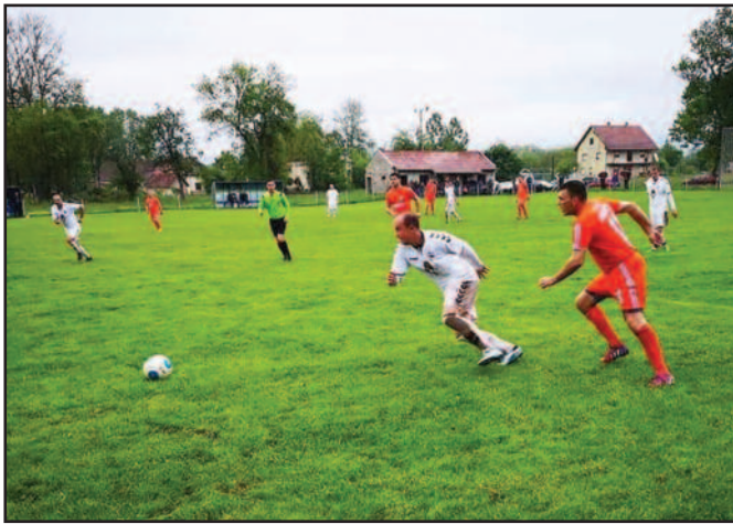
Тавничани у серији победили госте из Цветака-детал са утакмице

Утакмицама 24. кола претходног викенда настављено је првенство Међуопштинске фудбалске лиге Краљево. Lider из Врдила је, после 19 везаних победа, одиграо другу узастопну утакмицу нерешено, а Прогорелици је бод велики као кућа. Грдичани су лако изашли на крај са Богутовачком Бањом и задржали два бода предности у односу на „дуњаре“ из Тавника. На „Пројани“ овог пролећа голови падају као траци, Тавничани су демолерали комшије из Цветака. Од краљевачког Металца је остало само име, крај Ложионице је савила Звезда, док је убедљива победа Адранаца у Врби очекивана. Борац из Вранеша је остао у трци за другом позицијом на табели победом на Рудну.