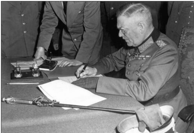
Фелдмаршал Вилхелм Кајтел потписује немачку капитулацију

Пошту жртвама одају широм Србије и Републике Српске представници