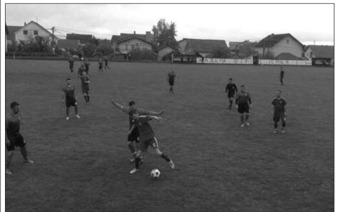
Победа у Јарчујаку-детал са утакмице Краљево Хајдука и Пролетера

У Окружној фудбалској лиги претходног викенда одигране су утакмице 25. кола. Лидер из Печенога је гоствао у Јарчујаку и на „вршећем“ терену славио убедљиву победу. На руку је Пролетеру ишао пораз Радника из Ушћа кога је Будућност у Конаревоу декласирала. Први пратиоци лидера постали су ОФК Рас који је неочекивано лако и убедљиво победио у Матаругама и Омладинац који је у Новом Селу славио против Поповићи Врњаци. У Баљевцу је домаћин минимално славио против Ибра, док је Рибница одолела у Витковцу. У Витановцу је домаћин демолирао комшије из Стубла, а права посласница је био