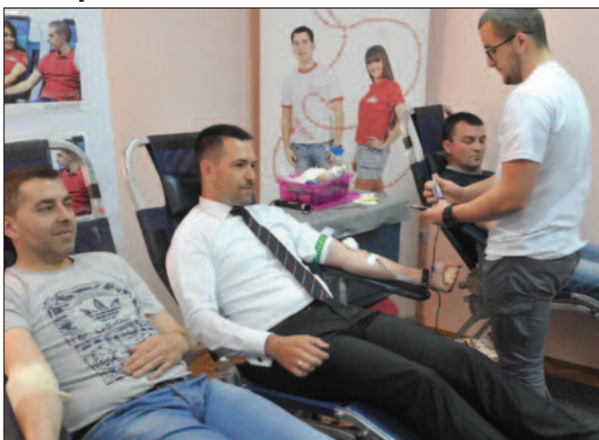
Твојих 15 минута времена могу неке спасити живот

Љубав је кад знаш шта ћеш поклонити. „Поклони живот - дај крв“ мото је акције добровољног давања крви која је одржана у