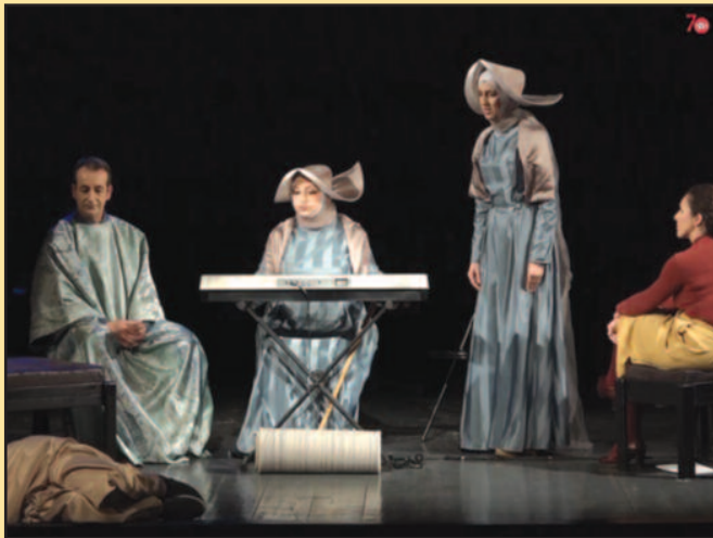
Краљевачки глумци у представи „Сумња“

Такмичарски програм: Понедељак, 15. мај, у 20 часова. Режија: Патрик Шенли УМЊА Режија: Југ Ђорђевић