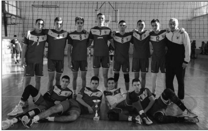
Јуниори Рибнице у походу на титулу првака Србије

У Краљево ће наступити осам екипа подељених у две групе. У