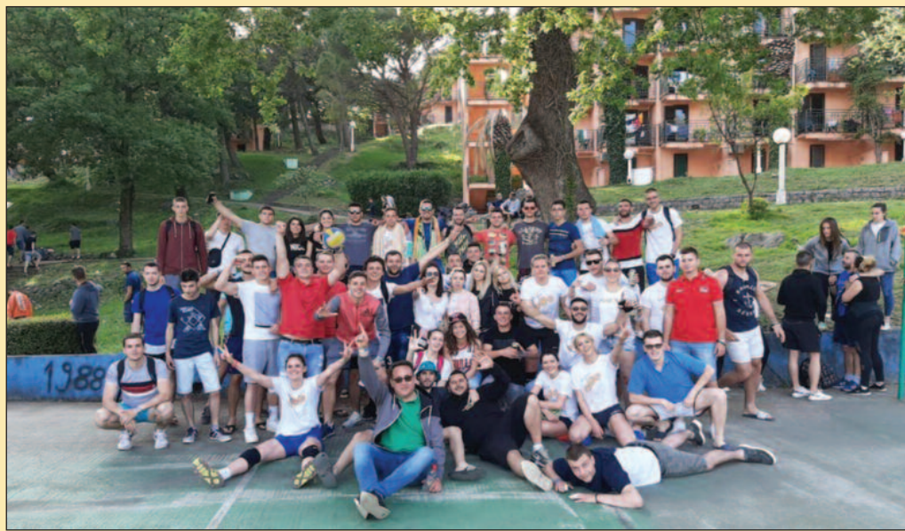
За успех најзаслужнији студенти, али и цео наставни колектив

-Као студенту егзактних наука сачуван је традиционални мит о Машинијади и знању, где је знање организовано на високом нивоу. „Знање“ траје 4 сата, окупљају се професори са свих факултета, састављају задатке и учествују у том раду. Посебно смо поносни на генерални пласман и друго место, где смо на корак уз Београд и где смо показали да можемо да се боримо са свим великим факултетима из бивше СФРЈ. Када је спорт у питању, освојили смо прво место, а последњег дана играли смо 6