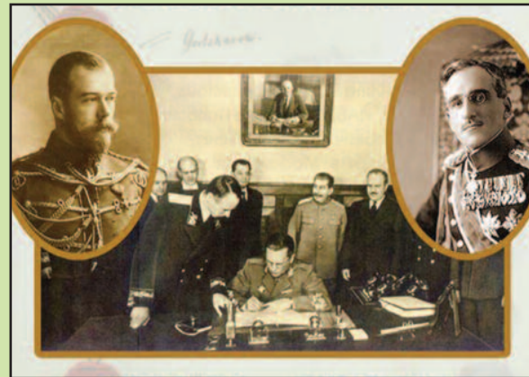
Приказана архивска грађа која датира из 1838. године