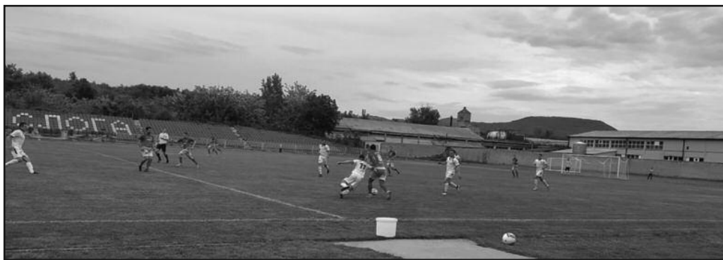
Слога тешком мук до тријумфа против Полета-детал са комшијског дербија

предности у односу на Слогу. Краљевачки „бели“ су имали комшијски дуел са Полетом из Ратине на Градском стадиону. Много буре у поменутом мечу, чак три црвена картона, промашен једанаестерац домаћих и на крају минимална,