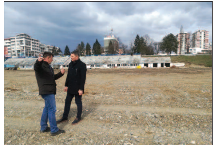
Радови на Атлетском стадиону биће готови до Балканијаде