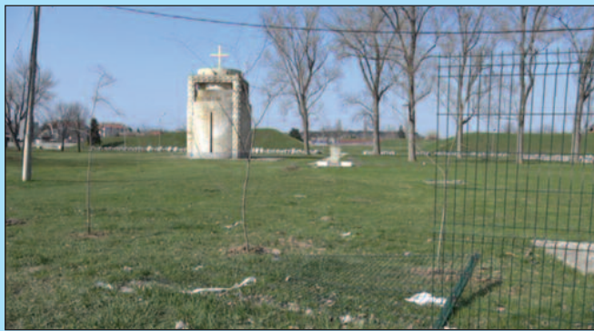
Организовање чуварске службе спречило би крађе