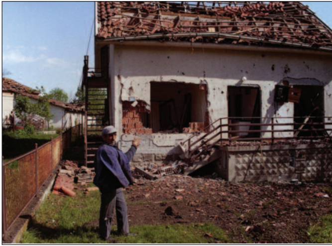
Једна од уништених кућа у селу Витановцу

У двомесечном дивљању агресора, Краљево је 54 дана било мета крстарећих ракета, ракетних