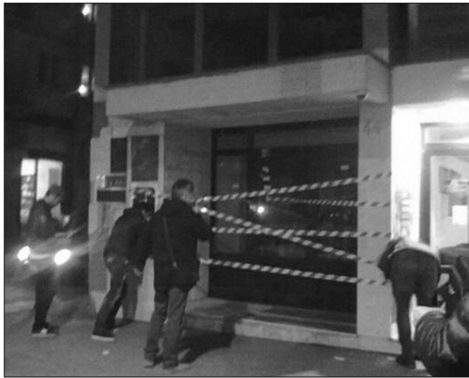
Покушај да се ускрати загарантовано право на рад

Нешто после 18 часова, демонстранти су се наменски зауставили испред седишта Телевизије Краљево и тракама затворили улаз у зграду телевизије. Сам улазак и излазак за посленима из зграде, био је онемогућен више од 10-так минута. Све време демонстранти су узвикивали пароле: „Краљевачка лажовизија“, „Лопови“, „Вучићева телевизија“... Интересантно је да су се врло брзо фотографијама на друштвеним мрежама похвалили чланови УГ „Староседеоци“ из Краљева. Питамо се да ли се за овакву демократију залаже краљевачка опозиција и да ли сматрају да ће пар налепница и трака онемогућити најстарију регионалну медијску кућу да настави да информира своје грађане, као што је то увек и чинила. Очигледно је да шачица очајних демон-