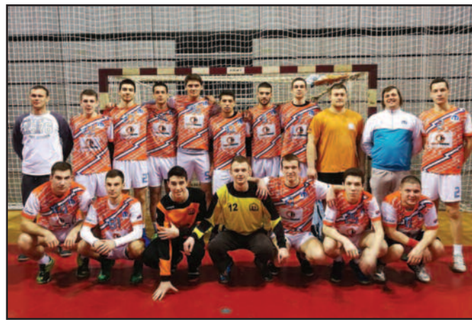
Бод на старту другог дела- рукометаша краљевачке Слоге

МЕТАЛАЦ: Васиљевић 3, Прибаковић, Димитријевић 1, Милачак, Батрићевић 4, Јовановић 5, 3. Вељовић 5, Б. Вељовић