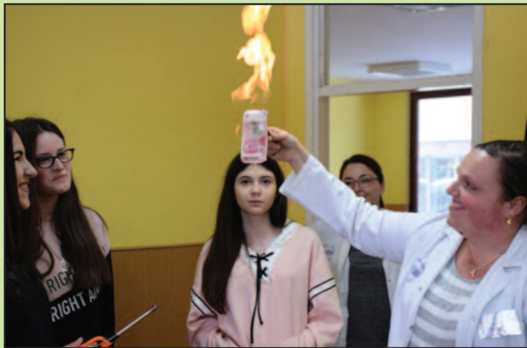
Да се кроз игру деци приближе природне науке

Овакав концепт учења је сагласан Пројектној настави, која је имплементирана у редован васпитно-образовни систем. Акција је усмерена ка поди-