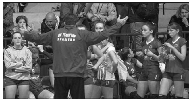
Одбојкашице Техничара током предаха