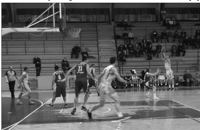
Пораз од Здравља у завршници меча-детал са једне утакмице Слоге

-Заслужена победа кошаркашам Здравља, мада не би било не заслужено и да је Слога победила. Била је права првенствена утакмица, мислим да су гледаоци уживали, а у самој завршници мирнију руку су имали Лесковчани. Били су прецизни са линије пенала, неколико бољих решења су имали у последњим тре-