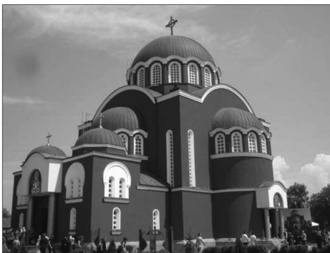
Храм светог Саве у Краљеву

Слика краљевачког Храма Светога Саве и у петак, и у суботу и у недељу била је нешто другачија него обично. Литургија се овде служи сваке седмице и осим свештенства и народа често је присутан чак и Епископ. Међутим, осим ових који су споменути, прошлог викенда у Цркви смо могли да сретнемо многе људе који су нам можда рођаци, познаници, комшије, колеге, а које иначе не виђамо у Цркви... Заиста једна лепа слика! Сви су они дошли са жељом да се причесте прве седмице поста. Ова слика ме је навела да се препустим машти и да покушам да замислим како би само било лепо када би наши људи схватили да су призвани да учествују у службама Божијим током читаве године, а не само једном или двапут годишње! Како би то била дивна стварност!? Верујте, све сфере друштва би доживеле темељни преображај! Покушајте и ви да замислите колико би другачије изгледали наш град и наша земља када би сви ми у много већој мери држали заповести Бога који је Љубав. Када би се много већи број нас трудио да живи часно, у духу Христове