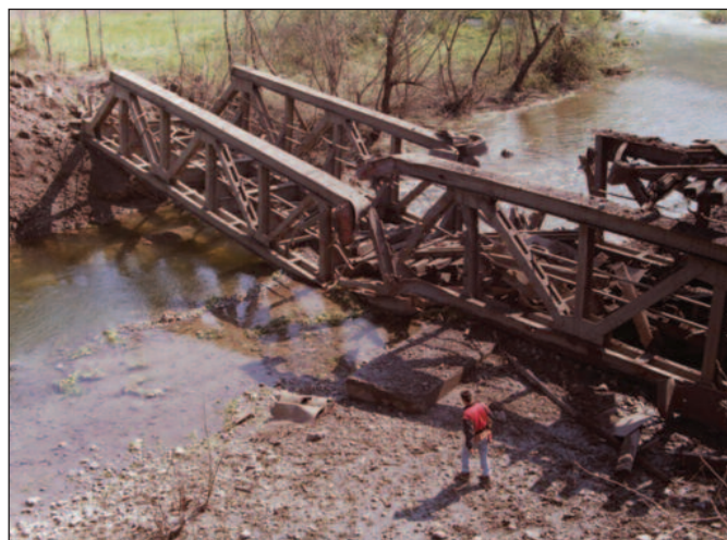
Срушен железнички мост у Богutowцу

лезнички град, имало је велике железничке капацитете у којима је радило више од 3.000 људи и зато приказујемо овај сегмент везан за уништавање железничких пруга и целокупне железничке структуре, нагласио је Матијевић, а затим позвао грађане да се заједно подсетимо „када су наши људи храбро бранили Србију од далеко надмоћнијег непријатеља“.