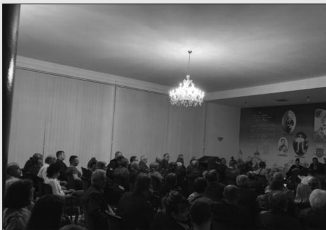
Краљевачки напредњаци на скупу подршке Александру Вучићу

Вашим срамним понашањем обрукали сте и понизили поштenu, радну и одговорну Србију. Нећете демонстра-