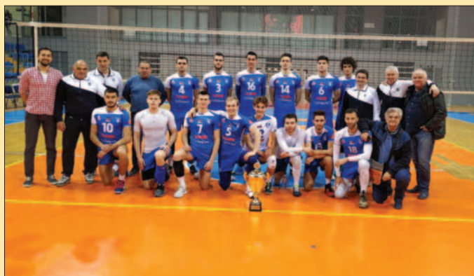
Шампиони Прве лиге за сезону 2018-2019