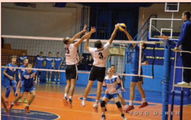
Надигравање на мрежи-деталј са утакмице одбојкаша Рибнице 2