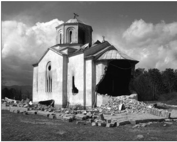
Црква светог Илије у Подујеву

Етнички је очишћена Приштина, а Чаглавица, прво село до тада најстабилнија српска енклава јужно од Приштине, је убрзо по-