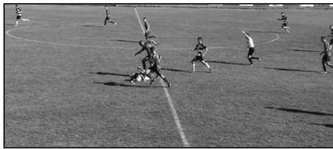
Детаљ са једне утакмице Кикера

Старт другог дела сезоне смо дочекали спремни. Радил смо преко зиме у тешким условима, али смо се максимално припремили и нестрпљиво чекали премијерни дуел са Чукарничким на терену у Раковици. одиграли смо добру утакмицу, били смо у већем делу меча бољи ривал, имали смо три „зицер“ шансе и права је штета што нису реализоване, јер би смо се из Београда вратили са целим пленом. Да нам је неко пре утакмице понудио бод, прихватили би смо, јер кадети Чукарничког су кандидати за највиши пласман. После свега има мало незадовољства, били смо ближи победи – уверава Го-