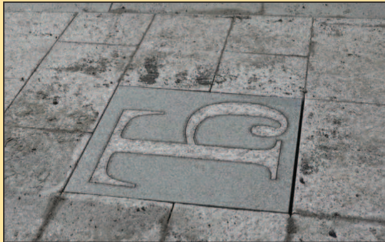
Трг српских ратника добио ново, занимљиво обележје

-Идеја се појавила већ онда када је више државних и градских институција отворило питање заштите ћирилице. Међутим, ми ни у једном моменту осим одлука, закључака и декларација нисмо видели да је неко нешто конкретно урадио. Када је почела реконструкција Трга српских ратника у Краљеву онда смо ми дошли на идеју да овај трг оплеменимо и да предложимо да око споменика у интарзију у мермеру инсталирамо национално српско писмо - ћирилицу. Наишли смо заиста на разумевање пре свега ЈП за уређивање грађевинског земљишта и самог Града. Данас је Краљево добило још једно занимљиво обележје и сматрамо да више ни једна екскурзија неће проћи кроз