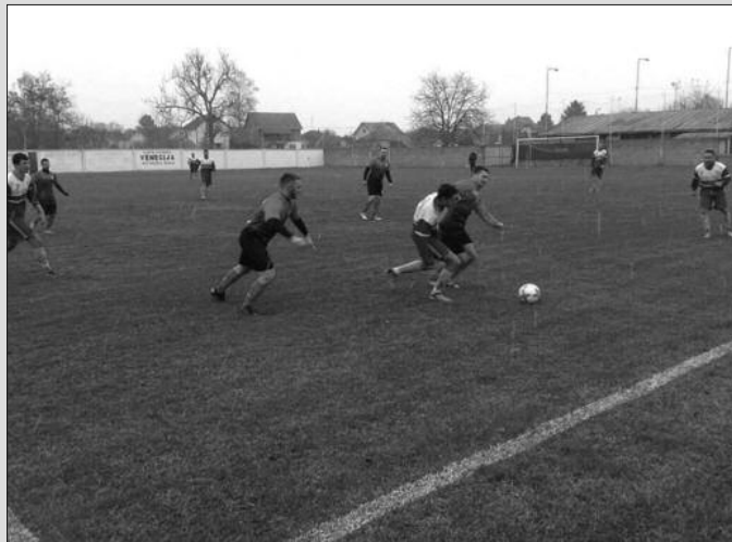
Детаљ са јесењег дуела Ибар.Пролетер у Матарушкој бањи

На теренима Окружне фудбалске лиге овог викенда играју се утакмице првог пролећног кола. Јесењи првак, Пролетер из Печенога гостује у Ушћу и то ће бити добра провера за тим који сем додатно појачао у зимском прелазном року. Једна од најзанимљивијих утакмица се игра у Витановцу где домаћој Грузи гостује најближи комшија, екипа Ласте из Витковца. Другопласирани Гранит из Јошаничке Бање ће имати тешко гостовање у Конареву, док се добра и неизвесна представа очекује у Јарчујаку где гостује Напредак из Грачаца. На старту пролећног дела првенства састају се и некадашњи српсколигаши Рудар из Баљевца и Омладинац из Новог Села.