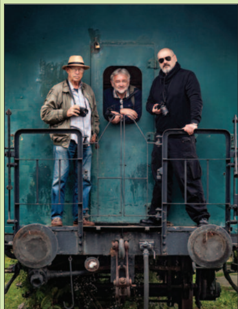
Аутори ове занимљиве изложбе

У галерији Културног центра у Рибници у среду је