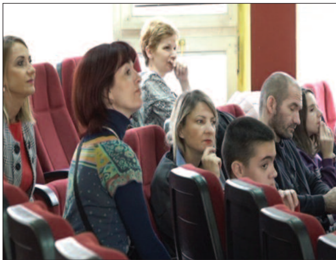
Двојезична настава за три одељења шестог разреда

–Нама је драго што смо дошли овде, јер су представници ове школе прошле године били код нас када су кренули са упознавањем како се то у нашој школи реализује двојезична настава. Ми смо им тада показали какав је то модел и како то функционише. Тако да је ово први наш долазак након тог