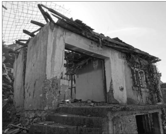
Уништена српска кућа у Призрену

Савезни министар за одбрану заједнице СЦГ, Борис Тадић је током погрома боравио у Братислави, на Међународној конференцији представника НАТО земаља, где је искористио прилику да тражи моментално заустављање насиља над српским живљем, као и заштиту њихове имовине. Од државника и