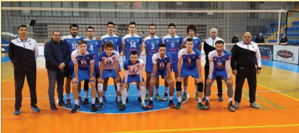
Нови трофеј у витринама за повратак на елитну сцену-ОК Рибница Краљево