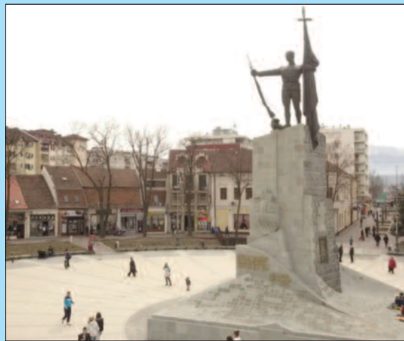
Радови су изведени по највишим техничким стандардима

застојима и кашњењем изведени са највишим стандардима за ову врсту радова како у смислу урађене материјала тако и по