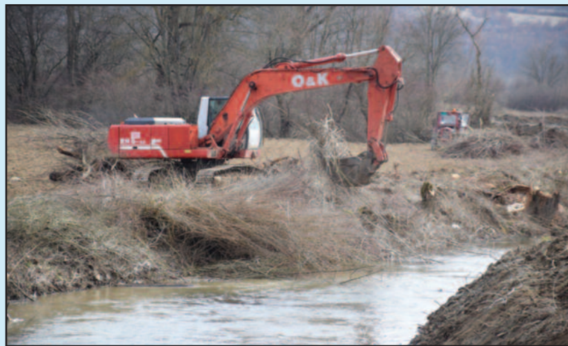
Уређење реке Грузе значајно за будући развој агара

веома значајна за овај део Србије и ниједног тренутка не гледамо да ли већу корист има Краљево или Кнић. Корист треба да имају грађани, људи који живе око Грузе, који ће сада имати нове хектаре обрадивих површина које ће моћи да засеју и који ће моћи да зараде животом на селу. Очекује нас наставак регулације тока Грузе, али и разговори у вези са грузанским водоводом, којом се водом снабдевају људи и у селима у Краљеву, али и у општини Кнић. Морамо заједничким снагама да сарађујемо са републичким јавним предузећима и министарствима како би што више