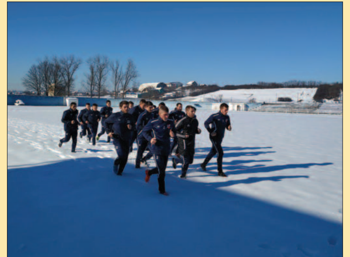
Истрчани први километри

Екипа ће све време радити у Краљеву, по програму биће и шест до седам јаких провера против старијих знаца чачанског Борца, На-