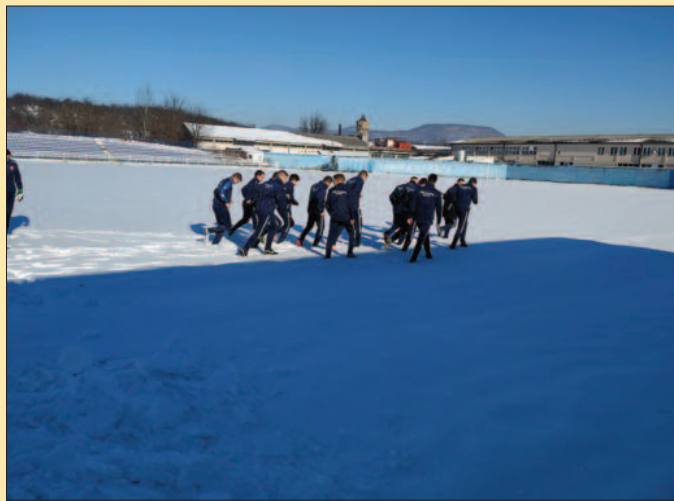
По снегу до трона

играча, циљ је да пре свега у Слоги буду Краљевчани и да на тај начин помогну да водећи клуб дође на по-