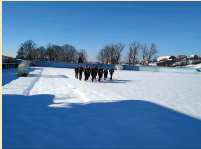
Фудбалери Слоге на првом тренингу

—За разлику од играча, ми у руководству клубу нисмо одмарали. Много је посла које је требало одрадiti и још увек се раде. Није ту у питању само прелазни рок, већ и организација, јер смо свесни да је то велики проблем Слоге и он је присутан деценијама. Време је да се поставе стабилни темељи, да се поставе основе квалитетног клуба, што Слога мора да буде. Да нас неко