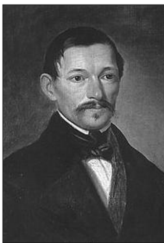
Јован Стерија Поповић

У комедији је започео једночицима, да би, откривши свој комедиографски таленат, написао прву већу комедију