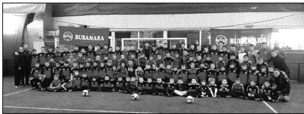
Права рођенданска прослава краљевачке Бубамаре