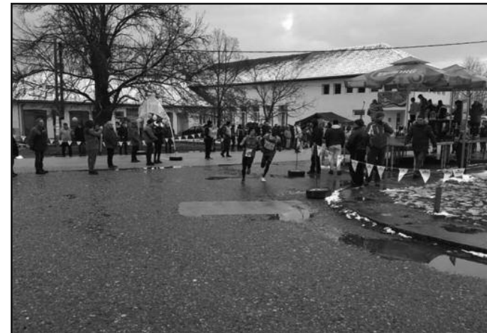
Детаљ са трке сениора у Мрсаћу