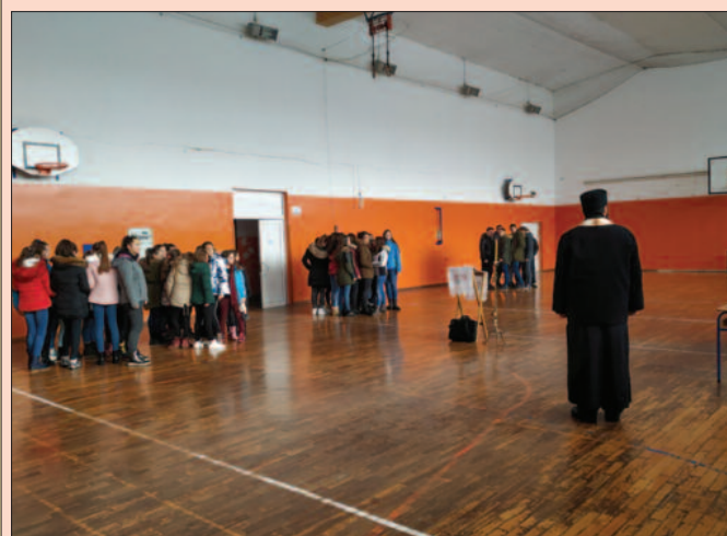
Свака селекција по једну чесницу за Божић и рођендан клуба

Сетили су се, на овом скупу бивши играчи, још пуно догађаја од пре четири деценије, па и комплета „оловка, роковник и календар“ из године успеха који још чувају, а који су, пошто тада није био обичај да се спортисти и новчано награђују, добили у знак признања на пријему код челника у