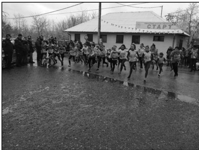
Старт млађих и старијих пионирки на трци у Мрсаћу

-Трка је била тешка и замљива. Није ми толико сме-