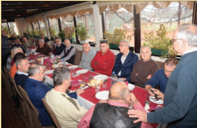
Успехом у Новом Саду подигли цео град на ноге - одбојкаши Рибнице који су 1978. освојили Куп Југославије

Одбојкаши Рибнице, који су Југославију пре четрдесет година представљали у Европи, окупили су се крајем прошле године да би се подсетили на дане кад је град на Ибру због њих био на ногама. Сви живи и здрави, неки, истина, са мање косе, а више килограма. Озбиљни породични људи, већина њих са дипломама виших школа и факултета, сада при крају успешних пословних каријера, а у спорту и даље као функционери, тренери, судије... То су они момци за којима су на краљевачком корзоу уздисале девојке, а чија је слика покрај пехара, те давне 1978. године, месец дана стајала у излогу робне куће „Београд“, у самом центру Краљева. Јер, били су екипа Рибнице, освајачи одбојкашког Купа Југославије и онда представници те велике земље у Европи, у такмичењу Купа победника купова. Осим што су дигли град на ноге, због њих је саграђена прва хала спортова на обали