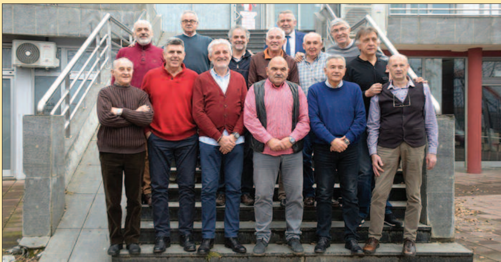
Генерација ОК Рибница која је освојила Куп

„техничари“ су преломили чеснице, мало се почастили и дружили, уз пригодну молитву