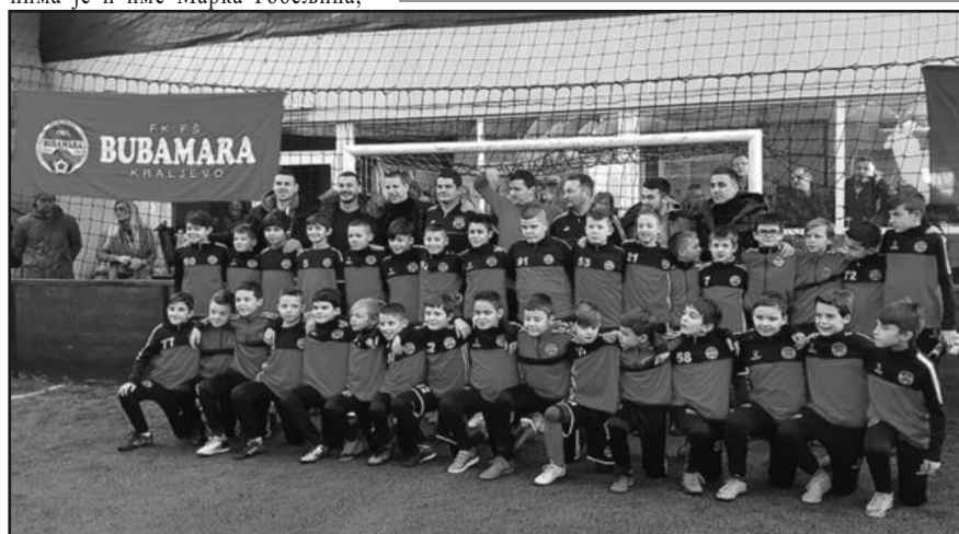
Деца из Бубамаре са драгим гостима из београдске Црвене звезде