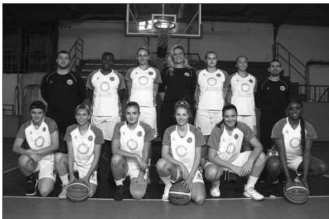
Женски кошаркашки клуб Краљево

Ми смо у сезону ушли са истим амбицијама, али ималим