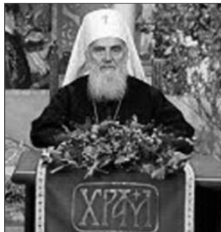
Патријарх српски Иринеј

Ми тражимо поштовање једног од основних хришћанских начела: „Све што хоћете да чине вама људи чините и ви њима“ (Мт 7, 12). Све што захтевамо за нашу браћу и сестре на Косову и Метохији спремни смо да пружимо и пружамо и свим народима који живе или на Косову и Метохији или у другим крајевима Републике Србије. Али та слобода за српски народ и за све друге није могућа у самопроглашеној лажној држави Косово! То најбоље доказују догађаји наших дана: варварско лишавање српског народа на Косову и у Метохији намирница, лекова и других ствари неопходних за живот увођењем већ злогласних „такси“, сталне претње, хашења и много шта друго, а најновије је оснивање такозване косовске војске, у циљу даљега застрашивања и коначног изгона свих Срба, како оних јужно од Ибра тако и оних северно од те српске реке. Поново истичемо да је за нас питање Косова и Метохије, између осталог, питање опстанка нашег народа, свештенства, монаштва и, нарочито, наших древних светиња, без којих не бисмо били оно што