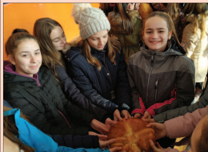
Техничарке ломиле чесницу уз најлепше жеље

На Божић 2010. године основан је клуб који је данас по броју чланова, условима за рад,