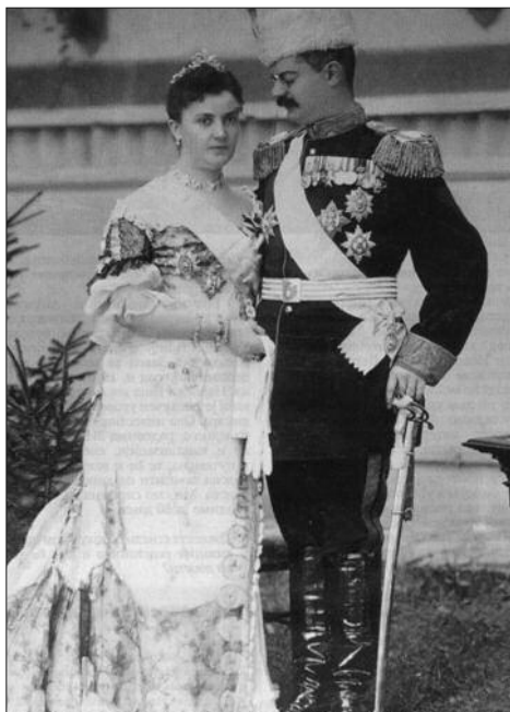
Краљ Александар и краљица Драга

„Господару! Било је време када сам као начелник округа нишког са болом у души морао о односима Вашег величанства да слушам разне историје са неким сумњивим женскињама, које су из иностранства довођене. То ми и као Србину и као државном чиновнику не беше право, те сам – сазнав овде у Београду о односима Вашег величанства са госпођом Драгом – налазио, да је паметније да Ваше величанство одржава односе само са једном женском, која је уз то и довољно озбиљна и доста полаже на углед свој у друштву, а да би могла ту везу своју са Вашим величанством афиширати пред светом. Баш пре два-три месеца сазнадох од једног вишег официра, да Ваше величанство често одлази ноћу код госпође Драге, што ми као одговорном министру за сигурност Вашег величанства беше врло неповољно. У почетку био сам намеран да лично Вашем величанству говорим о незгодама таквих ноћних посета, али сам