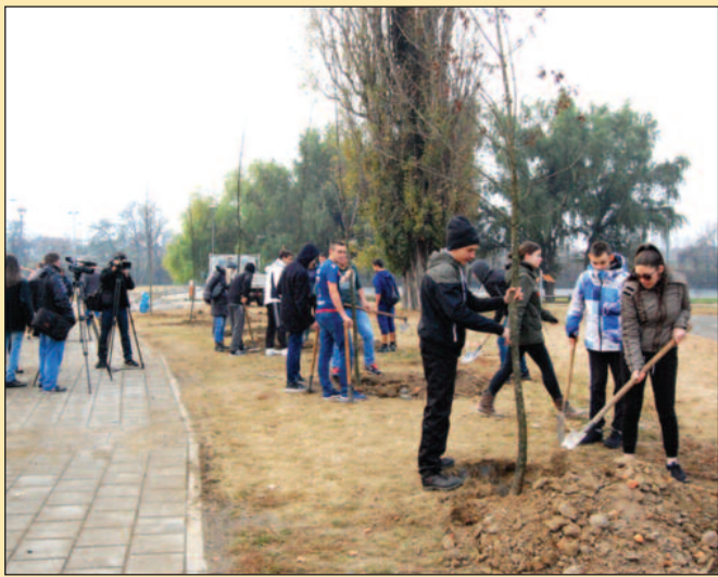
Ученици Шумарске школе креирају дрворед

На иницијативу грађана Краљева и "Фејсбук" групе "Град Краљево", крај Атлетског стадиона у Краљеву ученици Шумарске школе, заједно са професорима, посадили су прошлог петка 20 стабала јасена, старих пет – шест година, а још 130 садница требало би да буде засађено на локацији поред реке