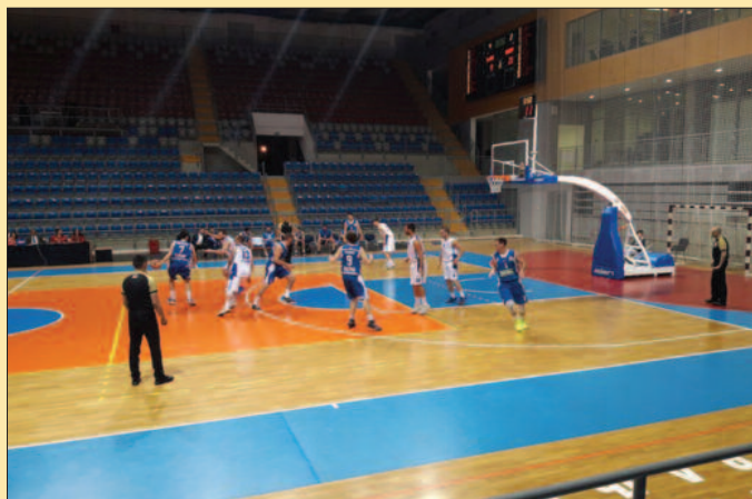
Важна победа против Земуна-детал са утакмице кошаркаша Слоге