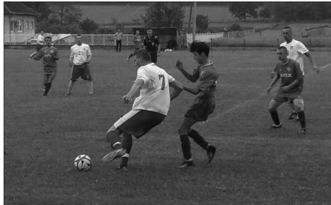
Пауза до марта-детал са једне утакмице Међуопштинске лиге

помогло да Богutowачка Бања са 40 датих голова буде најефикаснији тим јесење полусезоне. У мечу имењака у Вранешима домаћин је декласирао госте из Адрана и најавио да се на пролеће неће предати тек тако у борби за позиције које воде у Окружну лигу. У Цветкама није било голова, што је мало поква-