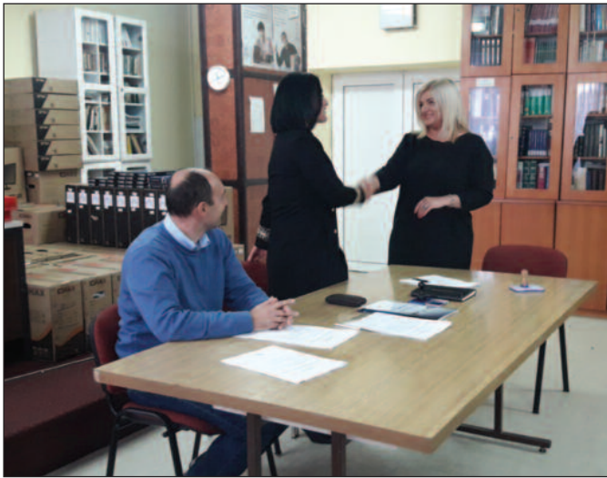
Опрема донирана где је најпотребнија, као и приградским и сеоским школама

-Реформа образовања и образовног система у Србији је у великом жеку, а у складу са технолошким напретком. Влада Републике Србије и Министарство просвете, науке и технолошког развоја раде увелико на дигитализацији и модернизацији школа. Један од таквих примера је и подела рачунара и рачунарске опреме за основне школе и гимназије на територији Рашког