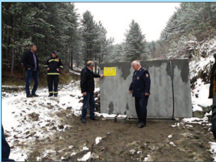
Водозахват ће омогућити брзо реаговање у случају пожара

У циљу одрживости пројекта водозахват је стављен у функцију Добровољног ватрогасног друштва „Студеница“ и манастира Студеница. -Тај водозахват је једна акумулација воде на овом терену. Омогућује пуњење 1 000 напртњача за шумске пожаре и гашење сваког пожара на овом подручју. У склопу водозахвата је и појило за дивљач и за стоку, као и чесма за путника на-