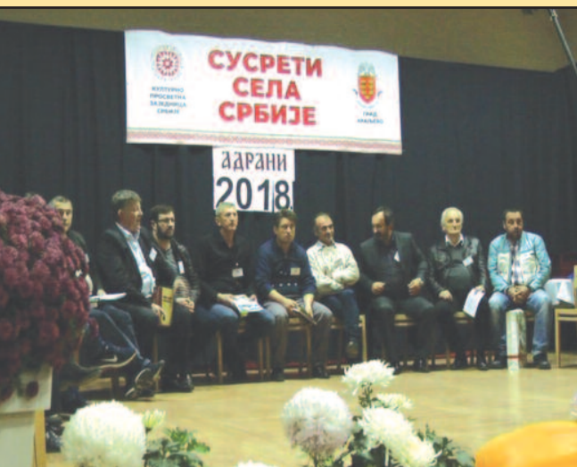
Представници села-учесника имали су чиме да се похвале

освећује пољопривреди и еколо- ји. Не мање битне су и друшт- ене активности, где се највише еда образовање мештана и дравство, даље се гледа инфра- структура урађена у селу, али и