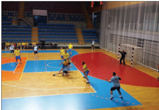
Детаљ са једне рукометне утакмице у Краљеву