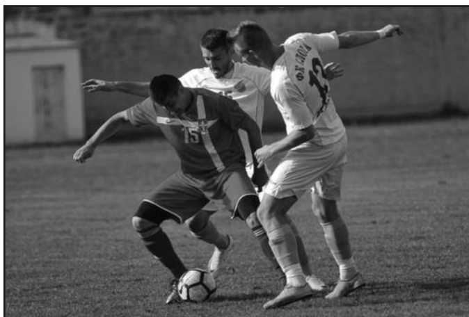
Адио до пролећа-детал са утакмице зонаша из Ковача и Слоге