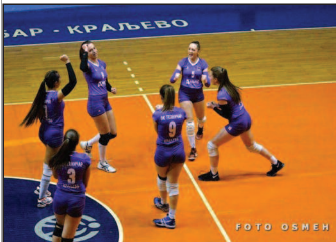
Радост Техничарки због победе

На теренима Друге лиге група „Запад“ за одбојкашице претходног викенда одигране су утакмице 6. кола. Техничар је у Краљеву победио Бамби Волеј из Пријепоља резултатом 3-0 (25-13, 25-18, 25-22) што је четврта победа „техничарки“ у сезони. Занимљиво да у претходне две сезоне, тим из Пријепоља је славио оба пута крај Ибра, док је Техничар био