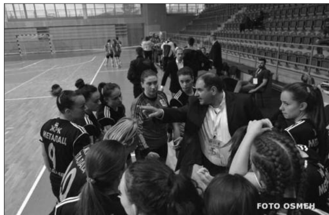
Савети са клупе-тајм аут рукометашица Металца

Претходног викенда завршен је први део сезоне Прве лиге група „Запад“ за рукометашице. Металац је у Краљево изгубио од друге екипе Бекамент Буковичке Бање резултатом 19-37 (7-18) што је