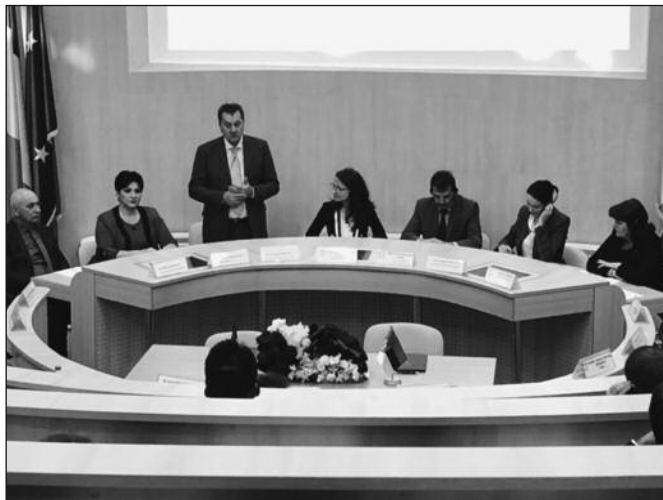
Сарадња два округа убрзаће и пут Србије ка Европској унији

-Пре свега желим да се захвалим начелници округа на исказаној енергији и вољи да направимо једну добру сарадњу. Отварање аеродрома „Морава“ даће могућност да се ова два округа што пре увезу како би се направила сарадња у здравственом, верском и бањском туризму. Истовремено велика захвалност Сибиу округу за све донације у области здравства и културе. Биће нам драго да идуће године наша Угоститељска школа буде учесник у Сибиу на