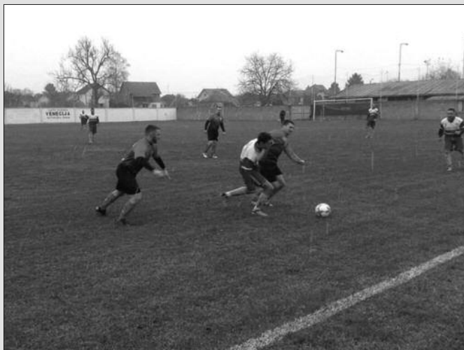
Клизање лидера у Матарушкој Бањи-детал са утакмице Ибар-Пролетер

Претходног викенда на програму су биле утакмице 15. кола Окружне фудбалске лиге, чиме је завршена јесења полусезона. Лидер и јесењи првак из печенога потучен је крај Ибра у Матарушкој Бањи, а овај исход делимично је искористио Гранит. На игралишту удаљеном само 200 метара од овог крај Ибра, лигаш из Јошаничке Бање и домаће Матаруге су одиграли нерешно, па Печеножани на зимску паузу иду са само три бода предности. Дobar финиш јесење полусезоне имао је Напредак из Грачаца који је победио у Витановцу и зимоваће на koti три. У Баљевцу је домаћин био сигуран против гостију из