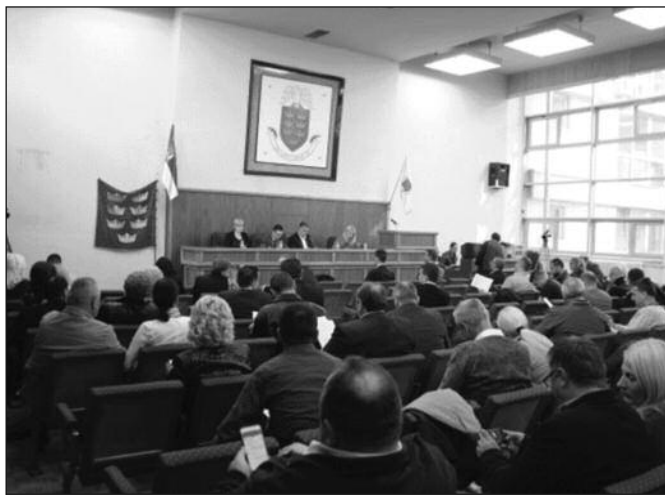
Још једна целодневна бурна седница Скупштине града

Бурна расправа водила се и око предлога Концесионог акта за поверавање обављања градског и приградског превоза путника на територији Краљева. По том предлогу процењено је да је за обављање комплетног превоза потребно 10 нископодних аутобуса за градске линије и још 13 соло аутобуса и 13 минибусева. Сви они треба да поседују климу и грејање возила и да имају уграђену камеру и фискалне касе. Због заштите животне средине најмање 50 одсто возила треба да задовољи еколошке критеријуме ЕУРО 5 норме. Због свих ових услова одборници из редова опозиције су тврдили да краљевачки превозници немају такве аутобусе и да неће моћи да направе конзорцијум и конкуришу за посао.