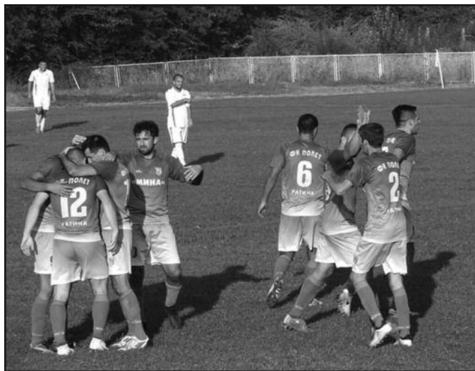
Прславили нову победу-фудбалери Полета из Ратине

лону 2018. У Ратини је одигран претпоследњи краљевачки зонски дерби. Полетн је угостио Карађорђа и