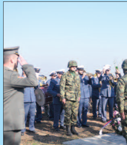
Одата пошта погинулим припадницима Ужичког одреда

– Број људи који је дошао на централну манифестацију говори да на достојан, господски начин обележавамо крај Великог рата, односно потписивања примирја после највеће трагедије у историји српског народа. Од 1914-1918. године погинуло је 359 хиљада српских војника, од тога 150 хиљада је погинуло у борбама током повлачења, док 77 хиљада није преживело голготу Албаније и нису стигли на Крф. Као Феникс, наша војска се касније опоравила и са савезницима донела ослобођење наше земље. Увек смо кроз историју знали да изаберемо праву страну, али нам се то кроз историју не враћа, јер ти исти савезници не осећају потребну да помогну Србију у остваривању својих циљева. Познати смо као један отпоран народ који ће и ту неправду да исправи, нагласио је