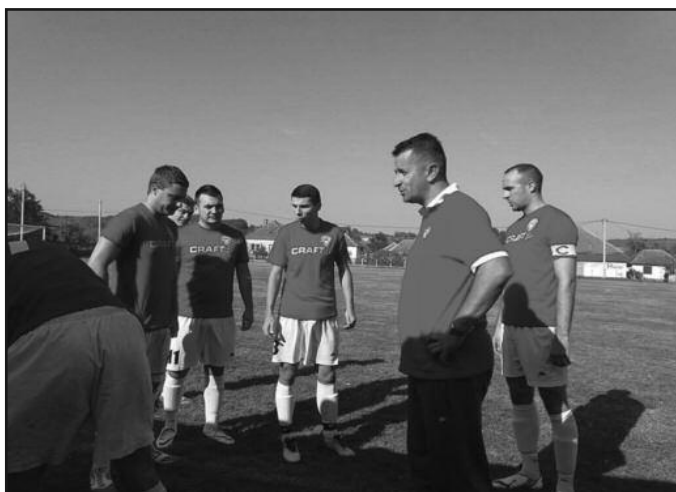
Не прија фењер-тренер Ђоковић и фудбалери Карађорђа из Рибнице

На теренима Шумадијско-Рашке фудбалске зоне претходног викенда одигране су утакмице 12. кола. Дерби кола одигран је у Краљеву, на Градском стадиону су стари знанци Слога и Шумадија 1903 из Крагујевца одиграли без голова. Не посебно занимљива утакмица, у којој су оба актера остала дужна окупљеним навијачима. На крају је исход овог сусрета одговарао Сушици да коло пре краја овери прво место на крају јесење полусезоне. Слога је показала два лица ове јесени, било је одличних игара, али и лошијих издања као што је био пораз од Реала у Краљеви. За остварење жељеног циља потребно је комплетирање играчког кадра, наравно квалитетним фудбалерима. У противном, Слога ће и даље остати зонаш. Краљевачки „бели“ у по-