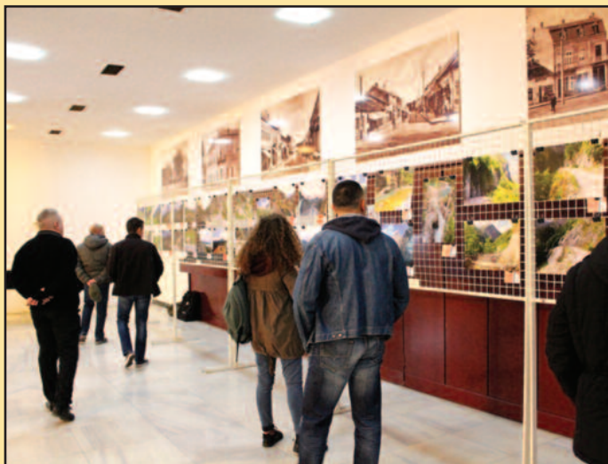
Изложба обухвата педесет фотографија насталих током путовања преко Албаније

пели да осетимо и да наслутимо какав је то догађај био и какве су размере страдања и воље, осећаја остварења, односно доласка на задати циљ. Тада смо заправо само загремали провршину целог догађаја. Кренули смо од основе повлачења преко Албаније, да су и народ и војска били приморани на то, али смо сазнали да су постојале различите руте, нимало једноставне ни са историјског нити са било ког другог аспекта гледано. Док су други народи свој на-