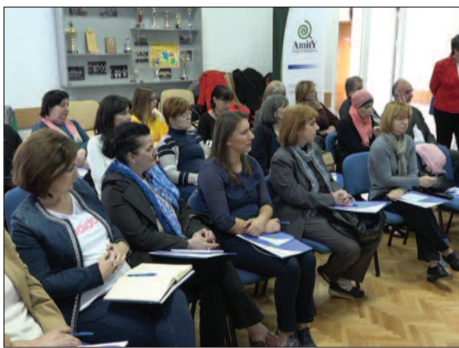
Како охрабри старе да о насиљу не ћуте и не одустају од тражења помоћи

Према свим доступним истраживањима, свака пета старија особа трпи неки вид насиља, и то најчешће у кругу породице, а тек свака стота старија особа се осмели, охрабри и усуди да пријави злостављача и тражи помоћ или некога замоли да потражи помоћ у њено име. Последње насиља су веома драстичне, па чак иду и до смртних исхода. У току 2018.године до сада је