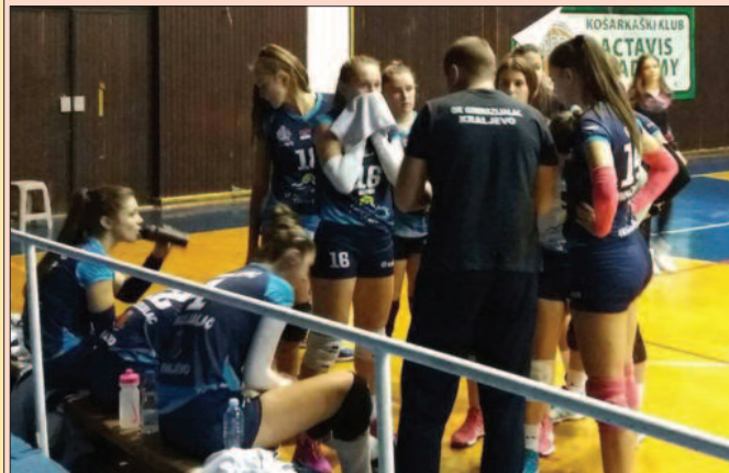
Тешка борба за опстанак-тренер Пљакић и одбојкашице Гимназијалца

Одбојкашице Гимназијалца поражене су у Краљеву од београдског Радничког резултатом 3-0 (25-19, 25-11, 25-18) у мечу 8. кола Прве „Б“ лиге. Био је ово шести пораз „шармерки“ у сезони, али овај неуспех није изненађење, јер вишеструки првак некадашње Југославије сигурно води на табели „Б“ лиге. „Шар-