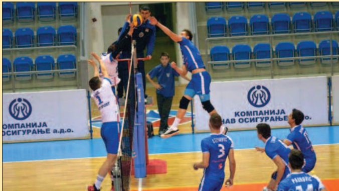
Шампионски ход мускетара-детал са утакмице одбојкаша Рибнице

Евидентно је да су „мускетари“ врло спремно дочекали првенство, ради се максимално, ситнији кадровски проблеми не остављају последице