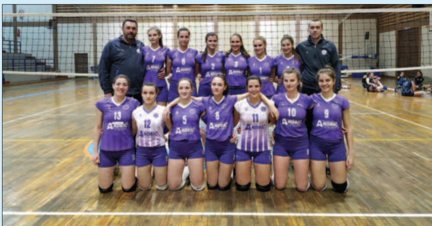
Вредна победа крај Дрине-одбојкашице Техничара са тренерима