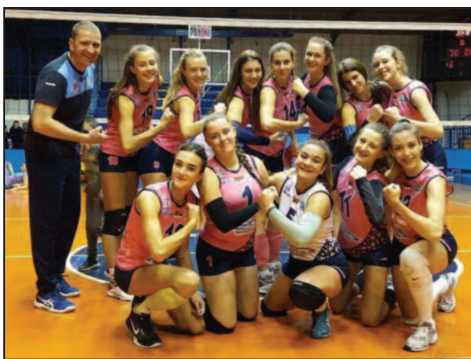
Показале карактер победника-одбојкашице Гимназијалца после победе над Инђијом