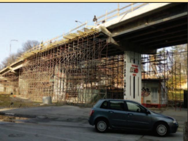
Законом дефинисани рокови за јавне набавке директно утичу на рок за завршетак радова

допуна, усвајање ребаланса буџета ЈП „Путеви Србије“, расписивање јавне набавке у отвореном ношење понуда заинтересованих понуђача, као и време трајања прегледа понуда имају зако- и директно утичу на рок за завршетак радова