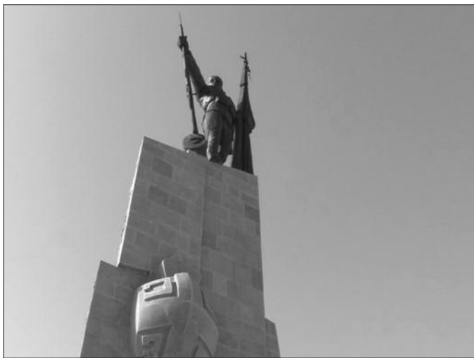
Постамент и бронзана фигура су у потпуности очишћени и све је урађено у року