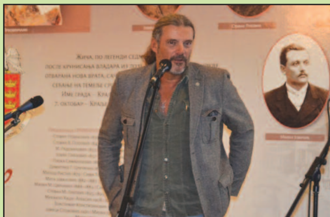
Оскар Фрајзингер: Много сам срећан што сам вечерас са вама

ској управи, швајцарски писац наставио је обилазак града, а наредне локације биле су Народни музеј Краљево, где је обишао сталну поставку, уз посебно интересовање да се више едукује о стрељању наших суграђана 1941. године, а затим је обишао и само Гробље стрељаних. За крај ове посете у понедељак је организовано вече посвећено књижевном стваралаштву и политичком деловању Фрајзингера, осведоченог пријатеља Срба који се годинама уназад труди да се створена слика о нашем народу у свету бар мало промени.