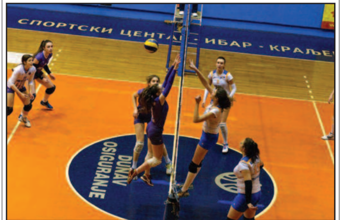
Детал са утакмице одбојкашица Техничара

У Другој лиги група „Запад“ за одбојкашице претходног викенда одигране су утакмице 3. кола. Краљевачки Техничар је убедљиво поражен у Пожеги од домаће Слоге 031 резултатом 3-0 (25-23, 25-13, 25-22). Био је ово други пораз „техничарки“, а први на гостовању у овој сезони. Иако су важиле за фаворита у мечу са дебитантом у друголигашкој кон-