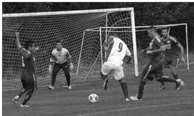
Детаљ са једне утакмице Окружне фудбалске лиге

Претходног викенда одигране су утакмице 12. кола Окружне фудбалске лиге. Комшијски дерби у Новом Селу, где је гостовао лигаш из Грацаца, завршен је так победника уз четири виђена гола. Такав исход највише је погодовао Пролетеру који рутинском победом у Печеногу против „фењераша“ из Матаруга одмакао најближем пратиоцу четири бода. Радник из Ушћа није успео да победи неугодног госта из Новог Пазара, а публика је уживала у шест лепих голова. Вечити комшијски дерби или дерби свих дербија у овом крају, одигран у Матарушкој Бањи завршен је без голова, па слађи део плена иде у Коњарево. Стубал је сигурно тријумфовао против гостију из Баљевца, као и Рибница која