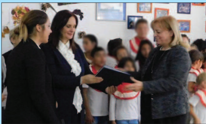
Две СОС маме добиле јубиларне награде за десетогодишњи рад

Одређен број деце који је одрастао и живео у СОС Дечјем селу у