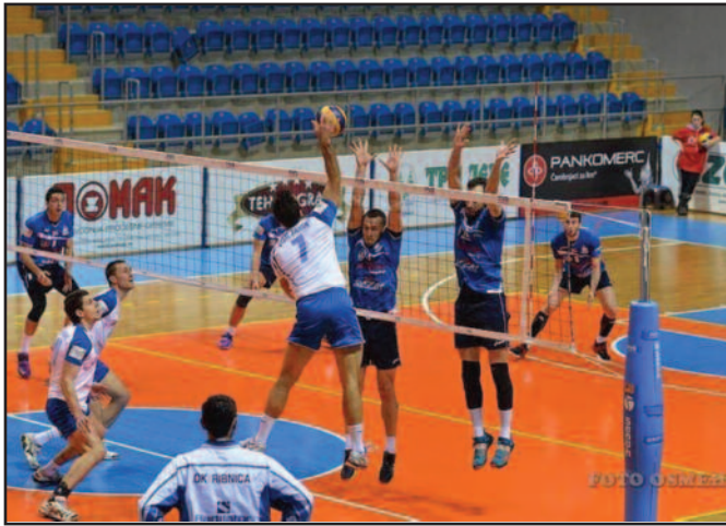
Рибници прија лидерска позиција-детал са утакмице краљевачких одбојкаша

Унапред добијене утакмице су најтеже. У овој лиги свако опуштање се кажњава, моји играчи су били веома озбиљни, максимално одговорни против објективно слабијег ривала и то је највише утицало на крајњи резултат. Најважније је да