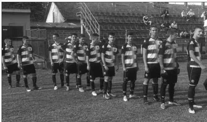
Кадети краљевачког Кикера