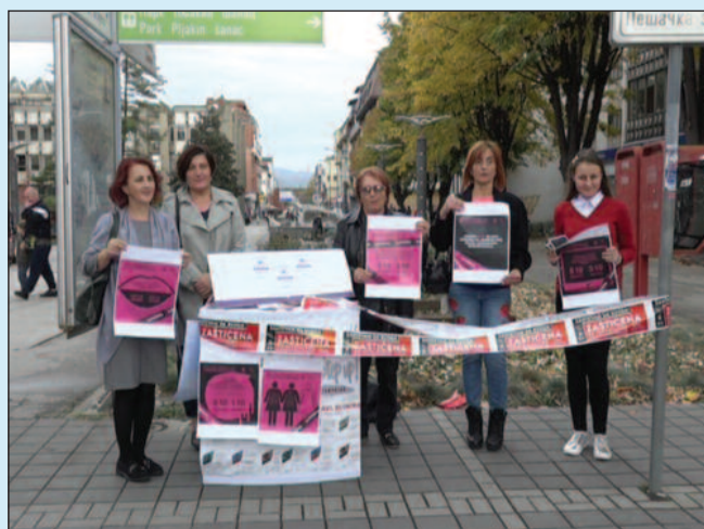
Волонтерке удружења „Феномена“ промовишу нови број СОС телефона

-Ми смо иначе ушле у процес лиценцирања телефона, где ћемо на републичком нивоу ући у националну мрежу која ће свакако бити бесплатна за све градове Србије, тако и за Краљево.Првенствено је важно да жена која пријави насиље најпре добије неку врсту ин- формативне подршке коме може у одређеном моменту да се даље јави. Дакле ми немамо неких средстава којима бисмо могле даље да делујемо, али можемо да пружимо услугу у смислу да ли треба да се пријави Центру за