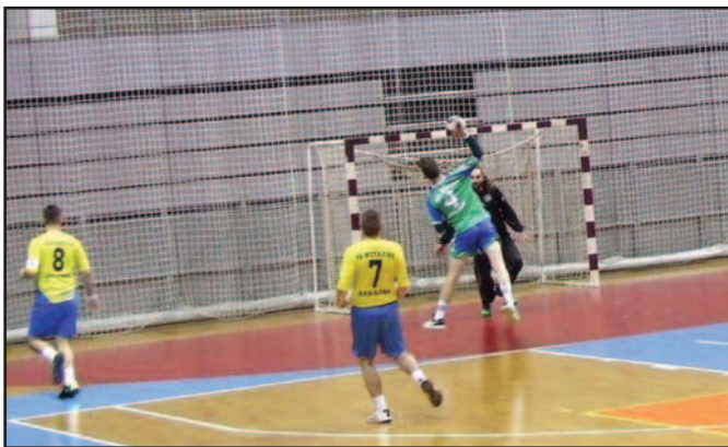
Очекиван пораз од Чачана-детал са утакмице Металац-Младост