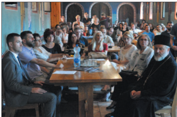
Трпезарија Манастира Жича традиционално пуна уважених гостију