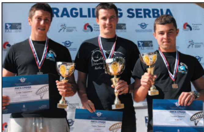
Јуниорски победници Парагладинг лиге Србије

Екипно су током године најуспешнији били пилоти из Парагладинг клуба „Голија“ Рашка, који су постали победници лиге у конкуренцији ти-