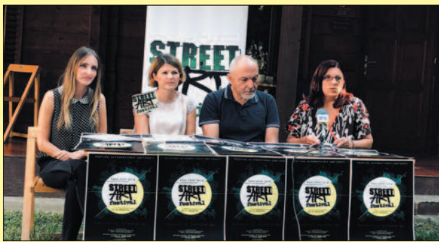
Програм представљен на конференцији за новинаре

Културни центар „Рибница“ Краљево организује 24. и 25. августа Фестивал алтер- нативних уметности „Street art“. На конфе- ренцији за новинаре, одржаној у среду, детаљно је представљен овогодишњи про- грам.