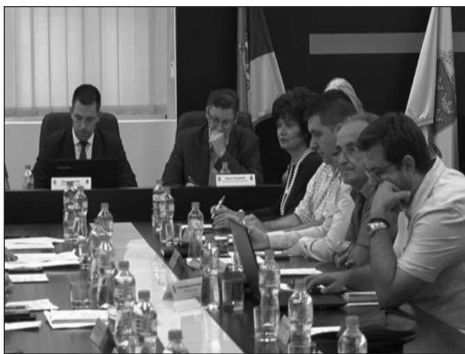
На седници обезбеђен и новац за организацију Сајма пољопривреде

-У односу на планирано, приходи у првом делу ове године износе 38 одсто. Познато је већ да су иначе приходи у првој половини године увек мањи у односу на другу половину године, а они су планирани у проценту од 44, а реализовани у проценту од 38 процената. Ми смо успели да у првој половини текуће године остваримо приход од готово милијарду пет стотина милиона динара, а ако упоредимо овај период у односу на исти период претходне године, произилази да се ради о већим приходима за износ од 76 милиона динара. Такође, успели смо да у првој половини године