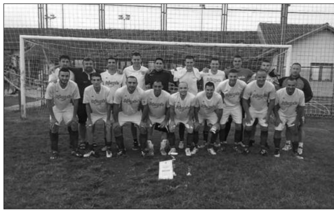
Биће изненађење и у Лиги-ФК Полет из Ратине победник турнира у Рибници

Чим се неки тим налази у зонском степену такмичења, он заслужује респект. Нови Пазар је добра екипа, верујем да ће бити у борби за сам врх табеле, али у Ратини се ми питамо. Боримо се до последњег атома снаге да слаavimo победу, а очекујем да