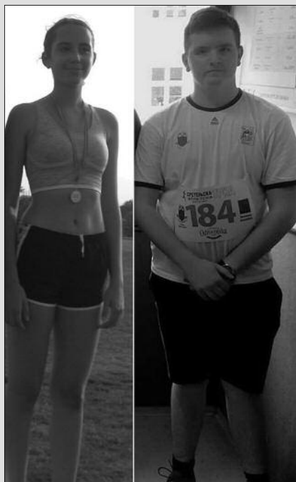
Најбољи у техничким дисциплинама

Истовремено, такмичари АК Краљево учествовали су у Крагујевцу на такмичењу 4. кола атлетске лиге Централне