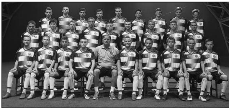
Кадетска екипа краљевачког Кикера у новој сезони

кенда, гостује Реал Нишу (субота 13ч), да би опет у среду 29. августа угостио вршњаке земуноског Телеоптика.