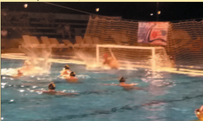
Пенила се вода у краљевачком базену-детал са финалне утакмице

Крагујевцу и тамо тренирали. Нажалост је тако, али не напушта нас ентузијазам. Једна група играча ће на заслужени одмор, осзали остају