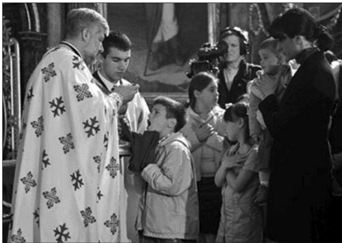
заједно са Њим и да са Њим дели суштину живота; чини нас једнакима пред лицем љубави Божије и чини нас једнаким са

Када је Господ на Тајној Вечери установио Тајну наше вере коју називамо Светом Литургијом или Евхаристијом, Он је око себе окупио Своје ученике, и оне који су му остали верни све до смрти, али и онога који се већ спремао да изда свога Учитеља. Све њих, укључујући и тог ученика, Он је сучио са изузетном љубављу Божијом, јер примити некога за трезу је знак да нас Он, наш Домаћин, доживљава као једнакима себи и да нас доживљава као своје пријатеље; као некога ко има част да прелама хлеб