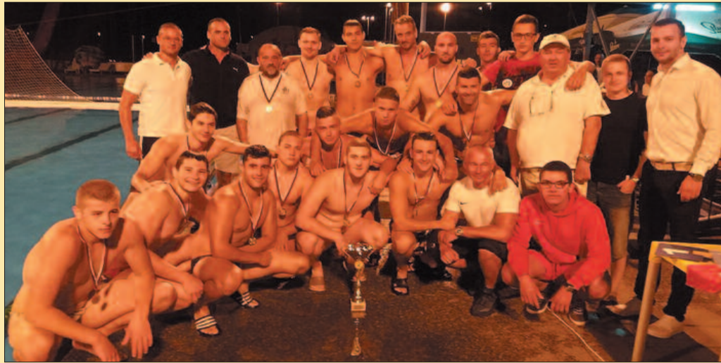
Прави шампиони-ватерполисти Краљева прваци Друге лиге Србије

Уследило је финално вече, отворили су га у борби за треће место Палилула и Младост, а Бео-