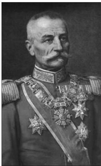
Петар Први Карађорђевић

Краљ Петар је био врховни командант српске војске у Балканским ратовима. Због старости је 24. јуна 1914. пре-