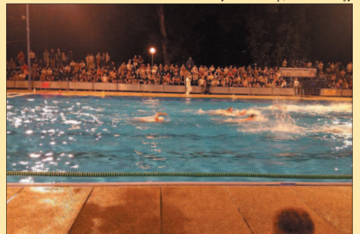
Препуна трибина на финалној утакмици Краљево-Гоч

лука и серија од 3-0 је била доволна за изједначење 7-7. Тим резултатом се завршио овај занимљив и неизванредан меч, али права