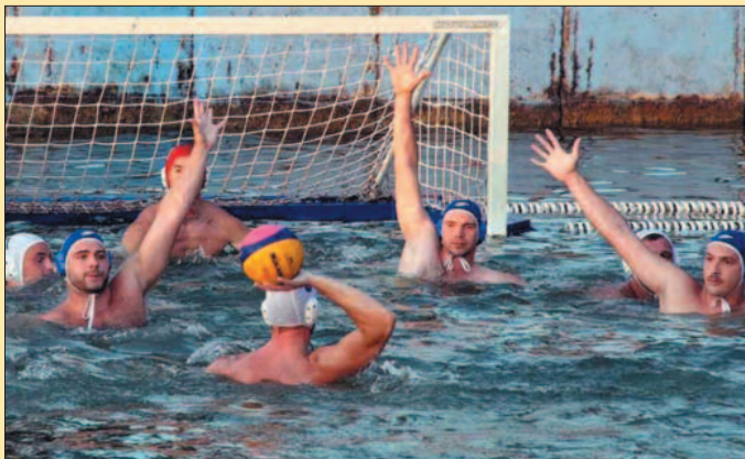
Чекајући фајл фор-детал са утакмице ватерполиста Краљева

-Веома сам задовољан оствареним резултатима до сада. Играмо препознатљиво, баш како Краљево и треба да игра у овом рангу такмичења. Све ове победе добијају на значају ако се зна да смо до њих дошли скоро без тренинга. Немамо затворени базен и већи део године играчи тренирају у другим срединама или не раде уопште. Овог лета временске прилике су постале не прилике, грмљавина и киша су постали заштитни знак месеца јула, тако да смо више времена провели у свла-