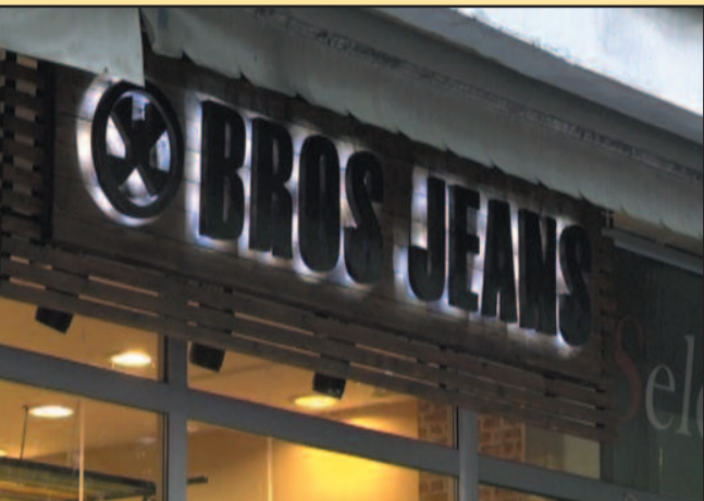
Аутентичан и врло занимљив ентеријер

м недеље у Омладинској улици 16 свечано отворен малопродајни објекат аутентичног и једин-