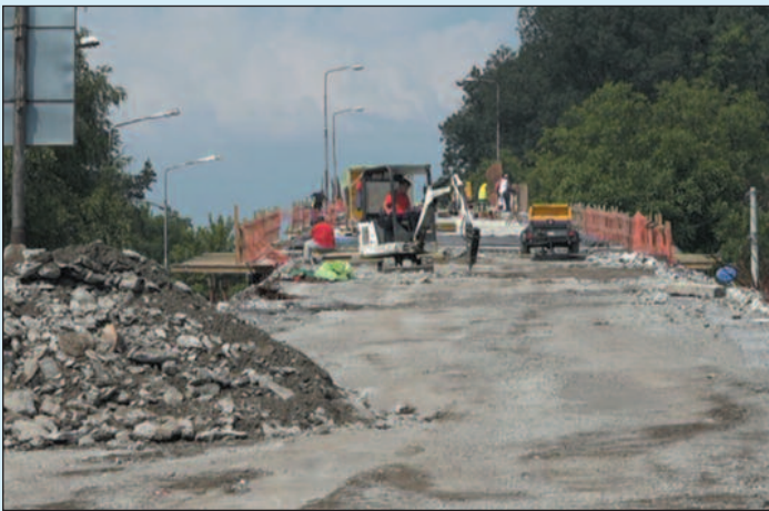
Због лошег стања главне конструкције радови продужени за три месеца

-После откривања свих слојева асфалта и надслоја бетона увидели смо да су углавном ивични носачи у великој мери оштећени, што није било предвиђено пројектом. Била је предвиђена њихова санација а не тотална промена. Имамо 11 нових носача који се производе у фабричком погону а које треба монтирати на мосту и то ће званично продужити рок до 15. новембра. Прво иде израда пројекта носача које