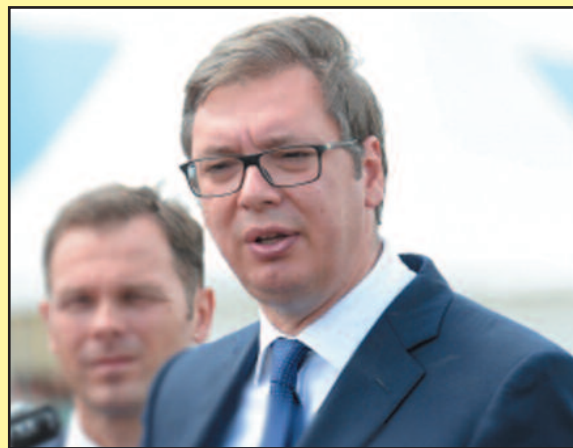
Председник Србије Александар Вучић

склопу тога битно и да имамо нормалне путеве како би страни туристи управо таквим путевима стизали на туристичке дестинације. У том смислу Вучић је напоменуо и изградњу железничког коридора 10 истичући да у светлу разних тензија у свету, како сада између САД и Ирана нафта по барелу може да "скочи" и на више од 120 долара,