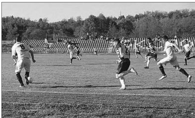
Чекајући решење за спас клуба-детал са једне утакмице Слоге на Градском стадиону

-Наша породична кућа и пекара се наслањају на стадион клуба. Везани смо за овај спортски колектив и прихватили смо позив људи који су у и око клуба да дођемо и помогнемо. Грдица је име у овом рангу такмичења, срамота је што игра у Међуопштинској лиги, јер по мени би требало да будемо други, трећи клуб у