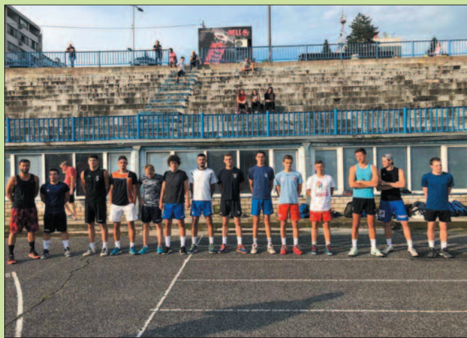
Одбојкаши Рибнице на првом тренингу на почетку припрема

-Ми смо Рибница, клуб са највећим именом у овој лиги, са највећом репутацијом и зато је природно да нам циљ буде експресан повратак међу суперлигаше. То је лако рећи, али ће бити тешко урадити. Увек су тешке сезоне после испадања, потребно је покренути момке, морају да схвате да оно што је било прошле сезоне је прошлост, а да се од данас испишује нова страница