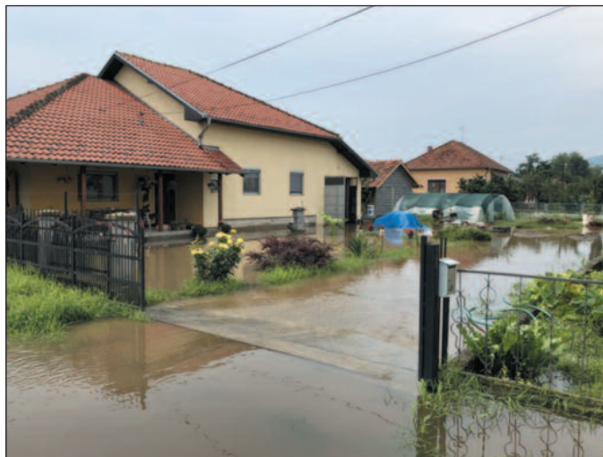
тња када после оволике кише дође слегања земље. Ни најста-

Како се завршила прошла тако је почела и ова недеља. С кишом. Екипе су биле на терену нон стоп покушавајући да санирају последице обилних падавина, али им киша то није дозволила. Као у епској песми „Зидање Скадра“. Све што би они поправили вода би им за десет минута порушила. Мали потоци за тили час прерасту у моћну бујицу која руши све пред собом. Такви би се страшни облаци спустили изнад Краљева да у сред подне буде као да је вече пало. Севало је стално, грмело је тако снажно да се то не памти, а шта тек рећи за кишу. Она једноставно сипа као из кабла, па је само у понедељак 30. јула пало од 50-60 литара кише по метру квадратном. Толика количина пада-